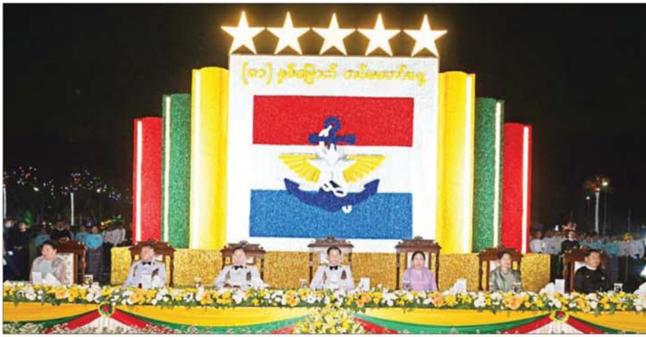
နိုင်ငံတော်လုံခြုံရေးနှင့် အေးချမ်းသာယာရေးကော်မရှင်ဥက္ကဋ္ဌ တစ်မတော်ကာကွယ်ရေးဦးစီးချုပ် ဗိုလ်ချုပ်မှူးကြီး မင်းအောင်လှိုင်နှင့် ဇနီး ဒေါ်ကြူကြူလှနှင့် အဖွဲ့ဝင်များ (၈၁)နှစ်မြောက် တစ်မတော်နေ့ ဂုဏ်ပြုညစာစားပွဲ အခမ်းအနားသို့ တက်ရောက်စဉ်။

ရေဖျိုးမှ ကော်မရှင်အဖွဲ့ဝင် ညိုနှိုင်းကွပ်ကဲရေးမှူးကြီး(ကြည်း၊ ရေ၊ လေ) ဗိုလ်ချုပ်ကြီး ကျော်စွာလင်းနှင့် ဇနီး၊ ကာကွယ်ရေးဦးစီးချုပ်(ရေ) ဗိုလ်ချုပ်ကြီး ထိန်ဝင်းနှင့် ဇနီး၊ ကာကွယ်ရေး ဦးစီးချုပ်(လေ) ဗိုလ်ချုပ်ကြီး ထွန်းအောင်နှင့် ဇနီး၊ ကော်မရှင် အဖွဲ့ဝင်များ၊ ပြည်ထောင်စုအဆင့်ပုဂ္ဂိုလ်များနှင့် ဇနီးများ၊ ကာကွယ်ရေးဦးစီးချုပ်ရုံးမှ အဆင့်မြင့် တစ်မတော်အရာရှိကြီးများနှင့် ဇနီးများ၊ ရဲဘော်သုံးကျိပ်ဝင် မိသားစုဝင်များ၊ အငြိမ်းစား တစ်မတော်ကာကွယ်ရေးဦးစီးချုပ်များ၏မိသားစုဝင်များ၊ အငြိမ်းစားတစ်မတော်(ကြည်း၊ ရေ၊ လေ)အရာရှိကြီးများ၊ လွတ်လပ်ရေးမော်ကွန်းဝင် ပုဂ္ဂိုလ်ကြီးများ၊ အကြံပေးပုဂ္ဂိုလ်များ၊ ဒုတိယဝန်ကြီးများ၊ တစ်မတော်သားအငြိမ်းစား သံအမတ်ကြီးများ၊ နိုင်ငံခြားစစ်သံရုံးများမှ စစ်သံမှူးများနှင့် တာဝန်ရှိသူများ၊ တစ်နိုင်ငံလုံး ပစ်ခတ်တိုက်ခိုက်မှု ရပ်စဲရေးသဘောတူစာချုပ်(NCA) လက်မှတ်ရေးထိုးထားသည့် တိုင်းရင်းသားလက်နက်ကိုင် အဖွဲ့များမှ ကိုယ်စားလှယ်များ၊ နိုင်ငံရေးပါတီများမှ ဥက္ကဋ္ဌများနှင့် တာဝန်ရှိသူများ၊ အောင်ဆန်းသူရိယာဘွဲ့ ရရှိခဲ့သူများ၏ မိသားစုဝင်များနှင့်