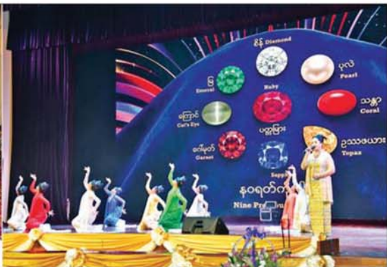
နိုင်ငံတော်လုံခြုံရေးနှင့် အေးချမ်းသာယာရေးကော်မရှင်ဒုတိယဥက္ကဋ္ဌ ဒုတိယတစ်မတော်ကာကွယ်ရေးဦးစီးချုပ် ဒုတိယဗိုလ်ချုပ်မှူးကြီး စိုးဝင်းနှင့် အခမ်းအနား တက်ရောက်လာကြသူများ မြဝတီတေးဂီတအဖွဲ့မှ တပ်ဖွဲ့ဝင် စစ်သည်၊ စစ်သမီးများက သံနံတီးပိုင်းနှင့်တွဲဖက်၍ အဆို၊ အကများ၊ ယိမ်းအကများဖြင့် သီဆိုတီးမှုတ် ဖော်ဖြေတင်ဆက်မှုကို ကြည့်ရှုအားပေးကြစဉ်။

ကော်မရှင်ဒုတိယဥက္ကဋ္ဌ ဒုတိယ တစ်မတော်ကာကွယ်ရေးဦးစီးချုပ်က စစ်သည်၊ စစ်သမီးများအား အမှတ်တရဂုဏ်ပြုပန်းခြင်းပေးအပ်ခဲ့ပြီး တက်ရောက်လာကြသူများအား ရင်းရင်းနှီးနှီးနှုတ်ဆက်သည်။ (၈၁)နှစ်မြောက် တစ်မတော်နေ့ကို ကြိုဆိုဂုဏ်ပြုသောအားဖြင့် ကာကွယ်ရေးဦးစီးချုပ်ရုံး(ကြည်း) ဝင်း အဝင်လမ်းမကြီးတစ်လျှောက်တွင် တစ်မတော် ရေယာဉ်များ၊ လေယာဉ်၊ ရဟတ်ယာဉ်များ၊ ယာဉ်ယန္တရားများ၏ ပုံသဏ္ဍာန်များ၊ ပထမ၊ ဒုတိယနှင့် တတိယ မြန်မာနိုင်ငံတော်တို့ကို တည်ထောင်ခဲ့ကြသော မင်းသားပါး ရုပ်တုများအား မီးအလှအပများဖြင့် လှပစွာဂုဏ်ပြုပုံဖော် ထွန်းညှိထားရှိကြောင်း သိရသည်။ သတင်းစဉ်