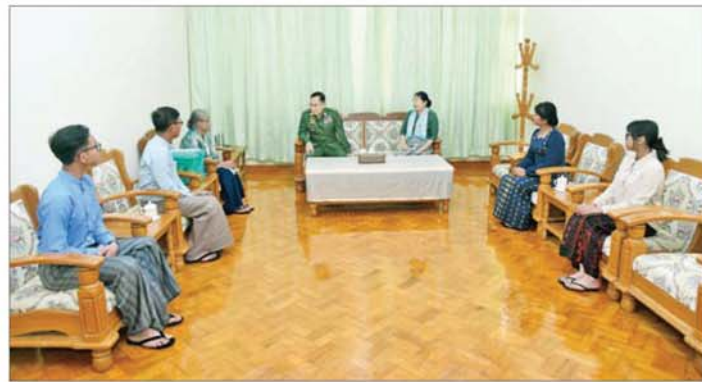
နိုင်ငံတော်လုံခြုံရေးနှင့် အေးချမ်းသာယာရေးကော်မရှင် ဒုတိယဥက္ကဋ္ဌ ဒုတိယတပ်မတော်ကာကွယ်ရေးဦးစီးချုပ် ဒုတိယဗိုလ်ချုပ်မှူးကြီး စိုးဝင်းနှင့် ဇနီး ဒေါ်သန်းသန်းနွယ် (၈၁) နှစ်မြောက် တပ်မတော်နေ့ အခမ်းအနားသို့ တက်ရောက်ကြမည့် အငြိမ်းစားတပ်မတော်အရာရှိကြီးများနှင့် ဇနီးများအား သွားရောက်တွေ့ဆုံ ဂါရဝပြုနှုတ်ဆက်စဉ်။