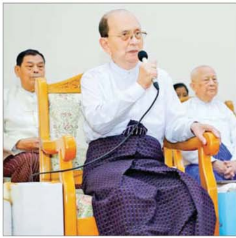
ဗိုလ်ချုပ်ကြီး သိန်းစိန်(အငြိမ်းစား)က ဩဝါဒစကားပြောကြားစဉ်။

ဒုတိယ ဗိုလ်ချုပ်မှူးကြီး စိုးဝင်းနှင့်ဇနီး ဒေါ်သန်းသန်းနွယ်၊ ကော်မရှင် အတွင်းရေးမှူး ကာကွယ်ရေးဦးစီးချုပ် (ကြည်း) ဗိုလ်ချုပ်ကြီး ရဲဝင်းဦးနှင့်ဇနီး၊ ကော်မရှင်အဖွဲ့ဝင် ညွှန်ကြားရေးမှူးကြီး (ကြည်း)၊ ရေ၊ လေ) ဗိုလ်ချုပ်ကြီး ကျော်စွာလင်းနှင့်ဇနီး၊ ကာကွယ်ရေးဦးစီးချုပ်ရုံး (ကြည်း၊ ရေ၊ လေ) မှ တပ်မတော် အရာရှိကြီးများနှင့် ဇနီးများက တက်ရောက် ဂါရဝပြုကန်တော့ကြသည်။