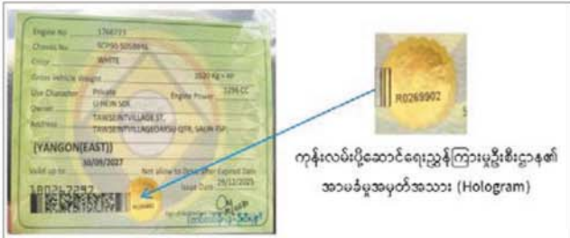
ကုန်းလမ်းပို့ဆောင်ရေးဌာနကြားမှူးစီးဌာန၏ အာမခံမှုအမှတ်အသား (Hologram)

စနစ်အားအသုံးပြုရာတွင် မော်တော်ယာဉ်၏ Wheel Tax တွင် အာမခံမှုအမှတ်အသား (Hologram) ပါရှိမှသာ အရောင်းဆိုင်ဝန်ထမ်းက Scan ဖတ်မည်ဖြစ်ပါသည်။