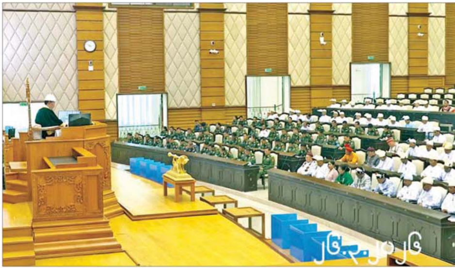
တတိယအကြိမ် အမျိုးသားလွှတ်တော် ပထမပုံမှန်အစည်းအဝေး တတိယနေ့ ကျင်းပစဉ်။

အစည်းအဝေးတွင် အမျိုးသား လွှတ်တော်ဥက္ကဋ္ဌဦးအောင်လင်းခွေး က တတိယအကြိမ် အမျိုးသား လွှတ်တော် ပထမပုံမှန်အစည်း အဝေးတတိယနေ့သို့ တက်ရောက် ခွင့်ရှိသည့် အမျိုးသားလွှတ်တော် ကိုယ်စားလှယ်ဦးစု စုစုပေါင်း ၂၁၃ ဦးစလုံး တက်ရောက်သည့် အတွက် ရာခိုင်နှုန်းပြည့်ဖြစ်သဖြင့် အစည်းအဝေး အထမြောက် ကြောင်းနှင့် စတင်ကျင်းပကြောင်း ကြေညာကာ အစည်းအဝေး တက်ရောက်မှု အခြေအနေကို လွှတ်တော်၏ အတည်ပြုချက် ရယူ၍ မှတ်တမ်းတင်သည်။