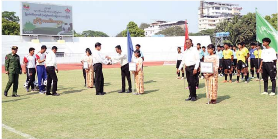
မြက်သော မျိုးဆက်သစ် အားကစားသမားများပေါ်ထွက်လာစေရန် ရည်ရွယ်ကျင်းပပေးခြင်းဖြစ်ပါကြောင်း ပြောကြားပြီးနောက် ၂၀၂၆ခုနှစ် မန္တလေးတိုင်းဒေသကြီးအစိုးရအဖွဲ့ ဝန်ကြီးချုပ်ဖလား မြို့နယ်ပေါင်းစုံ အသက်(၁၈)နှစ်အောက်(အမျိုးသား)ဘောလုံးပြိုင်ပွဲကို စတင်ဖွင့်လှစ်ပေးခဲ့သည်။ ၎င်းနောက် တိုင်းဒေသကြီးဝန်ကြီးချုပ်နှင့် အဖွဲ့သည် ပြိုင်ပွဲဝင် အားကစားသမားများကို လိုက်လံနှုတ်ဆက်အားပေးစကားများပြောကြားပြီး အားကစားပစ္စည်းများ ထောက်ပံ့ပေးအပ်ခဲ့ပြီးနောက် အခမ်းအနားအစီအစဉ် ဆက်လက်ကျင်းပခဲ့ပြီး မလိုင်မြို့နယ်အသင်းနှင့် ကျောက်ပန်းတောင်းမြို့နယ်အသင်းတို့ ယှဉ်ပြိုင်ကစားနေမှုများကို ကြည့်ရှုအားပေးခဲ့ကြောင်း သိရသည်။ (မန္တလေးနေ့စဉ်)

မန္တလေး မတ် ၂၆ မတီမှတာဝန်ရှိသူများ၊ အုပ်ချုပ်သူနည်းပြများနှင့် ပြိုင်ပွဲဝင်ဘောလုံးအားကစားသမားများ၊ အားကစားဝါသနာရှင်ပြည်သူများ တက်ရောက်ကြသည်။ အခမ်းအနား၌ တိုင်းဒေသအနားကို ယနေ့ညနေပိုင်းက အောင်မြင်သောမြို့နယ်ရှိ အောင်မြင်လှသောအားကစားကွင်း၌ ကျင်းပရမည့် မန္တလေးတိုင်းဒေသကြီးအစိုးရအဖွဲ့ ဝန်ကြီးချုပ် ဦးမျိုးအောင်၊ တိုင်းဒေသကြီးတရားလွှတ်တော်တရားသူကြီးချုပ်၊ တိုင်းဒေသကြီးအစိုးရအဖွဲ့ဝင် ဝန်ကြီးများနှင့် တာဝန်ရှိသူများ၊ ဌာနဆိုင်ရာများ၊ တိုင်းဒေသကြီးဘောလုံးဆက်တိုက် မြင်မှုရရှိစေရန်နှင့် ထူးချွန်ထက်