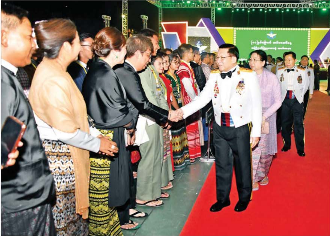
နိုင်ငံတော်လုံခြုံရေးနှင့် အေးချမ်းသာယာရေးကော်မရှင်ဥက္ကဋ္ဌ တပ်မတော်ကာကွယ်ရေးဦးစီးချုပ် ဗိုလ်ချုပ်မှူးကြီး မင်းအောင်လှိုင်နှင့် ဇနီး ဒေါ်ကြာကြာလှ (၈၁)နှစ်မြောက် တပ်မတော်နေ့ ဂုဏ်ပြုညစာစားပွဲ အခမ်းအနားသို့ တက်ရောက်လာကြသူများအား ရင်းရင်းနှီးနှီး နှုတ်ဆက်စဉ်။

နေပြည်တော် မတ် ၂၆ ၂၀၂၆ ခုနှစ် (၈၁)နှစ်မြောက် တပ်မတော်နေ့ကို ကြိုဆိုဂုဏ်ပြုသော အားဖြင့် နိုင်ငံတော်လုံခြုံရေးနှင့် အေးချမ်းသာယာရေးကော်မရှင်ဥက္ကဋ္ဌ တပ်မတော်ကာကွယ်ရေးဦးစီးချုပ် ဗိုလ်ချုပ်မှူးကြီး မင်းအောင်လှိုင်နှင့် ဇနီး ဒေါ်ကြာကြာလှတို့က တည်ခင်းစဉ်ခံသည့် ဂုဏ်ပြုညစာစားပွဲအခမ်းအနားကို ယနေ့ညပိုင်းတွင် နေပြည်တော်ရှိ ဧဇယာသီရိဗိမာန် ဥပစာရင်ပြင်၌ ကျင်းပပြုလုပ်သည်။ မီးရှူးမီးပန်းများ ပစ်ဖောက် ဂုဏ်ပြုညစာစားပွဲ စတင်ကျင်းပချိန်တွင် (၈၁)နှစ်မြောက် တပ်မတော်နေ့ကို ကြိုဆိုဂုဏ်ပြုသည့် အထိမ်းအမှတ်အဖြစ် တပ်မတော်နေ့ စစ်ရေးပြကွင်းနှင့် ဘုရင့်နေောင်ရိပ်သာတို့မှ မီးရှူးမီးပန်းများ ပစ်ဖောက်ကြသည်။ ထို့နောက် နိုင်ငံတော်လုံခြုံရေးနှင့် အေးချမ်းသာယာရေးကော်မရှင်ဥက္ကဋ္ဌ တပ်မတော်ကာကွယ်ရေး ဦးစီးချုပ် ဗိုလ်ချုပ်မှူးကြီး မင်းအောင်လှိုင်နှင့် ဇနီး ဒေါ်ကြာကြာလှတို့သည် (၈၁)နှစ်မြောက် တပ်မတော်နေ့အထိမ်းအမှတ် ဂုဏ်ပြုညစာစားပွဲသို့ တက်ရောက်လာကြသည့် ကော်မရှင်ဒုတိယဥက္ကဋ္ဌ ဒုတိယ တပ်မတော်ကာကွယ်ရေးဦးစီးချုပ် ဒုတိယ ဗိုလ်ချုပ်မှူးကြီး စိုးဝင်း၊ ကော်မရှင် အတွင်းရေးမှူး ကာကွယ်ရေးဦးစီးချုပ် (ကြည်း) ဗိုလ်ချုပ်ကြီး ရဲဝင်းဦးနှင့် ဇနီး၊ စာမုက်နာ ၃ သို့ ဇ