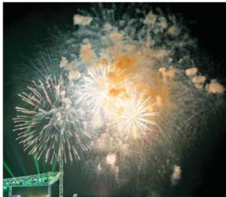
(၈၁)နှစ်မြောက် တစ်မတော်နေ့ ဂုဏ်ပြုညစာစားပွဲ အခမ်းအနား အောင်မြင်ခြင်း အထိမ်းအမှတ်အဖြစ် မီးရှူးမီးပန်းများ ပစ်ဖောက်စဉ်။

မှ တပ်ဖွဲ့ဝင်များ၊ တိုင်းရင်းသား ဖွံ့ဖြိုးရေးတက္ကသိုလ်မှ ဆရာဆရာမများနှင့် ကျောင်းသားကျောင်းသူများ၊ အထူးဖိတ်ကြားထားသည့် ဧည့်သည်တော်များအား ရင်းရင်းနှီးနှီး နှုတ်ဆက်သည်။ ယင်းနောက် နိုင်ငံတော်လုံခြုံရေးနှင့် အေးချမ်းသာယာရေးကော်မရှင်ဥက္ကဋ္ဌ တစ်မတော်ကာကွယ်ရေး