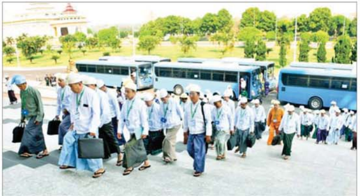
တတိယအကြိမ် ပြည်သူ့လွှတ်တော် ပထမပုံမှန်အစည်းအဝေး စတုတ္ထနေ့သို့ တက်ရောက်လာကြသည့် ပြည်သူ့လွှတ်တော်ကိုယ်စားလှယ်များကိုတွေ့ရစဉ်။