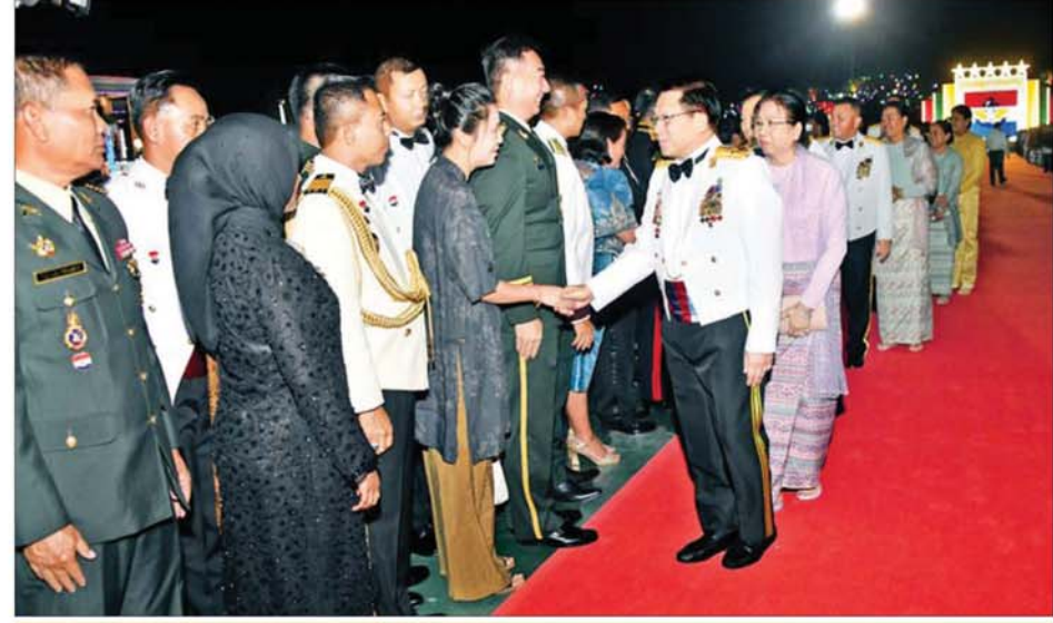
နိုင်ငံတော်လုံခြုံရေးနှင့် အေးချမ်းသာယာရေးကော်မရှင်ဥက္ကဋ္ဌ တစ်မတော်ကာကွယ်ရေးဦးစီးချုပ် ဗိုလ်ချုပ်မှူးကြီး မင်းအောင်လှိုင်နှင့် ဇနီး ဒေါ်ကြူကြူလှ (၈၁)နှစ်မြောက် တစ်မတော်နေ့ ဂုဏ်ပြုညစာစားပွဲ အခမ်းအနားသို့ တက်ရောက်လာကြသူများအား ရင်းရင်းနှီးနှီးနှုတ်ဆက်စဉ်။

က မျိုးချစ်စိတ်ဓာတ် ရှင်သန်ထက်မြက်စေမည့် ဂုဏ်ပြုတေးသီချင်းများဖြင့် သီဆိုဖော်ဖြေတင်ဆက်ကြသည်။ ဂုဏ်ပြုညစာစားပွဲ အပြီးတွင် နိုင်ငံတော်လုံခြုံရေးနှင့် အေးချမ်းသာယာရေးကော်မရှင် ဥက္ကဋ္ဌ တစ်မတော်ကာကွယ်ရေးဦးစီးချုပ် ဗိုလ်ချုပ်မှူးကြီး မင်းအောင်လှိုင်နှင့် ဇနီးတို့က တက်ရောက်လာကြသူများအား ရင်းရင်းနှီးနှီးနှုတ်ဆက်ခဲ့ကာ အခမ်းအနားအောင်မြင်ခြင်း အထိမ်းအမှတ်အဖြစ် မီးရှူးမီးပန်းများ ပစ်ဖောက်မှုကို ကြည့်ရှုအားပေးကြပြီး အခမ်းအနားမှ ပြန်လည်ထွက်ခွာကြသည်။ ဆက်လက်၍ အခမ်းအနားအစီအစဉ် ဒုတိယပိုင်းအဖြစ် ဧယျာသိရိမာန် သဘင်ဆောင်အတွင်း၌ ညိုဆက်ဆံရေးနှင့် စိတ်ဓာတ်စစ်ဆင်ရေး ညွှန်ကြားရေးမှူးရုံး ကွပ်ကဲမှုအောက်ရှိ မြဝတီတေးဂီတအဖွဲ့မှ တပ်ဖွဲ့ဝင်စစ်သည်၊ စစ်သမီးများက သံနံတီးပိုင်းနှင့်တွဲဖက်၍ အဆို၊ အကများ၊ ယိမ်းအကများဖြင့် သီဆိုတီးမှုတ် ဖော်ဖြေတင်ဆက်ကြရာ ကော်မရှင်ဒုတိယဥက္ကဋ္ဌ ဒုတိယ တစ်မတော်ကာကွယ်ရေးဦးစီးချုပ် ဒုတိယဗိုလ်ချုပ်မှူးကြီး စိုးဝင်းနှင့် အခမ်းအနား တက်ရောက်လာကြသူများက ကြည့်ရှုအားပေးကြသည်။ ဖော်ဖြေတင်ဆက်မှုအပြီးတွင် ကော်မရှင်ဒုတိယဥက္ကဋ္ဌ ဒုတိယ တစ်မတော်ကာကွယ်ရေးဦးစီးချုပ်က စစ်သည်၊ စစ်သမီးများအား အမှတ်တရဂုဏ်ပြုပန်းခြင်းပေးအပ်ခဲ့ပြီး တက်ရောက်လာကြသူများအား ရင်းရင်းနှီးနှီးနှုတ်ဆက်သည်။