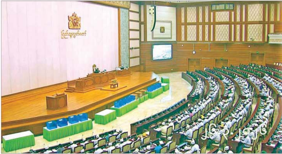
တတိယအကြိမ် ပြည်သူ့လွှတ်တော် ပထမပုံမှန်အစည်းအဝေး စတုတ္ထနေ့ ကျင်းပစဉ်။

ယင်းနောက် ပြည်သူ့လွှတ်တော် ဥက္ကဋ္ဌသည် တရုတ်ပြည်သူ့