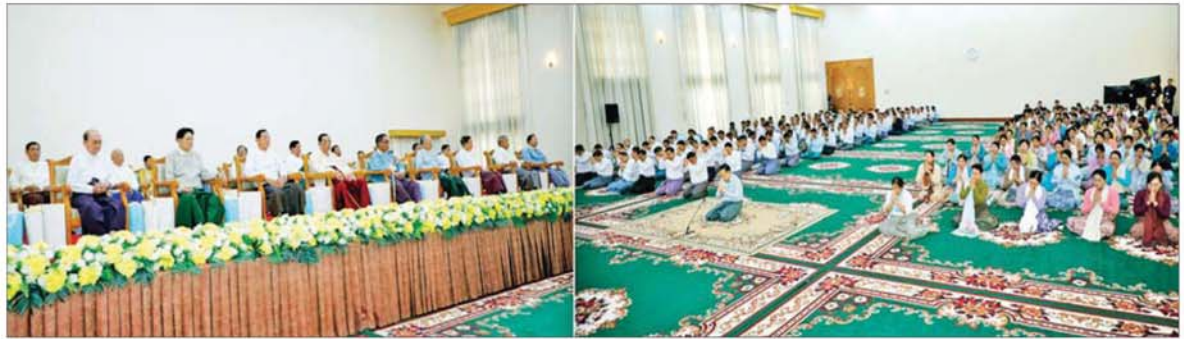
နိုင်ငံတော်လုံခြုံရေးနှင့် အေးချမ်းသာယာရေးကော်မရှင် ဒုတိယဥက္ကဋ္ဌ ဒုတိယတပ်မတော်ကာကွယ်ရေးဦးစီးချုပ် ဒုတိယဗိုလ်ချုပ်မှူးကြီး စိုးဝင်းနှင့်ဇနီး ဒေါ်သန်းသန်းနွယ် ဦးဆောင်သည့် တပ်မတော်(ကြည်း၊ ရေ၊ လေ) မိသားစုများက (၈၁)နှစ်မြောက် တပ်မတော်နေ့အခမ်းအနားသို့ တက်ရောက်ကြမည့် အငြိမ်းစားတပ်မတော်အရာရှိကြီးများအား ဂါရဝပြုကန်တော့စဉ်။

အဆိုပါဂါရဝပြုကန်တော့သည် အခမ်းအနားသို့ အငြိမ်းစား တပ်မတော် အရာရှိကြီး ၁၈ ဦးနှင့် ဇနီး ကိုးဦး စုစုပေါင်း ၂၅ ဦးတို့ ကန်တော့ခံ တက်ရောက်ကြပြီး နိုင်ငံတော်လုံခြုံရေးနှင့် အေးချမ်းသာယာရေးကော်မရှင် ဥက္ကဋ္ဌ တပ်မတော်ကာကွယ်ရေးဦးစီးချုပ် ဗိုလ်ချုပ်မှူးကြီး မင်းအောင်လှိုင် ကိုယ်စား နိုင်ငံတော်လုံခြုံရေးနှင့် အေးချမ်းသာယာရေး ကော်မရှင် ဒုတိယဥက္ကဋ္ဌ ဒုတိယ တပ်မတော်ကာကွယ်ရေးဦးစီးချုပ် စာမျက်နှာ ၅ သို့