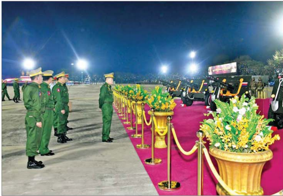
နိုင်ငံတော်လုံခြုံရေးနှင့်အေးချမ်းသာယာရေးကော်မရှင် ဒုတိယဥက္ကဋ္ဌ ဒုတိယတပ်မတော်ကာကွယ်ရေးဦးစီးချုပ် ဒုတိယဗိုလ်ချုပ်မှူးကြီး စိုးဝင်း (ဓာ)နှစ်မြောက် တပ်မတော်နေ့စစ်ရေးပြအခမ်းအနားကျင်းပရန် ဖြစ်ဆင်ဆောင်ရွက်ထားရှိမှုကို ကြည့်ရှုစစ်ဆေးစဉ်။

ထိုသို့ လေ့ကျင့်နေမှုများကို နိုင်ငံတော်လုံခြုံရေးနှင့် အေးချမ်းသာယာရေးကော်မရှင် ဒုတိယဥက္ကဋ္ဌ ဒုတိယတပ်မတော်ကာကွယ်ရေးဦးစီးချုပ် ဒုတိယဗိုလ်ချုပ်မှူးကြီး စိုးဝင်းနှင့်အတူ ကော်မရှင် အတွင်းရေးမှူး ကာကွယ်ရေးဦးစီးချုပ် (ကြည်း) ဗိုလ်ချုပ်ကြီး ရဲဝင်းဦး၊ ကော်မရှင်အဖွဲ့ဝင် ညှိနှိုင်းကွပ်ကဲရေးမှူး (ကြည်း၊ ရေလေ) ဗိုလ်ချုပ်ကြီး ကျော်စွာလင်း၊ ကော်မရှင်အဖွဲ့ဝင် ကာကွယ်ရေး ဝန်ကြီးဌာန ပြည်ထောင်စုဝန်ကြီး ဗိုလ်ချုပ်ကြီး မောင်မောင်အေး၊ ကော်မရှင်အဖွဲ့ဝင် ပြည်ထဲရေးဝန်ကြီးဌာန ပြည်ထောင်စုဝန်ကြီး ဒုတိယဗိုလ်ချုပ်ကြီး ဖုန်းမြတ်၊ ကာကွယ်ရေးဦးစီးချုပ် (ရေ) ဗိုလ်ချုပ်ကြီး ထိန်ဝင်း၊ ကာကွယ်ရေးဦးစီးချုပ် (လေ) ဗိုလ်ချုပ်ကြီး ထွန်းအောင်၊ တပ်မတော်နေ့ကျင်းပရေး ဦးစီးကော်မတီဥက္ကဋ္ဌ တပ်မတော် လေ့ကျင့်ရေးအရာရှိချုပ် ဗိုလ်ချုပ်