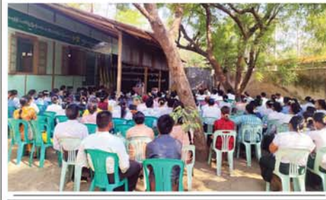
စာအုပ်၊ စာပေ လှူမိတ်ဆွေ ။