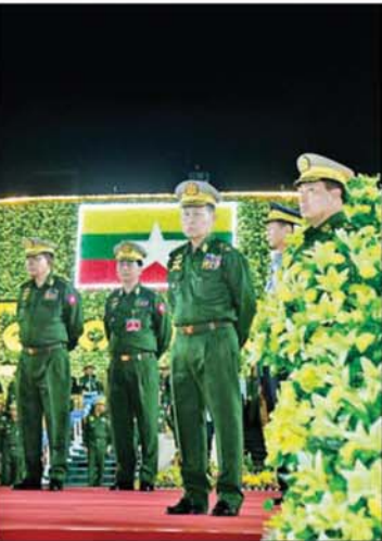
နိုင်ငံတော်လုံခြုံရေးနှင့်အေးချမ်းသာယာရေးကော်မရှင် ဒုတိယဥက္ကဋ္ဌ ဒုတိယတပ်မတော်ကာကွယ်ရေးဦးစီးချုပ် ဒုတိယဗိုလ်ချုပ်မှူးကြီးစိုးလင်း (၈၁)နှစ်မြောက် တပ်မတော်နေ့စစ်ရေးပြအခမ်းအနား၌ ပါဝင်စစ်ရေးပြကြမည့် စစ်ရေးပြစစ်ကြောင်းကြီးများ ဝတ်စုံပြည့် စစ်ရေးပြလေ့ကျင့်နေမှုကို ကြည့်ရှုစစ်ဆေးစဉ်။