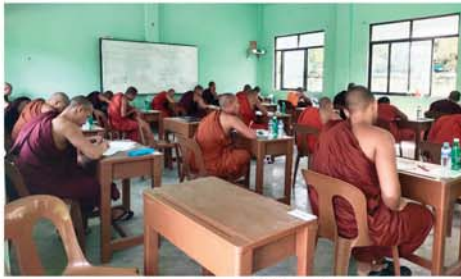
မန္တလေး မတ် ၂၅ မြေဖြိုနယ် အ.ထ.က(၁၃) ၂၀၂၆ ခုနှစ် အစိုးရဓမ္မာစရိယစာမေးပွဲကို မဟာအောင်ရက် မွန်းလွှဲပိုင်းက (ဒုတိယနေ့) ဆက်လက်ဖြေဆိုခဲ့သည်။

အဆိုပါ အစိုးရဓမ္မာစရိယစာမေးပွဲ ဖြေဆိုနေမှုကို ဩဝါဒါစရိယဆရာတော်များ၊ အထူးကြီးကြပ်ရေး ဆရာတော်များ၊ အထူးစစ်ဆေးရေးဆရာတော်ကြီးများ၊ ကြီးကြပ်ရေးဆရာတော်ကြီးများက ကြီးကြပ်ဆောင်ရွက်ကြပြီး ပါရာဇိကပါဠိအဋ္ဌကထာ (ဒုတိယနေ့) ကို ဆက်လက်ဖြေဆိုလျက်ရှိသော သံဃာတော် ၆၄၇ ပါးရှိသည်။ (အပေါ်ပုံ)