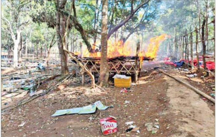
၂၀-၃-၂၀၂၆ ရက်နေ့တွင် လဲချားမြို့နယ် ကောင်းစံကျေးရွာအနီး သိမ်းဆည်းရမိခဲ့သည့် တရားမဝင်အွန်လိုင်းလိမ်လည်လောင်းကစားမှုကျူးလွန်ရာတွင် အသုံးပြုခဲ့သည့် ယာယီအဆောက်အအုံများအား စနစ်တကျမီးရှို့ဖျက်ဆီးခဲ့မှုအား တွေ့ရစဉ်။