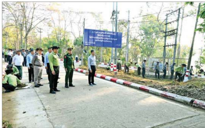
ကျန်းမာရေးဝန်ကြီးဌာနတို့မှ ညွှန်ကြားရေးမှူးချုပ်များ၊ ဒုတိယရဲချုပ်များနှင့် တပ်ဖွဲ့/ဦးစီးဌာနများမှ တာဝန်ရှိသူများ၊ ဆေးရုံအုပ်ကြီး ဒေါက်တာ

အဆိုပါ စုပေါင်းသန့်ရှင်းရေး လုပ်အားပေးနေမှုကို ပြည်ထောင်စုဝန်ကြီးဌာန ဒုတိယဝန်ကြီး ဗိုလ်ချုပ်မင်းသူ၊ ကျန်းမာရေးဝန်ကြီးဌာန ဒုတိယဝန်ကြီး ဒေါက်တာအေးထွန်း၊ ပြည်ထောင်စုဝန်ကြီးဌာန အမြဲတမ်းအတွင်းဝန် ဦးခိုင်ထွန်းဦး၊ အထွေထွေအုပ်ချုပ်ရေးဦးစီးဌာန၊ အထူးစုံစမ်းစစ်ဆေးရေးဦးစီးဌာန၊ အကျဉ်းဦးစီးဌာန၊ မီးသတ်ဦးစီးဌာနနှင့်