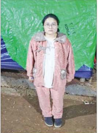
ဗီယက်နမ်နိုင်ငံသား အမျိုးသမီး တစ်ဦး။