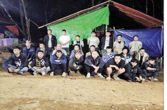
တရုတ်နိုင်ငံသား အမျိုးသား ၂၃ ဦး။