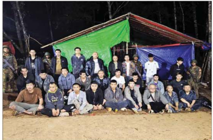
တရုတ်နိုင်ငံသား အမျိုးသား ၂၆ ဦး မှတ်တမ်းဓာတ်ပုံ။