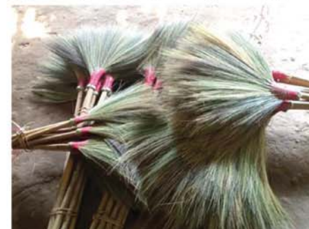
တောတောင် များတွင် သဘာဝအတိုင်း အလေ့ကျပေါက် ရောက်နေသည့် တံမြက်စည်းပင်သည် တပိုင်းထွက် တံမြက်စည်းဆံများ ထွက်လာပြီး အဆိုပါထွက်ပေါ်လာသည့် တံမြက်စည်းအဆံများကို တံမြက်စည်းချောပြုလုပ်ရန် ရှာဖွေဖြတ်

မိုင်းယောင်း မတ် ၂၁ မြန်မာနိုင်ငံ၏ အရှေ့ဘက် အကျဆုံးမြို့ဖြစ်သည့် ရှမ်းပြည်နယ်(အရှေ့ပိုင်း)၊ မိုင်းယောင်းခရိုင်၊ မိုင်းယောင်းမြို့နယ်၌ ယခုအခါ တံမြက်စည်းချော ပြုလုပ်ရောင်းချသူများ အဆင်ပြေလျက်ရှိသည်။