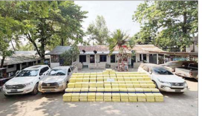
သိမ်းဆည်းရမိသည့် စိတ်ကြွရူးသွပ်ဆေးပြားများနှင့် ယာဉ်များအား တွေ့ရစဉ်။

ဆေးပြားများ ထည့်ထားသည့် ဆာလာအိတ် ၃၇ လုံး (ဆာလာ အိတ် တစ်လုံးလျှင် နှစ်သိန်းပြား ပါ) စိတ်ကြွရူးသွပ်ဆေးပြား ၇၄ သိန်းနှင့် Ford အမျိုးအစား (လိုင်စင်မဲ့) အဖြူရောင်ယာဉ်ပေါ် မှ WY စာတန်းပါ စိတ်ကြွရူးသွပ် ဆေးပြားများ ထည့်ထားသည့် ဆာလာအိတ် ၂၂ လုံး (ဆာလာ အိတ် တစ်လုံးလျှင် နှစ်သိန်းပြား ပါ) စိတ်ကြွရူးသွပ်ဆေးပြား ၄၄ သိန်း စုစုပေါင်း WY စာတန်းပါ စိတ်ကြွရူးသွပ် ဆေးပြား ၁၇၈ သိန်း (ခန့်မှန်းငွေကျပ် ၈ ဒသမ ၉ ဘီလီယံကျော်တန်ဖိုးရှိ) မူးယစ် ဆေးဝါးများကို ပိုင်ရှင်