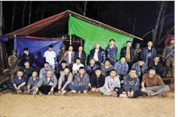
တရုတ်နိုင်ငံသား အမျိုးသား ၂၆ ဦး မှတ်တမ်းဓာတ်ပုံ။

ခန့်အကွာ၌ အွန်လိုင်းလိမ်လည်လောင်းကစားမှု ကျူးလွန်ရာတွင် အသုံးပြုသည့် လူနေအဆောက် အအုံများနှင့် ဆက်စပ်ပစ္စည်းများကို ဖော်ထုတ် သိမ်းဆည်းနိုင်ခဲ့သည့် သတင်းအား ထုတ်ပြန်ခဲ့ပြီး ဖြစ်သည်။ ဆက်လက်၍ နယ်မြေလုံခြုံရေးဆောင်ရွက် နေသော လုံခြုံရေးတပ်ဖွဲ့ဝင်များသည် လဲချားမြို့နယ်