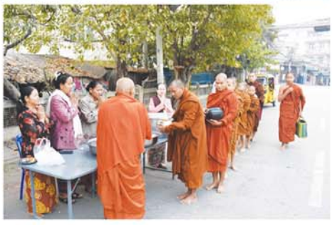
တော်များအား ကြွရောက်အလှူခံသိရသည်။ (အပေါ်ပုံ) နိုင်ပါရန် ပင့်ဖိတ်ထားကြောင်း (မန္တလေးနေ့စဉ်-၃)