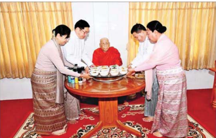
နိုင်ငံတော်လုံခြုံရေးနှင့် အေးချမ်းသာယာရေးကော်မရှင်အဖွဲ့ဝင် နိုင်ငံတော်ဝန်ကြီးချုပ် ဦးညိုစောနှင့်ဇနီး၊ နိုင်ငံတော်ဩဝါဒါစရိယ သောဌဓမ္မ ရွှေကျင်သာနာပိုင်ဆရာတော်၊ သီတဂူ ကမ္ဘာ့ဗုဒ္ဓတက္ကသိုလ်များနှင့် သီတဂူဆေးရုံတော်များ၏ အစီပတ် အတ်စေမဟာရဋ္ဌဂုရု အတ်စေ အဂ္ဂမဟာ သဒ္ဓမ္မဇောတိက ဒေါက်တာ ဘဒ္ဒန္တညာဏီသာရအား နေ့ဆွမ်းဆက်ကပ်လှူဒါန်းစဉ်။

✦ စစ်ကိုင်းမြို့ ရှေးဟောင်းသမိုင်းဝင်မှ စစ်ကိုင်းတိုင်းဒေသကြီး ဝန်ကြီးချုပ်၊ မန္တလေးတိုင်းဒေသကြီး ဝန်ကြီးချုပ်၊ ကာကွယ်ရေးဦးစီးချုပ်ရုံးမှ အဆင့်မြင့်တပ်မတော် အရာရှိကြီးများနှင့် ဇနီးများ၊ အနောက်မြောက်ပိုင်း တိုင်းစစ်ဌာနချုပ် တိုင်းမှူး၊ အလယ်ပိုင်း တိုင်းစစ်ဌာနချုပ် တိုင်းမှူး၊ ဒုတိယ ဝန်ကြီးများ၊ ဌာနဆိုင်ရာများ၊ ဖိတ်ကြားထားသည့် ဧည့်သည်တော်များ၊ စေတနာရှင် အလှူရှင်များ၊ ဝတ်အသင်းအဖွဲ့များနှင့် ဒေသခံပြည်သူများ စတင်ကာ သိုက်မြိုက်စွာ တက်ရောက်ကြည့်ညိကြသည်။