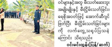
ဝင်းမင်းထွန်း(ပြန်/ဆက်)