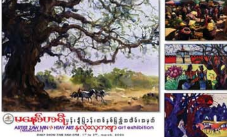
ပေးလျက်ရှိပြီး အနုပညာဝါသနာရှင် မည်သူမဆို နေ့စဉ်လာရောက် လေ့လာနိုင်ကြောင်း သိရသည်။