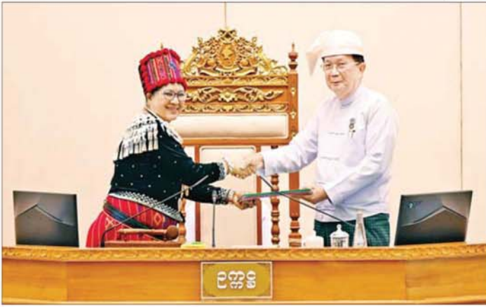
သာဘာပတိက အမျိုးသားလွှတ်တော်ဥက္ကဋ္ဌ ဦးအောင်လင်းဒွေးထံ တာဝန်လွှဲအပ်စဉ်။