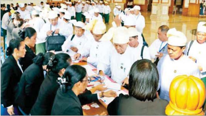
တတိယအကြိမ် အမျိုးသားလွှတ်တော် ပထမပုံမှန်အစည်းအဝေး ပထမနေ့သို့ တိုင်းဒေသကြီးနှင့် ပြည်နယ်များမှ ရွေးကောက်ခံ အမျိုးသားလွှတ်တော်ကိုယ်စားလှယ်များ တက်ရောက်လာကြစဉ်။

ဒုတိယဥက္ကဋ္ဌအဖြစ် ရွေးကောက်တင်မြှောက်ခြင်းခံရ သည့် ဦးအောင်လင်းဒွေးနှင့် Jeng Phang နော်တောင် တို့က သာဘာပတိ၏ရှေ့မှောက်၌ ကတိသစ္စာပြုကြပြီး ကတိသစ္စာပြုလွှာပေါ်တွင် လက်မှတ်ရေးထိုးကြသည်။ ထို့နောက် သာဘာပတိက အမျိုးသားလွှတ်တော် ဥက္ကဋ္ဌ ဦးအောင်လင်းဒွေးထံ တာဝန်လွှဲအပ်သည်။ ယင်းနောက် အမျိုးသားလွှတ်တော်ဥက္ကဋ္ဌက နှုတ်ခွန်းဆက်စကားပြောကြားသည်။ (အမျိုးသားလွှတ်တော်ဥက္ကဋ္ဌ၏ နှုတ်ခွန်းဆက် စကားအပြည့်အစုံကို စာမျက်နှာ ၆ တွင် သီးခြား ဖော်ပြထားပါသည်။) ထို့နောက် တတိယအကြိမ် အမျိုးသား လွှတ်တော် ပထမပုံမှန်အစည်းအဝေး ပထမနေ့ကို ရပ်နားလိုက်ပြီး အစည်းအဝေး ဒုတိယနေ့ ကျင်းပ မည့်နေ့ရက်နှင့်အချိန်ကို ကြိုတင်အသိပေးကြေညာ သွားမည်ဖြစ်ကြောင်း သိရသည်။ သတင်းစဉ်