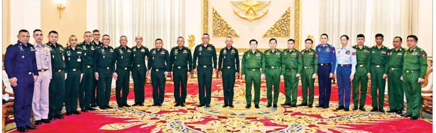
နိုင်ငံတော်လုံခြုံရေးနှင့် အေးချမ်းသာယာရေးကော်မရှင်ဥက္ကဋ္ဌ တပ်မတော်ကာကွယ်ရေးဦးစီးချုပ် ဗိုလ်ချုပ်မှူးကြီး မင်းအောင်လှိုင်၊ ထိုင်းဘုရင့်တပ်မတော် ကာကွယ်ရေးဦးစီးချုပ် General Ukris Boontanondha နှင့် အခမ်းအနားတက်ရောက်လာကြသူများ စုပေါင်းမှတ်တမ်းတင်ဓာတ်ပုံရိုက်စဉ်။