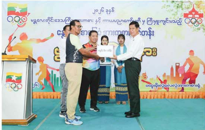
မန္တလေး မတ် ၁၈

၂၀၂၆ ခုနှစ်၊ မန္တလေးတိုင်းဒေသကြီး နွေရာသီအခြေခံအားကစားသင်တန်းဖွင့်ပွဲ အခမ်းအနားကို ယနေ့နံနက်ပိုင်းက ချမ်းအေးသာစံမြို့နယ်ရှိ ဗထူးအားကစားခန်းမတွင် ကျင်းပသည်။