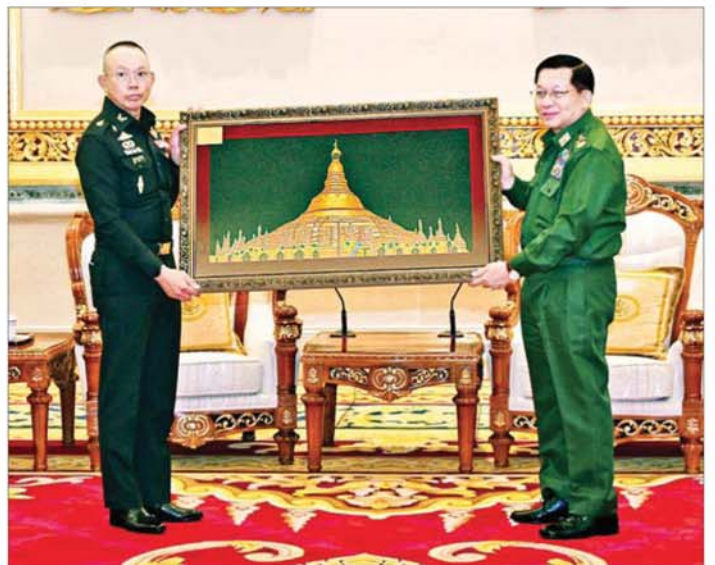
နိုင်ငံတော်လုံခြုံရေးနှင့် အေးချမ်းသာယာရေးကော်မရှင်ဥက္ကဋ္ဌ တပ်မတော်ကာကွယ်ရေးဦးစီးချုပ် ဗိုလ်ချုပ်မှူးကြီး မင်းအောင်လှိုင်နှင့် ထိုင်းဘုရင့်တပ်မတော် ကာကွယ်ရေးဦးစီးချုပ် General Ukris Boontanondha တို့ လက်ဆောင်ပစ္စည်းများ အပြန်အလှန်ပေးအပ်စဉ်။

တွေ့ဆုံပွဲအပြီးတွင် နိုင်ငံတော်လုံခြုံရေးနှင့် အေးချမ်းသာယာရေးကော်မရှင်ဥက္ကဋ္ဌ တပ်မတော် ကာကွယ်ရေးဦးစီးချုပ်နှင့် ထိုင်းဘုရင့်တပ်မတော် ကာကွယ်ရေးဦးစီးချုပ်တို့သည် အမှတ်တရလက်ဆောင် ပစ္စည်းများ အပြန်အလှန်ပေးအပ်ပြီး တက်ရောက် လာကြည့်သူများနှင့်အတူ စုပေါင်းမှတ်တမ်းတင်ဓာတ်ပုံ ရိုက်ခဲ့ကြကြောင်းလည်း သိရသည်။ သတင်းစဉ်