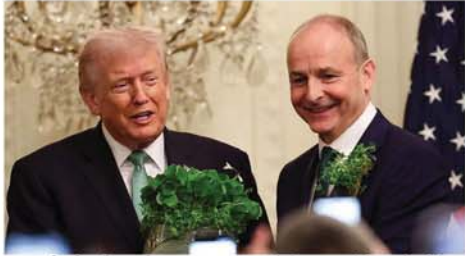
ဝါရှင်တန် မတ် ၁၈ အိမ်ဖြူတော် ဘဲဥပုံရုံးခန်း အတွင်း၌ တွေ့ဆုံစဉ် အိုင်ယာလန်နှင့် အမေရိကန်ပြည်ထောင်စုအကြား တည်ရှိသည့် ခိုင်မာအားကောင်းသော ဆက်ဆံရေးကို အသိအမှတ်ပြုခဲ့သည့်အတွက် ဒေါ်နယ်လ်ထရပ်၏ ကျေးဇူးတင်

ရိုသည့်ဟု အိုင်ယာလန်ဝန်ကြီးချုပ် မိဟိုးလ်မာတင်က ပြောကြားခဲ့ကြောင်း စီအင်န်အင်န် သတင်းဌာနက ဖော်ပြသည်။ စိန့်ပက်ထရစ်နေ့ အထိမ်းအမှတ်အဖြစ် ဝါရှင်တန်သို့ နှစ်စဉ်သွားရောက်သည့် ခရီးစဉ်၏ အစိတ်အပိုင်းတစ်ခုအဖြစ် အိမ်ဖြူတော်တွင် အမေရိကန်သမ္မတနှင့် ၎င်းတွေ့ဆုံခဲ့ခြင်းဖြစ်သည်။ အိုင်ယာလန်နှင့်အမေရိကန်အကြား အလွန်ကောင်းမွန်သော