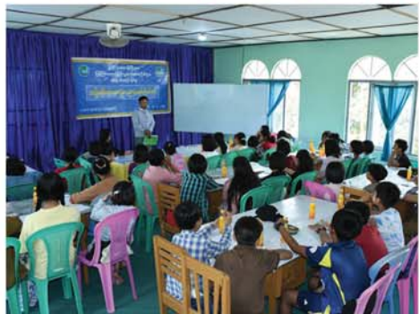
ကျောက်ဆည် မတ် ၁၈

နွေရာသီကျောင်းပိတ်ရက် လူငယ်များဘက်စုံဖွံ့ဖြိုးရေး မန္တလေးတိုင်းဒေသကြီး၊ ကျောက်ဆည်ခရိုင်မြန်ကြားရေးနှင့် ပြည်သူ့ဆက်ဆံရေးဦးစီးဌာနနှင့် ခရိုင်တိုင်းရင်းဆေးပညာဦးစီးဌာနတို့ ပူးပေါင်း၍ ယနေ့နံနက်ပိုင်းက ခရိုင်လူထုအခြေပြုဗဟိုဌာနတွင် အခြေခံတိုင်းရင်းဆေးပညာ ပညာပေးရက်တိုသင်တန်း ဖွင့်လှစ်သင်ကြားပေးလျက်ရှိကြောင်း သိရသည်။