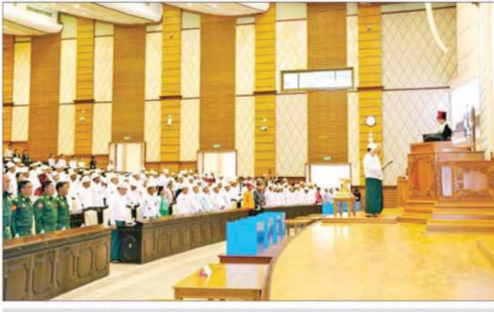
အမျိုးသားလွှတ်တော်ဥက္ကဋ္ဌနှင့် ဒုတိယဥက္ကဋ္ဌအဖြစ် ရွေးကောက်တင်မြှောက်ခြင်းခံရသည့် ဦးအောင်လင်းဒွေးနှင့် Jeng Phang နော်တောင် တို့က သာဘာပတိ၏ ရှေ့မှောက်၌ ကတိသစ္စာပြုကြစဉ်။

ထို့နောက်အမျိုးသားလွှတ်တော်ဥက္ကဋ္ဌ ရွေးချယ် တင်မြှောက်ရာ စရာဝတီတိုင်းဒေသကြီး မဲဆန္ဒနယ် အမှတ်(၈)မှ အမျိုးသားလွှတ်တော်ကိုယ်စားလှယ် ဦးအောင်တင်မြင့်က အမျိုးသားလွှတ်တော်ဥက္ကဋ္ဌ လောင်းအဖြစ် မန္တလေးတိုင်းဒေသကြီး မဲဆန္ဒနယ် အမှတ် (၁၁)မှ အမျိုးသားလွှတ်တော်ကိုယ်စားလှယ် ဦးအောင်လင်းဒွေး တစ်ဦးတည်းကသာ အမည်စာရင်း တင်သွင်းပြီး ရန်ကုန်တိုင်းဒေသကြီး မဲဆန္ဒနယ် အမှတ် (၃)မှ အမျိုးသားလွှတ်တော်ကိုယ်စားလှယ် ဦးခင်မောင်တင့်က ထောက်ခံသည့်အတွက် ၂၀၁၅ ခုနှစ် အမျိုးသားလွှတ်တော်ဆိုင်ရာ နည်းဥပဒေ (၁၁) အရ မန္တလေးတိုင်းဒေသကြီး မဲဆန္ဒနယ်အမှတ် (၁၁)မှ အမျိုးသားလွှတ်တော် ကိုယ်စားလှယ် ဦးအောင်လင်းဒွေးအား အမျိုးသားလွှတ်တော် ဥက္ကဋ္ဌအဖြစ် တင်မြှောက်ကြောင်း သာဘာပတိက