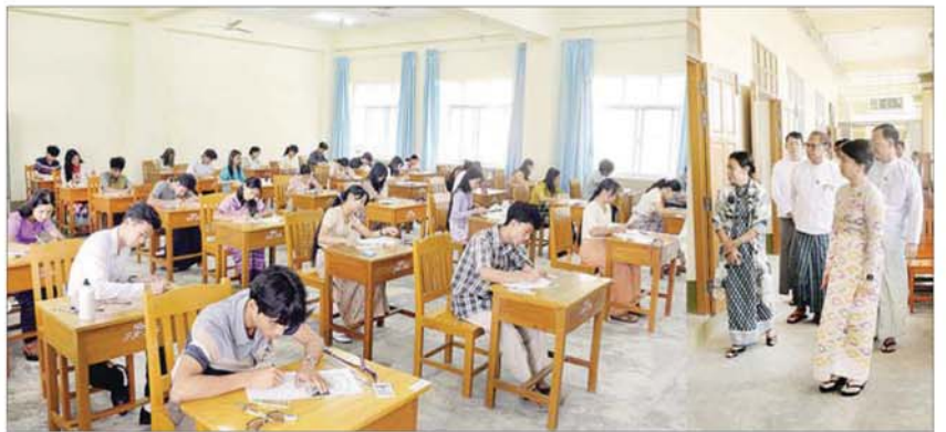
နေပြည်တော်ကောင်စီ နယ်မြေရှိ ၂၀၂၆ ခုနှစ် တက္ကသိုလ်ဝင်စာမေးပွဲတွင် စာစစ်ဌာန စုစုပေါင်း ၄၉ ခု၌ တက္ကသိုလ် နှစ်စာမေးပွဲဖြေဆိုရန် ကျောင်းသား တာဝန်ရှိသူများအား ဘာသာရပ်ဖြေဆိုသူ ၁၄၀၈၅ ဦး ဝင်ရောက် ကျောင်းသူ ၁၄၉၁၄ ဦး စာရင်းပေးသွင်း ဖြေဆိုခဲ့ကြောင်း သိရသည်။ ကြပြီး ဆဋ္ဌမနေ့ ဇီဝဗေဒနှင့် ဘောဂဗေဒ သတင်းစဉ်

များကို ကြည့်ရှုစစ်ဆေးသည်။ (ယာဝု) Naypyitaw State Academy ၏ ၂၀၂၅-၂၀၂၆ ပညာသင်နှစ် ပထမပညာသင်ကာလ စာမေးပွဲများကို မတ် ၁၆ ရက်မှ ၂၄ ရက်အထိ ကျင်းပလျက်ရှိပြီး ကြည့်ရှုစစ်ဆေးစဉ် ပြည်ထောင်စုဝန်ကြီးက ကျောင်းသားကျောင်းသူများ စိတ်အေးချမ်းသာစွာ ဖြေဆိုနိုင်ရေး၊ စာမေးပွဲလုပ်ငန်းများ အဆင်ပြေချောမွေ့ရေး ဖြည့်ဆည်းဆောင်ရွက်ရန် မှာကြားသည်။ ကြည့်ရှုအားပေး ထိုနောက် ဧဗ္ဗသီရိမြို့နယ် အမှတ်(၆) အခြေခံပညာအထက်တန်းကျောင်း စာစစ်ဌာန၌ ကျောင်းသားကျောင်းသူများ အေးချမ်းစွာ တက္ကသိုလ်ဝင်စာမေးပွဲ ဖြေဆိုနေမှုကို ကြည့်ရှုအားပေးသည်။