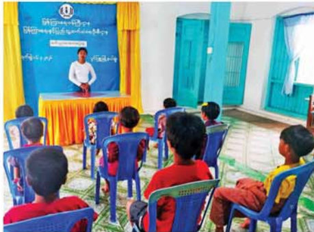
ကို ဖြန့်ဝေပေးပြီး ကလေးအလုပ်သမားပပျောက်ရေးနှင့်ပတ်သက်သည့် နံရံကပ်စာစောင်များကို ခင်းကျင်းပြသရာ ကျောင်းသား၊ ကျောင်းသူများက စိတ်ပါဝင်စားစွာ လေ့လာဖတ်ရှုခဲ့ကြကြောင်း သိရသည်။ (အပေါ်ပုံ) (၄၄၅)

ကလေးအလုပ်သမားအဓိပ္ပာယ်၊ ကလေးသူငယ်အခွင့်အရေးဆိုင်ရာ ဥပဒေနှင့် ပြစ်မှု၊ ပြစ်ဒဏ်များ၊ ကလေးသူငယ်ကာကွယ်စောင့်ရှောက်ရေးလုပ်ငန်းများနှင့် ကလေးအလုပ်သမားဆိုင်ရာ အသိပညာများအကြောင်းကို ဆွေးနွေးဟောပြောခဲ့သည်။ ထို့နောက် ဆွေးနွေးပွဲသို့ တက်ရောက်လာသည့် ကျောင်းသား၊ ကျောင်းသူများအား ပြန်ကြားရေးနှင့် ပြည်သူ့ဆက်ဆံရေးဦးစီးဌာနမှ ဝန်ထမ်းများက ကလေးအလုပ်သမားပပျောက်ရေး အသိပညာပေး လက်ကမ်းစာစောင်များ