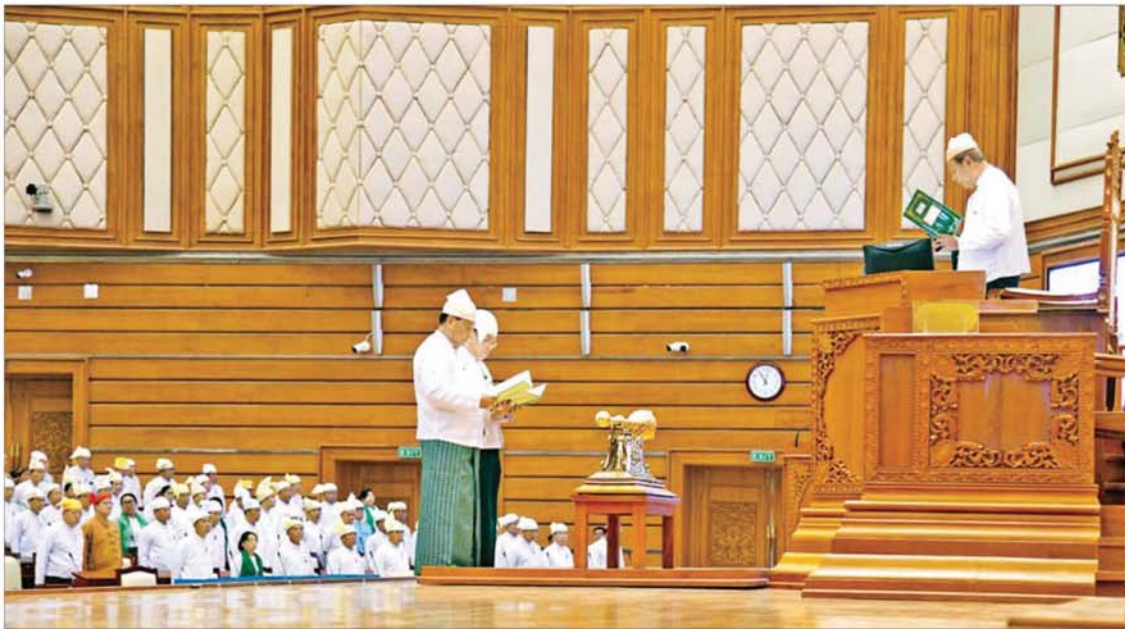
ပြည်သူ့လွှတ်တော်ဥက္ကဋ္ဌနှင့် ဒုတိယဥက္ကဋ္ဌအဖြစ် ရွေးကောက်တင်မြှောက်ခြင်းခံရသည့် ဦးခင်ရီနှင့် ဦးမောင်မောင်အုန်းတို့က သဘာပတိ၏ရှေ့မှောက်၌ ကတိသစ္စာပြုကြစဉ်။

နေပြည်တော် မတ် ၁၆ တတိယအကြိမ် ပြည်သူ့လွှတ်တော် ပထမပုံမှန်အစည်းအဝေး ပထမနေ့ကို ယနေ့နံနက် ၁၀ နာရီတွင် နေပြည်တော်ရှိ လွှတ်တော်အဆောက်အအုံ ပြည်သူ့လွှတ်တော် အစည်းအဝေးခန်းမ၌ စတင်ကျင်းပသည်။ တက်ရောက် အစည်းအဝေးသို့ တိုင်းဒေသကြီးနှင့် ပြည်နယ်များမှ ရွေးကောက်ခံပြည်သူ့လွှတ်တော် ကိုယ်စားလှယ်များနှင့် တပ်မတော်သား ပြည်သူ့လွှတ်တော် ကိုယ်စားလှယ်များတက်ရောက်ကြသည်။ ဦးစွာ အစည်းအဝေးသို့ တက်ရောက်လာကြသည့် ပြည်သူ့လွှတ်တော် ကိုယ်စားလှယ်များက ပြည်သူ့လွှတ်တော် ဥက္ကဋ္ဌနှင့် ဒုတိယဥက္ကဋ္ဌတို့ ရွေးကောက်တင်မြှောက်ခြင်းပြီးသည့်အထိ အစည်းအဝေးကို ကြီးကြပ်ကွပ်ကဲနိုင်ရန် ပြည်သူ့လွှတ်တော် ကိုယ်စားလှယ်တစ်ဦးအား သဘာပတိအဖြစ် တင်မြှောက်ကြရာ သဘာပတိလောင်းအဖြစ် တင်မြှောက်ရန် အမည်စာရင်း တင်သွင်းသူနှစ်ဦးရှိသည့် အတွက် လျှို့ဝှက်ဆန္ဒမဲပေးရွေးချယ်ရာ စာမျက်နှာ ၃ သို့ ။