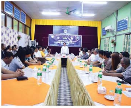
မကျေး မတ် ၁၆