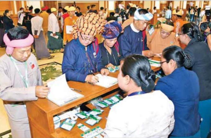
တိုင်းဒေသကြီးနှင့် ပြည်နယ်များမှ ရွေးကောက်ခံပြည်သူ့လွှတ်တော်ကိုယ်စားလှယ်များ အစည်းအဝေးတက်ရောက်ကြောင်း လက်မှတ်ရေးထိုးကြစဉ်။

✎ စာမျက်နှာ ၃ မှ ဆက်လက်၍ ပြည်သူ့ လွှတ်တော်ဥက္ကဋ္ဌနှင့် ဒုတိယဥက္ကဋ္ဌ အဖြစ် ရွေးကောက်တင်မြှောက် ခြင်းခံရသည့် ဦးခင်ရီနှင့် ဦးမောင်မောင်အုန်း တို့က သဘာပတိ၏ ရှေ့မှောက်၌ ကတိသစ္စာပြုကြပြီး ကတိသစ္စာ ပြုလွှာပေါ်တွင် လက်မှတ်ရေးထိုး ကြသည်။ ထို့နောက် သဘာပတိက ၂၀၁၃ ခုနှစ် ပြည်သူ့လွှတ်တော်ဆိုင်ရာ နည်းဥပဒေ ၁၅ အရ ပြည်သူ့ လွှတ်တော်ဥက္ကဋ္ဌ ဦးခင်ရီကို