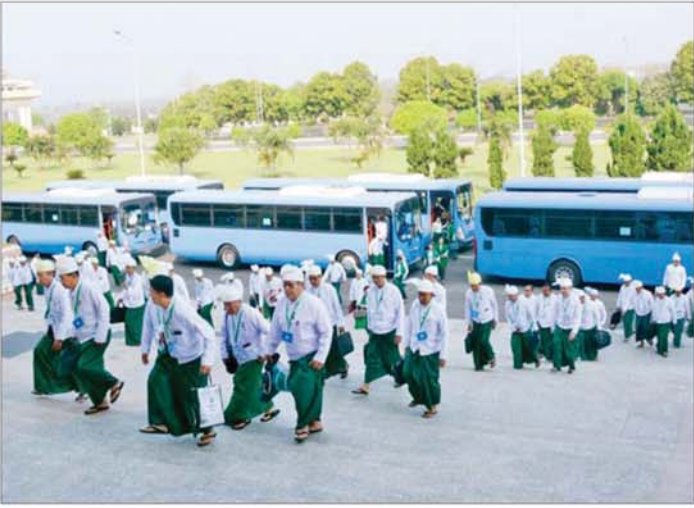
တတိယအကြိမ် ပြည်သူ့လွှတ်တော် ပထမပုံမှန်အစည်းအဝေး ပထမနေ့သို့ တက်ရောက်လာကြသည့် တိုင်းဒေသကြီးနှင့် ပြည်နယ်များမှ ရွေးကောက်ခံပြည်သူ့လွှတ်တော်ကိုယ်စားလှယ်များနှင့် တပ်မတော်သား ပြည်သူ့လွှတ်တော်ကိုယ်စားလှယ်များကို တွေ့ရစဉ်။