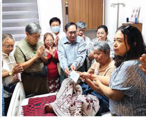
မန္တလေးတက္ကသိုလ်ကျန်းမာရေးစောင့်ရှောက်မှုကော်မတီမှ ကျန်းမာရေးထောက်ပံ့ငွေပေးအပ်

ရှင်းခြင်း၊ ပညာရေးနှင့် သုတေသန၊ စီးပွားရေးနှင့် လုပ်ငန်းခွင်၊ Pro- gramming နှင့် Coding ရေးသားနည်း၊ တီထွင်ဖန်တီးမှု ဆိုင်ရာလုပ်ငန်းများ၊ ကိုယ်ပိုင် အရည်အချင်းမြှင့်တင်ခြင်း၊ ဓာတ် ပုံဖြင့် အဖြေရှာနည်း၊ ကျန်းမာရေး အတွက် ဆွေးနွေးခြင်း စသည့် အကြောင်းအရာများအား စာတွေ့၊ လက်တွေ့ သင်ကြားပို့ချခဲ့ရာ သင်တန်းသား၊ သင်တန်းသူ စုစု ပေါင်း ၄၂ ဦး တက်ရောက်သင် ကြားခဲ့သည်။ (ဇေဇ)