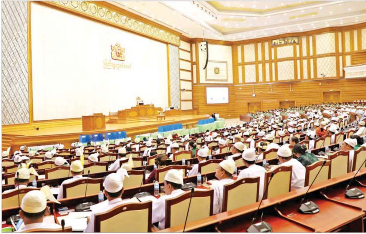
တတိယအကြိမ် ပြည်သူ့လွှတ်တော် ပထမပုံမှန်အစည်းအဝေး ပထမနေ့ ကျင်းပစဉ်။

သဘာပတိ ဒေါက်တာ နန္ဒကျော်စွာက ၂၀၁၃ ခုနှစ် ပြည်သူ့လွှတ်တော် ဆိုင်ရာ နည်းဥပဒေ ၁၅ အရ ပြည်သူ့ လွှတ်တော်ဥက္ကဋ္ဌ ဦးခင်ရီကို တာဝန်လွှဲအပ်စဉ်။