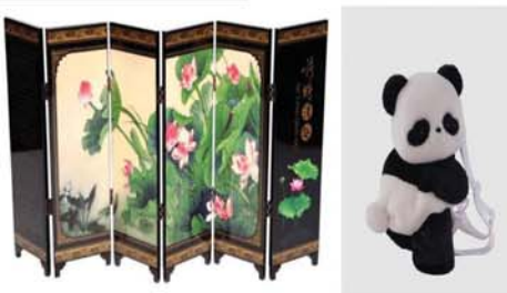
(မန္တလေးနေ့စဉ်-၈)

သံရုံး၏ တရားဝင် Facebook စာမျက်နှာတွင် လန်ချန်း-မဲခေါင် ပူးပေါင်းဆောင်ရွက်ရေးနှင့် ပတ် သက်သည့် ရွေးချယ်စရာ မေးခွန်း သုံးခုကို နေ့စဉ်ထုတ်ပြန်ကြေညာ သွားမည်ဖြစ်သည်။ မေးခွန်း သုံးခုစလုံးကို မှန်ကန် စွာ ဖြေဆိုနိုင်သူများထံမှ ကံထူးရှင် သုံးဦးကို ကျန်းမာရေးချယ်ကာ Six sided Chinese Lacquered Panel Art နှင့် Panda Cross-body Backpack များကို လက် ဆောင်အဖြစ် ပေးအပ်သွားမည်ဖြစ် သည်။ ထိုအစီအစဉ်အတွက် ကံထူး ရှင်များ၏ စာရင်းကို မတ် ၂၃ ရက်တွင် ကြေညာသွားမည်ဖြစ်ပြီး စိတ်ဝင်စားသူများအားလုံး ပါဝင် ယှဉ်ပြိုင်နိုင်ကြောင်း မြန်မာနိုင်ငံ ဆိုင်ရာ တရုတ်သံရုံးမှ အသိပေး ထားသည်။ (ဇေဇ)