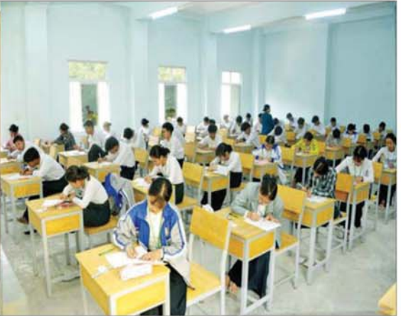
ပဉ္စမနေ့ ရှုပဒေနှင့် သမိုင်းဘာသာရပ်ကို စိတ်အေးချမ်းစွာ ဖြေဆိုနေမှုကို လှည့်လည်