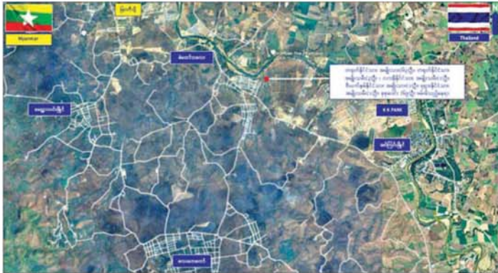
မြဝတီမြို့နယ် မဲထော်သလေးကျေးရွာဝန်းကျင်အနီး၌ တရားမဝင် နယ်စပ်ဖြတ်ကျော်ဝင်ရောက်လာသည့် ပြည်ပနိုင်ငံသား ၆၉ ဦး ဖမ်းဆီးရရှိမှုနေရာပြပုံ။