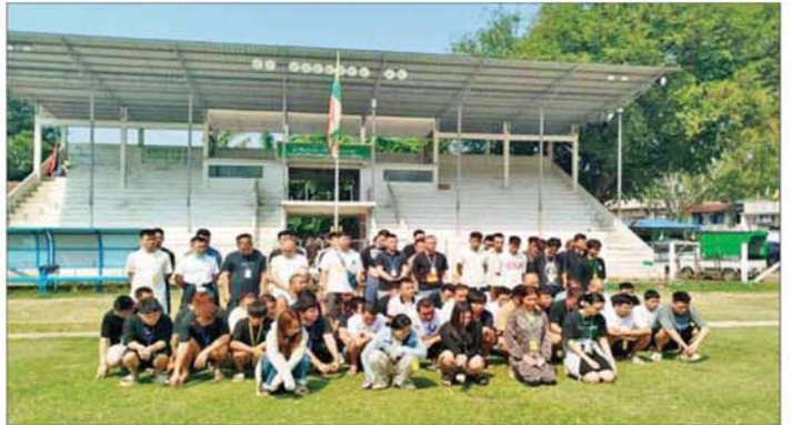
မြဝတီမြို့နယ် မဲထော်သလေးကျေးရွာဝန်းကျင်အနီး ဖမ်းဆီးရမိသည့် တရားမဝင်နယ်စပ်ဖြတ်ကျော်ဝင်ရောက်လာသည့် ပြည်ပနိုင်ငံသား ၆၉ ဦးကို တွေ့ရစဉ်။