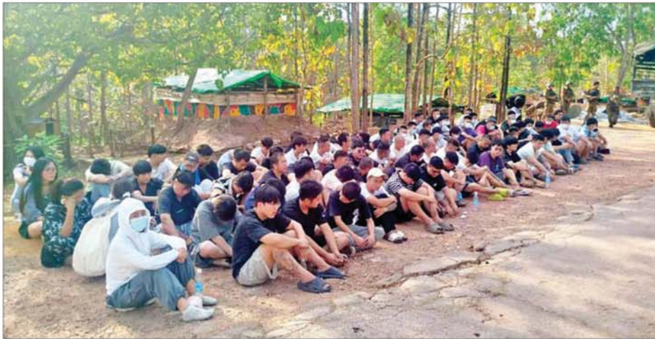
မြဝတီမြို့နယ် မဲထော်သလေးကျေးရွာဝန်းကျင်အနီး တရားမဝင်နယ်စပ်ဖြတ်ကျော်ဝင်ရောက်လာသည့် ပြည်ပနိုင်ငံသား ၈၆ ဦး ဖမ်းဆီးရရှိမှုကို တွေ့ရစဉ်။

နေပြည်တော် မတ် ၁၄ မြန်မာနိုင်ငံအစိုးရအနေဖြင့် နိုင်ငံအတွင်း အွန်လိုင်းလိမ်လည် လောင်းကစားမှုလုပ်ငန်းများ လုံးဝအခြေမပြုနိုင်စေရေးအတွက် အွန်လိုင်းလိမ်လည်လောင်းကစားမှုတိုက်ဖျက်ရေး လုပ်ငန်းစဉ်များကို ပြည်တွင်းအင်အားစုများအပြင် အိမ်နီးချင်းနိုင်ငံအစိုးရများနှင့်လည်း ပေါင်းစပ်ညှိနှိုင်း၍ တက်ကြွစွာဆောင်ရွက်လျက်ရှိရာ တိုင်းဒေသကြီးနှင့် ပြည်နယ်အသီးသီးရှိ ဌာနဆိုင်ရာပူးပေါင်းအဖွဲ့များကလည်း အွန်လိုင်း လိမ်လည်လောင်းကစားမှုတိုက်ဖျက်ရေးလုပ်ငန်းများနှင့် နိုင်ငံအတွင်း သို့ပြည်ပနိုင်ငံသားများ တရားမဝင် ဝင်ရောက်နေထိုင်မှုမရှိစေရေးတို့ကို အသေးစိတ် စစ်ဆေးကြပ်မတ်ဆောင်ရွက်လျက်ရှိသည်။ ထိုသို့ ဆောင်ရွက်လျက်ရှိရာ ကရင်ပြည်နယ် မြဝတီမြို့နယ် မဲထော်သလေးကျေးရွာ၏ အရှေ့ဘက်မီတာ ၁၅၀၀ ခန့်အကွာ၌ တရားမဝင် ပြည်ပနိုင်ငံသားများ ဝင်ရောက်ပုန်းအောင်း နေထိုင်လျက်ရှိ ကြောင်း သတင်းများအရ လုံခြုံရေးတပ်ဖွဲ့ဝင်များ၊ အုပ်ချုပ်ရေးအဖွဲ့ အစည်းများနှင့် ဌာနဆိုင်ရာတာဝန်ရှိသူများပါဝင်သော ပူးပေါင်းအဖွဲ့ များက သွားရောက်စစ်ဆေးရာ ယနေ့ညနေ ၄ နာရီခန့်တွင် မြဝတီမြို့ နယ် မဲထော်သလေးကျေးရွာ၏ အရှေ့တောင်ဘက်မီတာ ၂၅၀၀ အကွာ ရှိ အဆောက်အအုံနှင့် နေအိမ်များအတွင်း ပုန်းအောင်းနေသည့် တရားမဝင် တရုတ်နိုင်ငံသား အမျိုးသား ၄၉ ဦး၊ ဖိလစ်ပိုင်နိုင်ငံသား အမျိုးသားတစ်ဦးနှင့်