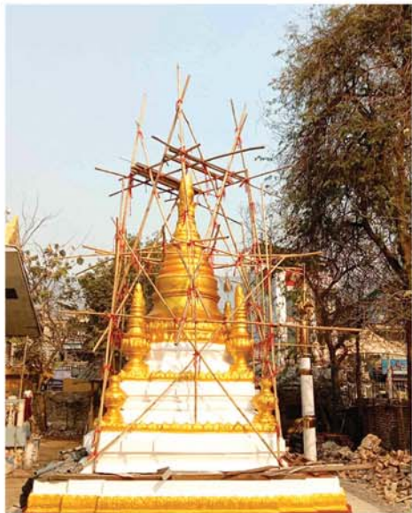
ရွှေဘုန်းတော်တိုးစေတီတော် ထီးတော်တင်နှင့် ဌာပနာထည့်သွင်းခြင်းမင်္ဂလာ ကျင်းပမည်

ကြိမ်ရွတ်ဆို ဆုတောင်း၍ ရုပ် သိမ်းလိုက်သည်။ ထို့နောက် ၂၀၂၅ ခုနှစ် အစိုးရ ပါဠိပထမပြန် စာမေးပွဲ ကျောက်ပန်းတောင်း စာဖြေဌာနမှ အောင်မြင်တော်မူ ကြသည့် စာအောင်သံဃာနှင့် သီလရှင်ဆရာလေးများကို မြို့ နယ် စီမံခန့်ခွဲရေးနှင့် အဖွဲ့ဝင် ရေးကော်မတီဥက္ကဋ္ဌနှင့် အဖွဲ့ဝင် များ၊ ဌာနဆိုင်ရာများနှင့် အလှူ ရှင်များက စာအောင်ဆုနှင့် လှူ ဖွယ်ဝတ္ထုပစ္စည်းများ ဆက်ကပ် လှူဒါန်းကြရာ သုံးကျမ်းပြီး ငါး ပါး၊ နှစ်ကျမ်းပြီး နှစ်ပါး၊ ပထမ ကြီးတန်းအောင် ၁၂ ပါး၊ ပထမ လတ်တန်းအောင် ၂၃ ပါး၊ ပထမ ငယ်တန်းအောင် ၇၁ ပါးနှင့် အခြေပြုမှုလတန်းအောင် ၉၂ ပါး တို့က လက်ခံရယူကြသည်။