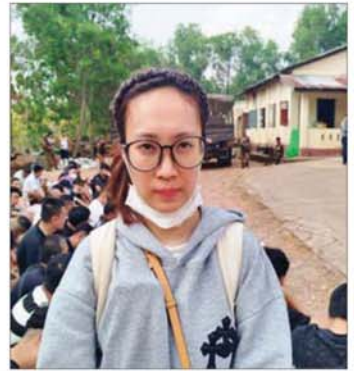
မြတ်ဗြိ.နယ် မဲထော်သလေးကျေးရွာဝန်းကျင်အနီး၌ တရားမဝင်နယ်စပ်ဖြတ်ကျော်ဝင်ရောက်လာသည့် ဖိလစ်ပိုင်နိုင်ငံသူနှင့် ဗီယက်နမ်နိုင်ငံသူများအား ဖော်ထုတ်ဖမ်းဆီးရမိမှုကို တွေ့ရစဉ်။