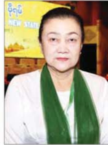
ဒေါ်နန်းဝင်းစိန်

အဆောက်အအုံတွေနဲ့ပတ်သက်ပြီး အသေးစိတ် ဆွေးနွေးခဲ့ကြတာဖြစ်ပါတယ်။ နိုင်ငံအတွက် အရေးကြီးတဲ့ စွမ်းအင်ကဏ္ဍကိုလည်း ဆွေးနွေးခဲ့ပါ တယ်။ မကြာခင်စတင်တော့မယ့် လွှတ်တော်ကို တက်ရောက်ကြမယ့် လွှတ်တော်ကိုယ်စားလှယ်တွေ ကို ပညာရှင်တွေက လေ့လာထားတဲ့ အတွေ့အကြုံ၊ ပညာရပ်တွေ၊ အချက်အလက်တွေ မျှဝေပေးခြင်းအား ဖြင့် ဥပဒေပြဋ္ဌာန်းပြင်ဆင်ရေးကဏ္ဍတွေမှာ အကျိုးပြု ပေးနိုင်မှာဖြစ်ပါတယ်။ ဒီဖိုရမ်ကတစ်ဆင့် ထွန်းလင်း တောက်ပပြီး ဖွံ့ဖြိုးတိုးတက်တဲ့နိုင်ငံတော်ကို မြင်ရ လိမ့်မယ်လို့ ယုံကြည်ပါတယ်။ ဒေါ်သီဂီဝင်းရွှေ အမျိုးသားလွှတ်တော်ကိုယ်စားလှယ် ပညာရှင်တွေက သူတို့ရဲ့ အတွေ့အကြုံတွေ၊ ဗဟုသုတတွေ၊ လေ့လာဆည်းပူးထားတဲ့ အသိပညာ တွေကို ဆွေးနွေးပြောကြားပေးတဲ့အတွက် ဖိုရမ် ကျင်းပပေးတဲ့ နိုင်ငံတော်အကြီးအကဲကို ကျေးဇူးတင်