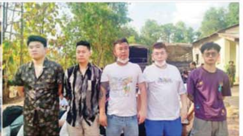
မြတ်ဗြိ.နယ် မဲထော်သလေးကျေးရွာဝန်းကျင်အနီး၌ တရားမဝင်နယ်စပ်ဖြတ်ကျော်ဝင်ရောက်လာသည့် တရုတ်နိုင်ငံသားများအား ဖော်ထုတ်ဖမ်းဆီးရမိမှုကို တွေ့ရစဉ်။