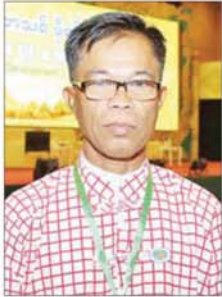
ဦးသန်းရွှေ