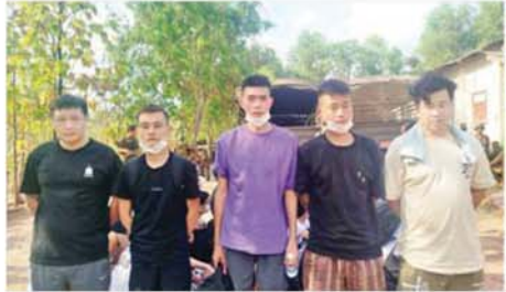
မြတ်ဗြိ.နယ် မဲထော်သလေးကျေးရွာဝန်းကျင်အနီး၌ တရားမဝင်နယ်စပ်ဖြတ်ကျော်ဝင်ရောက်လာသည့် တရုတ်နိုင်ငံသားများအား ဖော်ထုတ်ဖမ်းဆီးရမိမှုကို တွေ့ရစဉ်။

အဆိုပါ တရားမဝင် နယ်စပ်ဖြတ်ကျော်ဝင်ရောက်လာသည့် တရုတ်နိုင်ငံသား အမျိုးသား ၇၉ ဦးနှင့် အမျိုးသမီး တစ်ဦး၊ ထိုင်းနိုင်ငံသား အမျိုးသမီး နှစ်ဦး၊ ဖိလစ်ပိုင်နိုင်ငံသား အမျိုးသား တစ်ဦးနှင့် အမျိုးသမီး တစ်ဦး၊ မလေးရှားနိုင်ငံသား အမျိုးသား တစ်ဦး၊ ဗီယက်နမ်နိုင်ငံသား အမျိုးသမီး တစ်ဦး စုစုပေါင်း တရားမဝင် ပြည်ပနိုင်ငံသား ၈၆ ဦးတို့အား မြတ်ဗြိ.နယ် ထိန်းသိမ်းထားရှိပြီး ဌာနဆိုင်ရာပူးပေါင်း အဖွဲ့များက လိုအပ်သည့်ကိစ္စရပ်အချက်အလက်များနှင့် မှတ်တမ်းများ စာရင်းကောက်ယူခြင်းလုပ်ငန်းများ ဆောင်ရွက်လျက်ရှိကြောင်း သိရသည်။