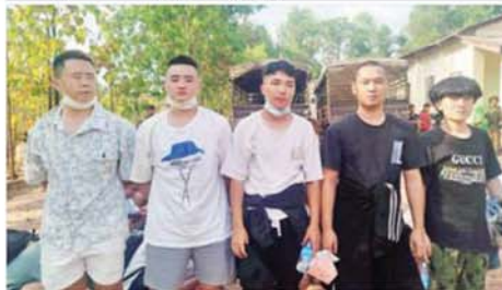
မြတ်ဗြိ.နယ် မဲထော်သလေးကျေးရွာဝန်းကျင်အနီး၌ တရားမဝင်နယ်စပ်ဖြတ်ကျော်ဝင်ရောက်လာသည့် တရုတ်နိုင်ငံသားများအား ဖော်ထုတ်ဖမ်းဆီးရမိမှုကို တွေ့ရစဉ်။