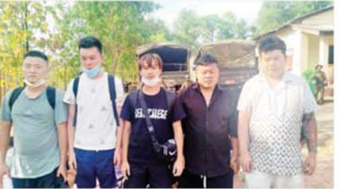
မြတ်ဗြိ.နယ် မဲထော်သလေးကျေးရွာဝန်းကျင်အနီး၌ တရားမဝင်နယ်စပ်ဖြတ်ကျော်ဝင်ရောက်လာသည့် တရုတ်နိုင်ငံသားများအား ဖော်ထုတ်ဖမ်းဆီးရမိမှုကို တွေ့ရစဉ်။