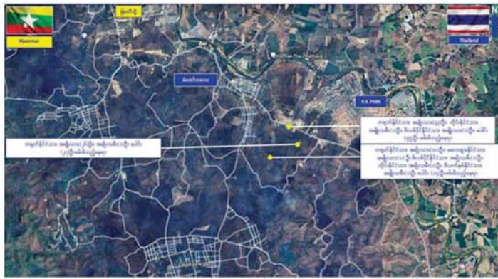
မြတ်ဗြိ.နယ် မဲထော်သလေးကျေးရွာဝန်းကျင်အနီး၌ တရားမဝင်နယ်စပ်ဖြတ်ကျော်ဝင်ရောက်လာသည့် ပြည်ပနိုင်ငံသား ၈၆ ဦး ဖမ်းဆီးရရှိမှုဓာတ်ပုံပုံ။