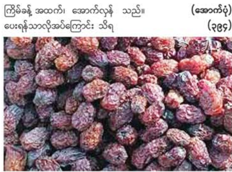
ကျွန်ုပ်တို့ အထက်၊ အောက်လှန် ပေးရန်သာလိုအပ်ကြောင်း သိရသည်။ (အောက်ပုံ) (၃၉၄)

မြစ်အထက်ပိုင်းထွက် ဆီးသီးခြောက်များကိုသာ ရယူခြင်းဖြစ်ပြီး ဆီးသီးခြောက်ကို ပိုးမစားသဖြင့် ပိုးသတ်ဆေးလုံးဝသုံးရန် မလိုအပ်သည့် သဘာဝစားသုံးကုန်ဖြစ်သောကြောင့် တရုတ်နိုင်ငံနှင့် ပြည်တွင်းစားသောက်ကုန်လုပ်ငန်းရှင်များက ဝယ်ယူနေခြင်းဖြစ်သည်။ “ဆီးတောင်သူတွေဆီက ဆီးသီးခြောက်တွေရောက်လာရင် ပွဲရုံထဲ ပုံထားရတယ်။ ပွဲရုံကို အခြောက် ချည်းလာတာမဟုတ်