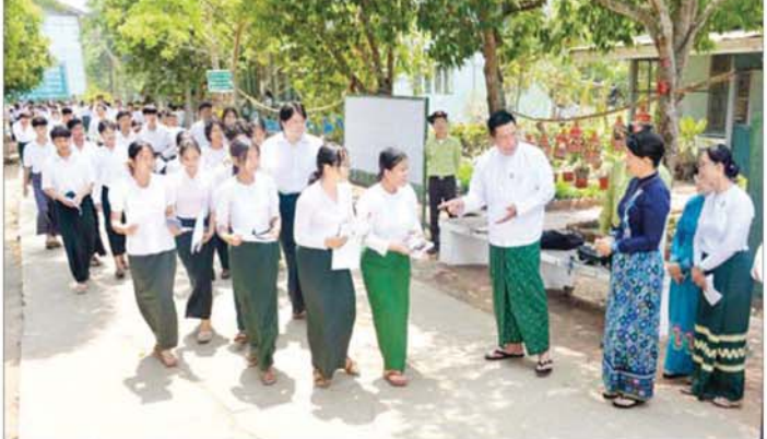
စွာဖြေဆိုနေမှုကို လှည့်လည်ကြည့်ရှုအားပေးပြီး ရင်းရင်းနှီးနှီး တွေ့ဆုံအားပေးစကားပြောကြားခဲ့ကြောင်း သိရသည်။ သတင်းစဉ်

မြို့နယ် အခြေခံပညာနှင့်စက်မှု စိုက်ပျိုး၊ မွေးမြူရေး အထက်တန်းကျောင်း (တိုက်ကြီး) စာစစ်ဌာနသို့ သွားရောက်၍ တာဝန်ကျစာမေးပွဲ ကြီးကြပ်ရေးမှူးနှင့် လက်ထောက်ကြီးကြပ်ရေးမှူး ဆရာဆရာမများ စာမေးပွဲစည်းမျဉ်းစည်းကမ်းနှင့်အညီ စနစ် တကျဆောင်ရွက်နေမှုများနှင့် ကျောင်းသား ကျောင်းသူများ တက္ကသိုလ်ဝင်စာမေးပွဲ စိတ်အေးချမ်းသာစွာ ဖြေဆိုနေမှုများကို လှည့်လည်ကြည့်ရှုအားပေးသည်။ ယင်းနောက် လှည်းကူးမြို့နယ် အခြေခံပညာ အထက်တန်းကျောင်း (လှည်းကူး) စာစစ်ဌာနသို့ ရောက်ရှိပြီး ကျောင်းသား ကျောင်းသူများ အေးချမ်း