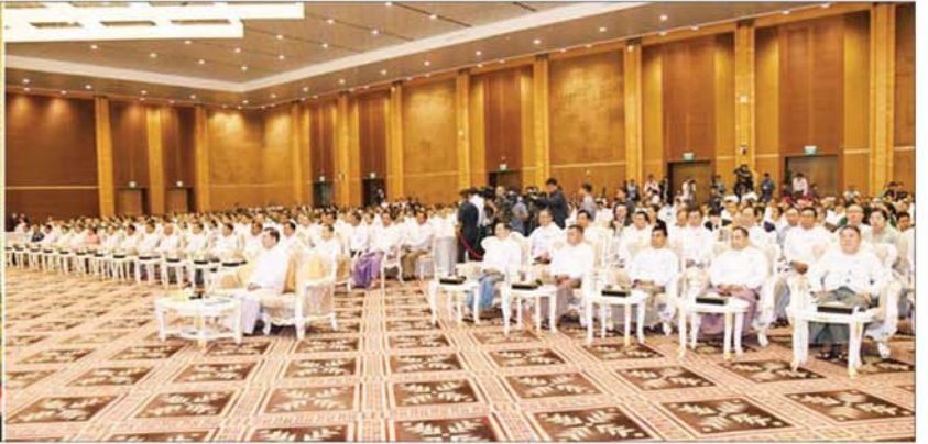
ပြည်ထောင်စုသမ္မတမြန်မာနိုင်ငံတော် ယာယီသမ္မတ နိုင်ငံတော်လုံခြုံရေးနှင့် အေးချမ်းသာယာရေးကော်မရှင်ဥက္ကဋ္ဌ ဗိုလ်ချုပ်မှူးကြီး မင်းအောင်လှိုင်နှင့် အခမ်းအနားတက်ရောက်လာကြသူများ အနုပညာရှင်များ၏ "ရောင်နီသစ်ပြီ" တေးသီချင်းဖြင့် သီဆိုဖျော်ဖြေတင်ဆက်မှုကို ကြည့်ရှုအားပေးကြစဉ်။

စာမျက်နှာ ၆ မှ ဖြစ်ပွားခြင်း၊ အချင်းချင်း မသင့်မြတ်မှုများ ဖြစ်ပွားမှုကြောင့် စစ်ပွဲဖြစ်ပွားခြင်းများ ကြောင့် မိမိတို့၏ ရှေးယခင်ကတတ်မြောက် ခဲ့သည့် အသိပညာ၊ အတတ်ပညာများကို ဆက်လက်လက်ဆင့်ကမ်း ထိန်းသိမ်းနိုင် မှု အားနည်းခဲ့ကြသည်ကိုတွေ့ရကြောင်း၊ အလားတူ လွတ်လပ်ရေးဆုံးရှုံးပြီး ကိုလိုနီ လက်အောက်သို့ ကျရောက်ခဲ့ချိန်တွင် လည်း မိမိတို့နိုင်ငံ၏ ပညာရေးနိမ့်ပါး အောင်ဆောင်ရွက်ခဲ့ကြကြောင်း၊ လွတ်လပ် ရေးရရှိပြီးချိန်တွင်လည်း ပြည်တွင်း လက်နက်ကိုင်ပဋိပက္ခများ ဖြစ်ပွားခဲ့ခြင်း ကြောင့် တည်ငြိမ်အေးချမ်းမှုများ ပျက်ပြား ခဲ့ပြီး ပညာသင်ကြားမှုများ ထိခိုက်ခဲ့ရ ကြောင်း။