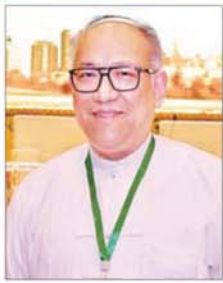
ဒေါက်တာဇော်ဦး

ထိန်းကျောင်းတဲ့ ပုံသဏ္ဍာန်တစ်ခု ပေါ်ပေါက်လာပြီး အဲဒီကနေ တစ်ဆင့် ဝိုင်းဝန်းအားကောင်းတဲ့ နိုင်ငံရေးစနစ်၊ နိုင်ငံရေးယဉ်ကျေး မှု တိုးတက်လာဖို့အတွက် ဝိုင်းပြီး ကြိုးစားကြရမယ်လို့ မြင်ပါတယ်။ မကြာခင်မှာ ကျင်းပပတာမှမယ လွှတ်တော်အစည်းအဝေးတွေမှာ နိုင်ငံအတွက် အရေးကြီးတဲ့ ဆုံးဖြတ်ချက်၊ မူဝါဒဆိုင်ရာတွေကို ဆွေးနွေးကြမယ့်အချိန်မှာ ဒီနေ့ ဆွေးနွေးတဲ့ အချက်အလက်တွေ ဟာ အများကြီး အထောက်အကူ ဖြစ်လိမ့်မယ်လို့ မျှော်လင့်ပါတယ်။ နိုင်ငံတစ်ခုရဲ့ အပြောင်းအလဲဖြစ်စဉ် ဆိုတာက ကောင်းမွန်စေမယ့် အားလုံးကို ဆက်ခံရတာပါ။ ဖြစ်ခဲ့ တာတွေကို သင်ခန်းစာတွေယူပြီး အဲဒီကနေ ရှေ့ဆက်မယ့်အခါအတွက် ပြင်ဆင်ကြရမှာဖြစ်ပါတယ်။