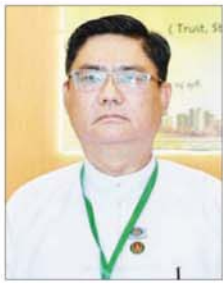
ဦးအောင်ကျော်မင်း

ဒီနေ့ကျင်းပတဲ့ ဖိုရမ်မှာ ထူးခြား တာကတော့ ရွေးကောက်ပွဲအပြီး ရွေးကောက်ခံရတဲ့ လွှတ်တော် ကိုယ်စားလှယ်တွေ ပါဝင် တက်ရောက်တာ ဖြစ်ပါတယ်။ ဒီနေ့အခမ်းအနားမှာ နိုင်ငံတော် အကြီးအခင်အနေနဲ့ သူ့ရဲ့ အယူ အဆ၊ သုံးသပ်ချက်တွေကို ဖော်ပြ သွားတယ်ဆိုတာ နိုင်ငံတဝန်ထမ်း ဆောင်မယ့် ပုဂ္ဂိုလ်တွေအတွက် လက်ဆင့်ကမ်းတယ်လို့ ကျွန်တော် ကတော့မြင်ပါတယ်။ လွှတ်တော် အဝင်းအကျင်း ပေါ်လာတယ် ဆိုတာက အာဏာခွဲဝေကျင့်သုံးတဲ့ ယဉ်ကျေးမှု ပေါ်ထွန်းလာတာ ဖြစ်ပါတယ်။ အပြန်အလှန်စစ်ဆေး