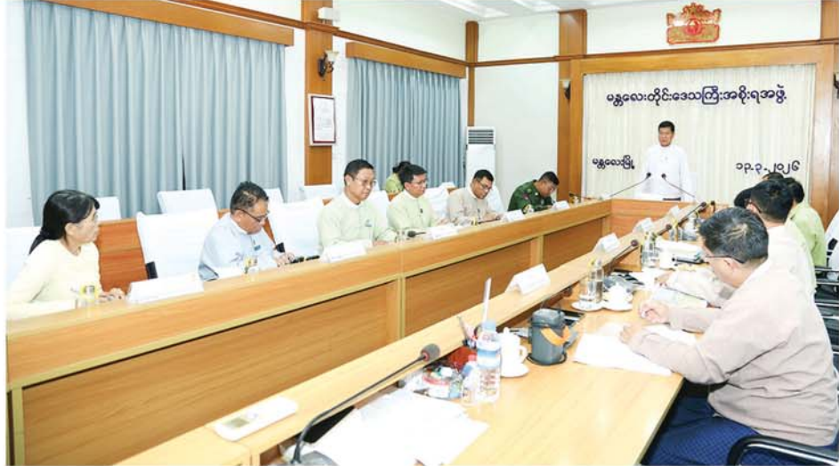
လျှောက်ထားတင်ပြလာသည့် အမှုတွဲများအား ရှင်းလင်းတင်ပြပြီး ကြရာ တိုင်းဒေသကြီး ဝန်ကြီးချုပ်က ပေါင်းစပ်ညှိနှိုင်းဆောင်ရွက် နောက် တက်ရောက်လာကြသူများက လယ်ယာမြေစီမံခန့်ခွဲမှုလုပ်ငန်း ပေးပြီး နိဂုံးချုပ်စကားပြောကြားခဲ့ကြောင်း သိရသည်။ (မန္တလေးနေ့စဉ်)

၎င်းနောက် တိုင်းဒေသကြီး လယ်ယာမြေစီမံခန့်ခွဲမှုအဖွဲ့ အတွင်းရေးမှူး တိုင်းဒေသကြီး မြေစာရင်းဦးစီးဌာနမှ တိုင်းဦးစီးမှူးက လယ်ယာမြေ ဥပဒေပုဒ်မ-၃၀(ခ)အရ အခြားနည်းအသုံးပြုခွင့်