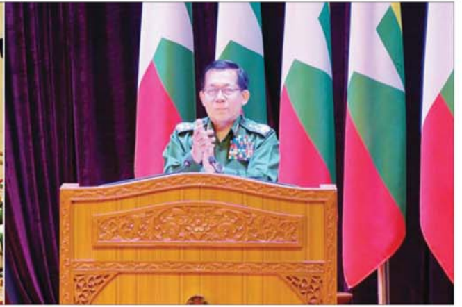
နိုင်ငံတော်လုံခြုံရေးနှင့် အေးချမ်းသာယာရေးကော်မရှင်ဥက္ကဋ္ဌ ဒုတိယဗိုလ်ချုပ်မှူးကြီး စိုးဝင်းအား ကျေးဇူးတင်ချီးကျူးဂုဏ်ပြုစဉ်။