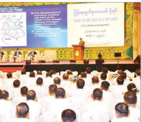
မြန်မာနိုင်ငံ၏ စီးပွားရေးဖွံ့ဖြိုးတိုးတက်ရေးအတွက် နိုင်ငံတကာအခွင့်အလမ်းများ ခေါင်းစဉ်ဖြင့် ဆွေးနွေးပွဲကျင်းပစဉ်။

အလမ်းသစ်များ၊ Greater Mekong Sub-Region(GMS)မှ တစ်ဆင့် စီးပွားရေး အခွင့်အလမ်းများ ဖော်ဆောင်မှု၊ မြန်မာနိုင်ငံ၏ ပထဝီစီးပွားရေးဆိုင်ရာ အခွင့်အလမ်းများ၊ စီးပွားရေးစင်္ကြံများမှ မြန်မာနိုင်ငံအနေဖြင့် ရရှိနိုင်သည့် အခွင့်အလမ်းများနှင့် စီးပွားရေးအကျိုးရလဒ်များ ဖော်ဆောင်နိုင်မည့် အခြေအနေ၊ တရုတ်နိုင်ငံအနေဖြင့် အာရှဒေသတွင်းမှ စိုက်ပျိုးရေးဆိုင်ရာ ထုတ်ကုန်များကို ပိုမိုတင်သွင်းခွင့်ပြုမည့် မူဝါဒ၊ မြန်မာ-တရုတ် နှစ်နိုင်ငံ ကုန်သွယ်မှုတွင် မြန်မာနိုင်ငံဘက်မှ စိုက်ပျိုးရေးဆိုင်ရာ ထုတ်ကုန်များ၊ တန်ဖိုးဖြင့် ထုတ်ကုန်များထုတ်လုပ်၍ တရုတ်နိုင်ငံသို့ ပိုမိုတင်ပို့နိုင်ရေးနှင့် စပ်လျဉ်း၍ ဆွေးနွေးသည်။