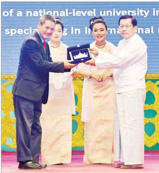
ပြည်ထောင်စုသမ္မတမြန်မာနိုင်ငံတော် ယာယီသမ္မတ နိုင်ငံတော်လုံခြုံရေးနှင့် အေးချမ်းသာယာရေးကော်မရှင်ဥက္ကဋ္ဌ ဗိုလ်ချုပ်မှူးကြီး မင်းအောင်လှိုင် ဖိုရမ်တွင်ပါဝင် ဆွေးနွေးကြမည့် နိုင်ငံတကာပညာရှင်များအား မြန်မာ့မျက်နှာစာသစ်ဖိုရမ်ကျင်းပခြင်း အထိမ်းအမှတ်လက်ဆောင်များ ပေးအပ်စဉ်။