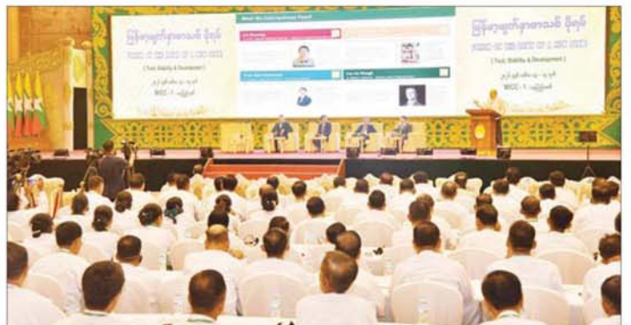
မြန်မာနိုင်ငံ၏ စီးပွားရေးဖွံ့ဖြိုးတိုးတက်ရေးအတွက် နိုင်ငံတကာအခွင့်အလမ်းများ ခေါင်းစဉ်ဖြင့် ဆွေးနွေးပွဲကျင်းပစဉ်။