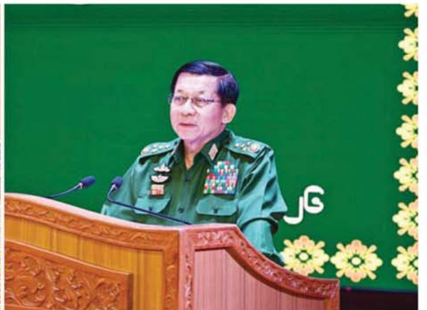
နိုင်ငံတော်လုံခြုံရေးနှင့် အေးချမ်းသာယာရေးကော်မရှင်ဥက္ကဋ္ဌ တပ်မတော်ကာကွယ်ရေးဦးစီးချုပ် ဗိုလ်ချုပ်မှူးကြီးမင်းအောင်လှိုင် ၂၀၁၁ ခုနှစ်မှ ၂၀၂၅ ခုနှစ်အတွင်း ခေတ်မီတပ်မတော်ဖြစ်စေရေး ဆောင်ရွက်ခဲ့မှုနှင့်ပတ်သက်၍ ပြန်လည်သုံးသပ် ဆွေးနွေးမှာကြားစဉ်။

နိုင်ငံတော်လုံခြုံရေးနှင့် အေးချမ်းသာယာရေးကော်မရှင်ဥက္ကဋ္ဌ တပ်မတော်ကာကွယ်ရေးဦးစီးချုပ် ဗိုလ်ချုပ်မှူးကြီးမင်းအောင်လှိုင် ၂၀၁၁ ခုနှစ်မှ ၂၀၂၅ ခုနှစ်အတွင်း ခေတ်မီတပ်မတော်ဖြစ်စေရေး ဆောင်ရွက်ခဲ့မှုနှင့်ပတ်သက်၍ ပြန်လည်သုံးသပ်ဆွေးနွေးမှာကြား မွန်မြတ်သည်လက်ဆင့်ကမ်းအမွေကို ထိန်းသိမ်းပြီး တပ်မတော်နှင့် နိုင်ငံ့ဂုဏ်ကို ဆက်လက်မြှင့်တင်ဆောင်ရွက်