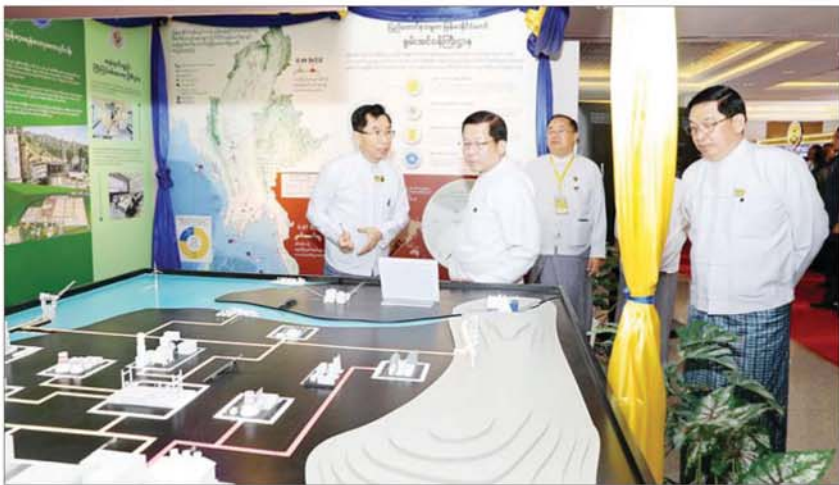
ပြည်ထောင်စုသမ္မတမြန်မာနိုင်ငံတော် ယာယီသမ္မတ နိုင်ငံတော်လုံခြုံရေးနှင့် အေးချမ်းသာယာရေးကော်မရှင်ဥက္ကဋ္ဌ ဗိုလ်ချုပ်မှူးကြီး မင်းအောင်လှိုင်နှင့် အခမ်းအနားတက်ရောက်လာကြသူများ မြန်မာ့မျက်နှာစာသစ်ဖိုရမ် အထိမ်းအမှတ် ပြခန်းများကို လှည့်လည်ကြည့်ရှုစဉ်။

စာမျက်နှာ ၆ မှ ဖြစ်ပွားခြင်း၊ အချင်းချင်း မသင့်မြတ်မှုများ ဖြစ်ပွားမှုကြောင့် စစ်ပွဲဖြစ်ပွားခြင်းများ ကြောင့် မိမိတို့၏ ရှေးယခင်ကတတ်မြောက် ခဲ့သည့် အသိပညာ၊ အတတ်ပညာများကို ဆက်လက်လက်ဆင့်ကမ်း ထိန်းသိမ်းနိုင် မှု အားနည်းခဲ့ကြသည်ကိုတွေ့ရကြောင်း၊ အလားတူ လွတ်လပ်ရေးဆုံးရှုံးပြီး ကိုလိုနီ လက်အောက်သို့ ကျရောက်ခဲ့ချိန်တွင် လည်း မိမိတို့နိုင်ငံ၏ ပညာရေးနိမ့်ပါး အောင်ဆောင်ရွက်ခဲ့ကြကြောင်း၊ လွတ်လပ် ရေးရရှိပြီးချိန်တွင်လည်း ပြည်တွင်း လက်နက်ကိုင်ပဋိပက္ခများ ဖြစ်ပွားခဲ့ခြင်း ကြောင့် တည်ငြိမ်အေးချမ်းမှုများ ပျက်ပြား ခဲ့ပြီး ပညာသင်ကြားမှုများ ထိခိုက်ခဲ့ရ ကြောင်း။