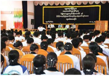
မိတ္ထီလာ မတ် ၁၁

မိတ္ထီလာမြို့၌ ပြန်ကြားရေးနှင့် ပြည်သူ့ဆက်ဆံရေးဦးစီးဌာနနှင့် မိတ္ထီလာပညာရေးဒီဂရီကောလိပ် တို့မှပေါင်းဆောင်ရွက်သော လူငယ် စကားပိုင်းကို မတ် ၁၀ ရက် နံနက် ပိုင်းက အဆိုပါဒီဂရီကောလိပ် ခန်းမတွင် ကျင်းပခဲ့သည်။