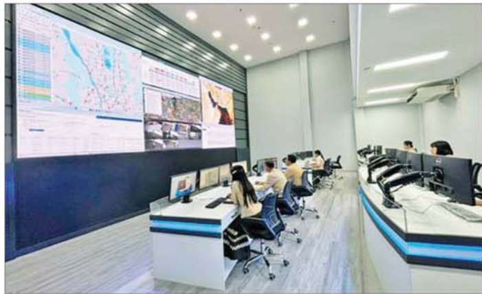
စွမ်းအင်ဝန်ကြီးဌာန၊ နေပြည်တော်ရှိ Online Monitoring Center တွင် အချိန်နှင့်တစ်ပြေးညီ စောင့်ကြည့်ကြပ်မတ်လျက်ရှိမှုအခြေအနေကိုတွေ့ရစဉ်။

စွမ်းအင်စီမံကိန်းများသည် ဆယ်စုနှစ်နှင့်ချီ၍ ဆောင်ရွက်ရသည့်ဖြစ်ရာ ဆက်လက်ဆောင်ရွက်သွားရမည့် လုပ်ငန်းစဉ်များကိုလည်း အချိန်ကိုက်အောင်မြင်စွာ အကောင်အထည်ဖော်ဆောင်ရွက်နိုင်ရန်အတွက်လည်း အစီအမံများချမှတ်ထားပြီးဖြစ်ရာ စိတ်အားထက်သန်စွာဖြင့် စည်းလုံးညီညွတ်စွာ ပူးပေါင်းဆောင်ရွက်သွားကြရန် မှာကြားလိုကြောင်း၊ တွေ့ကြုံရင်ဆိုင်ခဲ့ရသည့် အခက်အခဲများကို သင်ခန်းစာရယူပြီး အောင်မြင်သည့် အနာဂတ်ကို ရယူဆောင်ရွက်သွားရန် တိုက်တွန်းပြောကြားခဲ့ကြောင်း သိရသည်။ သတင်းစဉ်