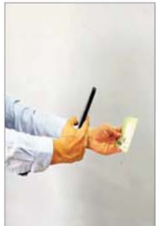
Barcode Scan ဖတ်မည်

ပြည်သူများ၏ပူးပေါင်းပါဝင်ကူညီဆောင်ရွက်ပေးမှုများကြောင့် စက်သုံးဆီအရောင်းဆိုင်များတွင် ယာဉ်တန်းစီများ လျော့ကျသွားပြီး ပုံမှန်ဖြန့်ဖြူးရောင်းချနိုင်သည့်အခြေအနေသို့ ပြန်လည်ရောက်ရှိခဲ့ပါသည်။ စွမ်းအင်ဝန်ကြီးဌာနအနေဖြင့်လည်း နေပြည်တော်ရှိ ရေနံထွက်ပစ္စည်းကြီးကြပ်စစ်ဆေးရေးဦးစီးဌာန၏ Online Monitoring Center တွင် စက်သုံးဆီတင်သွင်း၊ သိုလှောင်၊ ဖြန့်ဖြူးရောင်းချခြင်း လုပ်ငန်းစဉ် (Supply Chain) တစ်လျှောက်ကို အချိန်နှင့်တစ်ပြေးညီ စောင့်ကြည့်ကြပ်မတ်လျက်ရှိခြင်း၊ စက်သုံးဆီရောင်းချမှုများနှင့်ပတ်သက်၍ မြို့ကြီးများရှိ စက်သုံးဆီအရောင်းဆိုင်များတွင် ရောင်းချပေးသည့် ယာဉ်အမျိုးအစားနှင့်ယာဉ်နံပါတ်၊ ဆီအမျိုးအစားနှင့်ပမာဏ၊ ရောင်းချပေးသည့် ဈေးနှုန်းစသည်တို့ကိုလည်း အချိန်နှင့်တစ်ပြေးညီ စောင့်ကြည့်ကြပ်မတ်လျက်ရှိခြင်းတို့အပြင် ပြည်တွင်းစက်သုံးဆီဖုလုံမှုရှိစေရေးကိုလည်း အစီအမံအတိုင်း အထူးအလေးထားဆောင်ရွက်လျက်ရှိပါကြောင်း အသိပေးထုတ်ပြန်အပ်ပါသည်။