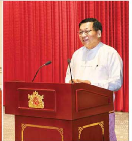
ပြည်ထောင်စုသမ္မတ မြန်မာနိုင်ငံတော် ယာယီသမ္မတ နိုင်ငံတော်လုံခြုံရေးနှင့် အေးချမ်းသာယာရေးကော်မရှင်ဥက္ကဋ္ဌ ဗိုလ်ချုပ်မှူးကြီး မင်းအောင်လှိုင် နိုင်ငံတော်အစိုးရ၏ ၂၀၂၁ ခုနှစ်မှ ၂၀၂၅ ခုနှစ်အတွင်း နိုင်ငံတော် ဖွံ့ဖြိုးတိုးတက်ရေး ဆောင်ရွက်ခဲ့မှုနှင့်ပတ်သက်၍ ပြန်လည်သုံးသပ်ဆွေးနွေး မှာကြားစဉ်။