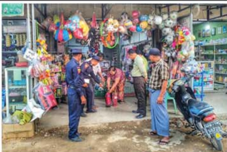
(မန္တလေးနေ့စဉ်-၈)

မန္တလေးတိုင်းဒေသကြီးအတွင်းရှိ တက္ကသိုလ်ဝင်တန်းစာမေးပွဲဖြေဆိုမည့် ကျောင်းသား၊ ကျောင်းသူများအားလုံး စိတ်အေးချမ်းသာစွာဖြင့် စာမေးပွဲဖြေဆိုနိုင်ရေးအတွက် တိုင်းဒေသကြီးအစိုးရအဖွဲ့မှ လိုအပ်သည်များကို စီမံဆောင်ရွက်ထားကြောင်း သိရသည်။