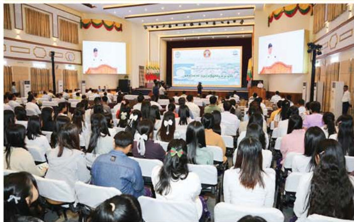
မန္တလေး မတ် ၁၀

ကမ္ဘာ့စားသုံးသူအခွင့်အရေးများနေ့ (World Consumer Rights Day) အထိမ်းအမှတ် အခမ်းအနားကို မြန်မာနိုင်ငံ စားသုံးသူကာကွယ်ရေးကော်မရှင်က ချမ်းအေးသာစံမြို့နယ်ရှိ မန္တလေးမြို့တော် စည်ပင်သာယာရေးကော်မတီရုံး မြို့တော်ခန်းမတွင် ယနေ့နံနက်ပိုင်းက ကျင်းပရာ မန္တလေးတိုင်းဒေသကြီးအစိုးရအဖွဲ့ ဝန်ကြီးချုပ် ဦးမျိုးအောင်၊ တိုင်းဒေသကြီးတရားလွှတ်တော် တရားသူကြီးချုပ်၊ တိုင်းဒေသကြီးအစိုးရအဖွဲ့ဝင် ဝန်ကြီးများနှင့် တာဝန်ရှိသူများ၊ ဌာနဆိုင်ရာများ၊ အသင်းအဖွဲ့များ၊ စီးပွားရေးလုပ်ငန်းရှင်များနှင့် ဖိတ်ကြားထားသူများ တက်ရောက်ကြသည်။