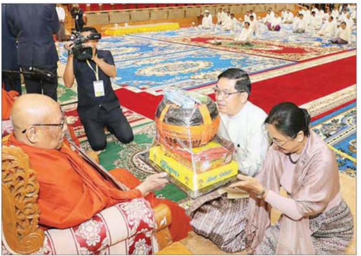
ကော်မရှင်အဖွဲ့ဝင် နိုင်ငံတော်ဝန်ကြီးချုပ် ဦးညိုစောနှင့်ဇနီး ဆရာတော်ကြီးထံ လှူဖွယ်ဝတ္ထုပစ္စည်းများ ဆက်ကပ်လှူဒါန်းစဉ်။

အဖွဲ့ဝင် အမှုဆောင်ချုပ် ဦးအောင်လှိုင်နှင့် ဇနီး ဒေါ်ကြူကြူလှ အမျိုးပြုသော ဧည့်ပရိသတ်များက နိုင်ငံတော် သံဃမဟာနာယကအဖွဲ့ ဥက္ကဋ္ဌ သန့်လှိုင်မင်းကျောင်းဆရာတော်ကြီး ထံမှ ရွတ်ပွားသရဏ္ဍာယ်တော်မူသော မေတ္တာသုတ်ပရိတ်တရားတော်များကို နာယူကြည်ညိုကြစဉ်။