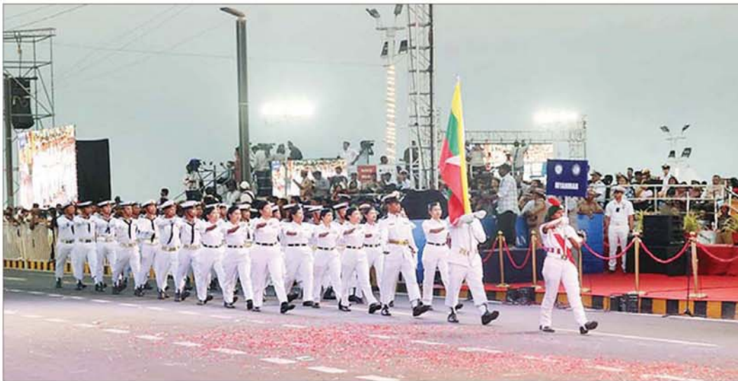
တပ်မတော်(ရေ)ကိုယ်စားလှယ်အဖွဲ့ City Parade တွင် ပါဝင်ဆောင်ရွက်နေမှုကိုတွေ့ရစဉ်။