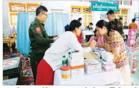
ဌာနချုပ်မှ တာဝန်ရှိသူများက ဆောင်ရွက်ပေးခဲ့ကြောင်း သတင်း သွားရောက် ကြည့်ရှုအေးပေး ရရှိသည်။ ပြီး လိုအပ်သည်များ ညှိနှိုင်း သတင်းစဉ်

ပတ်သက်၍ ကျန်းမာရေးစောင့် ရှောက်မှုလုပ်ငန်းများ ဆောင်ရွက် ပေးပြီး ကျန်းမာရေးအသိပညာ ပေးခြင်းများ လောပြောဆွေးနွေး ကာ ဆေးရုံတက်ရောက် ကုသရန် လိုအပ်သည့် လူနာများအား နယ်မြေခံ တပ်မတော်ဆေးရုံသို့ တက်ရောက် ကုသနိုင်ရေးဆောင် ရွက်ပေးသည်။ ယင်းသို့ ဆောင်ရွက်ပေးနေမည့် များကို အလယ်ပိုင်းတိုင်းစစ်