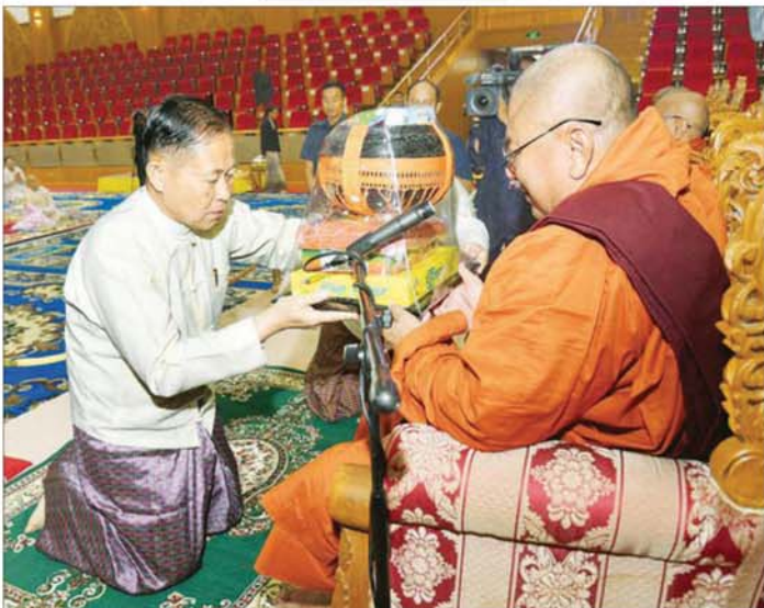
နိုင်ငံတော်လုံခြုံရေးနှင့် အေးချမ်းသာယာရေးကော်မရှင် ဒုတိယဥက္ကဋ္ဌ ဒုတိယဗိုလ်ချုပ်မှူးကြီး စိုးဝင်း နိုင်ငံတော်သံဃမဟာနာယကအဖွဲ့ အကျိုးတော်ဆောင်၊ မန္တလေးမြို့ မစိုးရိမ်တိုက်သစ် မဟာနာယက ဆရာတော်ကြီးထံ လှူဖွယ်ဝတ္ထုပစ္စည်းများ ဆက်ကပ်လှူဒါန်းစဉ်။