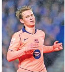
ကွင်းလယ်ကစားသမား ဖရန့်ကို ဒီဂျော့သည် ဘာစီလိုနာအသင်း နှင့်အတူ ၂၀၁၉-၂၀၂၀မှ ၂၀၂၅-၂၀၂၆ ဘောလုံးရာသီအထိ ပြိုင်ပွဲ စုံ ၂၉၀ပွဲကစားပြီး ဂိုး ၂၀သွင်း ယူကာ ခြေစွမ်းပြထားသည်။ (အောက်ပုံ)

ဖရန့်ကိုဒီဂျော့ ပေါင်ဒဏ်ရာကြောင့် ခြောက်ပတ်ခန့် အနားယူရမည် ဘာစီလိုနာ ဖေဖော်ဝါရီ ၂၈ ဘာစီလိုနာအသင်းကွင်း လယ်ကစားသမား ဖရန့်ကိုဒီ ဂျော့ ပေါင်ဒဏ်ရာကြောင့် ခြောက် ပတ်ခန့် အနားယူရမည်ဖြစ်သည်။ အဆိုပါ ကွင်းလယ်ကစား သမားသည် အသင်း၏ လေ့ကျင့် ရေး အစီအစဉ်တွင် ပါဝင်ကစား ရင်း ဒဏ်ရာရရှိခဲ့ခြင်းဖြစ်သည်။ ကွင်းလယ်ကစားသမား ဖရန့်ကိုဒီဂျော့ ဒဏ်ရာပြသကာ နှင့် ရင်ဆိုင်ခဲ့ရခြင်းကြောင့် ဘာစီ လိုနာအသင်းအတွက်လည်း ကြီး မားသည့် ထိုးနှက်ချက်တစ်ရပ် ဖြစ်လာခဲ့သည်။ အသက်(၂၈)နှစ်အရွယ်ရှိ