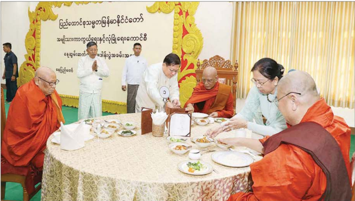
ပြည်ထောင်စုသမ္မတမြန်မာနိုင်ငံတော် ယာယီသမ္မတ နိုင်ငံတော်လုံခြုံရေးနှင့် အေးချမ်းသာယာရေးကော်မရှင်ဥက္ကဋ္ဌ ဗိုလ်ချုပ်မှူးကြီး မင်းအောင်လှိုင်နှင့်ဇနီး ဒေါ်ကြူကြူလှ သန့်လျင်မင်းကျောင်းဆရာတော်ကြီး အမှူးပြုသည့် ၂၀၂၆ ခုနှစ်၊ သာသနာတော်ဆိုင်ရာ ဘွဲ့တံဆိပ်တော် ဆက်ကပ်အပူဇော်ခံယူတော်မူကြမည့် ဆရာတော်ကြီးများအား နေ့ဆွမ်းဆက်ကပ်လှူဒါန်းစဉ်။

ဆက်လက်၍ နိုင်ငံတော် ယာယီသမ္မတ နိုင်ငံတော်လုံခြုံ ရေးနှင့် အေးချမ်းသာယာရေး