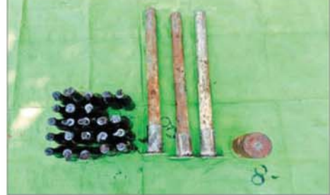
အကြမ်းဖက်သောင်းကျန်းသူများထံမှ လက်လုပ်စိန်ပြောင်း၊ မီးလောင်ပုလင်း၊ လက်လုပ်မိုင်းများ မှတ်တမ်းဓာတ်ပုံ။