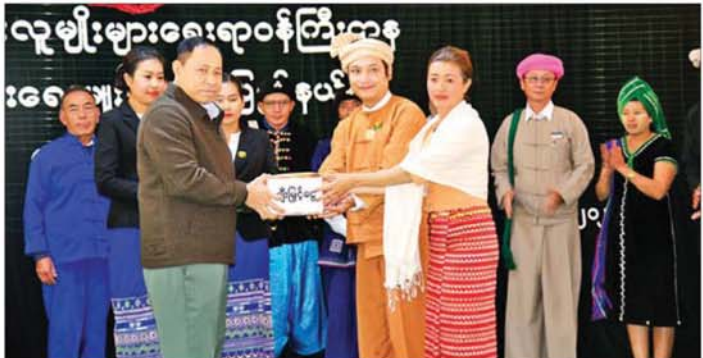
တွေ့ဆုံတိုင်တာဝန်ရှိသူများက တိုင်းရင်းသားရေးရာ ယဉ်ကျေးမှုနှင့် စာပေဆောင်ရွက်ရေးမှူး အခြေအနေ၊ ဒေသဖွံ့ဖြိုးရေးလုပ်ငန်းလုံအပ်ချက်များကို ရှင်းလင်း တင်ပြကြရာ ပြည်ထောင်စုဝန်ကြီးက လိုအပ်သည် များ ပေါင်းစပ်ဖြည့်ဆည်း ဆောင်ရွက်ပေးသည်။ ထို့နောက်ပြည်ထောင်စုဝန်ကြီးက ပြည်ထောင်စု

နေပြည်တော် ဖေဖော်ဝါရီ ၈ နိုင်ငံတော်လုံခြုံရေးနှင့် အေးချမ်းသာယာရေး ကော်မရှင်အဖွဲ့ဝင် နယ်စပ်ရေးရာဝန်ကြီးဌာနနှင့် တိုင်းရင်းသားလူမျိုးများရေးရာ ဝန်ကြီးဌာန ပြည်ထောင်စုဝန်ကြီး ဒုတိယဦးလှိုင်ကျော်သည် သည် ရှမ်းပြည်နယ်ဝန်ကြီးချုပ် ဦးအောင်အောင်နှင့် အတူ ယနေ့နံနက်ပိုင်းက တောင်ကြီးမြို့ရှိ ပြည်နယ် တိုင်းရင်းသားလူမျိုးများရေးရာ ဝန်ကြီးဌာန ညွှန်ကြားရေးမှူးရုံး၌ တိုင်းရင်းသားစာပေနှင့် ယဉ်ကျေးမှုအသင်းအဖွဲ့များဖြစ်ကြသည့် ရှမ်းစာပေ နှင့်ယဉ်ကျေးမှုအသင်း၊ ပအိုဝ်းစာပေနှင့် ယဉ်ကျေးမှု အဖွဲ့၊ ဓနုတိုင်းရင်းသားရေးရာအဖွဲ့၊ တောင်ရိုးစာပေ နှင့် ယဉ်ကျေးမှုအသင်း၊ အင်းသားစာပေယဉ်ကျေးမှုနှင့် ဒေသဖွံ့ဖြိုးရေးအသင်း၊ ကိုးကန့်စာပေနှင့်ယဉ်ကျေးမှု အသင်း၊ ကချင်စာပေနှင့် ယဉ်ကျေးမှုအသင်း၊ ထနေရာ စာပေနှင့် ယဉ်ကျေးမှုအသင်း၊ လီဆူစာပေနှင့် ယဉ်ကျေးမှုအသင်း၊ ယင်းကြားစာပေနှင့်ယဉ်ကျေးမှု အသင်း၊ ယင်းနက်စာပေနှင့် ယဉ်ကျေးမှုအသင်းတို့မှ တာဝန်ရှိသူများအား တွေ့ဆုံသည်။