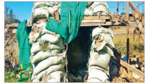
အကြမ်းဖက်သောင်းကျန်းသူများက ဗန်းမောက်မြို့ အထက (ဗန်းမောက်)ရှိ စာသင်ဆောင်များ၌ ခံစစ်ပြင်ဆင်ထားရှိမှု မှတ်တမ်း ဓာတ်ပုံ။