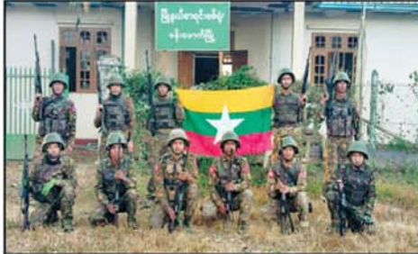
လုံခြုံရေးတပ်ဖွဲ့ဝင်များက ဗန်းမောက်မြို့ ပြည်သူ့ဆေးရုံ၊ မြို့တော်ခန်းမ၊ မြို့နယ်စာရင်းစစ်ရုံး၊ လဝကရုံးတို့အား ပြန်လည်သိမ်းပိုက်ရရှိမှု မှတ်တမ်းဓာတ်ပုံ။