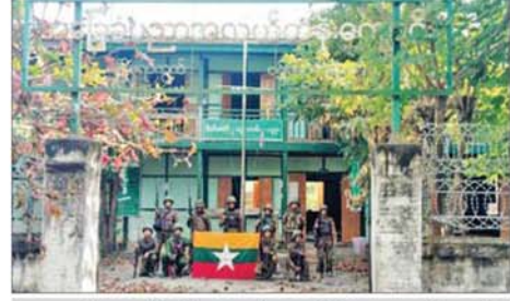
လုံခြုံရေးတပ်ဖွဲ့ဝင်များက ဗန်းမောက်မြို့ အလက(ဗန်းမောက်) အား ပြန်လည်သိမ်းပိုက်ရရှိမှု မှတ်တမ်းဓာတ်ပုံ။