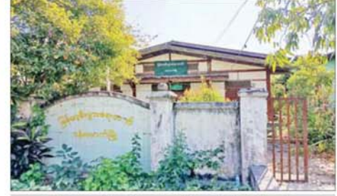
လုံခြုံရေးတပ်ဖွဲ့ဝင်များက ဗန်းမောက်မြို့ မြန်မာစီးပွားရေး တာဝါအား ပြန်လည်သိမ်းပိုက်ရရှိမှု မှတ်တမ်းဓာတ်ပုံ။