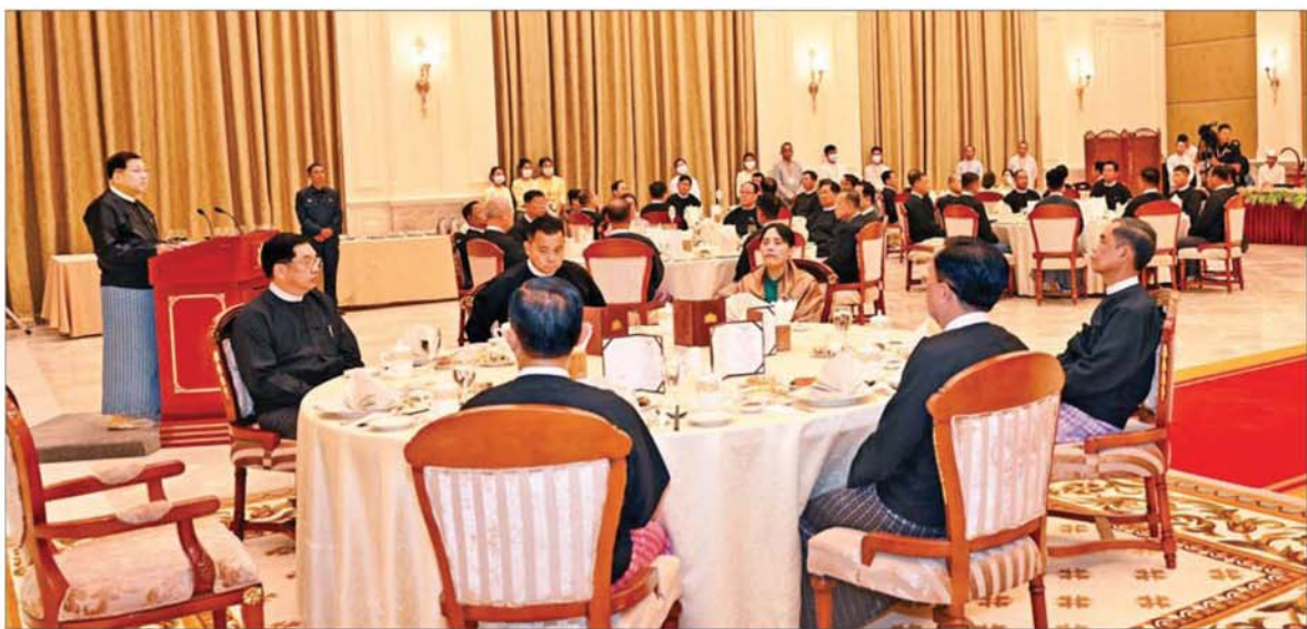
ပြည်ထောင်စုသမ္မတမြန်မာနိုင်ငံတော် ယာယီသမ္မတ နိုင်ငံတော်လုံခြုံရေးနှင့် အေးချမ်းသာယာရေးကော်မရှင်ဥက္ကဋ္ဌ ဗိုလ်ချုပ်မှူးကြီးမင်းအောင်လှိုင် အပြည်ပြည်ဆိုင်ရာတရားရုံး(ICJ) ၌ တရားရင်ဆိုင်ကြားနာပွဲသို့ သွားရောက်ဖြေရှင်းခဲ့သည့် မြန်မာကိုယ်စားလှယ်အဖွဲ့အား တည်ခင်းဧည့်ခံသည့် ဂုဏ်ပြုညစာစားပွဲတွင် အမှာစကားပြောကြားစဉ်။

နေပြည်တော် ဖေဖော်ဝါရီ ၈ ပြည်ထောင်စုသမ္မတ မြန်မာနိုင်ငံတော်ယာယီသမ္မတ နိုင်ငံတော်လုံခြုံရေးနှင့် အေးချမ်းသာယာရေးကော်မရှင်ဥက္ကဋ္ဌ ဗိုလ်ချုပ်မှူးကြီးမင်းအောင်လှိုင်က အပြည်ပြည်ဆိုင်ရာတရားရုံး(ICJ)၌ တရားရင်ဆိုင်ကြားနာပွဲသို့ သွားရောက်ဖြေရှင်းခဲ့သည့် မြန်မာကိုယ်စားလှယ်အဖွဲ့အား ဂုဏ်ပြုညစာစားပွဲဖြင့် တည်ခင်းဧည့်ခံပွဲကို ယနေ့ညနေပိုင်းတွင် အမျိုးသားကာကွယ်ရေးနှင့် လုံခြုံရေးကောင်စီရုံး Banquet Hall ၌ ကျင်းပပြုလုပ်သည်။