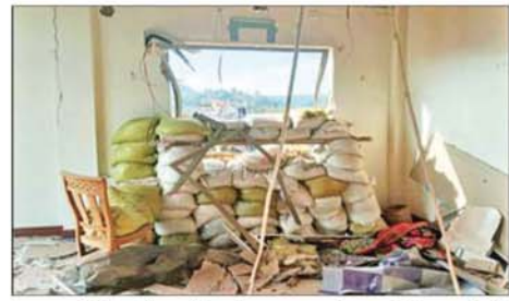
အကြမ်းဖက်သောင်းကျန်းသူများက ဗန်းမောက်မြို့ တော်ဝင် ရွှေမြို့တော်ဟိုတယ်နှင့် ဟိုတယ်အတွင်း၌ ခံစစ်ပြင်ဆင်ထားရှိမှု မှတ်တမ်းဓာတ်ပုံ။