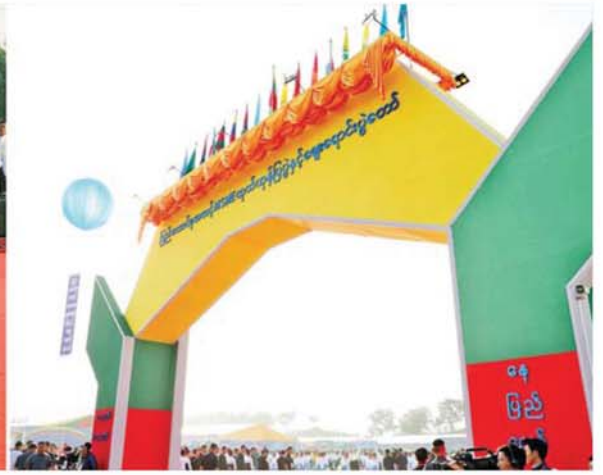
ပြည်ထောင်စုသမ္မတမြန်မာနိုင်ငံတော် ယာယီသမ္မတ နိုင်ငံတော်လုံခြုံရေးနှင့် အေးချမ်းသာယာရေးကော်မရှင်ဥက္ကဋ္ဌ ဗိုလ်ချုပ်မှူးကြီး မင်းအောင်လှိုင် ၂၀၂၆ ခုနှစ် (၇၉) နှစ်မြောက် ပြည်ထောင်စုနေ့အထိမ်းအမှတ် ပြည်ထောင်စုအဆင့် MSME ထုတ်ကုန်ပြပွဲနှင့် ဈေးရောင်းပွဲတော်အခမ်းအနားမုခ်ဦးအား စက်ခလုတ်နှိပ်ဖွင့်လှစ်ပေးခဲ့ပါသည်။

★ ရှေ့ဖိုးမှ အဆိုပါအခမ်းအနားသို့ နိုင်ငံတော်ယာယီသမ္မတ နိုင်ငံတော်လုံခြုံရေးနှင့် အေးချမ်းသာယာရေးကော်မရှင်ဥက္ကဋ္ဌနှင့် အတူ ကော်မရှင်ဒုတိယဥက္ကဋ္ဌ ဒုတိယဗိုလ်ချုပ်မှူးကြီး စိုးဝင်း၊ ကော်မရှင်အဖွဲ့ဝင် နိုင်ငံတော်ဝန်ကြီးချုပ် ဦးညိုစော၊ ကော်မရှင်အတွင်းရေးမှူး ဗိုလ်ချုပ်ကြီး ရဲဝင်းဦး၊ ကော်မရှင်အဖွဲ့ဝင်များ၊ ပြည်ထောင်စု ဝန်ကြီးများ၊ ပြည်ထောင်စုအဆင့်ပုဂ္ဂိုလ်များ၊ တိုင်းဒေသကြီးနှင့် ပြည်နယ် ဝန်ကြီးချုပ်များ၊ ကာကွယ်ရေးဦးစီးချုပ်မှူးအဆင့်မြင့်တပ်မတော် အရာရှိကြီးများ၊ နေပြည်တော်တိုင်းစစ်ဌာနချုပ်တိုင်းမှူး၊ ဒုတိယဝန်ကြီးများ၊ တိုင်းဒေသကြီးနှင့် ပြည်နယ်များမှ MSME အေဂျင်စီဥက္ကဋ္ဌများ၊ နေပြည်တော်ကောင်စီဝင်များ၊ ဌာနဆိုင်ရာ အကြီးအကဲများ၊ အသင်းအဖွဲ့များနှင့် ပြခန်းတာဝန်ခံများ၊ တိုင်းရင်းသားယဉ်ကျေးမှု အကအဖွဲ့များ၊ အထူး ဖိတ်ကြားထားသည့် ဧည့်သည်တော်များနှင့် ဒေသခံပြည်သူများ တက်ရောက်ကြပါသည်။