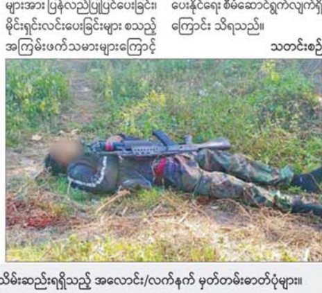
လုံခြုံရေးတပ်ဖွဲ့ဝင်များက အကြမ်းဖက်သောင်းကျန်းသူများထံမှ သိမ်းဆည်းရရှိသည့် အလောင်း/လက်နက် မှတ်တမ်းဓာတ်ပုံများ။