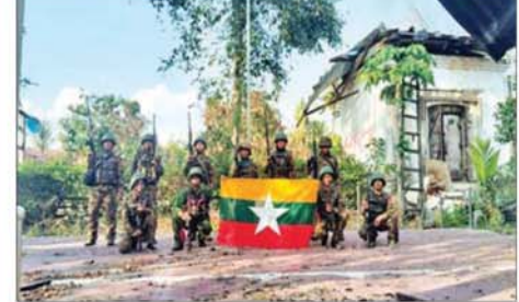
လုံခြုံရေးတပ်ဖွဲ့ဝင်များက ဗန်းမောက်မြို့ ရဲစခန်းအား ပြန်လည် သိမ်းပိုက်ရရှိမှု မှတ်တမ်းဓာတ်ပုံများ။