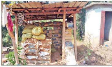
လုံခြုံရေးတပ်ဖွဲ့ဝင်များက ဗန်းမောက်မြို့တွင်း ရှင်းလင်းစဉ် အမက(အောင်သာကုန်း)အတွင်း သိမ်းပိုက်ရရှိသည့် ဘန်ကာနှင့် ပစ်ကျင်းများ မှတ်တမ်းဓာတ်ပုံ။