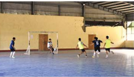
(မန္တလေးနေ့စဉ်-၃)

မန္တလေး ဖေဖော်ဝါရီ ၈ ၂၀၂၆ ခုနှစ် ဖေဖော်ဝါရီ ၁၂ ရက်တွင် ကျရောက်မည့် (၇၉)နှစ်မြောက် ပြည်ထောင်စုနေ့ အထိမ်းအမှတ် ပူသင်္ဘောလုံးပြိုင်ပွဲကို ယနေ့ မွန်းလွဲ ၁ နာရီက ချမ်းမြသာစည်မြို့နယ် အားကစားနှင့်ကာယပညာသိပ္ပံ (မန္တလေး)ဖူသင်္ဘောလုံးအားကစားကွင်းတွင် ပြိုင်ပွဲများကို ကျင်းပရာ ဒိုင်အေ့ဝင်များ၊ ပြိုင်အားကစားသမားများ ကြည့်ရှုအားပေးသူများဖြင့် စည်ကားလျက် ရှိသည်။ ပြိုင်ပွဲများကို ယှဉ်ပြိုင်ကစားကြရာ အုပ်စု(က)ပွဲစဉ်တွင် အားကစားနှင့်ကာယပညာသိပ္ပံ (မန္တလေး)အသင်း သုံးဂိုးနှင့် မန္တလေးမြို့တော်စည်ပင်သာယာရေးကော်မတီအသင်းက ခုနစ်ဂိုးဖြင့်လည်းကောင်း၊ တိုင်းဒေသကြီးအားကစားနှင့်ကာယပညာဦးစီးဌာနအသင်းက သုံးဂိုးနှင့် မန္တလေးတိုင်းဒေသကြီးမီးသတ်ဦးစီးဌာနအသင်းက (ခ)အုပ်စုဒုတိယဖြစ်သည့် အမျိုးသားယဉ်ကျေးမှုနှင့်အနုပညာတက္ကသိုလ် (မန္တလေး)အသင်းတို့က ပထမပွဲစဉ်အဖြစ်လည်းကောင်း၊ (ခ)အုပ်စုပထမဖြစ်သည့် မွေးနှင့်သားသတ်ဌာနအသင်းနှင့် (က)အုပ်စုဒုတိယဖြစ်သည့် မန္တလေးမြို့တော်စည်ပင်သာယာရေးကော်မတီအသင်းတို့က ဒုတိယပွဲစဉ် ယှဉ်ပြိုင်ကစားကြရမည်ဖြစ်သည်။ ဖေဖော်ဝါရီ ၁၁ ရက်တွင် တတိယနေရာလှပွဲစဉ်နှင့် ဗိုလ်လှပွဲများကို ယှဉ်ပြိုင်ကစားသွားကြမည်ဖြစ်ကြောင်း သိရသည်။