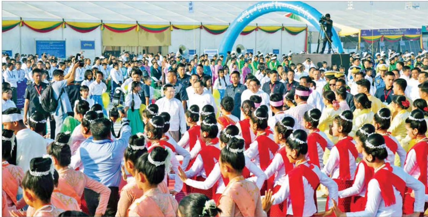
ပြည်ထောင်စုသမ္မတမြန်မာနိုင်ငံတော် ယာယီသမ္မတ နိုင်ငံတော်လုံခြုံရေးနှင့် အေးချမ်းသာယာရေးကော်မရှင်ဥက္ကဋ္ဌ ဗိုလ်ချုပ်မှူးကြီး မင်းအောင်လှိုင် ပြည်ထောင်စုအဆင့် MSME ထုတ်ကုန်ပြပွဲနှင့် ဈေးရောင်းပွဲတော် ဖွင့်ပွဲအခမ်းအနားတွင် တိုင်းဒေသကြီးနှင့်ပြည်နယ်များမှ တိုင်းရင်းသားယဉ်ကျေးမှုအဖွဲ့များ၏ ကပြဖျော်ဖြေတင်ဆက်မှုကို ကြည့်ရှုအားပေးစဉ်။