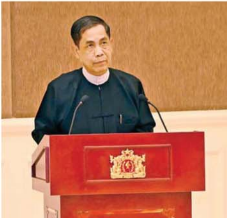
အပြည်ပြည်ဆိုင်ရာတရားရုံး(ICJ)၌ တရားရင်ဆိုင်ကြားနာပွဲသို့ သွားရောက်ဖြေရှင်းခဲ့သည့် မြန်မာကိုယ်စားလှယ်အဖွဲ့ခေါင်းဆောင် ပြည်ထောင်စုဝန်ကြီး ဦးကိုကိုလှိုင် ကျေးဇူးတင်စကားပြောကြားစဉ်။

ခဲ့ကြသည့်အတွက် အမျိုးသား စည်းလုံးညီညွတ်မှု၏ သာဓက တစ်ရပ်ရရှိခဲ့သည်ဟု ဆိုရမည် ဖြစ်ကြောင်း။