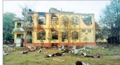
အကြမ်းဖက်သောင်းကျန်းသူများက နယ်စပ်ဒေသတိုင်းရင်း သားလူငယ်များ ဖွံ့ဖြိုးရေးသင်တန်းကျောင်း(နတလ)အား ပျက်ဆီး ခဲ့သည့် မှတ်တမ်းဓာတ်ပုံ။

လုံခြုံရေးတပ်ဖွဲ့ဝင်များအနေ ဖြင့် ဗန်းမောက်မြို့အား ပြန်လည် သိမ်းပိုက် ထိန်းချုပ်နိုင်ရေး စစ်ကြောင်းများခွဲ၍ ၂၀၂၅ ခုနှစ် စက်တင်ဘာ ၂၄ ရက်မှစ၍ နယ်မြေ ရှင်းလင်းရေး လုပ်ငန်းများ ဆောင်ရွက်ခဲ့ရာ အကြမ်းဖက် သောင်းကျန်းသူများ ယာယီစိုးမိုး ထားသည့် ပင်ဟင်းခါးရွာ၊ ရွှေကျောင်းရွာ၊ ခိုပြင်ရွာ၊ နောင် သာယာရွာ၊ တာဝါတိုင်ကုန်း၊ ခမိုးရွာနှင့် ဖြူးတောင်တစ်ဝိုက်တို့ အားလည်းကောင်း၊ အောက်တိုဘာ ၂၆ ရက်တွင် ဗန်းမောက်မြို့၏ အနောက်ဘက်နှင့် အနောက်