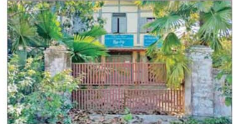
လုံခြုံရေးတပ်ဖွဲ့ဝင်များက ဗန်းမောက်မြို့ ပြန်ကြားရေးနှင့် ပြည်သူ့ဆက်ဆံရေးရုံးအား ပြန်လည်သိမ်းပိုက်ရရှိမှု မှတ်တမ်း ဓာတ်ပုံ။