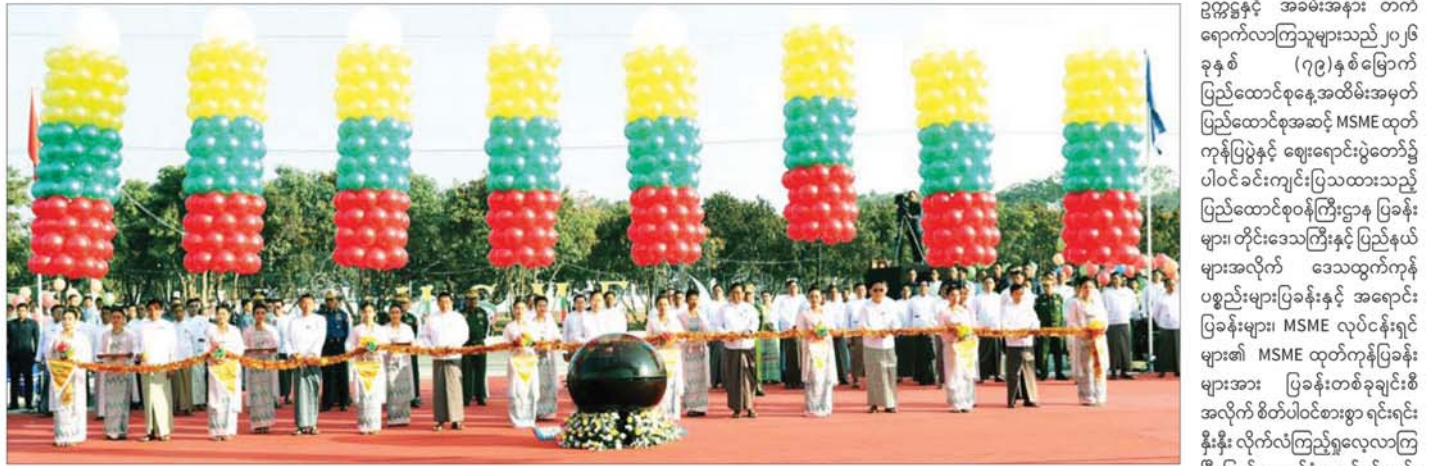
နိုင်ငံတော်လုံခြုံရေးနှင့် အေးချမ်းသာယာရေးကော်မရှင်ဒုတိယဥက္ကဋ္ဌ ဒုတိယဗိုလ်ချုပ်မှူးကြီး စိုးဝင်း၊ နိုင်ငံတော်ဝန်ကြီးချုပ် ဦးညိုစော၊ ပြည်ထောင်စုဝန်ကြီးများဖြစ်ကြသည့် ဒေါက်တာကဇော်၊ ဦးလှမိုး၊ ဒေါက်တာ ချာလီသန်း၊ ဦးချစ်ဆွေနှင့် နေပြည်တော်ကောင်စီဥက္ကဋ္ဌ ဦးသန်းထွန်းဦးတို့က ၂၀၂၆ ခုနှစ် (၇၉) နှစ်မြောက် ပြည်ထောင်စုနေ့အထိမ်းအမှတ် ပြည်ထောင်စုအဆင့် MSME ထုတ်ကုန်ပြပွဲနှင့် ဈေးရောင်းပွဲတော်အခမ်းအနားကို ဖဲကြိုးဖြတ်ဖွင့်လှစ်ပေးကြပါသည်။

ဖော်ပြတင်ဆက်မှုကို ကြည့်ရှုအားပေးကြပါသည်။ ထို့နောက် နိုင်ငံတော်ယာယီသမ္မတ နိုင်ငံတော်လုံခြုံရေးနှင့် အေးချမ်းသာယာရေးကော်မရှင်ဥက္ကဋ္ဌနှင့် အဖွဲ့ဝင်များ တက်ရောက်လာကြသူများသည် ၂၀၂၆ ခုနှစ် (၇၉)နှစ်မြောက် ပြည်ထောင်စုနေ့အထိမ်းအမှတ် ပြည်ထောင်စုအဆင့် MSME ထုတ်ကုန်ပြပွဲနှင့် ဈေးရောင်းပွဲတော်၌ ပါဝင်ခင်းကျင်းပြသထားသည့် ပြည်ထောင်စုဝန်ကြီးဌာန ပြခန်းများ၊ တိုင်းဒေသကြီးနှင့် ပြည်နယ်များအလိုက် ကုန်ပစ္စည်းများပြခန်းနှင့် အရောင်းပြခန်းများ၊ MSME လုပ်ငန်းရှင်များ၏ MSME ထုတ်ကုန်ပြခန်းများအား ပြခန်းတစ်ခုချင်းစီအလိုက် စိတ်ပါဝင်စားစွာ ရင်းရင်းနှီးနှီး လိုက်လံကြည့်ရှုလေ့လာကြပြီး ပြခန်းတာဝန်ခံများ၏ ရှင်းလင်းတင်ပြမှုများအပေါ် သိရှိလိုသည်များ ပြန်လည်မေးမြန်းဆွေးနွေးသည်။