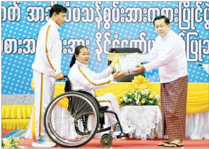
ပြည်ထောင်စုသမ္မတမြန်မာနိုင်ငံတော် ယာယီသမ္မတ နိုင်ငံတော်လုံခြုံရေးနှင့် အေးချမ်းသာယာရေး ကော်မရှင်ဥက္ကဋ္ဌ ဗိုလ်ချုပ်မှူးကြီးမင်းအောင်လှိုင် (၃၃)ကြိမ်မြောက် အာဆီယံမာန်စွမ်း အားကစားပြိုင်ပွဲ သံပြားပစ်နှစ် သံလုံးပစ်ပြိုင်ပွဲတွင် ရွှေတံဆိပ်နှစ်ခုရရှိခဲ့သည့် မထက်ထက်အေးအား ဂုဏ်ပြုဆုငွေများ ပေးအပ်ချီးမြှင့်စဉ်။

ဒေသတွင်း အားကစားပြိုင်ပွဲများ နှင့် နိုင်ငံတကာ မိတ်ဆုံပြိုင်ပွဲများ တွင် ရွှေ၊ ငွေ၊ ကြေး ဆုတံဆိပ်များ ယခုထက်ပိုမိုရရှိပြီး နိုင်ငံ့ဂုဏ်ကို အားကစားဖြင့် မြှင့်တင်နိုင်ရေး၊ လူငယ်လူရွယ်တိုင်း အားကစားကို စိတ်ပါဝင်စားပြီး လေ့လာလိုက်စား ရာမှတစ်ဆင့် ပြိုင်ပွဲဝင်နိုင်သည် အထိ လေ့ကျင့်ယှဉ်ပြိုင်နိုင်ရေးနှင့် အရှေ့တောင်အာရှအဆင့်မှသည် အာရှအဆင့်၊ ကမ္ဘာ့အဆင့်အထိ ထိုးဖောက်နိုင်အောင် ရည်မှန်းချက် ထားပြီး ဆက်လက်ကြိုးပမ်း အားထုတ်သွားကြရန် တိုက်တွန်း လိုကြောင်း ပြောကြားသည်။ ထို့နောက် (၈)ကြိမ်မြောက် ကမ္ဘာ့မိုစီနစ် ချန်ပီယံရရှိပြိုင်ပွဲ၊ (၁၆)ကြိမ်မြောက် ကမ္ဘာ့ကာယဗလ နှင့် ကာယကြံ့ခိုင်မှု အားကစား ပြိုင်ပွဲ၊ (၃၃)ကြိမ်မြောက် အရှေ့တောင်အာရှ အားကစား ပြိုင်ပွဲနှင့် (၁၃)ကြိမ်မြောက် အာဆီယံမာန်စွမ်း အားကစား ပြိုင်ပွဲတို့တွင် နိုင်ငံ့ဂုဏ်ထောင်ဆု သည့် အားကစားသမားမောင်မယ် များအား နိုင်ငံတော်မှ ဂုဏ်ပြု ချီးမြှင့်ပွဲအခမ်းအနားကို ကျင်းပ ပြုလုပ်ရာ နိုင်ငံတော်ယာယီ သမ္မတ နိုင်ငံတော်လုံခြုံရေးနှင့် အေးချမ်းသာယာရေး ကော်မရှင် ဥက္ကဋ္ဌက (၈)ကြိမ်မြောက် ကမ္ဘာ့မိုစီနစ် ချန်ပီယံရရှိပြိုင်ပွဲ တွင် ရွှေတံဆိပ်နှစ်ခုရရှိခဲ့ကြ သည့် မမေဟန်နီအောင်လွင်နှင့် မနင်းသက်ဝ၊ စာမျက်နှာ ၁၀ သို့ ။