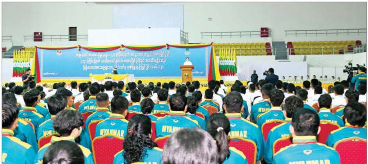
ပြည်ထောင်စုသမ္မတမြန်မာနိုင်ငံတော် ယာယီသမ္မတ နိုင်ငံတော်လုံခြုံရေးနှင့် အေးချမ်းသာယာရေးကော်မရှင် ဥက္ကဋ္ဌ ဗိုလ်ချုပ်မှူးကြီးမင်းအောင်လှိုင် ကမ္ဘာ့အဆင့်အားကစားပြိုင်ပွဲများ၊ (၃၃)ကြိမ်မြောက် အရှေ့တောင်အာရှအားကစားပြိုင်ပွဲနှင့် (၁၃) ကြိမ်မြောက် အာဆီယံမသန်စွမ်း အားကစားပြိုင်ပွဲများတွင် ဆုတံဆိပ်များရရှိခဲ့သည့် မြန်မာအားကစားအဖွဲ့များအား နိုင်ငံတော်မှဂုဏ်ပြုဆု ချီးမြှင့်ခြင်းအခမ်းအနားတွင် အမှာစကားပြောကြားစဉ်။

နေပြည်တော် ဖေဖော်ဝါရီ ၇ ၂၀၂၅ ခုနှစ်အတွင်း အင်ဒိုနီးရှား နိုင်ငံ၌ ကျင်းပခဲ့သည့် (၈)ကြိမ်မြောက် ကမ္ဘာ့ဗိုလ်ချုပ်ချန်ပီယံရှစ် ပြိုင်ပွဲ၊ (၁၆)ကြိမ်မြောက် ကမ္ဘာ့ကာယဗလနှင့် ကာယကြံ့ခိုင်မှု အားကစားပြိုင်ပွဲ၊ ထိုင်းနိုင်ငံ၌ ကျင်းပသည့် (၃၃)ကြိမ်မြောက် အရှေ့တောင်အာရှ အားကစားပြိုင်ပွဲနှင့် ၂၀၂၆ ခုနှစ် ဇန်နဝါရီလအတွင်း ထိုင်းနိုင်ငံ၌ ကျင်းပပြုလုပ်ခဲ့သည့် (၁၃)ကြိမ်မြောက် အာဆီယံမသန်စွမ်း အားကစားပြိုင်ပွဲတို့တွင် နိုင်ငံ့ဂုဏ်ဆောင်ခဲ့သည့် အားကစားသမား မောင်မယ်များအား နိုင်ငံတော်မှဂုဏ်ပြုဆုချီးမြှင့်ပွဲအခမ်းအနားကို ယနေ့နံနက်ပိုင်းတွင် နေပြည်တော်ရှိ ဝဏ္ဏသိဒ္ဓိအားကစားရုံ(A)၌ ကျင်းပရာ ပြည်ထောင်စုသမ္မတ မြန်မာနိုင်ငံတော် ယာယီသမ္မတနိုင်ငံတော်လုံခြုံရေးနှင့် အေးချမ်းသာယာရေးကော်မရှင် ဥက္ကဋ္ဌ ဗိုလ်ချုပ်မှူးကြီး မင်းအောင်လှိုင် တက်ရောက် အမှာစကားပြောကြားပြီး ဂုဏ်ပြုဆုငွေများ ပေးအပ်ချီးမြှင့်သည်။