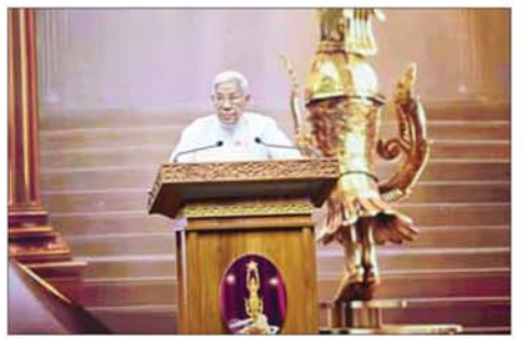
မြန်မာနိုင်ငံရုပ်ရှင်အစည်းအရုံးဥက္ကဋ္ဌ အကယ်ဒမီများရှင် ဦးကြည်စိုးထွန်း ဝမ်းမြောက်စကား ပြောကြားစဉ်။