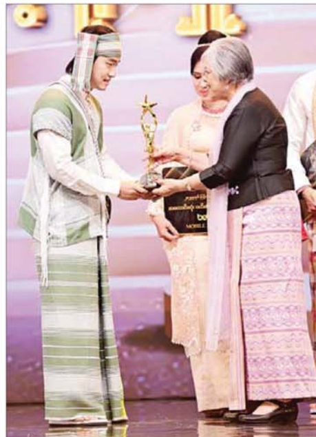
အကောင်းဆုံးဝတ်စားဆင်ယင်မှုဆု (အမျိုးသားအငယ်တန်း) ရရှိသည့် ကောင်းမြတ်စံ ဆုလက်ခံရယူစဉ်။