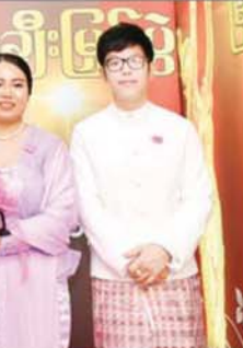
အကယ်ဒမီ သီလ

ရုပ်ရှင်လုပ်သက်ကလည်း အနည်းဆုံး အနစ် ၅၀ ရှိပြီး ဆုတစ်ခုခုလည်း ရဖူးသူဖြစ်ရပါမယ်။ ဆုမရခဲ့လည်း ရုပ်ရှင်အကျိုးအတွက် တကယ်လုပ်ဆောင်တဲ့ သူမျိုးဖြစ်ရမယ်။ အဲဒီလို သတ်မှတ်ပြီး ဒီဆုကို ပေးတာပါ။ အသက်ကြီးတိုင်း ပေးတာမဟုတ်ပါဘူး။ ဖြစ်နိုင်ရင် အကယ်ဒမီ ဆုပေးဖြစ်ရမယ်။ အလင်္ကာကျော်စွာ ပဲဖြစ်ဖြစ် ဆုတစ်ခုခုတော့ ရတဲ့သူမျိုး။ အသက်(၈၀) ကျော်တဲ့သူမျိုးကို ပေးတာဖြစ်ပါတယ်။ ဒီဆု ပေးရတဲ့အကြောင်းကို ပရိသတ်လည်း သိစေချင်လို့ ပြောပြခြင်းဖြစ်ပါတယ်။ ရုပ်ရှင်တစ်သက်တာဆု ရရှိတဲ့သူတွေ အတွက်လည်း ဝမ်းသာမိပါတယ်။