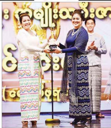
“မောင်မိဖုရား” ဇာတ်ကားဖြင့် အကောင်းဆုံး အမျိုးသမီးဇာတ်ပို့ဆုရရှိသည့် ဒိုင်နင်းဝေ ဆုလက်ခံရယူစဉ်။