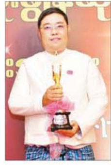
အကယ်ဒမီ ဩရသ