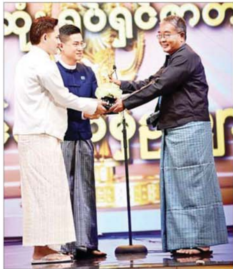
“ပန်းမြိုင်လယ်မှ ဥယျာဉ်မှူး” ဇာတ်ကားဖြင့် အကောင်းဆုံး ရုပ်ရှင်ဇာတ်ကားဆုရရှိသည့် Hein Film Production မှ တာဝန်ရှိသူများ ဆုလက်ခံရယူစဉ်။