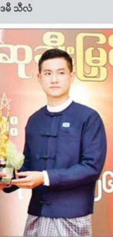
Hein Film Production

ကြိုးစားအားထုတ်မှုတွေ အရ ထင်လာခဲ့ပါပြီ။ ဆုပေးဖို့ ကိုယ့်နာမည်ကို ကြေညာတဲ့အချိန်မှာ ရင်ခုန်ပြီး ပြောစရာစကားတောင် ရှာမတွေ့ခဲ့ပါဘူး။ ပရိသတ်တွေကလည်း အစောကတည်းက ခန့်မှန်းပေးခဲ့ကြပါတယ်။ ပရိသတ်တွေအတွက်လည်း ဝမ်းသာမိပါတယ်။ နောက်ထပ်လည်း အနုပညာနဲ့ ပတ်သက်ပြီး အများကြီး ကြိုးစားသွားမှာပါ။ ဒီဇာတ်ကားက အမျှော်လင့်ဆုံးဇာတ်ကားတစ်ကားပါ။ အကယ်ဒမီဆု ရရှိအောင်အထိ ကြိုးပြည့်စုံတဲ့ ဇာတ်ညွှန်းတစ်ခု ဖြစ်ခဲ့တဲ့အတွက် ဂုဏ်ယူမိပါတယ်။ ပရိသတ်တွေနဲ့ တာဝန်ရှိသူတွေ အားလုံးကို ကျေးဇူးတင်ရှိပါတယ်။