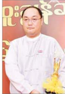
အကယ်ဒမီ ခွန်