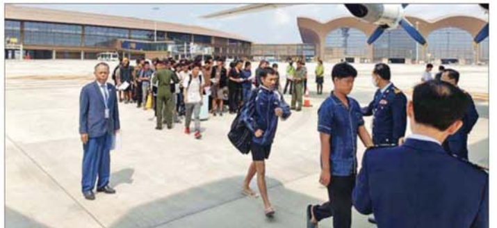
အွန်လိုင်းလိမ်လည်လောင်းကစားမှုများတွင် ပါဝင်ပတ်သက်သူ မြန်မာနိုင်ငံသားများ မြန်မာ့လေကြောင်းလိုင်း(MAI)နှင့် တပ်မတော်လေယာဉ်များဖြင့် ကမ္ဘောဒီးယားနိုင်ငံမှ ပြန်လည်ထွက်ခွာလာစဉ်။

မြန်မာနိုင်ငံတော်အစိုးရအနေဖြင့် ကမ္ဘောဒီးယားနိုင်ငံဆိုင်ရာ မြန်မာသံရုံးသို့ ရောက်ရှိနေသည့် မြန်မာနိုင်ငံသားများအား မြန်မာ့လေကြောင်းလိုင်း (MAI) နှင့် တပ်မတော်လေယာဉ်များဖြင့် အသီးသီးပြန်လည်ခေါ်ဆောင်ရောက်ရှိခဲ့ရာ ယနေ့အထိ မြန်မာနိုင်ငံသား ၁၀၈၆ ဦး ပြန်လည်ရောက်ရှိခဲ့ပြီးဖြစ်ကြောင်း သိရသည်။ ယနေ့တွင် ရန်ကုန်မြို့သို့ရောက်ရှိလာသည့် မြန်မာနိုင်ငံသားများအား မင်္ဂလာဒုံခရိုင်/မြို့နယ် တာဝန်ရှိသူများနှင့် ဌာနဆိုင်ရာတာဝန်ရှိသူများက တွေ့ဆုံ၍ စားသောက်ဖွယ်ရာများ ပေးအပ်ပြီး ရန်ကုန်တိုင်းဒေသကြီးအစိုးရအဖွဲ့ကစီစဉ်ပေးသည့် မော်တော်ယာဉ်များဖြင့် ရန်ကုန်မြို့ရှိ စုရပ်နေရာသို့ ပို့ဆောင်ပေးခဲ့ကြောင်း သိရသည်။ အဆိုပါ ကမ္ဘောဒီးယားနိုင်ငံမှ ပြန်လည်ရောက်ရှိလာသည့် မြန်မာနိုင်ငံသားများအား သက်ဆိုင်ရာတာဝန်ရှိသူများက လိုအပ်သည့်ကိုယ်ရေးအချက်