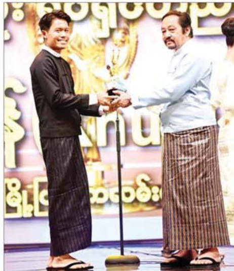
“မြို့ပြထဲက လမ်းမ”ဇာတ်ကားဖြင့် အကောင်းဆုံး ရုပ်ရှင်တည်းဖြတ်ဆုရရှိသည့် အကယ်ဒမီ ခွန် ဆုလက်ခံရယူစဉ်။

★ စာမျက်နှာ ၅ မှ ယခုနှစ်တွင်လည်း မြန်မာနိုင်ငံ ရုပ်ရှင်အစည်းအရုံးက ဖွဲ့စည်း ထားရှိသည့် ဆုရွေးချယ်ရေး အဖွဲ့ဝင်များက ရွေးချယ်ပေးကြ သည့်ဆုများကို မကြာမီ ချီးမြှင့် ပေးသွားမည်ဖြစ်ကြောင်း၊ ယခုနှစ် တွင် ထူးချွန်ဆုရရှိသည့် အနုပညာ ရှင်များအနေဖြင့် အနုပညာ လုပ်ငန်းများကို ဆက်လက် အောင်မြင်တိုးတက်စေရန်အတွက် အင်အားများ ပိုမိုရရှိပြီး မိမိတို့၏ အနုပညာအလုပ်များကို ပိုမို အားထုတ် ကြိုးပမ်းသွားကြမည် ဟု ယုံကြည်မျှော်လင့်ပါကြောင်း။ အလားတူ ထူးချွန်ဆုမရရှိသေး သည့် အနုပညာရှင်များအနေဖြင့် လည်း လာမည့်နှစ်ကာလများတွင် မိမိတို့၏အနုပညာစွမ်းပကားများ ကို မြှင့်တင်ပြီး ထူးချွန်ဆုများ ဆွတ်ခူးနိုင်ကြပါစေဟု ဆန္ဒဖြူ တိုက်တွန်းလိုကြောင်း၊ အထူး မေတ္တာရပ်ခံလိုသည့်မှာ မြန်မာ့ လေ့စရိုက်များ မမှားမိနဲ့၊ မပျောက်ပျက်စေရန် တိုင်းတစ်ပါး