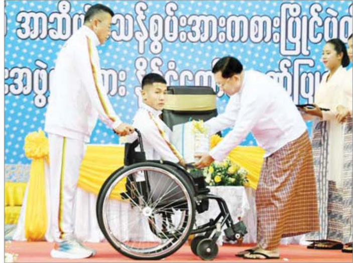
ပြည်ထောင်စုသမ္မတမြန်မာနိုင်ငံတော် ယာယီသမ္မတ နိုင်ငံတော်လုံခြုံရေးနှင့် အေးချမ်းသာယာရေး ကော်မရှင်ဥက္ကဋ္ဌ ဗိုလ်ချုပ်မှူးကြီးမင်းအောင်လှိုင် (၃၃)ကြိမ်မြောက် အာဆီယံမာန်စွမ်း အားကစားပြိုင်ပွဲ ရေကူးအားကစားနည်းတွင် မိတာ ၂၀၀ အလွတ်ကူး၊ မိတာ ၅၀ ရင်ပေါင်တန်းကူး၊ မိတာ ၅၀ အလွတ်ကူး၊ မိတာ ၁၀၀ အလွတ်ကူးပြိုင်ပွဲ လေးမျိုးလုံး၌ ရွှေတံဆိပ်လေးဆုရရှိသည့် မောင်ညီညီလင်းထက်အား ဂုဏ်ပြုဆုငွေများ ပေးအပ်ချီးမြှင့်စဉ်။