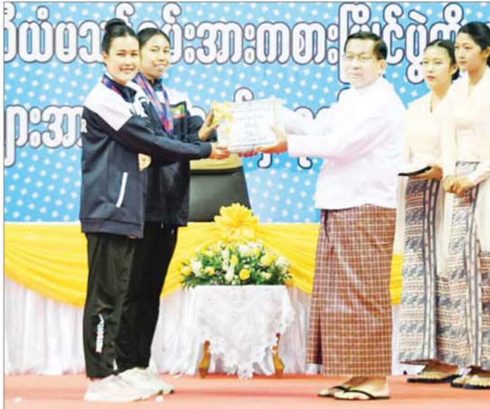
ပြည်ထောင်စုသမ္မတမြန်မာနိုင်ငံတော် ယာယီသမ္မတ နိုင်ငံတော်လုံခြုံရေးနှင့် အေးချမ်းသာယာရေးကော်မရှင် ဥက္ကဋ္ဌ ဗိုလ်ချုပ်မှူးကြီးမင်းအောင်လှိုင် (၈)ကြိမ်မြောက် ကမ္ဘာ့ဗိုလ်ချုပ်ချန်ပီယံရှစ်ပြိုင်ပွဲတွင် ရွှေတံဆိပ်နှစ်ဆုရရှိခဲ့ကြသည့် မမေန်နီအောင်လွင်နှင့် မနင်းသက်ဝေတို့အား ဂုဏ်ပြုဆုငွေများပေးအပ်ချီးမြှင့်စဉ်။

တစ်ဖက်ပြိုင်ဘက် အသင်းနှင့် အစွမ်းအစသိပ်မကွာဘဲ တန်းတူယှဉ်ပြိုင်နိုင်သော်လည်း အနိုင်မရရှိခဲ့ခြင်းသည် မည်သည့်အတွက်ကြောင့် ဆိုသည့်အားနည်းချက်ကို ရှာဖွေပြီး ဆက်လက်ဆောင်ရွက်သွားကြမည်ဆိုပါက ယခုထက်အောင်မြင်မှုများ ပိုရနိုင်လိမ့်မည်ဟု သုံးသပ်မိပါကြောင်း။