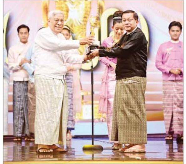
ပြည်ထောင်စုသမ္မတမြန်မာနိုင်ငံတော် ယာယီသမ္မတ နိုင်ငံတော်လုံခြုံရေးနှင့် အေးချမ်းသာယာရေးကော်မရှင်ဥက္ကဋ္ဌ ဗိုလ်ချုပ်မှူးကြီးမင်းအောင်လှိုင် ရုပ်ရှင်တစ်သက်တာ ထူးချွန်ဆုရရှိသည့် ဒါရိုက်တာ အကယ်ဒမီ ဦးကြည်စိုးထွန်းအား ဆုပေးအပ်ချီးမြှင့်စဉ်။

စီရင်ရေးကဏ္ဍများတွင် ဒီမိုကရေစီနှင့် လိုက်လျောညီထွေဖြစ်မည့် အင်စတီကျူးရှင်းများ ပြန်လည် ပေါ်ပေါက်လာတော့မည်ဖြစ်ကြောင်း၊ ရွေးကောက်ပွဲကြီး အောင်မြင်အောင် ဝိုင်းဝန်းကူညီ ပါဝင်ဆောင်ရွက်ပေးခဲ့ကြ