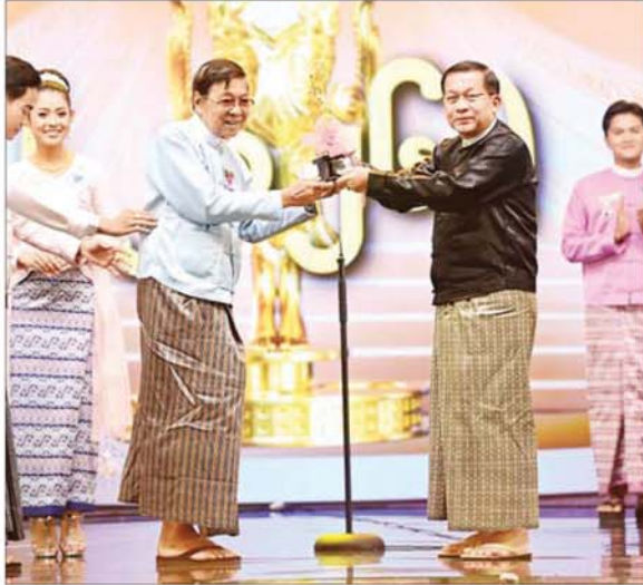
ပြည်ထောင်စုသမ္မတမြန်မာနိုင်ငံတော် ယာယီသမ္မတ နိုင်ငံတော်လုံခြုံရေးနှင့် အေးချမ်းသာယာရေးကော်မရှင်ဥက္ကဋ္ဌ ဗိုလ်ချုပ်မှူးကြီးမင်းအောင်လှိုင် ရုပ်ရှင်တစ်သက်တာ ထူးချွန်ဆုရရှိသည့် ဦးဌေးအောင်(ဆွေဗမာ)အား ဆုပေးအပ်ချီးမြှင့်စဉ်။

မိမိတို့ မြန်မာနိုင်ငံတွင်ရှိသည့် ယဉ်ကျေးမှုအမွေအနှစ်များသည် ကမ္ဘာ့နိုင်ငံအသီးသီးတွင် ရှိသည့် ယဉ်ကျေးမှုအမွေအနှစ်များကဲ့သို့ ထူးခြားလေးနက်သည့် ဝိသေသနှင့် အဓိပ္ပာယ်များရှိနေကြောင်း၊ ရုပ်ရှင်လောကသားအားလုံးသည် ရှေးရှေးဘိုးဘွားဘီဘင်တို့ ထားရှိခဲ့သည့် တန်ဖိုးမဖြတ်နိုင်သော နိုင်ငံ၏ ယဉ်ကျေးမှုအမွေအနှစ်များကို နောင်လာနောက်သားမျိုးဆက်သစ် သားစဉ်မြေးဆက်အထိ လက်ဆင့်ကမ်းသယ်ဆောင်ပေးနိုင်စွမ်းရှိကြသည့် အနုပညာရှင်များ ဖြစ်ကြကြောင်း၊ ထို့ကြောင့် ကျွန်တော်တို့၏ ခြပ်ရုံ၊ ခြပ်မဲ့ ယဉ်ကျေးမှုအမွေအနှစ်အားလုံးကို လူသားအားလုံးနှင့် သက်ဆိုင်သည့် ကမ္ဘာ့ယဉ်ကျေးမှုအမွေအနှစ်များအဖြစ် ထိန်းသိမ်းကာကွယ်ပြီး တန်ဖိုးထားလုပ်ဆောင်ပေးကြရန် အလေးအနက် တိုက်တွန်းပြောကြားလိုကြောင်း။