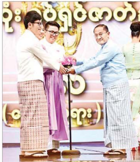
“မောင်မိဖုရား”ဇာတ်ကားဖြင့် အကောင်းဆုံးရုပ်ရှင်ဇာတ်ညွှန်းဆုရရှိသည့် သီလံ ဆုလက်ခံရယူစဉ်။