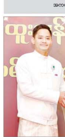
Hein Film Production

အခုလို အကယ်ဒမီဆုကို ရရှိခဲ့တဲ့အတွက် အင်မတန် ကျေနပ်မိပါတယ်။ မောင်နှမအဖွဲ့ဝင်များက