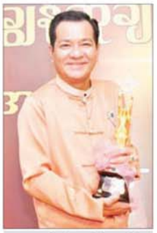
အကယ်ဒမီ နေမျိုးအောင်