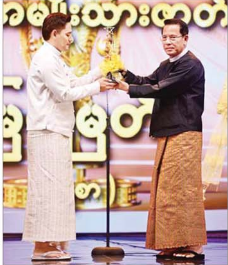
ပြည်ထောင်စုဝန်ကြီးဦးမောင်မောင်အုန်း “မြေစာ”ဇာတ်ကားဖြင့် အကောင်းဆုံးအမျိုးသားဇာတ်ဆောင်ဆုရရှိသည့် အကယ်ဒမီမြင့်မြတ်အား ဆုပေးအပ်ချီးမြှင့်စဉ်။

ပကတိအခြေအနေကို မျက်နှာမူကြရပါကြောင်း၊ လက်တွေ့မကျသည့် ဆွဲဆောင်စည်းရုံးမှုများကို အများအကြိုက် လှုံ့ဆော်နှိုးဆွပေး၍မရဘဲသို့ မိမိတို့၏ စိတ်ဆန္ဒများကို ရှေ့တန်းတင်၍ စာမျက်နှာ ၅ သို့ ★