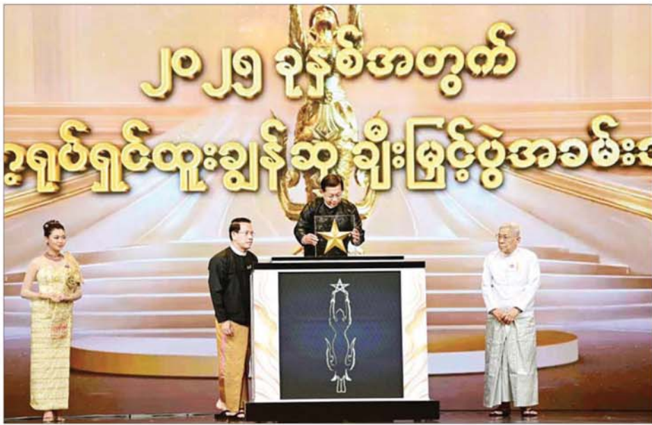
ပြည်ထောင်စုသမ္မတမြန်မာနိုင်ငံတော် ယာယီသမ္မတ နိုင်ငံတော်လုံခြုံရေးနှင့် အေးချမ်းသာယာရေးကော်မရှင်ဥက္ကဋ္ဌ ဗိုလ်ချုပ်မှူးကြီး မင်းအောင်လှိုင် ဒစ်ဂျစ်တယ်စက်လုပ်ငန်းပေါ်တွင် အကယ်ဒမီကြယ်စင်ရုပ်ကို စိုက်ထူ၍ ၂၀၂၅ ခုနှစ်အတွက် မြန်မာ့ရုပ်ရှင်ထူးချွန်ဆု ချီးမြှင့်ပွဲ အခမ်းအနားကို ဖွင့်လှစ်ပေးစဉ်။

သည် ဖွံ့ဖြိုးတိုးတက်မှုများသည် ကြောင်း၊ ရုပ်ပိုင်းဆိုင်ရာ ဖွံ့ဖြိုး တွင် စောင့်ထိန်းအပ်သည့် စရိုက် ပြီးပြည့်စုံမှုမရှိဘူးဟု ဆိုနိုင်ပါ တိုးတက်မှုများ၏ နောက်ကွယ် လက္ခဏာများ ပျက်စီးခြင်း၊ လူမျိုး