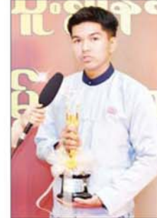
အကယ်ဒမီ ဟန်ထူးဇင်