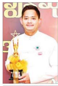
အကယ်ဒမီ မြင့်မြတ်

အတွက် ဝမ်းသာပီတိဖြစ်မိပါ တယ်။ ဒီဆုက ကျွန်တော့်အတွက် ဒုတိယမြောက်ဆုလို့ ပြောလို့ရပါ တယ်။ ဒါကြောင့် အတိုင်းမသိ ပျော်ရွှင်နေမိပါတယ်။ ဒီကားကို အနုပညာရှင်တွေအားလုံး ကြီးစား ပြီး ရိုက်ခဲ့တာ ဖြစ်ပါတယ်။ ဒီဇာတ်ကားရိုက်တုန်းကလည်း အခက်အခဲတွေ အများကြီးရှိခဲ့ပါ တယ်။ ဒီနှစ်မှာ ဇာတ်ကားကောင်း တွေ အများကြီးပါဝင်ပြီး ပြိုင်ဆိုင် မှု ပြင်းထန်တယ်လို့ ပြောလို့ရပါ တယ်။ ဒီကြားထဲက ဒီဆုကို ရရှိခဲ့ တဲ့အတွက် ရှေ့ဆက်ပြီး အကောင်းဆုံးကြီးစားသွားပါမယ်။ အခုက ထပ်ဆင့်အကယ်ဒမီ ဖြစ် သွားတဲ့အတွက် အနုပညာအလုပ် ကို ပိုပြီးကြိုးစားဖို့ လိုသွားပါပြီ။ ကျွန်တော့်ရဲ့ အနုပညာကို အခုလို အကယ်ဒမီဆုကို ရရှိခဲ့တာ ဖြစ်ပါတယ်။ အကယ်ဒမီ နေမျိုးအောင် (အကောင်းဆုံး အမျိုးသားဇာတ်ပို့ဆု) အကယ်ဒမီဆုကို ဆွတ်ခူးရရှိတဲ့ စံစားချက်က ဘာနဲ့မှ ဖော်ပြလို့ မရပါဘူး။ အင်မတန် ဝမ်းသာမိပါ တယ်။ ကျွန်တော့်ရဲ့ အနုပညာ သက်တမ်းက အနှစ် ၃၀ ရှိပါပြီ။ အခုတော့ ကြိုးစားမှုတွေ အရ ထင်ခဲ့ပြီလို့ ပြောလို့ရပါပြီ။ အခမ်း အနားကို အနုပညာရှင်တွေနဲ့ အတူ ရင်ခွန်ခွဲအတွက် တက် ရောက်ခဲ့ခြင်းဖြစ်ပါတယ်။ ဒါပေ မဲ့ ကျွန်တော် ဆုရတယ်လို့ ကြေညာလိုက်တဲ့အချိန်မှာ ပြော