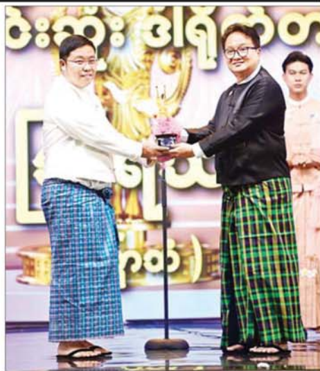
“မြောသံ” ဇာတ်ကားဖြင့် အကောင်းဆုံး ရုပ်ရှင်ဒါရိုက်တာဆုရရှိသည့် အကယ်ဒမီ ဩရာ ဆုလက်ခံရယူစဉ်။