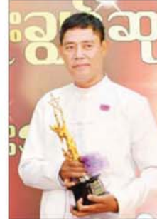
အကယ်ဒမီ သားကျော်