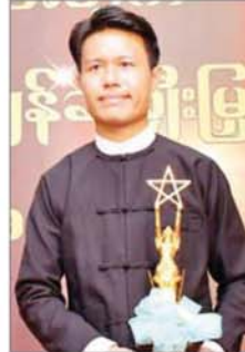
အကယ်ဒမီ သီလ