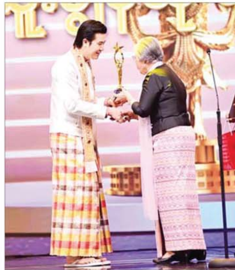
အကောင်းဆုံးဝတ်စားဆင်ယင်မှုဆု (အမျိုးသားအကြီးတန်း) ရရှိသည့် အကယ်ဒမီနေတိုး ဆုလက်ခံရယူစဉ်။

ဒီတာဝန်အရေးသုံးပါးသည် အလိုအပ်ဆုံးနှင့် အဖြစ်သင့်ဆုံး အမျိုးသားရေး ရည်မှန်းချက်၊ အမျိုးသားရေး တာဝန်များပင် ဖြစ်ပါကြောင်း။ ယနေ့အချိန်တွင် နိုင်ငံတော်အစိုးရသည် ဒီတာဝန်အရေးသုံးပါးကို အရင်းမှတည်ထားပြီး နိုင်ငံရေး၊ စီးပွားရေး၊ လူမှုရေး ဦးတည်ချက်များ ချမှတ်ဆောင်ရွက်လျက်ရှိသည့်အတွက် မြန်မာနိုင်ငံသားအားလုံးက တစ်သွေးတစ်သားတည်းသော စည်းလုံးညီညွတ်သည့် အမျိုးသားရေးစိတ်ဓာတ်များဖြင့် နိုင်ငံတော်ကြီးအေးချမ်းသာယာရန်နှင့် ဖွံ့ဖြိုးတိုးတက်ရန်အတွက် အတူတကွလက်တွဲ အကောင်အထည်ဖော်ပေးကြရန်လည်း ထပ်မံတိုက်တွန်းပြောကြားလိုပါကြောင်း။ မကြာမီအချိန်တွင် ၂၀၂၅ ခုနှစ်အတွက် မြန်မာ့ရုပ်ရှင်ထူးချွန်ဆု ရရှိကြသူများကို ဖွင့်ဖောက်ကြေညာပြီး ဆုများချီးမြှင့်ပေးအပ်မည်ဖြစ်ကြောင်း၊ ၂၀၂၅ ခုနှစ်အတွင်း မြန်မာ့ရုပ်ရှင်ဇာတ်ကား ၇၂ ကား ရုံတင်ပြသနိုင်ခဲ့ပြီး ယင်းဇာတ်ကားများအနက်မှ ထူးချွန်သည့်အနုပညာရှင်၊ အတတ်ပညာရှင်များကို အဆင့်ဆင့်စိစစ်အကဲဖြတ်ကာ ဆုများ ပေးအပ်ချီးမြှင့်မည်ဖြစ်ကြောင်း၊ ယခုကဲ့သို့ မြန်မာ ရုပ်ရှင်ဇာတ်ကားများကို ယခင်နှစ်များထက် ပိုမိုရုံတင်ပြသနိုင်ခဲ့ခြင်းသည် ရုပ်ရှင်လောကပုံမှန် ပြန်လည်သက်ဝင်လှုပ်ရှားနိုင်ခဲ့ကြောင်း ပြသခြင်းဖြစ်သည့်အတွက် ရုပ်ရှင်အစည်းအရုံးနှင့် သက်ဆိုင်ရာ အဖွဲ့အစည်းများ၊ အနုပညာရှင်များ အားလုံးကို အထူးပင်ကျေးဇူးတင်ရှိပါကြောင်း။ မိမိအနေဖြင့် နှစ်စဉ်တိုက်တွန်းပြောကြားခဲ့သည့် စကားတစ်ခွန်းကို ယခုနှစ်တွင်လည်း ပြန်လည်တိုက်တွန်းပြောကြားလိုကြောင်း၊ နိုင်ငံတော်အစိုးရအနေဖြင့် စာပေ၊ ရုပ်ရှင်၊ ဂီတ၊ သဘာဝ စသည့် နယ်ပယ်ကဏ္ဍ အသီးသီးတွင် ဖွံ့ဖြိုးတိုးတက်လာရန် အတွက် ဖြစ်သင့်ဖြစ်ထိုက်သည့် အားပေးကူညီမှုများကို လုပ်ဆောင်ပေးခဲ့