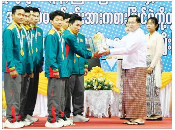
ပြည်ထောင်စုသမ္မတမြန်မာနိုင်ငံတော် ယာယီသမ္မတ နိုင်ငံတော်လုံခြုံရေးနှင့် အေးချမ်းသာယာရေး ကော်မရှင်ဥက္ကဋ္ဌ ဗိုလ်ချုပ်မှူးကြီးမင်းအောင်လှိုင် (၃၃)ကြိမ်မြောက် အရှေ့တောင်အာရှအားကစားပြိုင်ပွဲ ခြင်းလုံးအားကစားနည်းတွင် အမျိုးသားအသင်းလိုက် Event-3 ပြိုင်ပွဲတွင် ရွှေတံဆိပ်တစ်ခု ရရှိခဲ့သည့် အမျိုးသားအသင်းအား ဂုဏ်ပြုဆုငွေများ ပေးအပ်ချီးမြှင့်စဉ်။

ဝန်ကြီးဌာနနှင့် သက်ဆိုင်ရာ အားကစားအဖွဲ့ချုပ်များက တာဝန် ယူဆောင်ရွက်ရမည့် အပိုင်းများ ကို သေချာစွာခွဲခြားသိမြင်ပြီး နိုင်ငံတော်ကပြည့်ဆည်း တာဝန်ယူ ဆောင်ရွက်ပေးရမည့် အပိုင်းကို လည်း အချိန်မီတင်ပြသွားကြရန် လိုအပ်ကြောင်း။ ထို့ပြင် ပြည်တွင်း၌ ကျင်းပ သည့် အားကစားပြိုင်ပွဲများတွင် လူငယ်မျိုးဆက်သစ် အားကစား သမားများ စဉ်ဆက်မပြတ် ထွက်ပေါ်ရေး၊ နည်းပြများ၊ ခိုင်၊ ဂျူရီများကို ခေတ်နှင့်အညီ Update ဖြစ်သည့် သင်တန်းများ တက်ရောက်နိုင်ရေး၊ မြန်မာနိုင်ငံ အားကစားအဖွဲ့ချုပ်များကလည်း အရှေ့တောင်အာရှ အားကစား အဖွဲ့ချုပ်အပါအဝင် နိုင်ငံတကာ အားကစား အဖွဲ့အစည်းများတွင် သက်ဆိုင်ရာကဏ္ဍအလိုက် ဝင်ဆံ့ နိုင်ရေးကိုလည်း စဉ်ဆက်မပြတ် ကြိုးပမ်း ဆောင်ရွက်ကြရန်