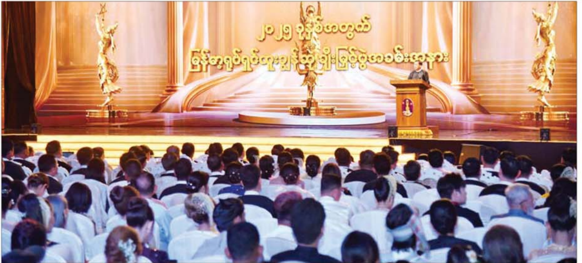
ပြည်ထောင်စုသမ္မတမြန်မာနိုင်ငံတော် ယာယီသမ္မတ နိုင်ငံတော်လုံခြုံရေးနှင့် အေးချမ်းသာယာရေးကော်မရှင်ဥက္ကဋ္ဌ ဗိုလ်ချုပ်မှူးကြီးမင်းအောင်လှိုင် ၂၀၂၅ ခုနှစ်အတွက် မြန်မာ့ရုပ်ရှင်ထူးချွန်ဆု ချီးမြှင့်ပွဲအခမ်းအနားတွင် အမှာစကားပြောကြားစဉ်။

ရုပ်ရှင်အနုပညာသည် နိုင်ငံ တစ်နိုင်ငံ ဖွံ့ဖြိုးတိုးတက်ရေး အတွက် အလွန်အရေးပါသည့် အခြေခံ အင်အားတစ်ရပ်ပင်ဖြစ် ကြောင်း၊ နိုင်ငံနှင့်ပြည်သူများ၏ အတွေးအခေါ်ပိုင်း၊ စိတ်ဓာတ်ပိုင်း နှင့် တန်ဖိုးထားမှုများကို ထင်ဟပ် ဖော်ပြနိုင်သည့် အနုပညာဖြစ် သည့်အတွက် ရုပ်ရှင်အနုပညာ ကဏ္ဍနှင့် ယဉ်ကျေးမှုကဏ္ဍ မပါဝင်