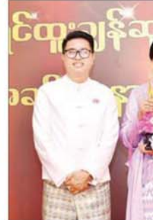
အကယ်ဒမီ သီလ