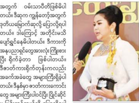
အကယ်ဒမီ ခိုင်နှင်းဝေ