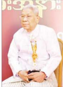
ဒါရိုက်တာ အကယ်ဒမီ ဦးကြည်စိုးထွန်း