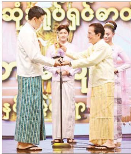
“နှင်းပွင့်စေရာ”ဇာတ်ကားဖြင့် အကောင်းဆုံး ရုပ်ရှင်ဇာတ်ပုံဆု ရရှိသည့် သားကျော် ဆုလက်ခံရယူစဉ်။