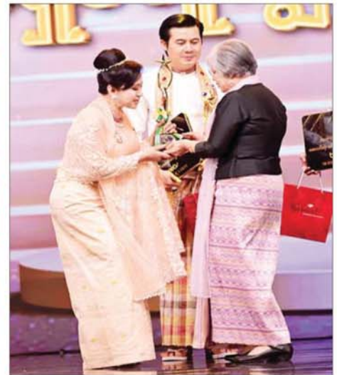
အကောင်းဆုံးဝတ်စားဆင်ယင်မှုဆု (အမျိုးသမီးအကြီးတန်း) ရရှိသည့် အကယ်ဒမီမေသန်းနု ဆုလက်ခံရယူစဉ်။