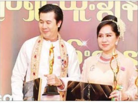
အကယ်ဒမီနေတိုး၊ အကယ်ဒမီမေသန်းနု

အကယ်ဒမီ ဆုပေးပွဲကြီးမှာ အားလုံးက အလှဆုံး ဝတ်ဆင်လာ ကြပါတယ်။ ဒီလို အလှဆုံးတွေ ကြားထဲမှာ အကောင်းဆုံးဝတ်စား ဆင်ယင်မှုဆု ရရှိတဲ့အတွက် ဝမ်းသာမိပါတယ်။ အမှတ်ပေး ရွေးချယ်ပေးတဲ့ ခိုင်တွေနဲ့ အားပေး ကြတဲ့ ပရိသတ်တွေအားလုံးကို ကျေးဇူးတင်ရှိပါတယ်။ ဒီလို ဆုရရှိ အောင် ပိုင်းဝန်းပွဲပေးကြတဲ့ ဒီနိုင်နာတွေ၊ လှပအောင် ပြင်ဆင် ပေးကြတဲ့ သူတွေကိုလည်း အထူး ကျေးဇူးတင်ရှိပါတယ်။ ဖက်ရှင်ဆု ရရှိဖို့က ကိုယ်ဝတ်တဲ့ ဝတ်စုံက မြန်မာ့ရိုးရာယဉ်ကျေး မှုနဲ့ ကိုက်ညီပြီး ဆန်းသစ်ဖို့ လိုအပ်ပါတယ်။ ဒီအချက်တွေနဲ့ ကိုက်ညီအောင် ဝတ်ဆင်ပြီး အခမ်းအနားကို တက်ရောက် လာခြင်းဖြစ်ပါတယ်။ ရိုးရာဝတ်စုံ တွေ အားလုံးက တန်ဖိုးရှိကြပါ တယ်။ ကောင်းမြတ်စံ၊ အကယ်ဒမီ ရတနာဦး (အကောင်းဆုံး ဝတ်စားဆင်ယင်မှုဆု) ပထမဦးဆုံး ဝတ်စုံချုပ်ပေးတဲ့ ဒီနိုင်နာတွေအားလုံးကို ကျေးဇူး တင်ရှိပါတယ်။ ရိုးရာဝတ်စုံနဲ့ ရရှိတဲ့အတွက် ဂုဏ်ယူမိပါတယ်။ ဒီဆုကို မျှော်လင့်ခဲ့ပေမယ့် ရရှိမယ်လို့တော့ မထင်ခဲ့ပါဘူး။ အမှတ်ပေးရွေးချယ် ပေးခဲ့ကြတဲ့ ခိုင်တွေနဲ့ ပရိသတ်တွေကို ကျေးဇူးတင်ပါတယ်လို့ ပြောချင်ပါ တယ်။ အကောင်းဆုံးဝတ်စား ဆင်ယင်မှုဆု ရရှိတဲ့အတွက် ပျော် ရွှင်မိနေတယ်ဆိုရင် ဒီနေ့ပွဲမှာ အကယ်ဒမီဆုတွေကို ဆွတ်ခူးရရှိ ကြတဲ့ သူတွေဆိုင်ရင် ဘယ်လောက် တောင်းရင်ခွန်စိတ်လှုပ်ရှားနေမလဲ ဆိုတာတွေးပြီး ပျော်ရွှင်နေမိပါ တယ်။ အကယ်ဒမီ ဩရသ (အကောင်းဆုံးဒါရိုက်တာဆု) အခုလို အကယ်ဒမီဆုကို ရရှိတဲ့