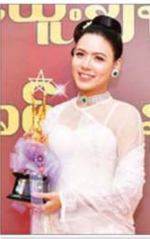
အကယ်ဒမီ ရတနာဦး