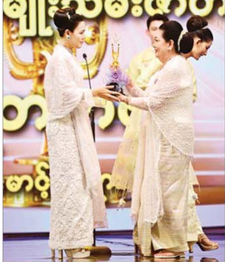
“မောင်မိဖုရား” ဇာတ်ကားဖြင့် အကောင်းဆုံးအမျိုးသမီးဇာတ်ဆောင်ဆုရရှိသည့် ရတနာခို ဆုလက်ခံရလှစဉ်။