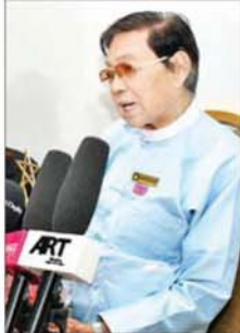
အကယ်ဒမီ ဦးဌေးအောင် (ဆွေဗမာ)

ဒီရုပ်ရှင်တစ်သက်တာဆုကို အသက်(၈၀)ကျော်မှ ပေးပါတယ်။