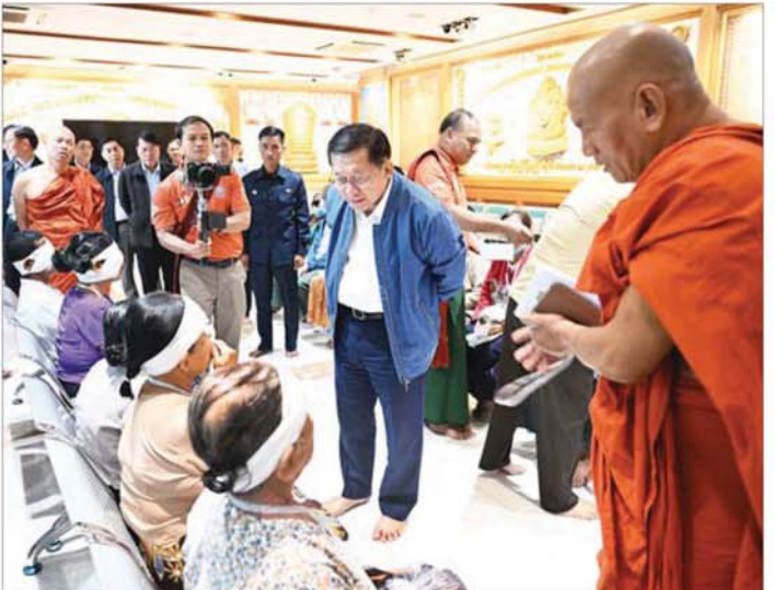
ပြည်ထောင်စုသမ္မတမြန်မာနိုင်ငံတော် ယာယီသမ္မတ နိုင်ငံတော်လုံခြုံရေးနှင့် အေးချမ်းသာယာရေးကော်မရှင်ဥက္ကဋ္ဌ ဗိုလ်ချုပ်မှူးကြီး မင်းအောင်လှိုင် သီတဂူစက္ခုဒါနဆေးရုံတွင် ခွဲစိတ်ကုသမှုခံယူထားသည့် ပြည်သူများအား မျက်မှန်များတပ်ဆင်ပေးပြီး မျက်စိခွဲစိတ်ကုသမှုခံယူထားသည့် ပြည်သူများအား ရင်းရင်းနှီးနှီးနွှတ်ဆက်အားပေးစကားပြောကြားစဉ်။

မန္တလေးနိုင်ငံခြားဘာသာတက္ကသိုလ်တွင် (ဂျေ)နှစ်မြောက် ပြည်ထောင်စုနေ့အကြို ပဒေသာကပွဲကျင်းပ မန္တလေး မေဖော်ဝါရီ ၆ မန္တလေး အောင်မြေသာစံမြို့နယ်ရှိ မန္တလေးနိုင်ငံခြားဘာသာတက္ကသိုလ်တွင် (ဂျေ)နှစ်မြောက် ပြည်ထောင်စုနေ့အကြို ပဒေသာကပွဲကို မေဖော်ဝါရီ ၅ ရက် မွန်လွိုင်က အဆိုပါ တက္ကသိုလ်