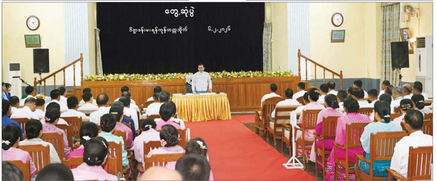
ပြည်ထောင်စုသမ္မတမြန်မာနိုင်ငံတော် ယာယီသမ္မတ နိုင်ငံတော်လုံခြုံရေးနှင့် အေးချမ်းသာယာရေးကော်မရှင်ဥက္ကဋ္ဌ ဗိုလ်ချုပ်မှူးကြီး မင်းအောင်လှိုင် ဝန်ကြီးဌာနအသီးသီးရှိ တက္ကသိုလ်၊ ဒီဂရီကောလိပ်များမှ ပါမောက္ခချုပ်များ၊ ကျောင်းအုပ်ကြီးများ၊ ပါမောက္ခများနှင့် ဆရာ၊ ဆရာမများအား တွေ့ဆုံအမှာစကားပြောကြားစဉ်။