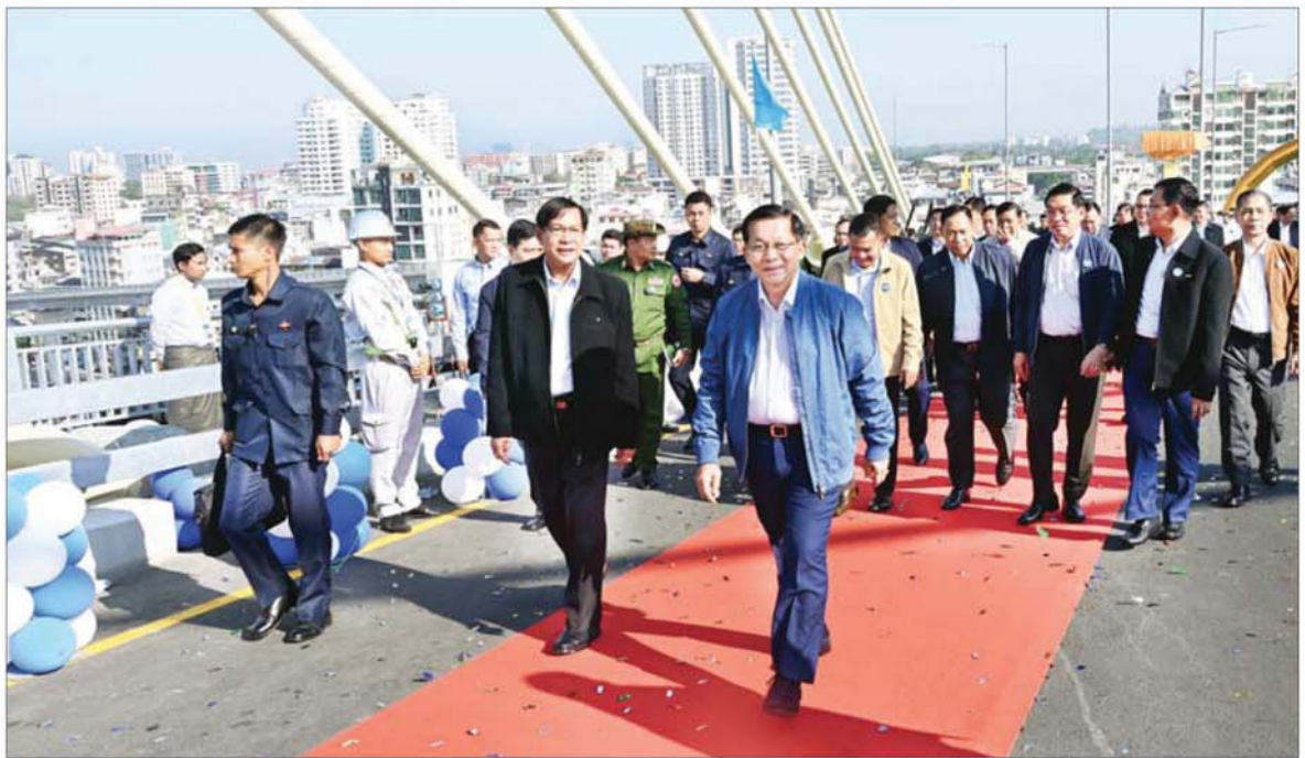
ပြည်ထောင်စုသမ္မတမြန်မာနိုင်ငံတော် ယာယီသမ္မတ နိုင်ငံတော်လုံခြုံရေးနှင့် အေးချမ်းသာယာရေးကော်မရှင်ဥက္ကဋ္ဌ ဗိုလ်ချုပ်မှူးကြီး မင်းအောင်လှိုင် မြန်မာ - ကိုရီးယား ချစ်ကြည် ရေး(ဒလ)တံတားပေါ်၌ ဖြတ်သန်းကြည့်ရှုစဉ်။

နေပြည်တော် ဖေဖော်ဝါရီ ၆ ရန်ကုန်တိုင်း ဒေသကြီး အတွင်းရှိ မြန်မာ - ကိုရီးယား ချစ်ကြည်ရေး(ဒလ)တံတား ဖွင့်ပွဲ အခမ်းအနားကို ယနေ့နံနက် ပိုင်းတွင် ကျင်းပပြုလုပ်ရာ ပြည်ထောင်စုသမ္မတ မြန်မာနိုင်ငံ တော် ယာယီသမ္မတ နိုင်ငံတော် လုံခြုံရေးနှင့် အေးချမ်းသာယာရေး ကော်မရှင်ဥက္ကဋ္ဌ ဗိုလ်ချုပ်မှူးကြီး မင်းအောင်လှိုင် တက်ရောက် ချီးမြှင့်သည်။ အဆိုပါအခမ်းအနားသို့ နိုင်ငံ တော်ယာယီသမ္မတ နိုင်ငံတော် လုံခြုံရေးနှင့် အေးချမ်းသာယာ ရေးကော်မရှင် ဥက္ကဋ္ဌနှင့်အတူ ကော်မရှင်အဖွဲ့ဝင်၊ နိုင်ငံတော် ဝန်ကြီးချုပ် ဦးညိုစော၊ ကော်မရှင် အတွင်းရေးမှူး ဗိုလ်ချုပ်ကြီး ရဲဝင်းဦး၊ ကော်မရှင်အဖွဲ့ဝင်များ၊ ပြည်ထောင်စုဝန်ကြီးများ၊ ရန်ကုန် တိုင်းဒေသကြီး ဝန်ကြီးချုပ်၊ ကာကွယ်ရေးဦးစီးချုပ်ရုံးမှ အဆင့် မြင့် တပ်မတော်အရာရှိကြီးများ၊ ရန်ကုန်တိုင်းစစ်ဌာနချုပ် တိုင်းမှူး၊ စာမျက်နှာ ၄ သို့ ✦