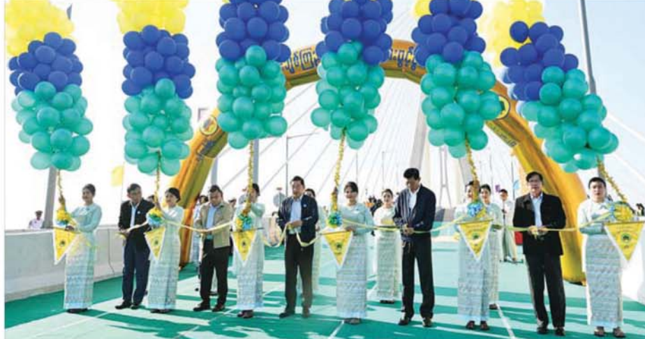
ကော်မရှင်အဖွဲ့ဝင် နိုင်ငံတော်ဝန်ကြီးချုပ် ဦးညိုစော၊ ကော်မရှင်အတွင်းရေးမှူး ဗိုလ်ချုပ်ကြီး ရဲဝင်းဦး၊ ပြည်ထောင်စုဝန်ကြီး ဦးမြထွန်းဦး၊ ပြည်ထောင်စုဝန်ကြီး ဦးမျိုးသန့်နှင့် ရန်ကုန်တိုင်းဒေသကြီးဝန်ကြီးချုပ် ဦးစိုးသိန်းတို့က မြန်မာ - ကိုရီးယား ချစ်ကြည်ရေး (ဒလ)တံတားကို ဖြိုဖျက်ဖြင့်ဖွင့်လှစ်ပေးကြစဉ်။

ဆောက်ခဲ့ပြီး တံတားကြီး အပြီးသတ်ဆောင်ရွက်နိုင်ရန် မြန်မာ ကျပ်ငွေ ၂၃ ဒသမ ၀၆၂ ဘီလီယံ ကျပ်ကိုလည်း နိုင်ငံတော်ဘဏ္ဍာ ရန်ပုံငွေမှ ထပ်မံဖြည့်စွက်ပြီး ပံ့ပိုးဆောင်ရွက်ပေးခဲ့သဖြင့် ယခုကဲ့သို့ အောင်မြင်စွာဖွင့်လှစ်နိုင်ခဲ့ခြင်းလည်းဖြစ်ကြောင်း။ ဆက်သွယ်သွားလာနိုင်ယခုအခါတွင် နိုင်ငံတော်အနေဖြင့် ရန်ကုန်တိုင်းဒေသကြီးအပါအဝင် တိုင်းဒေသကြီး/ပြည်နယ် အသီးသီးတွင်ရှိသည့် တိုင်းရင်းသားပြည်သူများ၏ လူမှုစီးပွားဘဝ ဖွံ့ဖြိုးတိုးတက်စေရန်အခြေခံအဆောက်အအုံဖြစ်သည့် ပို့ဆောင်ဆက်သွယ်ရေး ကဏ္ဍ