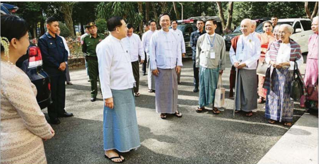
ပြည်ထောင်စုသမ္မတမြန်မာနိုင်ငံတော် ယာယီသမ္မတ နိုင်ငံတော်လုံခြုံရေးနှင့် အေးချမ်းသာယာရေးကော်မရှင်ဥက္ကဋ္ဌ ဗိုလ်ချုပ်မှူးကြီး မင်းအောင်လှိုင် တွေ့ဆုံပွဲ အခမ်းအနားသို့ တက်ရောက်လာကြသူများအား ရင်းရင်းနှီးနှီးနှုတ်ဆက်စဉ်။

ဆရာ၊ ဆရာမများအနေဖြင့် ကျောင်းနှင့်လုပ်ငန်း ခွင်တွင် စိတ်ချမ်းသာစွာ နေထိုင်နိုင်ရန်သာ စာပေ သင်ကြားမှုများကို စိတ်ပါဝင်စားပြီး ပိုမိုဆောင်ရွက် နိုင်မည်ဖြစ်ကြောင်း၊ ကလေးငယ်များ အတတ်ပညာ များရှိစေရေး နိုင်ငံတော်အရင်းနှီးမြှုပ်နှံငွေထည့်သွင်း ဖြည့်ဆည်းဆောင်ရွက်ပေးလျက်ရှိကြောင်း၊ မိမိတို့ အနေဖြင့် အနာဂတ်အတွက် ပညာရေးသစ်ပင် များကို ပြုစုစိုက်ပျိုးနိုင်ရန်လိုကြောင်း၊ သို့မှသာ ငယ်စဉ်ကတည်းက ပညာရေးအခြေခံကောင်း ခဲ့သည့် ကလေးငယ်များသည် မြင့်မားသည့် အတန်းပညာများကို သင်ယူနိုင်မည်ဖြစ် ကြောင်း။