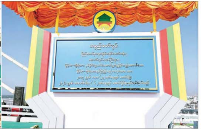
ပြည်ထောင်စုသမ္မတမြန်မာနိုင်ငံတော် ယာယီသမ္မတ နိုင်ငံတော်လုံခြုံရေးနှင့် အေးချမ်းသာယာရေးကော်မရှင်ဥက္ကဋ္ဌ ဗိုလ်ချုပ်မှူးကြီး မင်းအောင်လှိုင် မြန်မာ - ကိုရီးယား ချစ်ကြည်ရေး(ဒလ) တံတား ကမ္ပည်းမော်ကွန်းကို စက်ခလုတ်နှိပ် ဖွင့်လှစ်ပေးစဉ်။

စာမျက်နှာ ၄ မှ ဆက်သွယ်ထားသည့် ဝင်ပေါက် မြို့တစ်မြို့ ဖြစ်လာပြီး ဒေသ အတွင်းက ထုတ်ကုန်များကို ကုန်းလမ်းမှ အချိန်တိုအတွင်း သယ်ယူ ပို့ဆောင်နိုင်မည်ဖြစ်ကြောင်း ထို့အပြင် ဒေးဒရတ်တား မှတစ်ဆင့် ဒေးဒရပ်တိုက်လေး မြို့နှင့် ကမ်းခြေဒေသများအပါအဝင် ဧရာဝတီတိုင်းဒေသကြီး ရှိမြို့များကိုလည်း လွယ်ကူ လျင်မြန်စွာ ဆက်သွယ်သွားလာ နိုင်မည်ဖြစ်ကြောင်း၊ ရန်ကုန်မြို့ လယ်စရိယာနှင့် ကုန်းလမ်းဆက် သွယ်ရေး တိုက်ရိုက်ချိတ်ဆက် ဆောင်ရွက်နိုင်ပြီဖြစ်သဖြင့် ဒလ မြို့အပါအဝင် တံတား၊ ကော့မှူး၊ ကွမ်းခြံကုန်းမြို့များလည်း မြို့ပြ အသွင်ဆောင်ပြီး တစ်ပြိုင် တည်း ဖွံ့ဖြိုးတိုးတက်လာမည် ဖြစ်ကြောင်း။ နိုင်ငံတော်အစိုးရ အနေဖြင့် နိုင်ငံတော်၏ အမျိုးသားအကျိုး စီးပွားများ ပေါ်ထွန်းလာစေရန် မွှော်မှန်းချက်၊ ရည်မှန်းချက်များ ထားရှိပြီး မပြတ်သောသတိ၊ မလျော့သောစွမ်း၊ လုံ့လ၊ ဝီရိယ တို့ဖြင့် ကြိုးပမ်းဆောင်ရွက်လျက် ရှိကြောင်း၊ နိုင်ငံ၏အနာဂတ် ငြိမ်းချမ်းသာယာစေရန် နိုင်ငံသူ နိုင်ငံသားများ၏ဘဝ ချမ်းမြေ့ ပျော်ရွှင်စေရန် နိုင်ငံတော်အစိုးရ အနေဖြင့် ကောင်းမွန်သည့် ရည်မှန်းချက် ဦးတည်ချက်များကို ကြိုးပမ်း ပုံဖော်လျက်ရှိကြောင်း၊ မိဘပြည်သူ တိုင်းရင်းသား ညီအစ်ကိုများကလည်း နိုင်ငံတော် အစိုးရ၏ ငြိမ်းချမ်းရေး၊ ဒီမိုကရေစီ ဖက်ဒရယ် ဖွံ့ဖြိုးတိုးတက်စေရေး စသည့် လုပ်ငန်းစဉ်များအပေါ် ပိုမိုပူးပေါင်း ဆောင်ရွက်ပေး ကြရန် တိုက်တွန်းပြောကြား လိုကြောင်း။