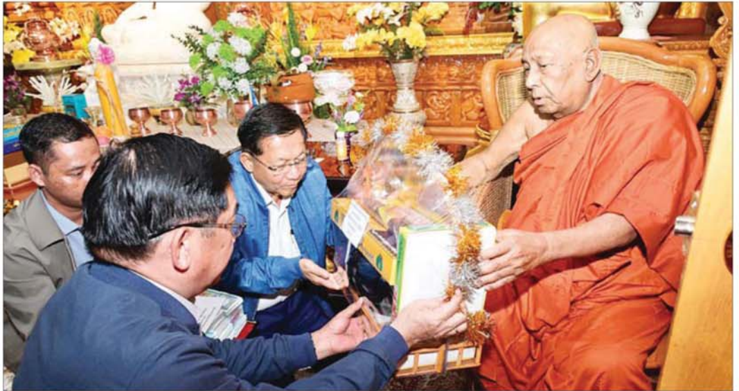
နိုင်ငံတော်ယာယီသမ္မတ နိုင်ငံတော်လုံခြုံရေးနှင့် အေးချမ်းသာယာရေးကော်မရှင်ဥက္ကဋ္ဌ ဗိုလ်ချုပ်မှူးကြီး မင်းအောင်လှိုင် နိုင်ငံတော်ဩဝါဒါစရိယ သောဠသမရွှေကျင်သာသနာပိုင်ဆရာတော်၊ သီတဂူကမ္ဘာ့ဗုဒ္ဓတက္ကသိုလ်များ၏ အဓိပတိ အဘိဓဇမဟာရဋ္ဌဂုရု အဘိဓဇအဂ္ဂမဟာသဒ္ဓမ္မဇောတိက ဒေါက်တာဘဒ္ဒန္တဉာဏိဿရအား လှူဖွယ်ဝတ္ထုပစ္စည်းများ ဆက်ကပ်လှူဒါန်းခဲ့ပါသည်။

နေပြည်တော် မေဖော်ဝါရီ ၆ ပြည်ထောင်စုသမ္မတမြန်မာနိုင်ငံတော် ယာယီသမ္မတ နိုင်ငံတော်လုံခြုံရေးနှင့် အေးချမ်းသာယာရေးကော်မရှင်ဥက္ကဋ္ဌ ဗိုလ်ချုပ်မှူးကြီး မင်းအောင်လှိုင်သည် ကော်မရှင်အဖွဲ့ဝင် နိုင်ငံတော်ဝန်ကြီးချုပ် ဦးညိုစော၊ ကော်မရှင်အတွင်းရေးမှူး ဗိုလ်ချုပ်ကြီး ရဲဝင်းဦးနှင့် ခရီးစဉ်တွင်လိုက်ပါလာသည့် အဖွဲ့ဝင်များ၊ ရန်ကုန်တိုင်းဒေသကြီးဝန်ကြီးချုပ်၊ ရန်ကုန်တိုင်းစစ်ဌာနချုပ်တိုင်းမှူး၊ ရန်ကုန်မြို့တော်ဝန်နှင့် တာဝန်ရှိသူများလိုက်ပါ၍ ယနေ့နံနက်ပိုင်းတွင် ရန်ကုန်တိုင်းဒေသကြီး မြောက်ခရိုင်မြို့နယ်ရှိ သီတဂူ အပြည်ပြည်ဆိုင်ရာ သာသနာပြုအဖွဲ့ သီတဂူ ကမ္ဘာ့ဗုဒ္ဓတက္ကသိုလ်၊ သီတဂူစက္ခုဒါနဆေးရုံသို့ သွားရောက်၍ နိုင်ငံတော်ဩဝါဒါစရိယ သောဠသမရွှေကျင်သာသနာပိုင်ဆရာတော်၊ သီတဂူကမ္ဘာ့ဗုဒ္ဓတက္ကသိုလ်များ၏ အဓိပတိ အဘိဓဇမဟာရဋ္ဌဂုရု အဘိဓဇ အဂ္ဂမဟာသဒ္ဓမ္မဇောတိက ဒေါက်တာဘဒ္ဒန္တဉာဏိဿရအား ဖူးမြော်ကြည်ညိုသည်။