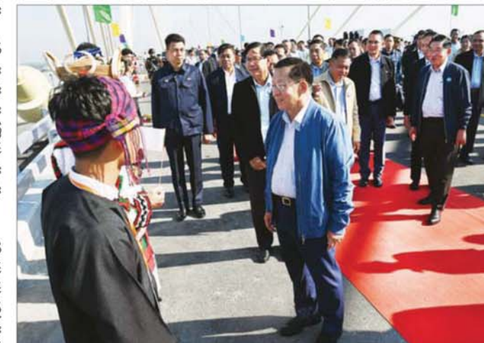
ပြည်ထောင်စုသမ္မတမြန်မာနိုင်ငံတော် ယာယီသမ္မတ နိုင်ငံတော်လုံခြုံရေးနှင့် အေးချမ်းသာယာရေး ကော်မရှင်ဥက္ကဋ္ဌ ဗိုလ်ချုပ်မှူးကြီး မင်းအောင်လှိုင် အခမ်းအနားသို့ တက်ရောက်လာကြသည့် တိုင်းရင်း သား လူငယ်မောင်မယ်များအား ရင်းရင်းနှီးနှီး နှုတ်ဆက်စဉ်။

နှင့် ၆ ပေ၊ ၆ လက်မအကျယ် လူသွားလမ်း နှစ်ဖက်ပါရှိပြီး တံတားနှင့်ပြုတန်ချိန်မှာ ယာဉ် တစ်စီးချင်းအလိုက် ၇၅ တန်ဖြစ် ကြောင်း၊ တံတားဘေးတစ်ဖက်စီ တွင် ရန်ကုန်မြို့မှ ဒလမြို့သို့ သောက်သုံးရေပေးစေနိုင်ရေး ၁ ပေ၊ ၆ လက်မ အချင်းရှိ ရေပိုက် များကိုလည်း တပ်ဆင်ဆောင်ရွက် ထားကြောင်း။ တံတား တည်ဆောက်ရေး ကာလအတွင်း ကိုစမ်း-၁၉ ရောဂါ ဖြစ်ပွားခြင်းနှင့် နှောင့်နှေး တွေ့ကြုံခဲ့ရသည့် အခက်အခဲများ ကို နိုင်ငံတော်အစိုးရအနေဖြင့် တံတားတည်ဆောက်ရေး လုပ်ငန်း များ ပြီးစီးနိုင်ရန်အတွက် နိုင်ငံတော် ဘဏ္ဍာငွေများကို ဖြည့်တင်းပေးနိုင်ခဲ့ခြင်းကြောင့် လုပ်ငန်းပြီးစီးခဲ့ခြင်းဖြစ်ကြောင်း၊ ယခုမြန်မာ-ကိုရီးယား ချစ်ကြည်ရေး (ဒလ) တံတား တည်ဆောက်ပြီးစီး သွားပြီဖြစ်သည့်အတွက် ရန်ကုန် တိုင်းဒေသကြီး၊ ရန်ကုန်မြို့မှနေ ၍ ဒလ၊ တံတား၊ ကော့မှူး၊ ကွမ်းခြံ ကုန်းမြို့များနှင့် ဧရာဝတီတိုင်း ဒေသကြီးအတွင်းရှိ မြို့များကို လွယ်ကူလျင်မြန်စွာသွားလာနိုင် မည်ဖြစ်ကြောင်း၊ ဒလမြို့သည် လည်း ဧရာဝတီတိုင်းဒေသကြီး နှင့် ရန်ကုန်တိုင်းဒေသကြီးကို ဆက်သွယ်ထားသည့် ဝင်ပေါက် မြို့တစ်မြို့ ဖြစ်လာပြီး တက်စုံ၊ ကဏ္ဍခံ ဖွံ့ဖြိုးတိုးတက်လာမည် ဖြစ်ကြောင်း၊ ဒလမြို့ ဖွံ့ဖြိုး တိုးတက်လာမှုနှင့်အတူတစ်ဆက် တစ်စပ်တည်း တွဲတေး၊ ကော့မှူး၊ ကွမ်းခြံကုန်းမြို့များသည်လည်း မြို့ပြအသွင်ဆောင်ပြီး တစ်ပြိုင် တည်းဖွံ့ဖြိုးတိုးတက်လာမည်ဖြစ် ကြောင်း၊ ယခု တံတားကြီးကို တည်ဆောက် ဖွင့်လှစ်ခြင်းအား ဖြင့် ဒေသတွင်းရှိ လူမှုရေး၊ စီးပွား ရေး၊ ပညာရေး၊ ကျန်းမာရေးနှင့် သယ်ယူပို့ဆောင်ရေး စသည့် ကဏ္ဍပေါင်းစုံကို ဖွံ့ဖြိုးတိုးတက် လာစေပြီး ရန်ကုန်မြို့တော်၏ အထင်ကရပြယုဂ် (Landmark) တံတားတစ်စင်းအဖြစ် မြင်တွေ့ရ မည်ဖြစ်ကြောင်း သတင်းရရှိ သည်။