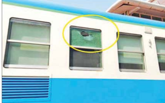
ရန်ကုန်-နေပြည်တော်လမ်းပိုင်း၌ ပြေးဆွဲလျက်ရှိသည့် ခေတ်မီလေအေးပေးစက်ပါ DEMU ရထားအား ခဲဖြင့်ပစ်ပေါက်မှုကြောင့် ပြတင်းပေါက်ပျက်စီးမှုကို တွေ့ရစဉ်။

မြန်မာ့ရထားအနေဖြင့် ရထားစီးခရီးသွားပြည်သူများ ပိုမိုစိတ်ချမ်းမြေ့စွာ သွားလာနိုင်စေရေးအတွက် ရန်ကုန်-နေပြည်တော်လမ်းပိုင်း၌ ခေတ်မီလေအေးပေးစက်ပါ DEMU တွဲဆိုင်သစ်များဖြင့် ပြေးဆွဲပေးလျက်ရှိပြီး ရန်ကုန်မြို့ပတ်လမ်းပိုင်းတွင်လည်း ရထားလမ်း အဆင့်မြှင့်တင်ပြုပြင်ပြီးဖြစ်၍ DEMU ရထားနှင့် RBE ရထားများဖြင့် ပြေးဆွဲပေးလျက်ရှိသည်။