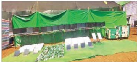
ရှမ်းပြည်နယ်(မြောက်ပိုင်း) မိုင်းရယ်မြို့နယ် ဟိုက်ပုကျေးရွာ အနီး၌ အွန်လိုင်းလိမ်လည်လောင်းကစားမှုလုပ်ငန်းများ လုပ်ကိုင် ရာတွင် အသုံးပြုသည့် ဆက်စပ်ပစ္စည်းများ သိမ်းဆည်းရမိမှု။

နိုင်ငံအနီးရုများနှင့်လည်း ပေါင်းစပ် ညှိနှိုင်း၍ အဆိုပါခုစုရိုက်မှုနှိမ်နင်း ရေးလုပ်ငန်းများကို တက်ကြွစွာ ဆက်လက် ဆောင်ရွက်လျက်ရှိ ကြောင်း သိရသည်။ သတင်းစဉ်