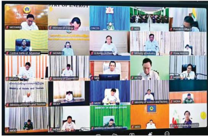
နိုင်ငံတော်လုံခြုံရေးနှင့်အေးချမ်းသာယာရေးကော်မရှင်ဥက္ကဋ္ဌ တပ်မတော်ကာကွယ်ရေးဦးစီးချုပ် ဗိုလ်ချုပ်မှူးကြီးမင်းအောင်လှိုင် နိုင်ငံတော်ကာကွယ်ရေးတက္ကသိုလ်မှ နည်းပြအရာရှိကြီးများနှင့် သင်တန်းသားအရာရှိကြီးများအား Video Conferencing ဖြင့် အမှစစကားပြောကြားစဉ်။

နိုင်ငံဝန်ထမ်းများ၏ တိုင်းချစ်ပြည်ချစ်စိတ်များကို တည်ဆောက်ပေးရန်လိုကြောင်း။