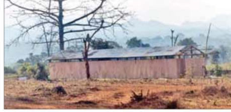
ရှမ်းပြည်နယ်(မြောက်ပိုင်း) မိုင်းရယ်မြို့နယ် ဟိုက်ပုကျေးရွာ အနီး၌ အွန်လိုင်းလိမ်လည်လောင်းကစားမှုလုပ်ငန်းများ လုပ်ကိုင် ရာတွင် အသုံးပြုရန်အတွက် ဆောက်လုပ်ဆဲအဆောက်အအုံများ သိမ်းဆည်းရမိမှု။