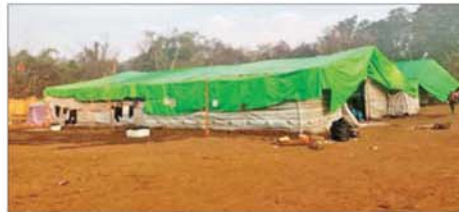
ရှမ်းပြည်နယ်(မြောက်ပိုင်း) မိုင်းရယ်မြို့နယ် ဟိုက်ပုကျေးရွာ အနီး၌ အွန်လိုင်းလိမ်လည်လောင်းကစားမှုလုပ်ငန်းများ လုပ်ကိုင် ရာတွင် အသုံးပြုသည့် အဆောက်အအုံများ သိမ်းဆည်းရမိမှု။