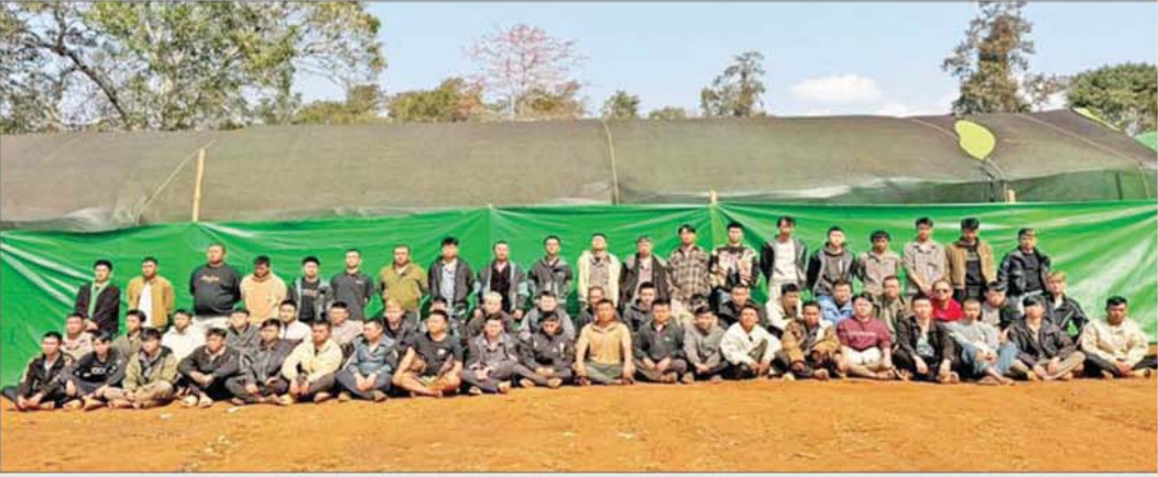
ရှမ်းပြည်နယ်(မြောက်ပိုင်း) မိုင်းရယ်မြို့နယ် ဟိုက်ပုကျေးရွာအနီး၌ အွန်လိုင်းလိမ်လည်လောင်းကစားမှုလုပ်ငန်းများ လုပ်ကိုင်နေသူများအား ဖမ်းဆီးရမိမှု။

ထိုသို့ဆောင်ရွက်လျက်ရှိရာ ရှမ်းပြည်နယ်(မြောက်ပိုင်း) မိုင်းရယ်မြို့နယ်အတွင်း အွန်လိုင်းလိမ်လည်လောင်းကစားမှုလုပ်ငန်းများ အခြေပြုလုပ်ကိုင်နေကြောင်း တာဝန်သိပြည်သူများ၏ သတင်းပေးပို့မှုအရ လုံခြုံရေးတပ်ဖွဲ့ဝင်များပါဝင်သော ပူးပေါင်းအဖွဲ့များက လိုအပ်သည့် လေကြောင်းကင်းထောက်ခြင်း၊ မြေပြင်သတင်းစုံစမ်းဖော်ထုတ်ခြင်းနှင့် နယ်မြေရှင်းလင်းခြင်းများကို ဆောင်ရွက်ခဲ့ရာ ယနေ့နံနက် ၇ နာရီခန့်တွင် မိုင်းရယ်မြို့၏ အရှေ့တောင်ဘက် ၃၅ ကီလိုမီတာခန့်အကွာ ဟိုက်ပုကျေးရွာအနီးသို့အရောက်၌ မသင်္ကာဖွယ်ရာ အဆောက်အအုံများကို တွေ့ရှိရသဖြင့် ဝင်ရောက်ရှာဖွေစစ်ဆေးခဲ့ရာ အွန်လိုင်းငွေကြေးလိမ်လည်မှုနှင့် လောင်းကစားမှုများ လုပ်ဆောင်နေသည့်နေရာဖြစ်ကြောင်း တွေ့ရှိရပြီး အွန်လိုင်းလိမ်လည်လောင်းကစားမှုများ လုပ်ကိုင်နေကြသူများဖြစ်သည့် တရုတ်နိုင်ငံသား စာမျက်နှာ ၁၅ သို့ ၂