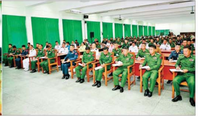
နိုင်ငံတော်လုံခြုံရေးနှင့် အေးချမ်းသာယာရေးကော်မရှင်ဥက္ကဋ္ဌ တပ်မတော်ကာကွယ်ရေးဦးစီးချုပ် ဗိုလ်ချုပ်မှူးကြီးမင်းအောင်လှိုင် နိုင်ငံတော်ကာကွယ်ရေးတက္ကသိုလ်မှ နည်းပြအရာရှိကြီးများနှင့် သင်တန်းသား အရာရှိကြီးများအား Video Conferencing ဖြင့် အမှာစကားပြောကြားစဉ်။