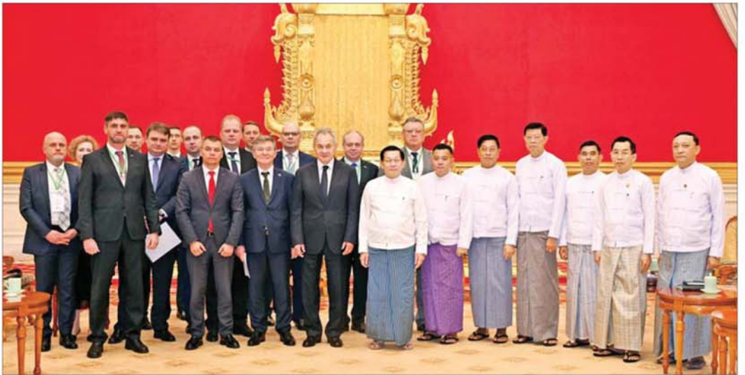
ပြည်ထောင်စုသမ္မတမြန်မာနိုင်ငံတော် ယာယီသမ္မတ နိုင်ငံတော်လုံခြုံရေးနှင့် အေးချမ်းသာယာရေးကော်မရှင်ဥက္ကဋ္ဌ ဗိုလ်ချုပ်မှူးကြီးမင်းအောင်လှိုင်နှင့် အဖွဲ့ဝင်များ ရုရှားဖက်ဒရေးရှင်းနိုင်ငံ လုံခြုံရေးကောင်စီအတွင်းရေးမှူး H.E.Mr. Sergey SHOIGU ဦးဆောင်သည့်ကိုယ်စားလှယ်အဖွဲ့နှင့်အတူ မှတ်တမ်းတင် ဓာတ်ပုံရိုက်စဉ်။

ယင်းနောက် မြန်မာနိုင်ငံတွင် ပါတီစုံဒီမိုကရေစီ အထွေထွေရွေးကောက်ပွဲ ကျင်းပပြုလုပ်ချိန်တွင် ရုရှားဖက်ဒရေးရှင်းနိုင်ငံအပါအဝင် နိုင်ငံတကာမှ ရွေးကောက်ပွဲ စောင့်ကြည့်လေ့လာရေးအဖွဲ့များ လာရောက်ခဲ့ပြီး ပြည်သူများက တက်ကြွစွာ ဆန္ဒမဲ ပေးခဲ့ကြသည်ကို မြင်တွေ့ခဲ့ရမှုနှင့် လွတ်လပ်ပြီး တရားမျှတမှုရှိသည့် ရွေးကောက်ပွဲတစ်ရပ်အဖြစ် ကျင်းပနိုင်သည်ကို သိရှိခဲ့ရသည့် အခြေအနေများ၊ မြန်မာနိုင်ငံအစိုးရအနေဖြင့် ပြည်တွင်းငြိမ်းချမ်းရေး