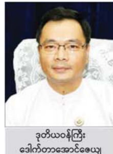
ဒုတိယဝန်ကြီး ဒေါက်တာအောင်ဇေယျ

လိုရတယ်ဆိုတဲ့ ပြကွက်တွေပါဝင်မှာဖြစ်ပါတယ်။ သိပ္ပံနှင့်နည်းပညာဝန်ကြီးဌာနအောက်ရှိ ဦးစီးဌာနတွေက ပြသတဲ့ ပြကွက်ပေါင်း ၁၉ ခုအပြင် Digital Corner ပြခန်းကိုပါ ထည့်သွင်းပြသသွားမှာ ဖြစ်ပါတယ်။ အထူးသဖြင့် AI နည်းပညာကို အသုံးပြုပြီး MSME လုပ်ငန်း ဖွံ့ဖြိုးတိုးတက်အောင် ဆောင်ရွက်လိုရတဲ့ အခြေအနေတွေကို လေ့လာလိုရမှာ ဖြစ်ပါတယ်။ Digital Corner ပြခန်းမှာလည်း ပြကွက် ၁၀ ခု ထားရှိမှာ" ဟု ပြောသည်။ ယခုနှစ် ကျင်းပသည့် ပြည်ထောင်စုအဆင့် MSME ထုတ်ကုန်ပြပွဲနှင့် ဈေးရောင်းပွဲတော်(နေပြည်တော်)တွင် သိပ္ပံနှင့်နည်းပညာဝန်ကြီးဌာနအနေဖြင့် နည်းပညာများကို အခြေပြုပြီး MSME ထုတ်ကုန်များအား ဖွံ့ဖြိုးတိုးတက်အောင် ဆောင်ရွက်နိုင်သည့် နည်းလမ်းများ၊ MSME လုပ်ငန်းများကို ချဲ့ထွင်ပြီး ပြည်တွင်း ဈေးကွက်တွင်သာမက နိုင်ငံတကာ ဈေးကွက်အထိ ထိုးဖောက်နိုင်သည့် နည်းပညာများ၊ AI နည်းပညာကို အသုံးပြုပြီး