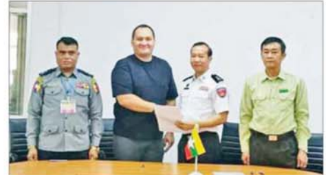
အကြောင်းအမျိုးမျိုးကြောင့် ဒုက္ခရောက်နေကြသော နိုင်ငံခြားသားများနှင့် လူကုန်ကူးခံရသည့် နိုင်ငံခြားသားများကို သက်ဆိုင်ရာနိုင်ငံများသို့ အမြန်ဆုံးပြည်ပနိုင်ငံလွှဲပြောင်းပေးနိုင်ရေး ထိရောက်စွာ ညှိနှိုင်းဆောင်ရွက်လျက်ရှိကြောင်း သိရသည်။ သတင်းစဉ်

စာတမ်းများကို စနစ်တကျ လွှဲပြောင်းပေးအပ်သည်။ နိုင်ငံတော်အနေဖြင့် Online Scam Center လုပ်ငန်းများတွင် ပါဝင်ပတ်သက် နေသူများနှင့် နောက်ကွယ်မှ ကြိုးကိုင်သော နိုင်ငံခြားသားများကို ဖော်ထုတ်ဖမ်းဆီးပြီး ထိထိရောက်ရောက် ပြင်းပြင်းထန်ထန် အရေးယူနိုင်ရေး အိမ်နီးချင်းနှင့် ဒေသတွင်းနိုင်ငံများ၊ နိုင်ငံတကာအဖွဲ့အစည်းများနှင့် တက်ကြွစွာ ပူးပေါင်းဆောင်ရွက်လျက်ရှိသည့်အပြင်