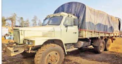
ရှမ်းပြည်နယ်(မြောက်ပိုင်း) မိုင်းရယ်မြို့နယ် ဟိုက်ပုကျေးရွာ အနီး၌ အွန်လိုင်းလိမ်လည်လောင်းကစားမှုလုပ်ငန်းများ လုပ်ကိုင် ရာတွင် အသုံးပြုသည့် မော်တော်ယာဉ်များအား သိမ်းဆည်းရမိမှု။