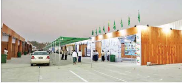
ပြည်ထောင်စုအဆင့် MSME ထုတ်ကုန်ပြပွဲနှင့် ဈေးရောင်းပွဲတော်(နေပြည်တော်)တွင် ပါဝင်ပြသရောင်းချမည့် ဈေးဆိုင်ခန်းများ ပြင်ဆင်နေမှုကို တွေ့ရစဉ်။

နည်းစဉ်တွေလည်း ပြသသွားမှာ ဖြစ်ပါတယ်။ ဒါတွေနဲ့ ပတ်သက်ပြီး နည်းပညာ တောင်းခံလာရင်လည်း မြန်ဝေပေးသွားမှာ ဖြစ်ပါတယ်။ လိုအပ်ပါက သင်တန်းဖွင့်လှစ် သင်ကြားပေးသွားမှာ ဖြစ်ပါတယ်။ ယခု MSME ပွဲတော်ကြီးမှာ တိုက်ရိုက်ချိတ်ဆက်နိုင်တဲ့ အခွင့်အလမ်းတွေ အများကြီး ရှိပါတယ်။ ဒါကြောင့် MSME ပွဲတော်ကြီးကို လာရောက်ကြည့်ရှုလေ့လာကြဖို့ လိုက်လို့က်လို့လဲ့ ဖိတ်ခေါ်ပါတယ်" ဟုပြောသည်။