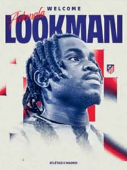
ပါပြီ။ ဒီအသင်းဟာ ကြီးကျယ်ခမ်းနားတဲ့ အသင်းတစ်သင်းပါ။ ဒီအသင်းနဲ့အတူ အောင်မြင်မှုများစွာကိုလည်း ရယူသွားမှာပါ' ဟု ပြောသည်။

အက်သလက်တိကို မက်ဒရစ်အသင်းသည် အတ္တလန္တာအသင်း ကွင်းလယ်ကစားသမား လွတ်ခမ်းနားအား ပြောင်းရွှေ့ကြေး ယူရိုသန်း ၄၀ ဖြင့် ခေါ်ယူခဲ့ကြောင်း အတည်ပြုထုတ်ပြန်ကြေညာခဲ့သည်။ အဆိုပါ ကွင်းလယ်ကစားသမားသည် အတ္တလန္တာအသင်းနှင့် အတူ ၂၀၂၀-၂၀၂၃ မှ ၂၀၂၅-၂၀၂၆ ဘောလုံးရာသီအထိ ပြိုင်ပွဲခွဲ ၁၃၇ ပွဲကစားကာ ၅၅ ရိုး သွင်းယူပြီး မြေစွမ်းပြနိုင်ခဲ့ခြင်းကြောင့် အက်သလက်တိကိုမက်ဒရစ်အသင်းက ခေါ်ယူခဲ့ခြင်းဖြစ်သည်။ အသက်(၂၈)နှစ်အရွယ်ရှိ လွတ်ခမ်းနားက *ကျွန်တော် အက်သလက်တိကိုမက်ဒရစ်အသင်းကို ရောက်ရှိခဲ့