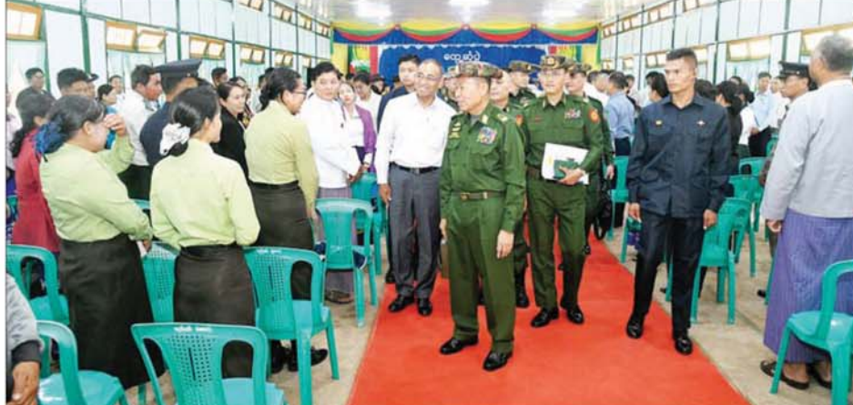
နိုင်ငံတော်လုံခြုံရေးနှင့် အေးချမ်းသာယာရေးကော်မရှင် ဒုတိယဥက္ကဋ္ဌ ဒုတိယတပ်မတော်ကာကွယ်ရေးဦးစီးချုပ် ကာကွယ်ရေးဦးစီးချုပ်(ကြည်း) ဒုတိယဝိုင်းချုပ်မှူးကြီး စိုးဝင်း ကလေးမြို့၌ မြို့နယ်အဆင့်ဌာနဆိုင်ရာတာဝန်ရှိသူများနှင့် တွေ့ဆုံပွဲအခမ်းအနားတွင် တက်ရောက်လာကြသူများအား ရင်းရင်းနှီးနှီး နှုတ်ဆက်စဉ်။

သွားမည့် အခြေအနေများကို ဦးစွာ ရှင်းလင်းပြောကြားသည်။ ဆက်လက်၍ ပြောကြားရာတွင် နိုင်ငံဝန်ထမ်းများ ဖြစ်သည့်အတွက် နိုင်ငံရေးအစိုးရများ မည်ကဲ့သို့ပင် ပြောင်းလဲသည်ဖြစ်စေ ဝန်ထမ်း ကျင့်ဝတ် သိက္ခာနှင့်အညီ ကျေပွန် စွာ တာဝန်ထမ်းဆောင်ရမည် ဖြစ်ပြီး ပြည်သူ့ဝန်ထမ်းကောင်း၊