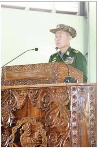
နိုင်ငံတော်လုံခြုံရေးနှင့် အေးချမ်းသာယာရေးကော်မရှင် ဒုတိယဥက္ကဋ္ဌ ဒုတိယတပ်မတော်ကာကွယ်ရေးဦးစီးချုပ် ကာကွယ်ရေးဦးစီးချုပ်(ကြည်း) ဒုတိယဗိုလ်ချုပ်မှူးကြီး စိုးဝင်း ကလေးတပ်နယ်မှ အရာရှိ၊ စစ်သည်၊ မိသားစုများအား တွေ့ဆုံအမှာစကားပြောကြားစဉ်။