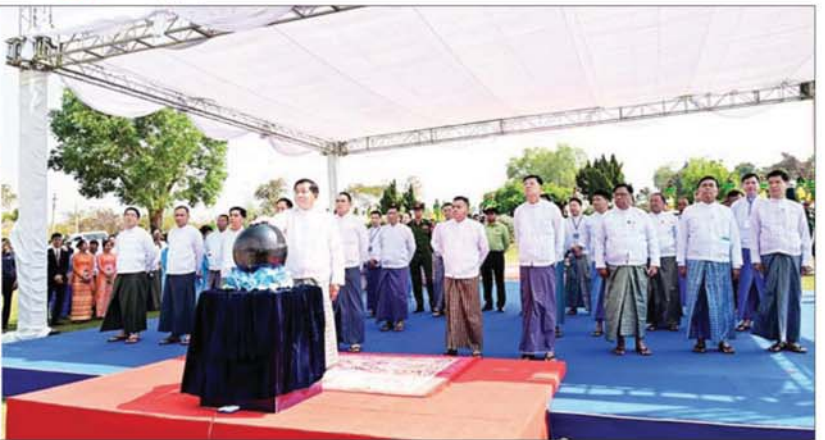
ပြည်ထောင်စုသမ္မတ မြန်မာနိုင်ငံတော်ယာယီသမ္မတ နိုင်ငံတော်လုံခြုံရေးနှင့် အေးချမ်းသာယာရေးကော်မရှင်ဥက္ကဋ္ဌ ဗိုလ်ချုပ်မှူးကြီး မင်းအောင်လှိုင် ဒစ်ဂျစ်တယ်မြန်မာနည်းပညာနီးနှောဖလှယ်ပွဲနှင့် ပြပွဲအခမ်းအနားဆိုင်းဘုတ်ကို စက်လှုပ်နှံပို့ဖွင့်လှစ်ပေးစဉ်။