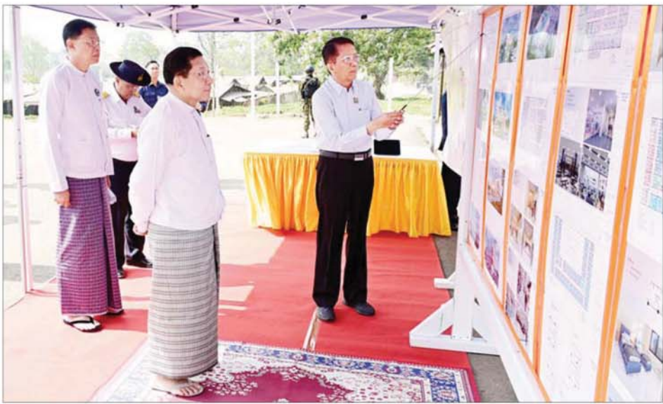
ပြည်ထောင်စုသမ္မတမြန်မာနိုင်ငံတော် ယာယီသမ္မတ နိုင်ငံတော်လုံခြုံရေးနှင့် အေးချမ်းသာယာရေးကော်မရှင်ဥက္ကဋ္ဌ ဗိုလ်ချုပ်မှူးကြီး မင်းအောင်လှိုင် ပြင်ဦးလွင်ဘူတာနယ်မြေတွင် မြို့ပြဖွံ့ဖြိုးတိုးတက်ရေးလုပ်ငန်းများ အကောင်အထည်ဖော်ဆောင်ရွက်နေမှုအခြေအနေများကို ကြည့်ရှုစစ်ဆေးရာ ဒုတိယဝန်ကြီး ဦးအောင်မြိုင်က ရှင်းလင်းတင်ပြစဉ်။

နေပြည်တော် ဖေဖော်ဝါရီ ၂၇ ပြည်ထောင်စုသမ္မတ မြန်မာနိုင်ငံတော် ယာယီသမ္မတ နိုင်ငံတော် လုံခြုံရေးနှင့် အေးချမ်းသာယာရေး ကော်မရှင်ဥက္ကဋ္ဌ ဗိုလ်ချုပ်မှူးကြီး မင်းအောင်လှိုင်သည် ကော်မရှင် အတွင်းရေးမှူး ဗိုလ်ချုပ်ကြီး ရဲဝင်းဦး၊ ခရီးစဉ်တွင် လိုက်ပါလာ သည့် အဖွဲ့ဝင်များ၊ မန္တလေးတိုင်း ဒေသကြီး ဝန်ကြီးချုပ်နှင့် တာဝန် ရှိသူတို့ လိုက်ပါ၍ ယနေ့နံနက်ပိုင်း တွင် ပြင်ဦးလွင်မြို့ မြို့ပြဖွံ့ဖြိုး တိုးတက်ရေး အကောင်အထည် ဖော်ဆောင်ရွက်နေမှု အခြေအနေ များကို လိုက်လံကြည့်ရှုစစ်ဆေး သည်။