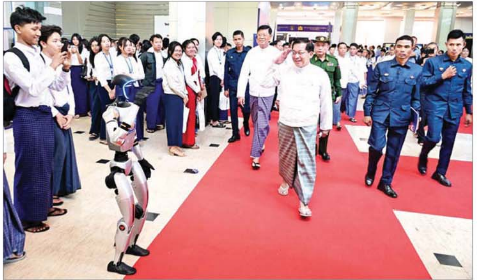
ပြည်ထောင်စုသမ္မတ မြန်မာနိုင်ငံတော်ယာယီသမ္မတ နိုင်ငံတော်လုံခြုံရေးနှင့် အေးချမ်းသာယာရေးကော်မရှင်ဥက္ကဋ္ဌ ဗိုလ်ချုပ်မှူးကြီး မင်းအောင်လှိုင် ဒစ်ဂျစ်တယ်မြန်မာနည်းပညာနိုးနှောဖလှယ်ပွဲနှင့် ပြပွဲအခမ်းအနားတွင် ပြသထားသည့် ပြခန်းများအား ကြည့်ရှုစစ်ဆေးစဉ်။

၂၀၂၆ ခုနှစ်တွင် ဉာဏ်ရည်တူ နည်းပညာသည် အရှိန်အဟုန်ဖြင့် တိုးတက်နေသောကြောင့် အာဆီယံ နိုင်ငံများအနေဖြင့် တာဝန်ယူမှု ရှိသည့် ဉာဏ်ရည်တူနည်းပညာ (Responsible AI) ကို အထူး အလေးပေး ဆောင်ရွက်နေသည် ကို တွေ့ရကြောင်း၊ အာဆီယံနိုင်ငံ အချင်းချင်း AI ဆိုင်ရာ ကျင့်ဝတ် စံနှုန်း (Ethical Guidelines) များ ကို ညှိနှိုင်းပြီး ဘေးကင်းသည့် AI အသုံးချမှုကို ဖော်ဆောင်နေသည် ကို တွေ့ရကြောင်း၊ ဒစ်ဂျစ်တယ် ဝန်ဆောင်မှုများ တိုးတက်များပြားလာ သည့်နှင့်အမျှ အွန်လိုင်းလိမ်လည် မှုများလည်း များလာကြောင်း၊ ယင်းကို တိုက်ဖျက်ရန်အတွက် အာဆီယံ နိုင်ငံများကြားတွင် သတင်းအချက်အလက်မျှဝေခြင်း ကွန်ရက်ကို အရင်ကထက်