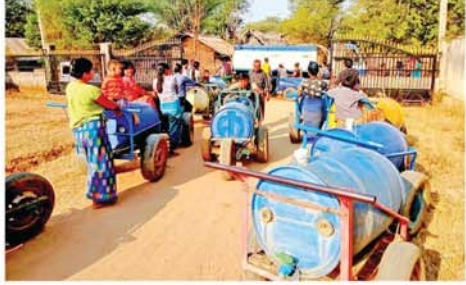
(အောက်ပုံပုံ) (၄၄၄)

ကြီးမြန်သစ်ပင် စိုက်ပျိုးလျှင် စွမ်းအင်လည်းရ ပြည်လည်းလှ ။