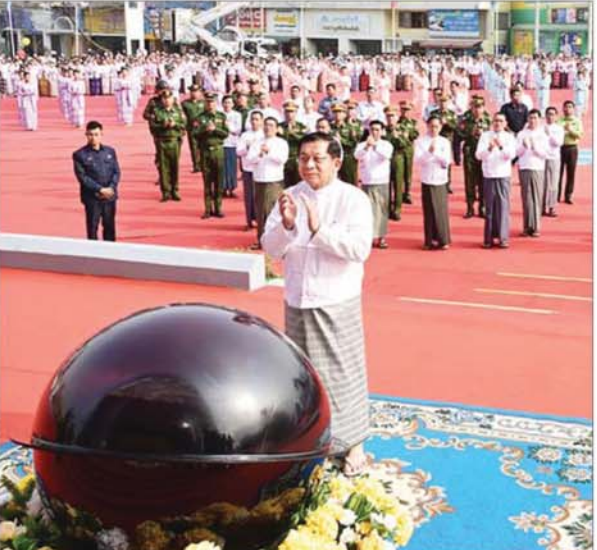
ပြည်ထောင်စုသမ္မတမြန်မာနိုင်ငံတော် ယာယီသမ္မတ နိုင်ငံတော်လုံခြုံရေးနှင့် အေးချမ်းသာယာရေးကော်မရှင်ဥက္ကဋ္ဌ ဗိုလ်ချုပ်မှူးကြီး မင်းအောင်လှိုင် သုမင်္ဂလာအဆင့်မြင့်ဈေးဆိုင်းဘုတ်အား စက်ခလုတ်နှိပ် ဖွင့်လှစ်ပေးစဉ်။