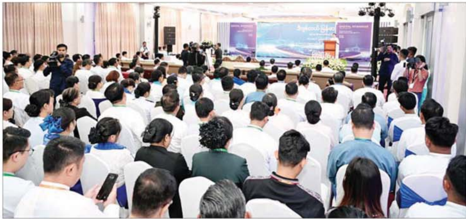
ပြည်ထောင်စုသမ္မတ မြန်မာနိုင်ငံတော်ယာယီသမ္မတ နိုင်ငံတော်လုံခြုံရေးနှင့် အေးချမ်းသာယာရေး ကော်မရှင်ဥက္ကဋ္ဌ ဗိုလ်ချုပ်မှူးကြီး မင်းအောင်လှိုင် ဒစ်ဂျစ်တယ်မြန်မာ နည်းပညာနိုးနှောဖလှယ်ပွဲနှင့် ပြပွဲအခမ်းအနားတွင် အမှာစကား ပြောကြားစဉ်။

ထို့အပြင် အာဆီယံနိုင်ငံများ အကြား နယ်စပ်ဖြတ်ကျော် ကုန်သွယ်မှုများကို ဒစ်ဂျစ်တယ် ဝန်ဆောင်မှုများဖြင့် ချောမွေ့စွာဆောင်ရွက် နိုင်ရန်၊ Artificial Intelligence (AI) ကို အကျိုးရှိစွာ အသုံးချနိုင်ရန်နှင့် AI ဆိုင်ရာ ဘေးကင်းလုံခြုံမှုကွန်ရက် များ ထူထောင်ရန်၊ ဒေသတွင်းရှိ လုပ်သားထု၏ ဒစ်ဂျစ်တယ်ဆိုင်ရာ အချက်အလက် သိရှိနားလည်မှု