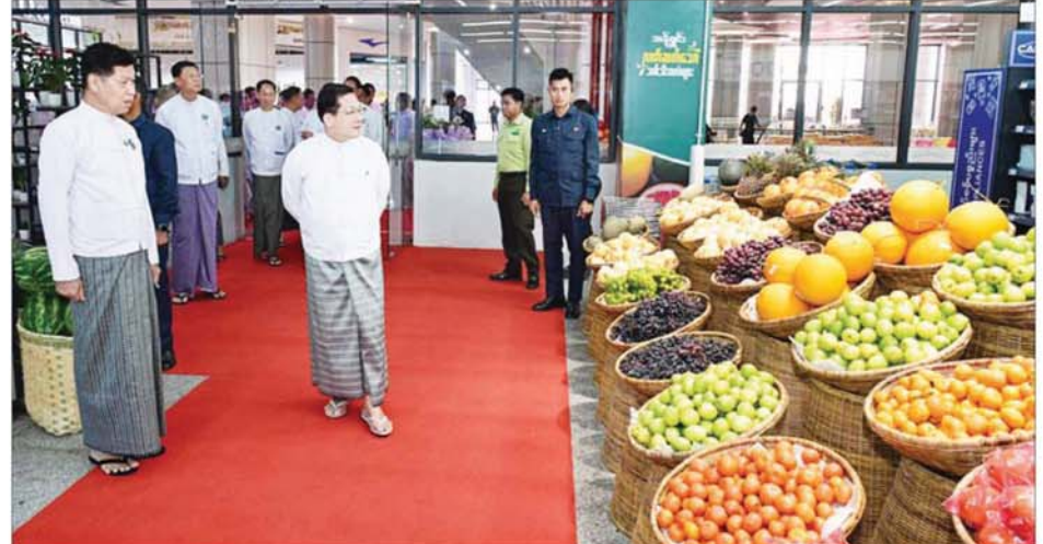
ပြည်ထောင်စုသမ္မတမြန်မာနိုင်ငံတော် ယာယီသမ္မတ နိုင်ငံတော်လုံခြုံရေးနှင့် အေးချမ်းသာယာရေးကော်မရှင်ဥက္ကဋ္ဌ ဗိုလ်ချုပ်မှူးကြီး မင်းအောင်လှိုင် သုမင်္ဂလာအဆင့်မြင့်ဈေးအတွင်း လှည့်လည်ကြည့်ရှုစဉ်။

နှိပ်ဖွင့်လှစ်ပေးသည်။ ဆက်လက်၍ အမျိုးသားယဉ်ကျေးမှုနှင့် အနုပညာတက္ကသိုလ်(မန္တလေး)နှင့် ပညာရေးဒီဂရီကောလိပ်(မန္တလေး)တို့မှကျောင်းသူလေးများက “လှပဝေဆာသုမင်္ဂလာ” တေးသီချင်းဖြင့် ကပြဖျော်ဖြေတင်ဆက်ကြသည်။ ထို့နောက် နိုင်ငံတော်ယာယီသမ္မတ နိုင်ငံတော်လုံခြုံရေးနှင့် အေးချမ်းသာယာရေး ကော်မရှင်ဥက္ကဋ္ဌနှင့် အခမ်းအနားတက်ရောက်လာကြသူများသည် စုပေါင်းမှတ်တမ်းတင်ဓာတ်ပုံရိုက်ကြသည်။ အမွှေးနံ့သာရည်များ ပက်ဖျန်းယင်းနောက် နိုင်ငံတော်ယာယီသမ္မတ နိုင်ငံတော်လုံခြုံရေးနှင့် အေးချမ်းသာယာရေး ကော်မရှင်ဥက္ကဋ္ဌနှင့် ကော်မရှင်အတွင်းရေးမှူး၊ ပြည်ထောင်စုဝန်ကြီးများ၊ မန္တလေးတိုင်းဒေသကြီးဝန်ကြီးချုပ်နှင့် အခမ်းအနားတက်ရောက်လာကြသူများက ပြင်ဦးလွင်မြို့ သုမင်္ဂလာအဆင့်မြင့်ဈေး ကမ္ပည်းမော်ကွန်းအား အမွှေးနံ့သာရည်များ ပက်ဖျန်းပေးကြသည်။ ဆက်လက်၍ နိုင်ငံတော်ယာယီသမ္မတ နိုင်ငံတော်လုံခြုံရေးနှင့် အေးချမ်းသာယာရေးကော်မရှင်ဥက္ကဋ္ဌနှင့် အခမ်းအနားတက်ရောက် လာကြသူများသည် သုမင်္ဂလာအဆင့်မြင့်ဈေးအတွင်း ဆိုင်ခန်းများ ဖွင့်လှစ်ရောင်းချလျက်ရှိမှုအခြေအနေ၊ ကလေးကစားကွင်းအတွင်း ကလေးငယ်