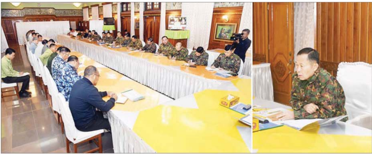
နိုင်ငံတော်လုံခြုံရေးနှင့် အေးချမ်းသာယာရေးကော်မရှင် ဒုတိယဥက္ကဋ္ဌ ဒုတိယတပ်မတော်ကာကွယ်ရေးဦးစီးချုပ် ကာကွယ်ရေးဦးစီးချုပ်(ကြည်း) ဒုတိယဝိုင်းချုပ်မှူးကြီး စိုးဝင်း ရပ်စောက်မြို့၌ မြို့နယ်အဆင့်ဌာနဆိုင်ရာတာဝန်ရှိသူများအား တွေ့ဆုံအမှာစကားပြောကြားစဉ်။

နေပြည်တော် ဖေဖော်ဝါရီ ၂၇ နိုင်ငံတော် လုံခြုံရေးနှင့် အေးချမ်းသာယာရေးကော်မရှင် ဒုတိယဥက္ကဋ္ဌ ဒုတိယတပ်မတော် ကာကွယ်ရေးဦးစီးချုပ် ကာကွယ် ရေးဦးစီးချုပ်(ကြည်း) ဒုတိယ ဝိုင်းချုပ်မှူးကြီး စိုးဝင်းသည် ရှမ်းပြည်နယ်ရှိ ပြည်နယ်အဆင့် ဌာနဆိုင်ရာများ၊ ရပ်စောက်၊ ကလေး၊ ဟံဟိုးနှင့် အောင်ပန်း မြို့များရှိ ခရိုင်၊ မြို့နယ်အဆင့် ဌာနဆိုင်ရာ တာဝန်ရှိသူများအား ရပ်စောက်မြို့နှင့် ကလေးမြို့တို့၌ ဖေဖော်ဝါရီ ၂၆ ရက်နှင့် ယနေ့ တို့တွင် သက်ဆိုင်ရာခန်းမများ၌ သီးခြားစီတွေ့ဆုံ၍ အမှာစကား ပြောကြားသည်။