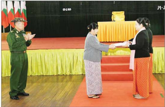
နိုင်ငံတော်လုံခြုံရေးနှင့် အေးချမ်းသာယာရေးကော်မရှင် ဒုတိယဥက္ကဋ္ဌ ဒုတိယတပ်မတော် ကာကွယ်ရေးဦးစီးချုပ် ကာကွယ်ရေးဦးစီးချုပ် (ကြည်း) ဒုတိယဗိုလ်ချုပ်မှူးကြီးစိုးဝင်း၏ စနီး ဒေါ်သန်းသန်းနွယ်က မိခင်နှင့် ကလေးစောင့်ရှောက်ရေးအသင်းအတွက် ချီးမြှင့်ငွေများပေးအပ်စဉ်။

ဖြင့် ညီညွတ်မျှတစွာ အုပ်ချုပ် ကွပ်ကဲကာ လိုအပ်သည်များ ပြည့်ဆည်း ဆောင်ရွက်ပေးသွား ကြရန်လိုကြောင်း၊ အုပ်ချုပ်မှုနှင့် သက်သာ ချောင်ချိမှုများ အားကောင်းပါက စိတ်ဓာတ်သည် လည်း အလိုလိုအားကောင်း လာမည်ဖြစ်ကြောင်း။ အရာရှိ၊ စစ်သည်များအနေဖြင့် မိမိဝင်ငွေနှင့်ထွက်ငွေကို မျှတစွာ သုံးစွဲတတ်ရန်လိုအပ်ပြီး တာဝန်ရှိ သူများမှလည်း သက်သာချောင်ချိမှု များ ပြည့်ဆည်းဆောင်ရွက်ပေး ရန် လိုအပ်မည်ဖြစ်ကြောင်း၊ ဝင်ငွေနှင့်ထွက်ငွေ မျှတစေရေး၊ ခြိုးခြံရွှေတာရန် လိုအပ်သကဲ့သို့ မလုံလားအပ်ဘဲ အပိုကုန်ကျနိုင် မည့် အရက်၊ မဆေးလိပ်၊ ကွမ်း အပါအဝင် လူမှုရေးဆိုင်ရာ ကိစ္စ လောင်းကစားမှုဆိုင်ရာ ကိစ္စ စသည့် ဆောင်ရန်၊ ရှောင်ရန် အချက်များကိုလည်း အရာရှိ၊ စစ်သည်၊ မိသားစုများ လိုက်နာရန် လိုအပ်ကြောင်း။