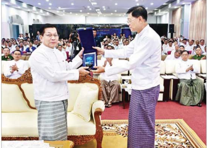
ပြည်ထောင်စုသမ္မတ မြန်မာနိုင်ငံတော်ယာယီသမ္မတ နိုင်ငံတော်လုံခြုံရေးနှင့် အေးချမ်းသာယာရေး ကော်မရှင်ဥက္ကဋ္ဌ ဗိုလ်ချုပ်မှူးကြီး မင်းအောင်လှိုင် ပြည်ထောင်စုဝန်ကြီး ဦးမြထွန်းဦးက ဒစ်ဂျစ်တယ် မြန်မာနည်းပညာနိုးနှောဖလှယ်ပွဲနှင့် ပြပွဲ အခမ်းအနားအထိမ်းအမှတ်လက်ဆောင်အား ဂါရဝပြ ပေးအပ်စဉ်။

အခြေခံများ တိုးတက်လာစေရေးကို အတွက် လမ်းပြမြေပုံတစ်ခု၊ မဟာဗျူဟာတစ်ခု ချမှတ်နိုင်ရေး အထောက်အကူပြုစေရန် မျှော်လင့် ပါကြောင်း။