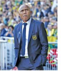
(အောက်ပုံ) (NGB)

အခုလို ပါရီအသင်းနည်းပြသစ်အဖြစ် ခန့်အပ်ခြင်းခံရလို အတိုင်းမသိ ဖော်ပြခဲ့ပါသည်။ ကွန်တော်ကို ယုံကြည်စွာနဲ့ တာဝန်ပေးအပ်ခဲ့တဲ့ အသင်းတာဝန်ရှိသူအားလုံးကိုလည်း အထူးကျေးဇူးတင်ပါသည်။ ဒီအသင်းကို ရလဒ်ကောင်းတွေ ရရှိအောင်လည်း အစွမ်းကုန်ကြိုးစားပေးသွားမှာပါ ဟု ပြောသည်။