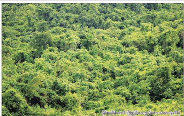
မြင်းမာဒီးတောင် ကြီးပြင်ကာကွယ်တော သဘာဝပတ်ဝန်းကျင်

နှင့် မြေအောက်ရေထိန်းသိမ်းရေး လုပ်ငန်းများအတွက် အထောက် အကူဖြစ်စေခြင်း၊ သဘာဝဘေး အန္တရာယ်များမှ တားဆီးကာ ကွယ်စေနိုင်ခြင်း၊ သစ်တောဖုံး ပိုမိုတိုးတက်ကောင်းမွန်မှုတ လာ နိုင်စေခြင်းစသည့် အကျိုးကျေးဇူး များ ရရှိနိုင်မည်ဖြစ်ပါသည်။ သယံဇာတနှင့် သဘာဝ ပတ်ဝန်းကျင်ထိန်းသိမ်းရေး ဝန်ကြီးဌာန ၀-၀-၀-၀-၀