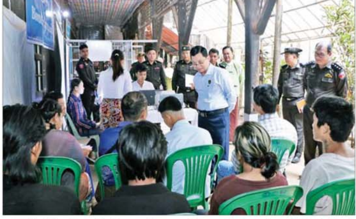
ID နံပါတ် တစ်ပါတည်းဆောင်ရွက်နေမှုအခြေအနေ ကို လှည့်လည်ကြည့်ရှုအားပေးပြီး လာရောက် ဆောင်ရွက်ကြသည့် ဒေသခံပြည်သူများအားလုပ်ငန်း

နေပြည်တော် ဖေဖော်ဝါရီ ၂၄ လူဝင်မှုကြီးကြပ်ရေးနှင့် ပြည်သူ့အင်အားဝန်ကြီး ဌာန ပြည်ထောင်စုဝန်ကြီး ဦးမြင့်ကျိုင်းသည် တာဝန် ရှိသူများနှင့်အတူ ယနေ့မွန်းလွဲပိုင်းတွင် ဧရာဝတီ တိုင်းဒေသကြီး မြောင်းမြမြို့နယ်ရှိ လူဝင်မှုကြီးကြပ် ရေးနှင့် ပြည်သူ့အင်အားဝန်ကြီးဌာန မြို့နယ်ဦးစီးမှူး ရုံး၌ မြို့နယ်အတွင်းရှိ ဒေသခံပြည်သူများအနက် အသက်ပြည့်မီပြီး နိုင်ငံသားစိစစ်ရေးကော်မတီပြား မရရှိသေးသူများနှင့် နိုင်ငံသားကတ်ပြားပျောက်ပျက်၊ မိတ္တူလာရောက်လျှောက်ထားသူများ၊ အိမ်ထောင်စု လူဦးရေစာရင်း ပြောင်းဝင်၊ ပြောင်းထွက် ဆောင်ရွက် ကြသည့် ပြည်သူများအား ဝန်ထမ်းများက လိုအပ် သည့် အထောက်အထား စာရွက်စာတမ်းများကို ဥပဒေ၊ လုပ်ထုံးလုပ်နည်းနှင့်အညီ စိစစ်ဆောင်ရွက် ထုတ်ပေးနေမှုကို လှည့်လည်ကြည့်ရှု အားပေးသည်။ ထို့နောက် ပြည်ထောင်စုဝန်ကြီးသည် နိုင်ငံသား စိစစ်ရေးကော်မတီပြားရှိပြီးသူများအား e-ID စနစ်ဖြင့် Biographic/ Biometric ကောက်ယူကာ Unique