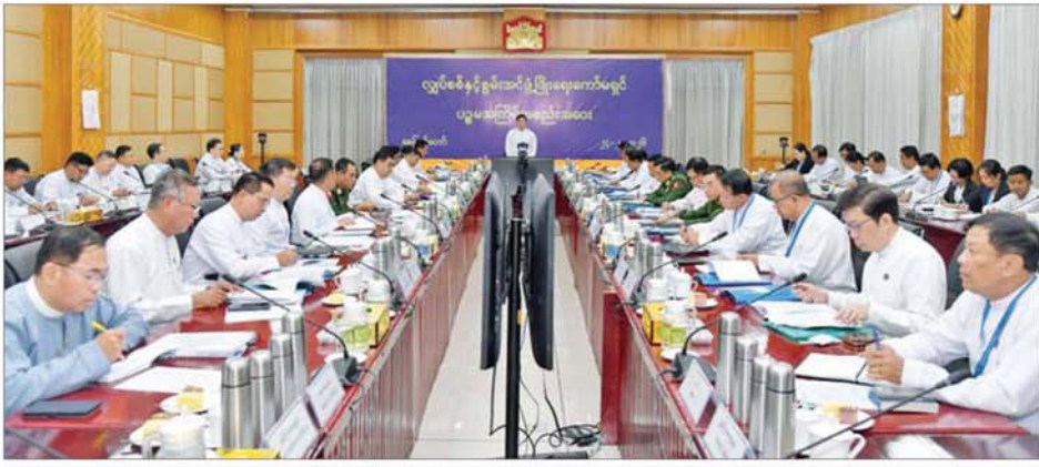
လျှပ်စစ်နှင့်စွမ်းအင်ဖွံ့ဖြိုးရေးကော်မရှင် ဥက္ကဋ္ဌ နိုင်တင်ထောင်စုဝန်ကြီး ဦးတင်အောင်စန်း လျှပ်စစ်နှင့် စွမ်းအင်ဖွံ့ဖြိုးရေးကော်မရှင် ပဉ္စမအကြိမ် လုပ်ငန်းညှိနှိုင်းအစည်းအဝေးတွင် အမှာစကားပြောကြားခဲ့ပါသည်။