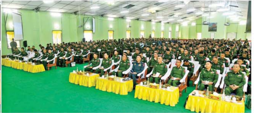
နိုင်ငံတော်လုံခြုံရေးနှင့် အေးချမ်းသာယာရေးကော်မရှင် ဒုတိယဥက္ကဋ္ဌ ဒုတိယတပ်မတော်ကာကွယ်ရေးဦးစီးချုပ် ကာကွယ်ရေးဦးစီးချုပ်ကြီး (ကြည်း) ဒုတိယဗိုလ်ချုပ်မှူးကြီး စိုးဝင်း ဗဟိုတပ်ကန်ရှိ ရေလျှင် တပ်ရင်းမှူး၊ တပ်ခွဲမှူး၊ တပ်စုမှူးသင်တန်းသားများနှင့် ဗိုလ်လောင်းများအား တွေ့ဆုံ အမှာစကားပြောကြားစဉ်။

နေပြည်တော် ဖေဖော်ဝါရီ ၂၄ - နိုင်ငံတော်လုံခြုံရေးနှင့် အေးချမ်းသာယာရေးကော်မရှင် ဒုတိယဥက္ကဋ္ဌ ဒုတိယတပ်မတော်ကာကွယ်ရေးဦးစီးချုပ် ကာကွယ်ရေးဦးစီးချုပ်ကြီး (ကြည်း) ဒုတိယဗိုလ်ချုပ်မှူးကြီး စိုးဝင်းသည် ယနေ့နံနက်ပိုင်းတွင် ဗဟိုတပ်ကန်ရှိ ရေလျှင်တပ်ရင်းမှူး၊ တပ်ခွဲမှူး၊ တပ်စုမှူး၊ သင်တန်းသားများနှင့် ဗိုလ်လောင်းများအား တပ်မတော် (ကြည်း) တိုက်ခိုက်ရေးကျောင်း (ဗဟို)ရှိ အောင်ဆန်းခန်းမ၌ တွေ့ဆုံ အမှာစကားပြောကြားသည်။ တွေ့ဆုံပွဲသို့ နိုင်ငံတော်လုံခြုံရေးနှင့် အေးချမ်းသာယာရေးကော်မရှင် ဒုတိယဥက္ကဋ္ဌ ဒုတိယတပ်မတော်ကာကွယ်ရေးဦးစီးချုပ် ကာကွယ်ရေးဦးစီးချုပ်ကြီး (ကြည်း) ဒုတိယဗိုလ်ချုပ်မှူးကြီး စိုးဝင်းနှင့် အတူ ကာကွယ်ရေးဦးစီးချုပ်မှူးမှူးအဆင့်မြင့် တပ်မတော်အရာရှိကြီးများ၊ အရေပိုင်းတိုင်းစစ်ဌာနချုပ် တိုင်းမှူး၊ နည်းပြအရာရှိများ၊ သင်တန်းသားများနှင့် တာဝန်ရှိသူများ တက်ရောက်ကြသည်။ ထိုသို့တွေ့ဆုံရာတွင် နိုင်ငံတော်လုံခြုံရေးနှင့် အေးချမ်းသာယာရေးကော်မရှင် ဒုတိယဥက္ကဋ္ဌ ဒုတိယတပ်မတော်ကာကွယ်ရေးဦးစီးချုပ်