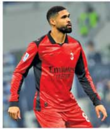
(အောက်ပုံ)(NGB)

အသက်(၃၀)နှစ်အရွယ်ရှိ ကွင်းလယ်ကစားသမား ရှောင်လှောင်တပ်စ်သည် အေစီမီလန်အသင်းနှင့်အတူ ၂၀၂၃-၂၀၂၄ ၂၀၂၅-၂၀၂၆ ဘောလုံးရာသီအထိ ပြိုင်ပွဲစုံ ၉၄ ပွဲကစားပြီး ၁၃ ဂိုး သွင်းယူကာ ခြေစွမ်းပြထားသည်။