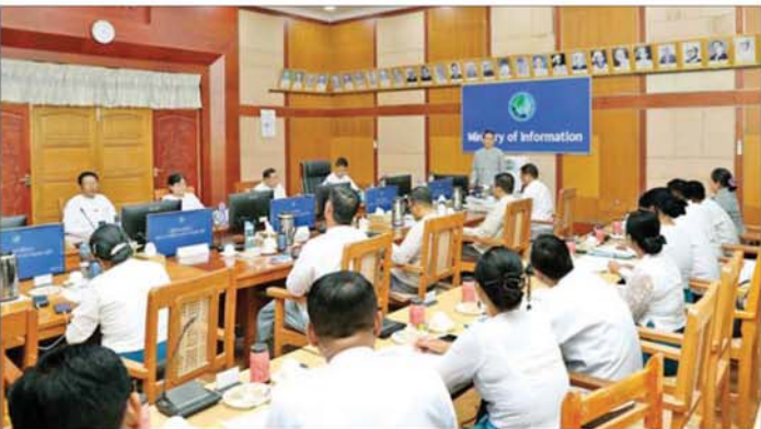
သော အမြင်ရှိရန်လိုကြောင်း၊ စုပေါင်းလုပ်ဆောင်တတ်သည့် များရှိအောင် မွေးမြူကြရန်လို ကြောင်း၊ မိမိတို့၏ တွေးခေါ် တစ်ဦးကိုတစ်ဦး လေးစားမှုဖြင့် ဒီမိုကရေစီ အလေ့အကျင့်ကောင်း ကြောင်း၊ မိမိတို့၏ တွေးခေါ်

နေပြည်တော် ဖေဖော်ဝါရီ ၂၄ ပြန်ကြားရေး ဝန်ကြီးဌာန ပြည်ထောင်စု ဝန်ကြီးနှင့် နေပြည်တော်ကောင်စီနယ်မြေနှင့် တိုင်းဒေသကြီး၊ ပြည်နယ် ပြန်ကြားရေးနှင့် ပြည်သူ့ဆက်ဆံ ရေးဦးစီးဌာန ဦးစီးမှူးများ တွေ့ဆုံ ပွဲကို ယနေ့မွန်းလွဲပိုင်းတွင် ပြန်ကြားရေးဝန်ကြီးဌာန အစည်း အဝေးခန်းမ၌ ကျင်းပသည်။ ဦးစွာ ပြည်ထောင်စုဝန်ကြီး ဦးမောင်မောင်အုန်းက မိမိတို့ ပြန်ကြားရေးဝန်ကြီးဌာန ဝန်ထမ်း များသည် နိုင်ငံတော်မီဒီယာသမား များဖြစ်သည့်အတွက် မှန်ကန်