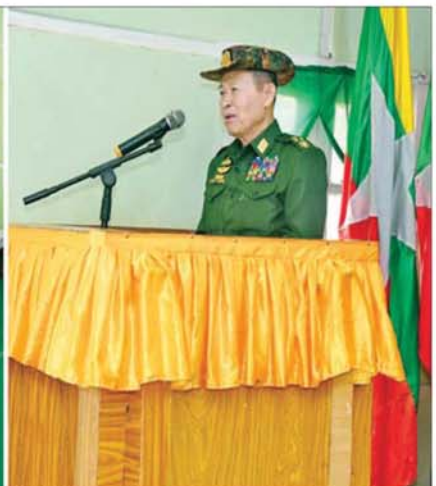
နိုင်ငံတော်လုံခြုံရေးနှင့် အေးချမ်းသာယာရေးကော်မရှင်ဒုတိယဥက္ကဋ္ဌ ဒုတိယတပ်မတော်ကာကွယ်ရေးဦးစီးချုပ်၊ ကာကွယ်ရေးဦးစီးချုပ် (ကြည်း) ဒုတိယဗိုလ်ချုပ်မှူးကြီး စိုးဝင်း နောင်တိုးတပ်နယ်မှ အရာရှိ၊ စစ်သည်၊ မိသားစုများအား တွေ့ဆုံအမှာစကားပြောကြားစဉ်။