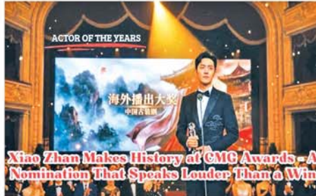
Xiao Zhan Makes History at CMG Awards - A Nomination That Speaks Louder Than a Win

တရုတ်အနုပညာထူးချွန်ဆုပေးပွဲ CMG Awards တွင် ရှောင်ကွန်ပါဝင်သောည့် Legend of Zang Hai က တစ်နှစ်တာ အကောင်းဆုံးဇာတ်ကားဆုရရှိခဲ့ကြောင်း ပိန်ဘိုဝက်ဘ်ဆိုက်တွင် ဖော်ပြသည်။ အဆိုပါဆုပေးပွဲတွင် ဇာတ်လမ်းတွဲလေးခုသာရရှိခဲ့ပြီး ရှောင်ကွန်မှာ Actor of the Year ဆုအတွက် ဆန်ခါတင်ပါဝင်ခဲ့သော်လည်း ဝါရင့်အနုပညာရှင် နှစ်ဦးက ရရှိသွားသည်။ ရှောင်ကွန်သည် ထိုဆန်ခါတင်ဇာရင်းတွင် ခေတ်ကာလအမျိုးအစားမတူသည့် ဇာတ်လမ်းများကြား ခေတ်ဟောင်းဇာတ်လမ်းကို ကိုယ်စားပြုနိုင်ခဲ့သည့် တစ်ဦးတည်းသော သရုပ်ဆောင်အဖြစ် ရပ်တည်ခဲ့ခြင်းဖြစ်သည်။ ယခုနှစ်အတွက် Weibo King နှင့် Queen ကို ရွေးချယ်ရာတွင် ယခင်နှစ် ရုပ်ရှင်နှင့် ဒရာမာ ကဏ္ဍနှစ်ခုစလုံးတွင် အောင်မြင်မှုရရှိသူများကို အခြေခံထားရာမှ ဂျက်ဆင်ရီ၊ ရှောင်ကွန်နှင့် ကျူရီလောင်းတို့ ပါဝင်ကြပြီး ယောင်မီ၊ ရှင်ဂျီလီနီ၊ ဆောင်ဂျီအတို့ကိုလည်း ပရိသတ်က ခန့်မှန်းပေးထားကြသည်။ (SKY)