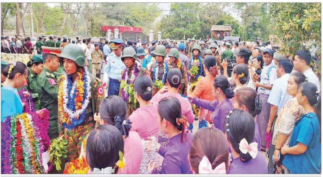
စစ်ဆင်ရေးတာဝန်များကို စွမ်းစွမ်းတမ်းတမ်းဆောင်ခဲ့ပြီး ရွပ်ရွပ်ချွံချွံတိုက်ပွဲဝင်ခဲ့သော အောင်ပွဲအလီလီရ ရှေ့တန်းပြန်နိုင်ငံသားကောင်း တပ်မတော်သားများအား ပြည်သူများက သောင်းသောင်းဖြဖြ ဂုဏ်ပြုကြိုဆိုစဉ်။

နေပြည်တော် ဖေဖော်ဝါရီ ၂၂ မန္တလေးတိုင်းဒေသကြီး မတ္တရာမြို့နယ် စဉ့်ကူး မြို့နယ်နှင့် သပိတ်ကျင်းမြို့နယ် ဒေသတစ်ဝိုက်ရှိ PDF အမည်ခံ အကြမ်းဖက်အဖွဲ့များအား ရွပ်ရွပ် ချွံချွံတိုက်ပွဲဝင်၍ အောင်ပွဲအလီလီရယူနိုင်ခဲ့သော ရှေ့တန်းပြန်နိုင်ငံသားကောင်း တပ်မတော်သားများ အား ဂုဏ်ပြုကြိုဆိုခြင်းကို ယနေ့ နံနက်ပိုင်းတွင် ရန်ကုန်တိုင်းဒေသကြီး မော်ဘီမြို့နယ်ရှိ နယ်မြေခံ တပ်ရင်း၌ ပြုလုပ်ရာ မော်ဘီတပ်နယ်မှ တာဝန်ရှိသူ များနှင့် ဌာနဆိုင်ရာတာဝန်ရှိသူများ၊ ကျောင်းသား ကျောင်းသူများ၊ အနုပညာရှင်များနှင့် ဒေသခံပြည်သူ များ ပါဝင်တက်ရောက် ဂုဏ်ပြုကြိုဆိုကြသည်။ တိုင်းဒေသကြီးနှင့် ပြည်နယ်အသီးသီးရှိ တိုင်းရင်းသားပြည်သူများ စိတ်အေးချမ်းသာစွာ နေထိုင်လုပ်ကိုင်စားသောက်နိုင်ရေးနှင့် အသက် အိုးအိမ်စည်စိမ်ဥစ္စာလုံခြုံမှုရှိစေရေး၊ နိုင်ငံတော် တည်ငြိမ်ရေး၊ နယ်မြေအေးချမ်းရေးအတွက် ရှေ့တန်း စစ်မျက်နှာများတွင် စစ်ဆင်ရေးတာဝန်များကို နေ့မအားညမနား စွမ်းစွမ်းတမ်း တာဝန်ထမ်းဆောင် ခဲ့ပြီး ရွပ်ရွပ်ချွံချွံတိုက်ပွဲဝင်၍ အောင်ပွဲအလီလီရ ဂုဏ် နိုင်ခဲ့သော