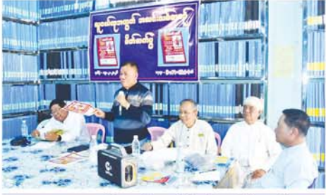
မန္တလေးအလင်းသစ်စာစဉ်မိတ်ဆက်ပွဲကျင်းပ လူငယ်ဖွံ့ဖြိုးရေး လစဉ်ထုတ်ဝေမည်

ထို့အပြင် တွေ့ရှိရသည့် သမိုင်းဝင် အမွေအနှစ်များကို ထိန်းသိမ်းကာကွယ်ရာတွင် Barrier Fencing, Camp စနစ်များနှင့် လုံခြုံရေးအစီအစဉ်များကိုလည်း အသုံးပြုဆောင်ရွက်ခဲ့ကြသည်။ ထိုလုပ်ငန်းစဉ်များအားလုံးသည် သုတေသနလုပ်ငန်းများကို ထိရောက်စွာဆောင်ရွက်နိုင်ရန်နှင့် အမွေအနှစ်ပစ္စည်းများ ပျက်စီးစေရန် ရှောင်ရွယ်ထားခြင်းဖြစ်ကြောင်း ပုဂံဒေသရှိ သမိုင်းဝင်အမွေအနှစ်များအပေါ် ဆောင်ရွက်နေသည့် သုတေသနနှင့် ပြုပြင်ထိန်းသိမ်းရေးလုပ်ငန်းများသည် ဒေသ၏ ယဉ်ကျေးမှုအမွေအနှစ်တန်ဖိုးကို မြှင့်တင်ပေးပြီး အနာဂတ်မျိုးဆက်များအတွက် တန်ဖိုးရှိသော သမိုင်းအမွေအနှစ်များကို ထိန်းသိမ်းပေးနိုင်ရန် အရေးပါသော အခန်းကဏ္ဍတစ်ခုဖြစ်ကြောင်း သိရသည်။ (အပေါ်ဝဲပုံ) (၄၀၁)