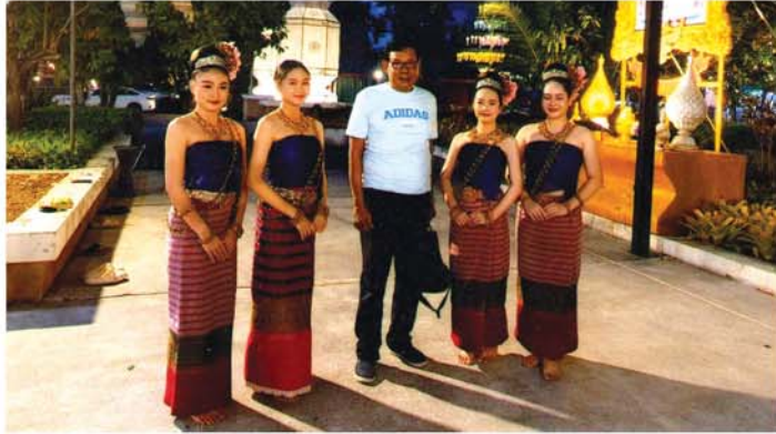
'ဒီဆိုင်ရဲ့ အသွင်အပြင်'

'စင်းမယ်သူ' မူရာရယ် ယဉ်ကျေးလို့ နတ်ရေးတစ်မျှ လှခေါင်တင်၊ လက်အုပ်ကလေး တချို့ချိနဲ့ 'ဆါသီခ' ရယ်လို့ ခွန်းစသပင်။ 'ထိုင်းမြောက်ပိုင်းရိုးရာ အစားအစာများ'