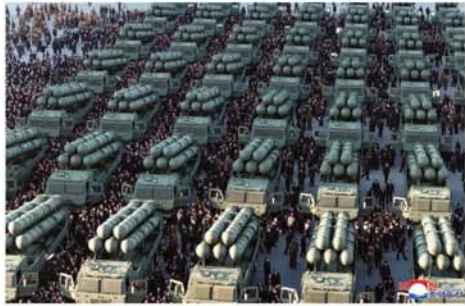
ပြယ်မ်း ဖေဖော်ဝါရီ ၁၉ ပစ်စင် အင်္ဂလိပ်ကို ခေါင်းဆောင် မြောက်ကိုရီးယားနိုင်ငံ၏ ကင်မ်ဂျောင်အွန်းက ထုတ်ဖော် အာဏာရ အလုပ်သမားပါတီ ပြသခဲ့ကြောင်း စီအင်န်အေ ညီလာခံမတိုင်မီ နျူလီးယား သတင်းဌာနက ဖော်ပြသည်။ လက်နက် တပ်ဆင်နိုင်သော ဒုံး ယမန်နေ့က ကျင်းပသော

အခမ်းအနားတွင် ကင်မ်ဂျောင် အွန်းက အဆိုပါ ၆၀၀ မီလီ မီတာ အရွယ်အစားရှိ ဒုံးပစ်စင် များကို အံ့အားသင့်ဖွယ်ကောင်း ပြီးဆောင်မှုရှိသော လက်နက် များအဖြစ် ချီးကျူးပြောကြား ခဲ့ကာ ရှေ့လာမည့် ပါတီညီလာခံ တွင် စစ်ရေးနှင့် တည်ဆောက် ရေးဆိုင်ရာ ရည်မှန်းချက်အသစ် များကို ချမှတ်သွားမည်ဖြစ် ကြောင်း ထည့်သွင်းပြောဆို သည်။ ယင်းကဲ့သို့သော ဒုံးပစ်စင် အခုရေ ၅၀ ကို မြောက်ကိုရီးယား