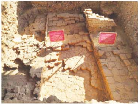
ပုဂံ ဖေဖော်ဝါရီ ၁၉

ပုဂံဒေသရှိ သတ္တုဥယျာဉ်အား ကြီး၏ သမိုင်းဝင်အမွေအနှစ်များသည် ပုဂံဒေသ၏ ယဉ်ကျေးမှု သမိုင်းကြောင်းနှင့် လူမှုဘဝဖွံ့ဖြိုးတိုးတက်မှုတို့ကို ထင်ဟပ်ပြသသည့် အရေးကြီးသက်သေအထောက်အထားများဖြစ်သည်။ ထိုအမွေအနှစ်များကို စနစ်တကျ စူးစမ်းသုတေသနပြုလုပ်ခြင်းနှင့်ထိန်းသိမ်းကာကွယ်ခြင်းတို့သည် မျိုးဆက်သစ်များအတွက် သမိုင်းမှတ်တမ်းအမွေအနှစ်များကို ဆက်လက်ထိန်းသိမ်းပေးနိုင်ရန် အလွန်အရေးပါသော ကဏ္ဍများဖြစ်ကြောင်း ရှေးဟောင်းသုတေသနနှင့်အမျိုးသားပြတိုက်ဦးစီးဌာန၊ ပုဂံဌာနခွဲတာဝန်ရှိသူများထံမှ သိရသည်။