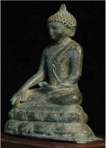
ပုဂံခေတ်ဆင်းတုတော် ။

ဓမာလက်ရာက အထက်မှာ ပြောခဲ့သလို ရေးပြီးသားဖြစ်ပေမယ့် တွေ့ရတဲ့ စေတီတော်နဲ့ လက်ရာဟန်နဲ့ ကွာခြားမှုအရ နောက်ခံအဖြစ် အပျက်ကွာခြားနိုင်လို့ထပ်ပြီး ရေးမယ်လို့ ပြောရခြင်းပါ။ ယခုအပတ်တော် ထိုင်းလက်ရာ ဆင်းတုတော်အကြောင်းကို သုတေသနရှုထောင့်ကနေ တင်ပြပါမယ်။ ဆင်းတုတော်အကြောင်းပြောမီ စေတီတော်အကြောင်းကို အရင်ပြောမှ အချိတ်အဆက်မိမယ် ထင်ပါတယ်။ စေတီတော်ဟာ ငလျင်ဒဏ်ကြောင့် ပြုကျတဲ့အချိန်မှာ အတွင်းဘုရားဆောင်ပါတဲ့ တိုက်ခံစေတီပုံစံမျိုးပါ။ ခေတ်အဆက်ဆက် ပြုပြင်ခဲ့တဲ့အတွက် အပေါ်ဆုံးလက်ရာမှာ ဘာအထောက်အထားမှ မတွေ့ရတဲ့အတွက် မျက်မှောက်ခေတ်လို့ပဲ ပြောရပါမယ်။