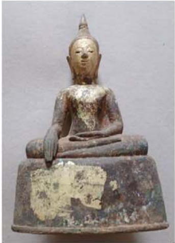
ယိုးဒယားဆင်းတုတော် ။

မန္တလေးငလျင်ကြီးအပြီး ပြုပျက်ခဲ့တဲ့ ဘုရားစေတီတော်တွေထဲက ထွက်ပေါ်လာခဲ့တဲ့ ဌာပနာတွေထဲက လက်ရာထူးခြားတဲ့ ဆင်းတုတော်နဲ့ အခြားသော ဆက်စပ်ပစ္စည်းလေးတွေအကြောင်းကို သုတေသနရှုထောင့်ကနေ ရေးသားခဲ့ပါတယ်။ ကျောက်ဆည်မြို့နယ် ဝေဘူတောင်မြေမှာ ပုဂံခေတ် အနော်ရထာမင်းကြီး ကောင်းမှုဆည်တော်နဲ့စေတီတော်ထဲက တွေ့ရတဲ့ ဓမာလက်ရာ ဆင်းတုတော်အကြောင်းလည်း ရေးသားတင်ပြခဲ့ပါတယ်။ အခုလည်း အမရပူရမြို့နယ်ထဲက ဒုဂ္ဂဝတီမြစ်ကမ်းနဲ့ မနီးမဝေးမှာ တည်ထားခဲ့တဲ့ ဆုတောင်းပြည့်စေတီတော် ပြုပျက်ရာက တွေ့လာရတဲ့ ဌာပနာတွေထဲမှာ လက်ရာထူးခြားတဲ့ ဆင်းတုတော်သုံးဆူ တွေ့ရပါမယ်။ အဲဒါတွေကတော့ ဓမာလက်ရာဆင်းတု၊ တရုတ်လက်ရာဆင်းတုနဲ့ ထိုင်းလက်ရာဆင်းတုတွေ ဖြစ်ပါတယ်။ အဲဒီဆင်းတုတော်သုံးဆူနဲ့ပတ်သက်ပြီး တစ်ဆူချင်းစီအလိုက် သုတေသနရှုထောင့်ကနေ ရေးသားတင်ပြပါမယ်။