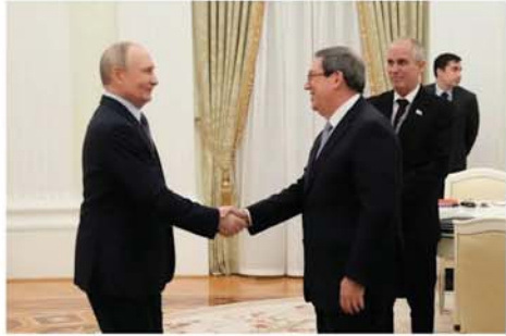
မော်စကို ဖေဖော်ဝါရီ ၁၉ ရုရှားသမ္မတ ပလာဒီမာပူ နှင့် ယမန်နေ့က ကရင်မလင်နန်း တော်၌ ကျူးဘားနိုင်ငံခြား တော်၌ တွေ့ဆုံခဲ့ပြီး ကွန်မြူနစ်

အုပ်ချုပ်သော ကျူးဘားကျွန်း နိုင်ငံအပေါ် ချမှတ်ထားသည့် ကန့်သတ်ချက်အသစ်များသည် လက်ခံနိုင်ဖွယ်မရှိဟု ပြောကြား လိုက်ကြောင်း သိရသည်။ ကျူးဘားနိုင်ငံသို့ ရေနံတင် သွင်းမှု ပြတ်တောက်စေရန် အမေရိကန်ပြည်ထောင်စု၏ ကြိုးပမ်းမှုကို တုံ့ပြန်နိုင်ရန် အတွက် ရုရှားနိုင်ငံအနေဖြင့် ဟာဗားနားမြို့သို့ ရုပ်ဝတ္ထုပစ္စည်း အထောက်အပံ့များ အပါအဝင် အကူအညီများ ပေးအပ်သွားမည်