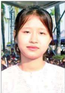
မဖြိုးသီရိကျော်