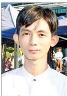
မောင်ရောင်စဉ်ထွန်း