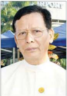
ဦးခင်မောင်ကျော်ဒင်

ဦးခင်မောင်ကျော်ဒင် (ဒုတိယဥက္ကဋ္ဌ၊ မြန်မာနိုင်ငံ သတင်းစီဒီယာကောင်စီ) ဂမိဘိယာက စွဲဆိုတဲ့အမှုကို မြန်မာနိုင်ငံ ကိုယ်စားလှယ်အဖွဲ့က နယ်သာလန်နိုင်ငံ သည်ဟိရ်မြို့ မှာ သွားပြီးတော့ အမှုရင်ဆိုင်ခဲ့တာပဲ။ ရက် ၂၀ လောက် ကြာတဲ့အခါမှာ မြန်မာကိုယ်စားလှယ်အဖွဲ့ရဲ့ ကြီးစား အားထုတ်မှုတွေ၊ လျှောက်လဲမှုတွေကို လေးစားဂုဏ်ပြု တဲ့အတွက် မြန်မာနိုင်ငံသတင်းစီဒီယာကောင်စီ အနေနဲ့ လာရောက်ဂုဏ်ပြု ကြိုဆိုတာဖြစ်ပါတယ်။ မြန်မာကိုယ်စားလှယ်အဖွဲ့က နိုင်ငံအကျိုးစီးပွားကို ကာကွယ်ခဲ့တဲ့အတွက် ထောက်ခံတဲ့အနေနဲ့ ကျွန်တော်တို့လည်း တစ်သားတည်းရပ်တည်ပါတယ်။ လူပုဂ္ဂိုလ်ကို တရားစွဲတာနဲ့ နိုင်ငံကို တရားစွဲတာက မတူပါဘူး။ နိုင်ငံကို တရားစွဲတဲ့အတွက် တစ်နိုင်လုံးမှာရှိတဲ့ နိုင်ငံသူနိုင်ငံသား ပြည်သူလူထု တွေက ဒီနိုင်ငံသားတွေဖြစ်တဲ့အတွက် တညီတညွတ်တည်း ကန့်ကွက်ရမယ်။ တညီတညွတ်တည်း ဒီကိုယ်စား လှယ်အဖွဲ့ကို အားပေးထောက်ခံရမှာဖြစ်ပါတယ်။ လူပုဂ္ဂိုလ်ဆိုရင်တော့ ကြိုက်သည်ဖြစ်စေ၊ မကြိုက်သည်ဖြစ်စေ ပါလို့ရတယ်။ မပါလို့လည်း ရတယ်။ အခုက နိုင်ငံကိုတရားစွဲတဲ့ အတွက် ပြည်သူ လူထုတွေအနေနဲ့ ပါကိုပါရမှာဖြစ်ပါတယ်။ မဖြိုးသီရိကျော် (သယ်နံးကျွန်း ပညာရေးဒီဂရီကောလိပ်) ကျွန်မအနေနဲ့ကတော့ ကိုယ့်ရဲ့နိုင်ငံအတွက် မတရားစွဲခံရတာကို မြန်မာကိုယ်စားလှယ်အဖွဲ့က အပြည်ပြည်ဆိုင်ရာ တရားရုံးမှာသွားပြီး မဖြေရှင်းပေးတဲ့အတွက် ဝမ်းသာပီတိဖြစ်ရပါတယ်။ ကျွန်မတို့ သယ်နံးကျွန်းပညာရေးဒီဂရီကောလိပ်က ကျောင်းသား ကျောင်းသူ ၅၀၀ လောက်လာပြီး ဂုဏ်ပြု ကြိုဆိုတာပါ။ တခြားကျောင်းက ကျောင်းသားကျောင်းသူတွေလည်း လာရောက်ကြိုဆိုတာပဲလို့ သိရပါတယ်။ အခုလိုမျိုး ကိုယ့်နိုင်ငံအတွက် မြန်မာကိုယ်စားလှယ်အဖွဲ့က မဖြေရှင်းပေးပြီး ပြန်ရောက်လာကြတာကို ကြိုဆိုရတဲ့ အတွက် မြန်မာအမျိုးသမီး တစ်ယောက်အနေနဲ့ ဂုဏ်ယူမဆုံးဖြစ်ပြီး ဝမ်းသာမိပါတယ်။