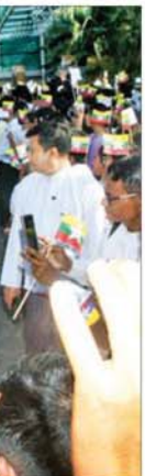
နိုင်ငံတော်သမ္မတရုံးဝန်ကြီးဌာန(၂) ပြည်ထောင်စုဝန်ကြီး ဦးကိုကိုလှိုင်နှင့် ဥပဒေရေးရာဝန်ကြီးဌာန ပြည်ထောင်စုဝန်ကြီးနှင့် ပြည်ထောင်စုရှေ့နေချုပ် ဒေါက်တာသီတာဦးတို့ ခေါင်းဆောင်သည့် မြန်မာကိုယ်စားလှယ်အဖွဲ့အား ရန်ကုန်တိုင်းဒေသကြီးဝန်ကြီးချုပ် ဦးစိုးသိန်း၊ တာဝန်ရှိသူများ၊ ရဟန်းရှင်လူပြည်သူများ၊ အနုပညာရှင်များ၊ ကျောင်းသား ကျောင်းသူများက ဂုဏ်ပြုပန်စည်းပေးအပ်၍ ကြိုဆိုကြသည်။

မကြာခင် ပေါ်ပေါက်လာတော့မည့် နိုင်ငံတော်၏ အခင်းအကျင်းအသစ်နှင့်အတူ မိမိတို့ချစ်သည့် မြန်မာနိုင်ငံတော်ကြီး အမွန်ရှည်တည်တံ့ခိုင်မြဲရေးနှင့် အေးချမ်းသာယာဖွံ့ဖြိုးရေးအတွက် ရည်မှန်း၍ မိမိတို့အားလုံး နိုင်ငံတော်အလံကို အလေးပြုပြီး နိုင်ငံတော်သီချင်းကို တက်တက်ကြွကြွ သီဆိုကာ မိမိတို့၏ နိုင်ငံချစ်စိတ်ကို ပြသပေးကြပါစို့ဟု မေတ္တာရပ်ခံလိုပါကြောင်း ပြောကြားသည်။ ဆက်လက်၍ ပြည်ထောင်စုဝန်ကြီး ဦးကိုကိုလှိုင်နှင့် ဒေါက်တာ သီတာဦးတို့ ခေါင်းဆောင်သည့် မြန်မာကိုယ်စားလှယ်အဖွဲ့သည် ရန်ကုန် အပြည်ပြည်ဆိုင်ရာလေဆိပ်မှ မော်တော်ယာဉ်တန်းဖြင့် ပြန်လည်ထွက်ခွာရာ လမ်းတစ်လျှောက်တွင် ဌာနဆိုင်ရာဝန်ထမ်းများ၊ အရပ်ဘက်အဖွဲ့အစည်းများ၊ ရဟန်းရှင်လူပြည်သူများ၊ ကျောင်းသား ကျောင်းသူများက စီမံခန့်ခွဲမှုဦးစီးဌာန နိုင်ငံတော်အလံများ၊ ဝှေ့ယမ်းကာ လှိုက်လှိုက်လှဲလှဲ တစ်ခဲနက် ကြိုဆိုထောက်ခံကြောင်း ပြသခဲ့ကြသည်။