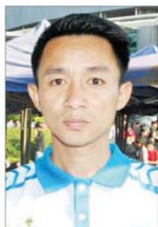
မောင်ကျော်သူဇော်

မြင်းဖြစ်ပါတယ်။ မြန်မာကိုယ်စားလှယ်အဖွဲ့က နိုင်ငံဂုဏ်သိက္ခာကို ကယ်တင်နိုင်အောင်လို့ ကမ္ဘာ့အမြင်မှာ မြန်မာက အကြမ်းဖက်နေတယ်ဆိုတဲ့ အမြင်တွေကို ပျောက်ကွယ်သွားအောင် အမှန်တရား တွေကို ဖော်ထုတ်ပေးတဲ့ ကိုယ်စားလှယ်အဖွဲ့ဖြစ်ပါတယ်။ မြန်မာနိုင်ငံက အကြမ်းဖက်နေတယ်ဆိုပြီး ဝါဒဖြန့်နေတာတွေကို ဒီလိုမျိုးအမှန်တရားတွေကို သိမြင်လာအောင်လို့ သွားရောက်ပြီးတော့ မဖြေရှင်း တာဖြစ်ပါတယ်။ အခုလို ICJ တရားရုံးမှာ ရဲရဲဝဲဝဲ ပြောကြားပြီး မဖြေရှင်းပေးခဲ့တဲ့အတွက် ဂုဏ်ယူ ဝမ်းမြောက်ရပါတယ်။ အုန်းသီး (ရုပ်ရှင်သရုပ်ဆောင်အကယ်ဒမီ) ကျွန်တော်တို့နိုင်ငံအတွက် ကာကွယ်ပေးတဲ့ ပုဂ္ဂိုလ်၊ နိုင်ငံအတွက် ရွပ်ရွပ်ချွတ်ချွတ်ပွဲဝင်ပေးတဲ့ ပုဂ္ဂိုလ်တွေကို လာရောက်ကြိုဆိုတာပါ။ ICJ မှာ ပြည်ထောင်စုဝန်ကြီးဦးကိုကိုလိုင်းနဲ့ အဖွဲ့သွားရောက် ချေပတဲ့အပေါ်မှာ ကျေနပ်အားရမှုရှိပါတယ်။ ပြည်ထောင်စုဝန်ကြီးနဲ့အဖွဲ့က ဉာဏ်ပညာတွေ၊ အတွေ့အကြုံတွေ ကျွန်တော်တို့ထက်အများကြီးရှိ ပါတယ်။ ကျွန်တော်အနေနဲ့ သုံးသပ်ရမယ့်ဆိုရင် သူများ နိုင်ငံကိုလည်း ကျွန်တော်တို့ ဝင်ရောက်မစွက်ဖက်ဘူး။ ကျွန်တော်တို့ နိုင်ငံကိုလည်း ဝင်ရောက်မစွက်ဖက် စေချင်ဘူး။ ကျွန်တော်တို့ အေးအေးချမ်းချမ်းပေးနေချင် ပါတယ်။ ကျွန်တော်အနေနဲ့ ပြည်သူလူထုကို ပြောချင် တာကတော့ မိမိနိုင်ငံကို မိမိချစ်ကြပါ။ ကိုယ့်နိုင်ငံ သာယာမှုကျွန်တော်တို့ ပြည်သူလူထုတလဲလဲသာယာ မှာ ဖြစ်ပါတယ်။