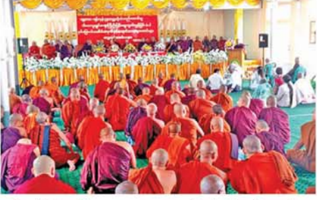
ကပ်လှူဒါန်းခဲ့သည်။ ထောင်ခဲ့ကြောင်း သိရသည်။ မန္တလေး၊ ပုဒ္ဒတက္ကသိုလ်ကို (အပေါ်) ၁၉၇၄ ခုနှစ်တွင် စတင်တည် (၀၃၂)