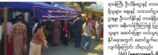
(ပုံ) (မန္တလေးနေ့စဉ်-၆)