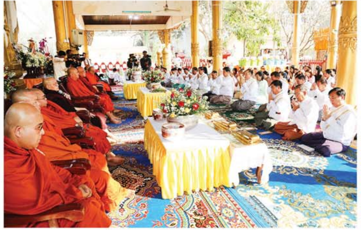
မန္တလေး ဖေဖော်ဝါရီ ၁

မန္တလေးလျှင်ကြီးကြောင့် ထိခိုက်ပျက်စီးခဲ့သည့် အမရပူရမြို့နယ်ရှိ ရှေးဟောင်းသမိုင်းဝင် သံသေကပ်ကျော်ဆုတောင်းပြည့်မြတ်စွာဘုရား သီတင်းသုံးတော်မူသည့် ဂန္ဓကုဋ်တိုက် စံကျောင်းတော်ကြီးအား အသစ်ပြန်လည်တည်ဆောက်လှူဒါန်းခြင်း ရတနာပန္နက်တော်တင်မင်္ဂလာအခမ်းအနားကို ယနေ့နံနက်ပိုင်းက အဆိုပါဂန္ဓကုဋ်တိုက် စံကျောင်းတော်ကြီးတွင် ကျင်းပရာ နိုင်ငံတော်ဗဟိုသံဃာ့ဝန်ဆောင်၊ မန္တလေးမြို့ မစိုးရိမ်တိုက်သစ် မဟာနာယက၊ ဓမ္မာဓိပတိကျောင်းဆရာတော်၊ ရန်ကုန်တိုင်းဒေသကြီး သံဃနာယကအဖွဲ့ဥက္ကဋ္ဌ မဟာဓာမိပရိယတ္တိစာသင်တိုက်ဆရာတော်၊ မန္တလေးတိုင်းဒေသကြီး သံဃနာယကအဖွဲ့ အကျိုးတော်ဆောင်၊ ဒက္ခိဏာရာမ ဘုရားကြီးတိုက် သာသနာဇောတိကာရုံကျောင်းဆရာတော်၊ အမရပူရမြို့နယ် သံဃနာယကအဖွဲ့ဥက္ကဋ္ဌ ဆင်ဖြူမယ်ကျောင်းဆရာတော်တို့ အမှူးပြုသော ဆရာတော်၊ သံဃာတော်များ ကြွရောက်ချီးမြှင့်တော်မူကြသည်။