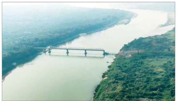
KNPP၊ KNDF အဖွဲ့များနှင့် PDF အမည်ခံ အကြမ်းဖက်သောင်းကျန်းသူများက သံလွင်တံတား (ဖားဆောင်း)အား မိုင်းထောင်ဖောက်ခွဲခဲ့မှုကြောင့် တံတားပျက်စီးနေမှု။

၂၅၀၊ အကျယ် ၂၄ ပေခန့် ပြိုကျပျက်စီးခဲ့ကြောင်းနှင့် လူထုခိုက်ခဏ်ရာရရှိမှုမရှိကြောင်း သိရသည်။ အကြမ်းဖက်သမားများအနေဖြင့် ဒေသ ကောင်းစားရေးဟုသုံးနှုန်း၍ အမှန်တကယ်တွင် ၎င်းတို့၏ ကိုယ်ကျိုးစီးပွားအတွက်သာ ရှေးရှု၍ ယုတ်မာရိုင်းစိုင်းစွာဖြင့် အများပြည်သူအဓိက သွားလာရာနှင့် ကုန်စည်များစီးဆင်းရာတွင် အဓိက အားထားအသုံးပြုနေသော စစ်ရေးပစ်မှတ်မဟုတ် သည့် သံလွင်တံတား(ဖားဆောင်း)အား ဖောက်ခွဲ ဖျက်ဆီးခဲ့ခြင်းကြောင့် ဒေသခံပြည်သူများ၏ လူမှုစီးပွားဘဝများ များစွာနစ်နာဆုံးရှုံးခဲ့ရ သည်။ အဆိုပါ မိုင်းခွဲဖျက်ဆီးမှုကြောင့် လက်ရှိတွင် လူနှင့်ယာဉ်များ ဖြတ်သန်းသွားလာနိုင်မှုမရှိကြောင်း သိရှိရပြီး တံတားပျက်စီးမှုကို သက်ဆိုင်ရာ လမ်း/ တံတားဦးစီးဌာနမှ တာဝန်ရှိသူများနှင့် ဝန်ထမ်း များက အမြန်ဆုံး ပြန်လည်ပြင်ဆင်သွားမည်ဖြစ်