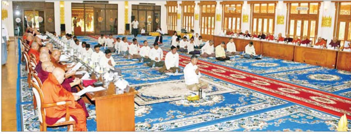
ပြည်ထောင်စုသမ္မတ မြန်မာနိုင်ငံတော် နဝမအကြိမ် နိုင်ငံတော်သံဃမဟာနာယကအဖွဲ့ ၄၇ ပါးစုံညီ စတုတ္ထအစည်းအဝေး ဒုတိယနေ့ ကျင်းပစဉ်။