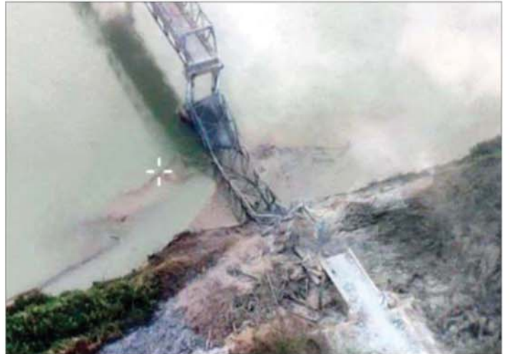
KNPP၊ KNDF အဖွဲ့များနှင့် PDF အမည်ခံ အကြမ်းဖက်သောင်းကျန်းသူများက သံလွင်တံတား (ဖားဆောင်း)အား မိုင်းထောင်ဖောက်ခွဲခဲ့မှုကြောင့် တံတားပျက်စီးနေမှု။