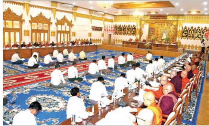
ပြည်ထောင်စုသမ္မတမြန်မာနိုင်ငံတော် နဝမအကြိမ် နိုင်ငံတော်သံဃမဟာနာယကအဖွဲ့ ၄၇ ပါးစုံညီ စတုတ္ထအစည်းအဝေး ဒုတိယနေ့ ကျင်းပစဉ်။

အစည်းအဝေးတွင် နဝမအကြိမ် နိုင်ငံတော် သံဃမဟာနာယကအဖွဲ့ ဒုတိယအဖွဲ့ခွဲ၏ ဒုတိယ အကြိမ်တာဝန်ကျရာကာလအတွင်း ဆောင်ရွက်ချက် များအနက် ဝိနိစ္ဆယရေးရာဆောင်ရွက်ချက်များအပေါ် အဂ္ဂမဟာသဒ္ဓမ္မဇောတိကဓဇ ဘဒ္ဒန္တအာစိတ္တက လည်းကောင်း၊ သာသနာရေးရာ ဆောင်ရွက်ချက်များ အပေါ် အဂ္ဂမဟာပဏ္ဍိတ အဂ္ဂမဟာသဒ္ဓမ္မဇောတိကဓဇ ဘဒ္ဒန္တပဏ္ဍိတလည်းကောင်း၊ ပညာရေးရာ ဆောင်ရွက်ချက်များအပေါ် အဂ္ဂမဟာပဏ္ဍိတ အဂ္ဂမဟာသဒ္ဓမ္မဇောတိကဓဇ မွေကထိကဗဟုဇန ဟိတဓရ ဘဒ္ဒန္တပညာသီဟာလင်္ကာရာဘိဝံသက လည်းကောင်း၊ ဝေဖန်ဆွေးနွေးတော်မူကြပြီး အစည်း အဝေးကို နံနက် ၉ နာရီတွင် ရပ်နားသည်။