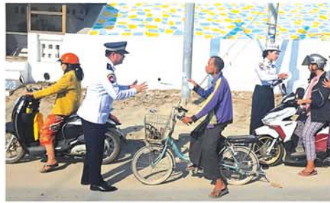
မန္တလေး ဖေဖော်ဝါရီ ၁၇ (၁၀၆)ယာဉ်ထိန်းရဲတပ်ဖွဲ့မှူးရုံး မြန်မာနိုင်ငံရဲတပ်ဖွဲ့ အမှတ် (စစ်ကိုင်းမြို့နယ်)မှ တပ်ဖွဲ့မှူး

နှင့်တပ်ဖွဲ့ဝင်များသည် ဖေဖော်ဝါရီ ၁၅ ရက် နံနက်ပိုင်းက ယာဉ်စည်းကမ်း၊ လမ်းစည်းကမ်းထိန်းသိမ်းရေးအတွက် စစ်ကိုင်းမြို့ကိုးပေးပို့နှင့် ဆေးမီးပွင့်တိုင်တော်ဆိုင်ကယ်များနှင့် သုံးဘီးတပ်မော်တော်ယာဉ်များအား လမ်းလယ်မှ မောင်းနှင်ခြင်းမပြုရန်၊ လမ်း၏ညာဘက်ဆုံး ယာဉ်ကြောမှသာ မောင်းနှင်ကြရန်၊ မေးသိုင်းကြီးသေချာစွာ တပ်ဆင်၍ ဆိုင်ကယ်စီးဦးထုပ်ဆောင်းကြရန် အသိပညာပေးပြောကြားခြင်း၊ အသိပညာပေးလက်ကမ်းစာစောင်များဖြန့်ဝေခြင်းတို့ကို ဆောင်ရွက်ခဲ့သည်။ (ဝဲပုံ) ဆိုင်ကယ်ဆောက်ထိုင်လိုက်ပါလာသော သံဃာတော်များ၊ သီလရှင်ဆရာပေးများအား ဆိုင်ကယ်စီးဦးထုပ် အလုံး ၅၀ အား လှူဒါန်းပေးခဲ့ကြောင်း သိရသည်။ (၁၄၅)