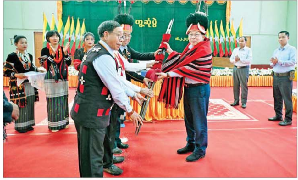
ပြည်ထောင်စုသမ္မတမြန်မာနိုင်ငံတော် ယာယီသမ္မတ နိုင်ငံတော်လုံခြုံရေးနှင့် အေးချမ်းသာယာရေးကော်မရှင်ဥက္ကဋ္ဌ ဗိုလ်ချုပ်မှူးကြီး မင်းအောင်လှိုင်ထံ နာဂကိုယ်ပိုင်အုပ်ချုပ်ခွင့်ရဒေသဦးစီးအဖွဲ့ဥက္ကဋ္ဌ၊ နာဂရိုးရာ စာပေနှင့်ယဉ်ကျေးမှုကော်မတီဥက္ကဋ္ဌနှင့် တာဝန်ရှိသူများက နာဂရိုးရာ ခေါင်းပေါင်း၊ မြို့ထည်နှင့် ရိုးရာလက်ဆောင်ပစ္စည်းများ ဂါရဝပြုဆင်မြန်းပေးစဉ်။

ဝန်ကြီးများ၊ စစ်ကိုင်းတိုင်းဒေသကြီး ဝန်ကြီးချုပ် ဦးမြတ်ကျော်၊ ကာကွယ်ရေး ဦးစီးချုပ်ရုံးမှ အဆင့်မြင့် တပ်မတော်အရာရှိကြီးများနှင့်စနိုးများ၊ အနောက်မြောက်တိုင်းစစ်ဌာနချုပ်တိုင်းမှူး၊ ဒုတိယဝန်ကြီးများ၊ လဟယ်မြို့နှင့်လေရှီးမြို့တို့ရှိ ဌာနဆိုင်ရာ တာဝန်ရှိသူများ၊ မြို့မိမြို့ဖများ၊ တိုင်းရင်းသားရိုးရာစာပေနှင့် ယဉ်ကျေးမှုအဖွဲ့များ၊ ဒေသခံတိုင်းရင်းသားပြည်သူများ တက်ရောက်ကြသည်။ ဒေသဆိုင်ရာ အချက်အလက်များနှင့် ဒေသဖွံ့ဖြိုးရေးအတွက် လိုအပ်ချက်များအား အသီးသီးဆွေးနွေးတင်ပြ ဦးစွာ လဟယ်မြို့နှင့် လေရှီးမြို့တို့မှ နာဂကိုယ်ပိုင်အုပ်ချုပ်ခွင့်ရဒေသဦးစီးဥက္ကဋ္ဌဦးထွန်းထွန်းဝင်းနှင့် လေရှီးမြို့နယ် စီမံခန့်ခွဲရေးနှင့် အုပ်ချုပ်ရေးကော်မတီ ဥက္ကဋ္ဌဦးဝင်းမောင်တို့က ဒေသဆိုင်ရာ အချက်အလက်များ၊ ဒေသတည်ငြိမ်အေးချမ်းရေး လုပ်ငန်းများ ဆောင်ရွက်ထားရှိမှု၊ ပါတီနှင့် ဒီမိုကရေစီအထွေထွေရွေးကောက်ပွဲ အောင်မြင်စွာကျင်းပပြုလုပ်နိုင်ခဲ့မှု၊ နာဂဒေသအတွင်း မြေအသုံးချမှုနှင့် ပျမ်းမျှမိုးရေရရှိမှု၊ ကဏ္ဍကြီးများအလိုက် ကုန်ထုတ်လုပ်မှုများ တိုးတက်ထုတ်လုပ်နိုင်ခဲ့မှု၊ ရာသီအလိုက် သီးနှံများစိုက်ပျိုးလျက်ရှိမှု၊ ဒေသဝမ်းစာပုံလုံမှု၊ မွေးမြူရေးလုပ်ငန်းများ ဆောင်ရွက်ထားရှိမှု၊ နိုင်ငံပီးပွားရေးမြှင့်တင်ရေးရန်ပုံငွေများ ထုတ်ဖျော့ပေးထားမှု