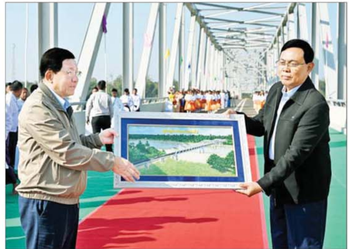
နိုင်ငံတော်ယာယီသမ္မတ နိုင်ငံတော်လုံခြုံရေးနှင့် အေးချမ်းသာယာရေးကော်မရှင်ဥက္ကဋ္ဌ ဗိုလ်ချုပ်ကြီး မင်းအောင်လှိုင်ထံ ဆောက်လုပ်ရေးဝန်ကြီးဌာန ပြည်ထောင်စုဝန်ကြီးက ချင်းတွင်းတံတား (ထမံသီ)ဖွင့်ပွဲအထိမ်းအမှတ်လက်ဆောင် ဂါရဝပြုပေးအပ်စဉ်။