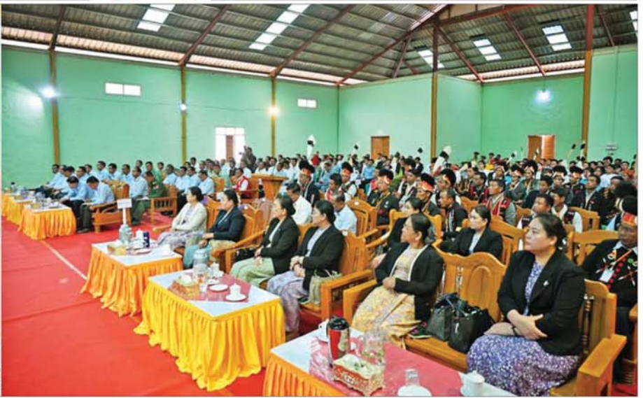
ပြည်ထောင်စုသမ္မတမြန်မာနိုင်ငံတော် ယာယီသမ္မတ နိုင်ငံတော်လုံခြုံရေးနှင့် အေးချမ်းသာယာရေးကော်မရှင်ဥက္ကဋ္ဌ ဗိုလ်ချုပ်မှူးကြီး မင်းအောင်လှိုင် နာဂကိုယ်ပိုင်အုပ်ချုပ်ခွင့်ရဒေသ လဟယ်မြို့ရှိ ဌာနဆိုင်ရာ တာဝန်ရှိသူများ၊ မြို့မိမြို့ဖများနှင့် တွေ့ဆုံ၍ ဒေသဖွံ့ဖြိုးတိုးတက်ရေးဆိုင်ရာများ ဆွေးနွေးပြောကြားစဉ်။