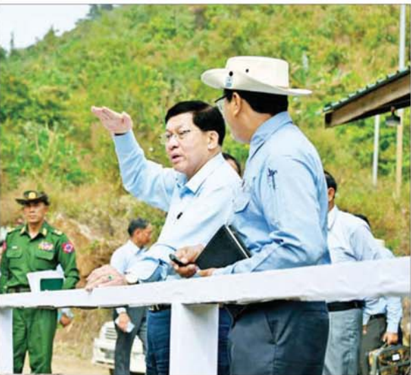
ပြည်ထောင်စုသမ္မတမြန်မာနိုင်ငံတော် ယာယီသမ္မတ နိုင်ငံတော်လုံခြုံရေးနှင့် အေးချမ်းသာယာရေးကော်မရှင်ဥက္ကဋ္ဌ ဗိုလ်ချုပ်မှူးကြီးမင်းအောင်လှိုင် နာဂကိုယ်ပိုင်အုပ်ချုပ်ခွင့်ရဒေသ လဟယ်မြို့ရှိ ဟေ့ထိုက်ရေအားလျှပ်စစ်စီမံကိန်း အကောင်အထည်ဖော်ဆောင်ရွက်နေမှုကို ကြည့်ရှုစစ်ဆေးစဉ်။