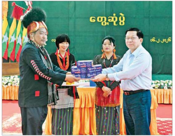
ပြည်ထောင်စုသမ္မတမြန်မာနိုင်ငံတော် ယာယီသမ္မတ နိုင်ငံတော်လုံခြုံရေးနှင့် အေးချမ်းသာယာရေး ကော်မရှင်ဥက္ကဋ္ဌ ဗိုလ်ချုပ်မှူးကြီး မင်းအောင်လှိုင် လဟယ်မြို့နယ်နှင့် လေရှိုးမြို့နယ်တို့ရှိ ဌာနဆိုင်ရာ တာဝန်ရှိသူများအတွက် လက်ဆောင်ပစ္စည်းများ ပေးအပ်စဉ်။

ဆောင်ရွက်ပေးလျက်ရှိကြောင်း၊ လမ်းပန်းဆက်သွယ်မှုအခက်အခဲ များကြောင့် ဒေသဖွံ့ဖြိုးတိုးတက် ရေးလုပ်ငန်းများ ဆောင်ရွက်ရန် အတွက် ပစ္စည်းများ သယ်ယူ ပို့ဆောင်ရန် အခက်အခဲများရှိ ကြောင်း၊ ထို့ကြောင့် ဒေသတွင်း လမ်းပန်းဆက်သွယ်မှုများ လုံခြုံ ချောမွေ့စေရေး မိမိတို့အနေဖြင့် ဆက်လက် ဆောင်ရွက်ပေးသွား မည်ဖြစ်ကြောင်း၊ လဟယ်မြို့ပေါ်ဆေးရုံအတွက် ဆရာဝန်လိုအပ်ချက်နှင့် ပတ်သက် ၍ ၂၀၂၂ ခုနှစ်မှစတင်၍ နာဂဒေသ အတွက် ဆရာဝန်လိုအပ်ချက်များ ရှိခြင်းကြောင့်တပ်မတော်အထူးကု ဆရာဝန်များကို စေလွှတ်ပေးခဲ့ ကြောင်း၊ လိုအပ်ချက်များရှိပါက မိမိတို့အနေဖြင့် ထပ်မံစေလွှတ် ပေးသွားမည်ဖြစ်ကြောင်း၊ ဆေးရုံ ရှိပါက ဆရာဝန်ရှိရမည်ဖြစ်သဖြင့် ဆရာဝန်များ ခန့်အပ်ပေးသွားမည် ဖြစ်ကြောင်း၊ ဆေးရုံအတွက် လိုအပ်သည့် ကုသရေးဆိုင်ရာ ပစ္စည်းများကိုလည်း တတ်နိုင်သမျှ ဖြည့်ဆည်းဆောင်ရွက်ပေးသွား မည်ဖြစ်ကြောင်း၊ စာသင်ကျောင်းများအတွက် ဆရာ ဆရာမများ လိုအပ်မှုနှင့် ပတ်သက်၍ အလယ်တန်းပြဆရာ ဆရာမများ ပိုမိုလိုအပ်လျက်ရှိ သည်ကို တွေ့ရကြောင်း၊ ဆရာ ဆရာမများ ဖြည့်ဆည်းပေး