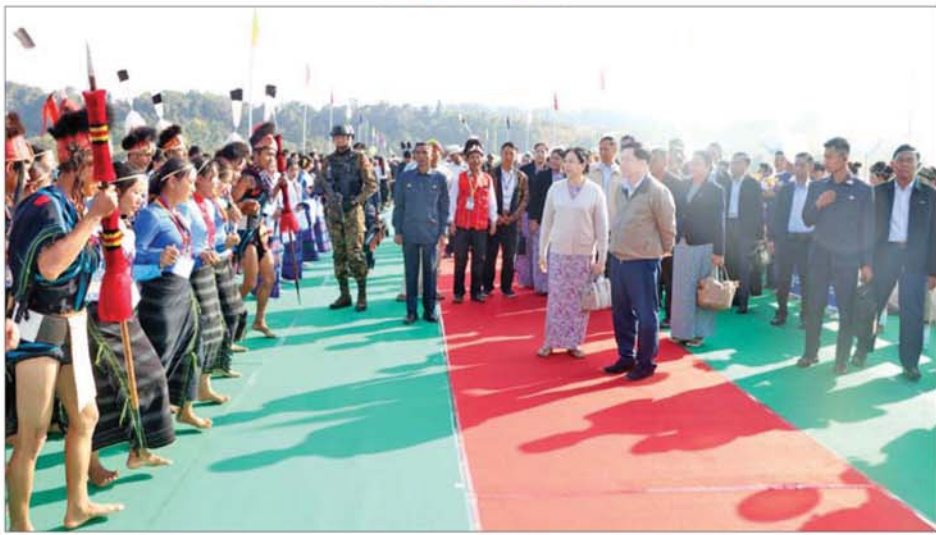
နိုင်ငံတော်ယာယီသမ္မတ နိုင်ငံတော်လုံခြုံရေးနှင့် အေးချမ်းသာယာရေးကော်မရှင်ဥက္ကဋ္ဌ ဗိုလ်ချုပ်ကြီး မင်းအောင်လှိုင်နှင့် ဇနီး ဒေါ်ကြူကြူလှ တိုင်းရင်းသားရိုးရာအကဖြင့် ကပြဖျော်ဖြေမှုကို ကြည့်ရှုအားပေးစဉ်။

ယင်းနောက် နိုင်ငံတော် ယာယီသမ္မတ နိုင်ငံတော်လုံခြုံရေးနှင့် အေးချမ်းသာယာရေး ကော်မရှင် ဥက္ကဋ္ဌက ချင်းတွင်းတံတား (ထမံသီ) ကမ္ဘာ့ပေမီတာအား စက်ခလုတ်နှိပ် ဖွင့်လှစ်ပေးပြီး အမွှေးနံ့သာရည်များ ပက်ဖျန်းပေးသည်။ ဆက်လက်၍ ကော်မရှင်အတွင်းရေးမှူးနှင့် အခမ်းအနား တက်ရောက်လာကြသူများက ကမ္ဘာ့ပေမီတာအား အမွှေး