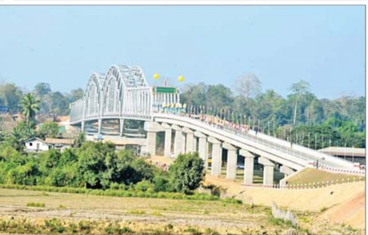
ချင်းတွင်းတံတား(ထမံသီ)ကို တွေ့ရစဉ်။