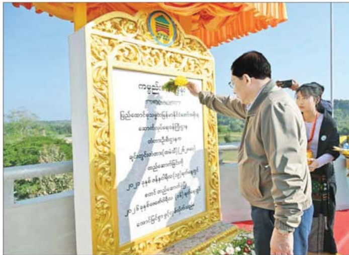
နိုင်ငံတော်ယာယီသမ္မတ နိုင်ငံတော်လုံခြုံရေးနှင့် အေးချမ်းသာယာရေးကော်မရှင်ဥက္ကဋ္ဌ ဗိုလ်ချုပ်ကြီး မင်းအောင်လှိုင် ချင်းတွင်းတံတား(ထမံသီ) ကမ္ဘာ့ပေမီတာအား အမွှေးနံ့သာရည် ပက်ဖျန်းပေးစဉ်။

နှုတ်ဆက်ခဲ့ကြသည်။ ထို့နောက် နိုင်ငံတော် ယာယီသမ္မတ နိုင်ငံတော်လုံခြုံရေးနှင့် အေးချမ်းသာယာရေး ကော်မရှင် ဥက္ကဋ္ဌသည် တံတားဖွင့်ပွဲသို့ လာရောက် အားပေးလျက်ရှိကြသည့် ဒေသခံပြည်သူများအား တွေ့ဆုံ၍ လူမှုစီးပွားအခြေအနေများအား မေးမြန်းပြီး ရင်းရင်းနှီးနှီး နှုတ်ဆက်ခဲ့သည်။ အထောက်အကူဖြစ်စေမည့် အဆိုပါ ချင်းတွင်းတံတား (ထမံသီ)အနေဖြင့် တံတားအရှည် ၂၆၂၈ ပေရှိပြီး သံကွန်ကရစ် တံတားအမျိုးအစားဖြစ်ကြောင်း၊ ရေလမ်းကင်းလွတ်အမြင့် ပေ ၄၀ ရှိကြောင်း၊ ယခုကဲ့သို့ ချင်းတွင်းတံတား (ထမံသီ)ကို တည်ဆောက်ဖွင့်လှစ်နိုင်ခြင်းဖြင့် ဟုမ္မလင်းခရိုင်နှင့် နာဂကိုယ်ပိုင်အုပ်ချုပ်ခွင့်ရဒေသတို့ရှိ ပြည်သူများ၏ လူမှုစီးပွားဘဝနှင့် ဒေသဖွံ့ဖြိုးတိုးတက်ရေး၊ ဒေသထွက်ကုန်များအား လွယ်ကူလျင်မြန်စွာ ပို့ဆောင်နိုင်ရေးနှင့် ပညာရေး၊ ကျန်းမာရေး၊ စီးပွားရေးကဏ္ဍများ ဖွံ့ဖြိုးတိုးတက်စေရေးတို့ကို များစွာအထောက်အကူဖြစ်စေမည်ဖြစ်ကြောင်း သတင်းစဉ်