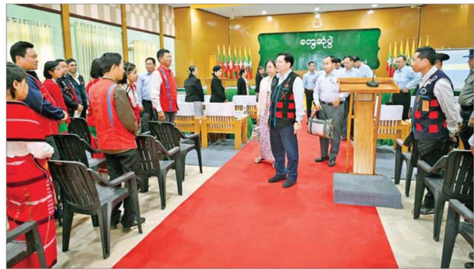
ပြည်ထောင်စုသမ္မတမြန်မာနိုင်ငံတော် ယာယီသမ္မတ နိုင်ငံတော်လုံခြုံရေးနှင့် အေးချမ်းသာယာရေးကော်မရှင်ဥက္ကဋ္ဌ ဗိုလ်ချုပ်မှူးကြီး မင်းအောင်လှိုင် လေရှိုးမြို့ရှိ ဌာနဆိုင်ရာတာဝန်ရှိသူများ၊ မြို့မိမြို့ဖများနှင့် ဒေသခံတိုင်းရင်းသားပြည်သူများအား ရင်းရင်းနှီးနှီး နှုတ်ဆက်စဉ်။

ကျောင်းတွင် တက်ရောက်ပြီးစီး ပါက ဟုမ္မလင်းမြို့ရှိ စိုက်ပျိုးရေး နှင့် မွေးမြူရေးသိပ္ပံပွဲတော် တက်ရောက် ပြီး ဒီပလိုမာဘွဲ့များ ရရှိအောင် ဆက်လက်သင်ကြားနိုင်ကြောင်း၊ ထို့ကြောင့် ကျောင်းတက်ရောက် နေကြသည့် ကျောင်းသား ကျောင်းသူများအားလုံး ပညာ ပြီးဆုံးအောင် သင်ကြားနိုင်ရေး နိုင်ငံတော်ဖွဲ့လည်း တတ်နိုင်သမျှ ဆောင်ရွက် ပေးသွားမည်ဖြစ် ကြောင်း။ လေရှိုးဒေသနှင့် လဟယ်ဒေသ တွင် ဝမ်းစာဖူလုံမှုမရှိသည့်ကို တွေ့ရကြောင်း၊ ဒေသဝမ်းစာဖူလုံ ရေးသည် အရေးကြီးလိုအပ်ချက် ဖြစ်သဖြင့် ကုန်မြင်လယ်များကို မဖြစ်မနေ ဖော်ဆောင်ပေးသွား မည်ဖြစ်ပြီး စိုက်ပျိုးရေးလုပ်ငန်းများ အတွက် လိုအပ်သည့် အောင်ရေ များရရှိအောင် စီမံဆောင်ရွက်ပေး သွားမည်ဖြစ်ကြောင်း၊ လဟယ် ဒေသတွင် ဝဋ္ဋ စိုက်ပျိုးခြင်းထွန်း အောင်မြင်သည်ဟု သိရှိရကြောင်း၊ ဝဋ္ဋမှ ဝဋ္ဋဆန် ထုတ်လုပ်၍ရသဖြင့် ဝဋ္ဋစိုက်ပျိုးရေးကို တိုးချဲ့စိုက်ပျိုး နိုင်ရေး သုတေသနပြုဆောင်ရွက် သွားရန်လိုကြောင်း၊ နိုင်ငံတော်မှ လည်း ပံ့ပိုးပေးမည်ဖြစ်ကြောင်း၊ အလားတူ ပြောင်းနှင့် အာလူးများ ကိုလည်း တိုးချဲ့စိုက်ပျိုးသွားရန် လိုကြောင်း၊ ဒေသမှထွက်ရှိသည့် လက်ဖက်၊ မက်မန်၊ ကော်ဖီ၊ လိမ္မော်နှင့် ထောပတ်ပင်များသည် နှစ်ရှည်သီးနှံများဖြစ်ပြီး ဒေသ အတွက် ဝင်ငွေများရရှိနိုင်မည်ဖြစ် သဖြင့် တိုးတက်စိုက်ပျိုးထုတ်လုပ် သွားနိုင်ရန်လိုကြောင်း။ မွေးမြူရေးနှင့် ပတ်သက်၍ စားရေးကို အထောက်အကူပြုစေ မည့် နွားနောက်၊ ဒေသန္တရကြက် နှင့်ဝက်များကို တိုးချဲ့မွေးမြူနိုင်ရေး ဆောင်ရွက်သွားကြမည်ဆိုပါက ဒေသဝမ်းစာအတွက် များစွာ အထောက်အကူပြုစေမည်ဖြစ် ကြောင်း၊ စာမျက်နှာ ၆ သို့။