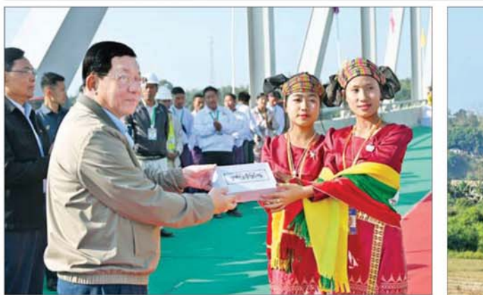
နိုင်ငံတော်ယာယီသမ္မတ နိုင်ငံတော်လုံခြုံရေးနှင့် အေးချမ်းသာယာရေးကော်မရှင်ဥက္ကဋ္ဌ ဗိုလ်ချုပ်ကြီး မင်းအောင်လှိုင် ကျောင်းသား ကျောင်းသူများနှင့် တိုင်းရင်းသားအကအဖွဲ့များအား ဂုဏ်ပြုချီးမြှင့်ငွေများ ပေးအပ်စဉ်။