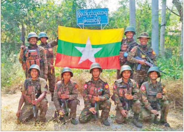
တပ်မတော်စစ်ကြောင်းများက အကြမ်းဖက်သောင်းကျန်းသူများ ယာယီစိုးမိုးထားသည့် ဖားဆောင်းမြို့အား ပြန်လည်တိုက်ခိုက်သိမ်းပိုက်ရရှိမှု။