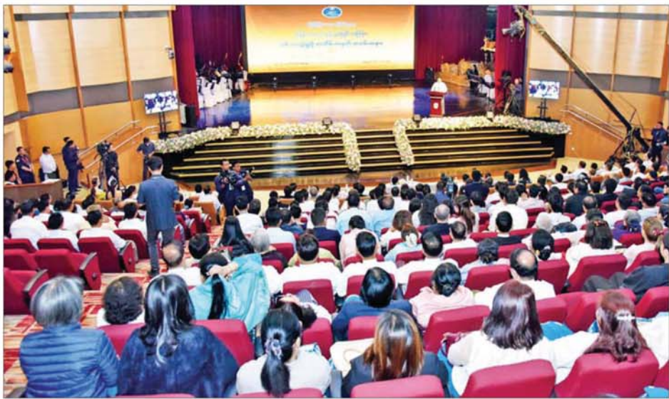
နိုင်ငံတော်ဝန်ကြီးချုပ် ဦးညိုစော မြန်မာ့အသံနှင့်ရုပ်မြင်သံကြား၏ နှစ်(၈၀) ပြည့် အထိမ်းအမှတ်အခမ်းအနားတွင် အမှာစကားပြောကြားစဉ်။

နေပြည်တော် ဖေဖော်ဝါရီ ၁၅ မြန်မာ့အသံနှင့် ရုပ်မြင်သံကြား၏ နှစ်(၈၀)ပြည့် အထိမ်းအမှတ်အခမ်းအနားကို ယနေ့နံနက်ပိုင်းတွင် နေပြည်တော် တပ်ကုန်းမြို့ရှိ မြန်မာ့အသံနှင့် ရုပ်မြင်သံကြားရုံးချုပ်၌ ကျင်းပပြုလုပ်ရာ နိုင်ငံတော်ဝန်ကြီးချုပ် ဦးညိုစောနှင့် ဧည့်သည်တော်များ တက်ရောက်သည်။