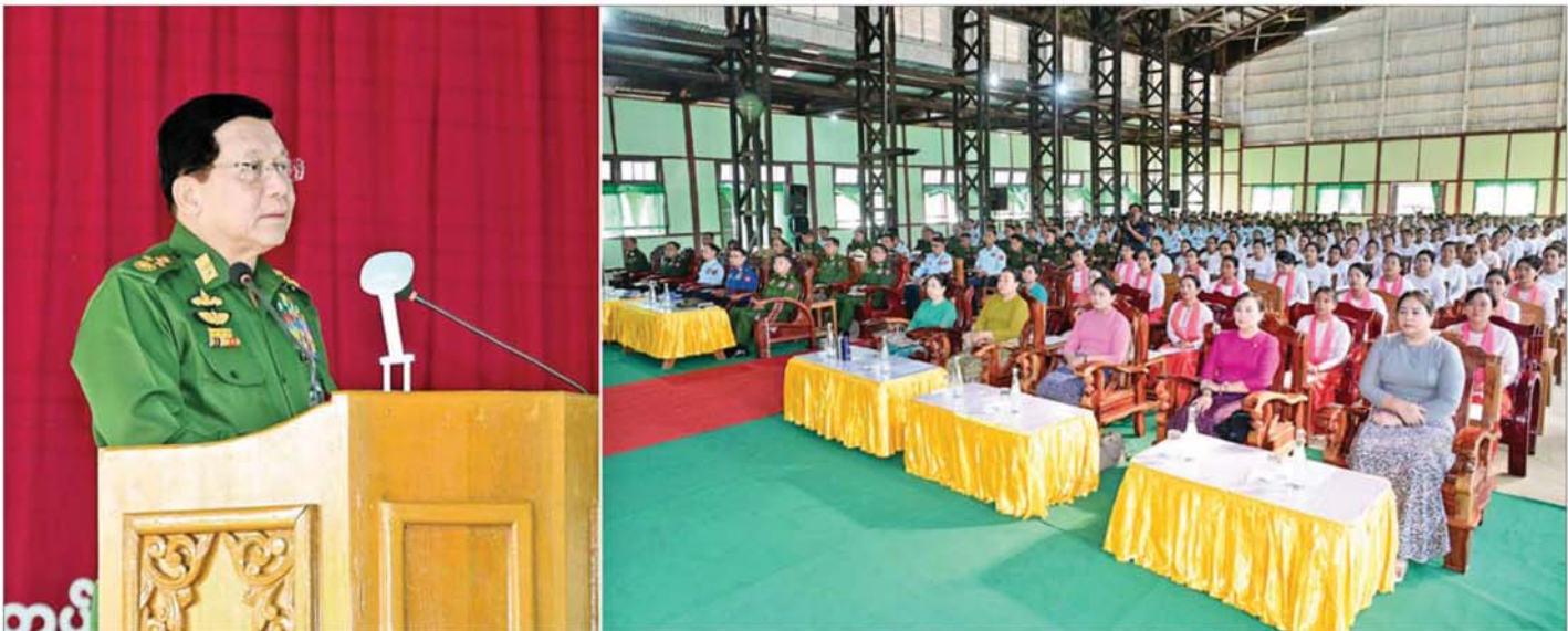
နိုင်ငံတော်လုံခြုံရေးနှင့် အေးချမ်းသာယာရေးကော်မရှင်ဥက္ကဋ္ဌ တပ်မတော်ကာကွယ်ရေးဦးစီးချုပ် ဗိုလ်ချုပ်မှူးကြီး မင်းအောင်လှိုင် ဟုမ္မလင်းတပ်နယ်ရှိ အရာရှိ၊ စစ်သည်၊ မိသားစုများအား တွေ့ဆုံအမှာစကား ပြောကြားစဉ်။