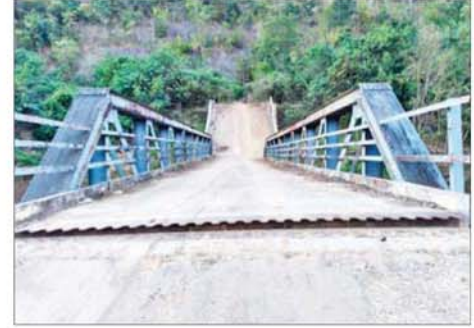
အကြမ်းဖက်သောင်းကျန်းသူများက မိုင်းထောင်ဖောက်ခွဲဖျက်ဆီးခဲ့သည့် ထူးချောင်းတံတား မှတ်တမ်းဓာတ်ပုံ။