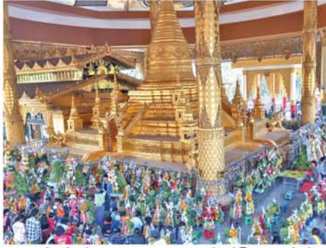
၃၅၅ ခုနှစ်တွင် ရှင်အရပ်ရဟန္တာ ကိုယ်တိုင် သိမ်သမုတိပြီး အနော်ရထာမင်းကြီးတည်ထားကိုးကွယ်ခဲ့သည့် တန်ခိုးကြီးရှေးဟောင်းဘုရား တစ်ဆူဖြစ်ကြောင်းနှင့် သစ္စာအဓိဋ္ဌာန်ပြုဆုတောင်းပါက တောင်းသည့်ဆရာများ ပြည့်ဝသဖြင့် ဘုရားဖူးများ တစ်နေ့တခြား စည်ကားလှကျော်ကြောင်း သိရသည်။ (အပေါ်ပုံ) (၄၈၅)

များဖြင့် အမြဲစည်ကားလှကျော်ရွှေသိမ်တော်ဘုရားကြီး၊ ရက်ကြီးများ၌ ဘုရားဖူးလာသည့်ပြည်သူများဖြင့် ပို၍စည်ကားကြောင်း၊ ဆုတောင်းပြည့်မဟာရွှေသိမ်တော်ဘုရားကြီး၏ ဂေါပကာအဖွဲ့မှလည်း ဘုရားဖူးပြည်သူများ အဆင်ပြေစေရေးအတွက် ယာဉ်ရပ်နားကွင်းများ စနစ်တကျ ဆောင်ရွက်ပေးထားပြီး ဘုရားဖူးပြည်သူများ၏ လိုအပ်သည့် အကူအညီများကို ပြည့်ဆည်းပေးနိုင်ရန်အတွက် လုံခြုံရေးဝန်ထမ်းများ ထားရှိပေးထားသည်။ ဆုတောင်းပြည့် မဟာရွှေသိမ်တော်ဘုရားသည် သက္ကရာဇ်