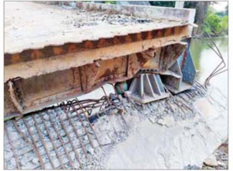
အကြမ်းဖက်သောင်းကျန်းသူများက မိုင်းထောင်ဖောက်ခွဲဖျက်ဆီးခဲ့သည့် ထူးချောင်းတံတား မှတ်တမ်းဓာတ်ပုံ။