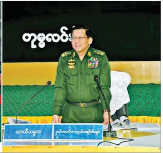
ပြည်ထောင်စုသမ္မတမြန်မာနိုင်ငံတော် ယာယီသမ္မတ နိုင်ငံတော်လုံခြုံရေးနှင့် အေးချမ်းသာယာရေးကော်မရှင်ဥက္ကဋ္ဌ ဗိုလ်ချုပ်မှူးကြီး မင်းအောင်လှိုင် ဟုမ္မလင်းမြို့ရှိ ခရိုင်၊ မြို့နယ်အဆင့်ဌာနဆိုင်ရာတာဝန်ရှိသူများ၊ မြို့မိမြို့ဖများနှင့်တွေ့ဆုံ၍ ဒေသဖွံ့ဖြိုးတိုးတက်ရေးဆိုင်ရာများ ဆွေးနွေးပြောကြားစဉ်။