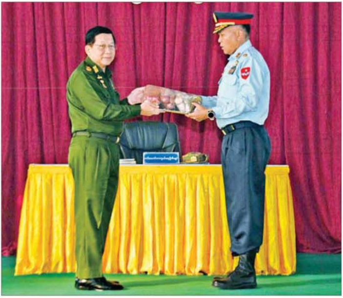
နိုင်ငံတော်လုံခြုံရေးနှင့် အေးချမ်းသာယာရေးကော်မရှင်ဥက္ကဋ္ဌ တပ်မတော်ကာကွယ်ရေးဦးစီးချုပ် ဗိုလ်ချုပ်မှူးကြီး မင်းအောင်လှိုင် ဟုမ္မလင်းတပ်နယ်မှ အရာရှိ စစ်သည်၊ မိသားစုများအတွက် စားသောက် ဖွယ်ရာပစ္စည်းများ ပေးအပ်စဉ်။

ယနေ့ခေတ်သည် နည်းပညာခေတ်ဖြစ်သည်နှင့် အညီ စစ်မြေပြင်တွင် အဆင့်မြင့်နည်းပညာများကို အသုံးပြုလာကြကြောင်း၊ ထို့ကြောင့် မိမိတို့အနေဖြင့် တပ်မတော်နှင့် မြန်မာနိုင်ငံရဲ့တပ်ဖွဲ့ တို့တွင် ခေတ်နှင့် အညီ နည်းပညာများကို အပြည့်အဝအသုံးပြုနိုင်ရေး ဆောင်ရွက်လျက်ရှိကြောင်း၊ ရဲတပ်ဖွဲ့နှင့် တပ်မတော် တို့သည် ညီနောင်တပ်ဖွဲ့များအဖြစ် လက်တွဲဆောင်ရွက် သွားကြရမည်ဖြစ်ကြောင်း၊ ဒေသတည်ငြိမ်အေးချမ်း ရေးအတွက် တပ်မတော်၊ မြန်မာနိုင်ငံရဲ့တပ်ဖွဲ့နှင့် ဒေသခံပြည်သူများပူးပေါင်း၍ ဆောင်ရွက်သွားကြရ မည်ဖြစ်ကြောင်း။ စွမ်းရည်၊ စွမ်းအားရှိသည့် တပ်မတော်ဖြစ်စေရေး