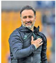
အစွမ်းကုန် ကြိုးစားပေးသွားမှာ ပါ 'ဟု ပြောသည်။ (အပေါ်ပုံ) (NGB)

တစ်ဦးဖြစ်ခြင်းကြောင့် နော်တင်ဟမ်ဟောရက်စ်အသင်းက နည်းပြ သစ်အဖြစ် ခန့်အပ်ခဲ့ခြင်းဖြစ်သည်။ အသက်(၅၇)နှစ်အရွယ်ရှိ နည်းပြ ပစ်တပ်ရဲရဲက ကျွန် တော်အခုလို နော်တင်ဟမ်ဖော့ ရက်စ်အသင်းနည်းပြသစ်အဖြစ် ခန့်အပ်ခြင်းခံရလျှင် အတိုင်းမသိ ပျော်ရွှင်မိပါ့တယ်။ ကျွန်တော်ကို ယုံကြည်စွာနဲ့ တာဝန်ပေးအပ်ခဲ့ တဲ့အသင်းတာဝန်ရှိသူအားလုံးကို အထူးကျေးဇူးတင်ပါတယ်။ ဒီ အသင်း အောင်မြင်တိုးတက်ဖို့