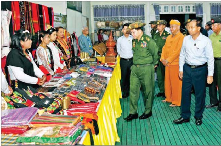
ပြည်ထောင်စုသမ္မတမြန်မာနိုင်ငံတော် ယာယီသမ္မတ နိုင်ငံတော်လုံခြုံရေးနှင့် အေးချမ်းသာယာရေးကော်မရှင်ဥက္ကဋ္ဌ ဗိုလ်ချုပ်မှူးကြီးမင်းအောင်လှိုင် ခင်းကျင်းပြသထားသည့် ဟုမ္မလင်းခရိုင်အတွင်းရှိ အသေးစား၊ အငယ်စားနှင့် အလတ်စား စီးပွားရေး (MSME) လုပ်ငန်းများမှ ထွက်ရှိသည့် ထုတ်ကုန်ပစ္စည်းများခင်းကျင်းပြသထားမှုကို လှည့်လည်ကြည့်ရှုစဉ်။

နိုင်မည်ဖြစ်ကြောင်း၊ စိုက်ပျိုးရေးလုပ်ငန်း တွင် မျိုးမြေ၊ ရေ၊ နည်း၊ ဟူသောနည်းလမ်း လေးသွယ်ဖြင့် ပြည့်စုံပါက ဆောင်မြင် ဖြစ်ထွန်းနိုင်မည်ဖြစ်ကြောင်း၊ စိုက်ပျိုး မွေးမြူရေးလုပ်ငန်းများ ဆောင်ရွက်ရာ တွင် မိရိုးဖလာနည်းလမ်းများအစား စနစ် ကျနသည့် ခေတ်မီနည်းစနစ်များ အသုံးပြု ဆောင်ရွက်ခြင်းဖြင့် အထွက်နှုန်းများ တိုးမြှင့်လာမည်ဖြစ်ကြောင်း၊ စနစ်ကျန သည့် စိုက်ပျိုးမွေးမြူရေးလုပ်ငန်းများ ဆောင်ရွက်နိုင်ရန်အတွက် လူသားအရင်း အမြစ်များလိုအပ်ကြောင်း၊ ဒေသန္တရစိုက်ပျိုး မွေးမြူရေးလုပ်ငန်းများ ဆောင်ရွက်ခြင်း ထက် ခေတ်မီသည့်စိုက်ပျိုးမွေးမြူရေး လုပ်ငန်းများဆောင်ရွက်နိုင်ရန် လိုကြောင်း၊ ဒေသန္တရ ကြက်၊ ဝက်၊ ခွားများကို မိရိုး ဖလာနည်းဖြင့် မွေးမြူခြင်းထက် ခေတ်မီ နည်းစနစ်များဖြင့် မွေးမြူသွားမည်ဆိုပါ က ဒေသ၏စားရေးကို အထောက်အကူ ပြုနိုင်မည်ဖြစ်ကြောင်း။