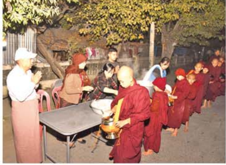
လေးပြင်လေးရပ်မှ ကြွရောက်တော်မူကြသော သံဃာတော်နှင့် သာမဏေအပါး ၂၀၀ ကျော်တို့ အား ယနေ့ နံနက်ပိုင်းက (၁၅၄) ကြိမ်မြောက်အဖြစ် ဆွမ်း၊ ကြက်သားချက်၊ နှမ်းဖတ်ချဉ်သုပ်တို့

မန္တလေး ဖေဖော်ဝါရီ ၁၅ မန္တလေးမြို့တော်စည်ပင်သာယာရေးကော်မတီ၊မဟာမြိုင်စည်ပင်ဝန်ထမ်းအိမ်ရာ၂၄၆လမ်း၊ ၆လမ်းနှင့် ၇လမ်းကွက်တွင် နေထိုင်သည့် ဝန်ထမ်းမိသားစုများမှ စုပေါင်း၍ အပတ်စဉ် (တနင်္ဂနွေနေ့)တွင် လေးပြင်လေးရပ်မှ ကြွရောက်အလှူခံတော်မူကြသော သံဃာတော်နှင့် သာမဏေများအား ဘုံဆွမ်းလောင်းလှူလျက်ရှိသည်။ ဘုံဆွမ်းလောင်းလှူရာတွင် ဝန်ထမ်း မိသားစုဝင်များက