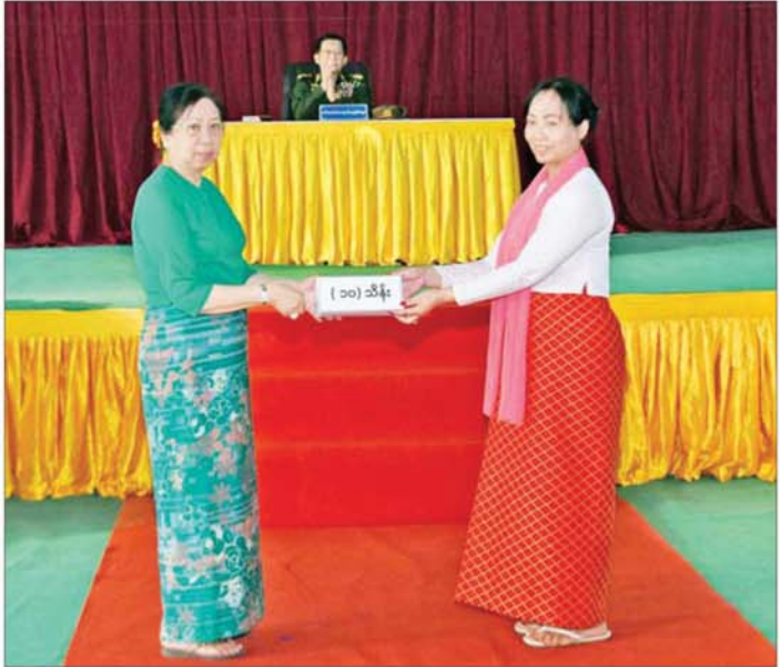
နိုင်ငံတော်လုံခြုံရေးနှင့် အေးချမ်းသာယာရေးကော်မရှင်ဥက္ကဋ္ဌ တပ်မတော်ကာကွယ်ရေးဦးစီးချုပ် ဗိုလ်ချုပ်မှူးကြီး မင်းအောင်လှိုင်၏စီးနင်း ဒေါ်ကြူကြူ လှဟုမ္မလင်းတပ်နယ် မိခင်နှင့် ကလေးစောင့်ရှောက်ရေး အသင်းအတွက် ချီးမြှင့်ငွေများ ပေးအပ်စဉ်။

မိမိတို့အနေဖြင့် ကြိုးပမ်းဆောင်ရွက်လျက်ရှိ ကြောင်း၊ တိုက်စွမ်းအားနှင့် ပတ်သက်၍ နိုင်ငံတကာ နှင့် ယှဉ်နိုင်သည့် တပ်မတော်ဖြစ်စေရေး တပ်မတော် (ရေ)နှင့် တပ်မတော်(လေ)တို့ရှိ ရေယာဉ်၊ လေယာဉ် များအား အဆင့်မြှင့်တင်ခြင်းနှင့် ထပ်မံဖြည့်တင်း