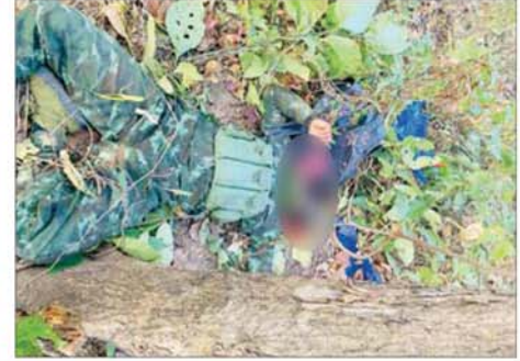
အကြမ်းဖက်သောင်းကျန်းသူများ၏ ရုပ်အလောင်းများ မှတ်တမ်းဓာတ်ပုံ။