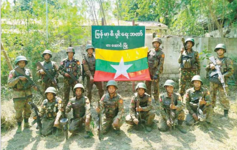
တပ်မတော်စစ်ကြောင်းများက အကြမ်းဖက်သောင်းကျန်းသူများ ယာယီစိုးမိုးထားသည့် ဖားဆောင်းမြို့အား ပြန်လည်ထိန်းချုပ်ရန် တိုက်ခိုက် ထွေရစဉ်။

နေပြည်တော် ဖေဖော်ဝါရီ ၁၅ တပ်မတော်အနေဖြင့် နိုင်ငံတော်တည်ငြိမ်အေးချမ်းပြီး ဖွံ့ဖြိုး တိုးတက်စေရန်အတွက် အကြမ်းဖက်သောင်းကျန်းသူများ ယာယီစိုးမိုး ထားပြီး အကြမ်းဖက်လုပ်ရပ်များ လုပ်ဆောင်လျက်ရှိသည့် ဒေသများ၌ အကြမ်းဖက်ချေမှုန်းမှုစစ်ဆင်ရေးများကို ဒေသခံပြည်သူများ၏ ပူးပေါင်းပါဝင်မှုနှင့်အတူ ကြိုးပမ်းဆောင်ရွက်ပြီး ပြန်လည်ထိန်းချုပ် လျက်ရှိရာ KNPP၊ KNDF အဖွဲ့များနှင့် PDF အမည်ခံအကြမ်းဖက် သမားများ ယာယီစိုးမိုးထားသည့် ကယားပြည်နယ် ဖားဆောင်းမြို့အား လည်း ယနေ့ ဖေဖော်ဝါရီ ၁၅ ရက်တွင် တပ်မတော်က အပြည့်အဝ ပြန်လည်ထိန်းချုပ်ပြီး လိုအပ်သည့် နယ်မြေလုံခြုံရေးနှင့် နယ်မြေ ရှင်းလင်းရေးလုပ်ငန်းများ ဆက်လက်ဆောင်ရွက်လျက်ရှိကြောင်း သိရသည်။ KNPP၊ KNDF အဖွဲ့များနှင့် PDF အမည်ခံအကြမ်းဖက်အဖွဲ့များ အနေဖြင့် ကယားပြည်နယ်အတွင်း အစိုးရ၏အုပ်ချုပ်မှုယန္တရား ပျက် ပြားစေရန်၊ ဒေသခံတိုင်းရင်းသားပြည်သူများ အကြောက်တရားများ လွှမ်းမိုးစေရန်ရည်ရွယ်၍ ၂၀၂၁ ခုနှစ် ဒီဇင်ဘာလမှစ၍ အကြမ်းဖက် အဖျက်အမှောင်လုပ်ရပ်များကို လုပ်ဆောင်ခဲ့ပြီး ကယားပြည်နယ်၏ မြို့တော်လှိုင်ကော်မြို့အား ထိန်းချုပ်ရန် တိုက်ပွဲများဖော်ဆောင်ခဲ့သဖြင့် တပ်မတော်စစ်ကြောင်းများက ဒေသခံပြည်သူများနှင့် ပူးပေါင်း၍ အကြမ်းဖက်သောင်းကျန်းသူများအား တိုက်ခိုက်ချေမှုန်းခဲ့ရာ အကြမ်း ဖက်သောင်းကျန်းသူများသည် ဒီးမော့ဆိုမြို့နယ်အတွင်း ဖရိုဖရဲ ဆုတ်ခွာထွက်ပြေးသွားခဲ့ပြီး မြို့၊ ကျေးရွာများတွင် ကျေးရွာသူ ကျေးရွာ သားများအသွင်ဖြင့် စိမ့်ဝင်ပုံဖျက် ဝင်ရောက်နေရာယူပြီး ပြည်သူများ အား လက်နက်အားကိုးဖြင့် စာမျက်နှာ ၁၀ သို့❖