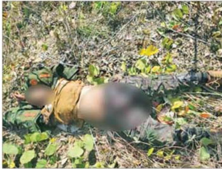
အကြမ်းဖက်သောင်းကျန်းသူများ၏ ရုပ်အလောင်းများ မှတ်တမ်းဓာတ်ပုံ။