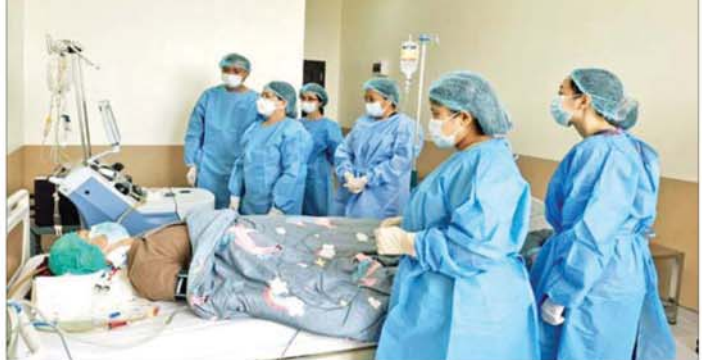
၂၀၂၆ ခုနှစ် ဖေဖော်ဝါရီလအတွင်း ရန်ကုန်ပြည်သူ့ဆေးရုံကြီး၌ ခြင်ဆီအစားထိုးကုသ ဆောင်ရွက်မှုကို တွေ့ရစဉ်။