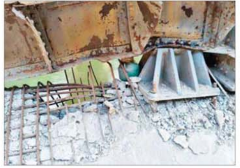
အကြမ်းဖက်သောင်းကျန်းသူများက မိုင်းထောင်ဖောက်ခွဲဖျက်ဆီးခဲ့သည့် ထူးချောင်းတံတား မှတ်တမ်းဓာတ်ပုံ။

အား ယာယီစိုးမိုးထားစဉ်အတွင်း ဘာသာရေးဆိုင်ရာ အဆောက်အအုံများ၊ စာသင်ကျောင်းများ၊ ဌာနဆိုင်ရာ အဆောက်အအုံများ၊ ဆေးရုံ/ ဆေးခန်းများနှင့် လူနေအိမ်များကို အကာအကွယ်ယူ၍ ဘန်ကာများ ဆောက်လုပ်ပြီး တပ်မတော် စစ်ကြောင်းများအား ပစ်ခတ်တိုက်ခိုက်ခြင်း၊ ဒေသခံ ပြည်သူများ၏ နေအိမ်များနှင့် ဈေးဆိုင်ခန်းများအား ဖောက်ထွင်း၍ တန်ဖိုးကြီးပစ္စည်းများ၊ စားသောက်ကုန်နှင့် အသုံး