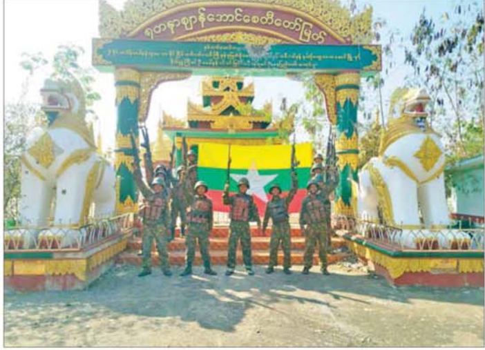
တပ်မတော်စစ်ကြောင်းများက အကြမ်းဖက်သောင်းကျန်းသူများ ယာယီစိုးမိုးထားသည့် ဖားဆောင်းမြို့အား ပြန်လည်တိုက်ခိုက်သိမ်းပိုက်ရရှိမှု။

နေရာများ၌ အဆင့်ဆင့်ပိတ်ဆို့ ဖြစ်ပွားခဲ့ပြီး အကြမ်းဖက်သောင်း လက်တိုက်သိမ်းဆည်းရမိခဲ့သည်။ ခြင်းဆောင်ရွက်ခဲ့သည်။ ဖြစ်စဉ် ကျန်းသူများထံမှ အလောင်း ၆ တပ်မတော် စစ်ကြောင်းများ တွင် တိုက်ပွဲကြီး/ငယ် ရှစ်ကြိမ် လောင်း၊ လက်နက်မျိုးစုံ ၁၁ အနေဖြင့် စာမျက်နှာ ၁၁ သို့ ❖