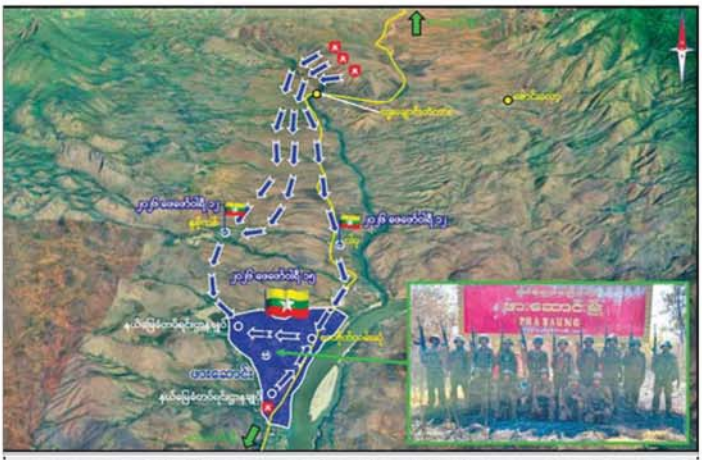
တပ်မတော်စစ်ကြောင်းများက အကြမ်းဖက်သောင်းကျန်းသူများ ယာယီစိုးမိုးထားသည့် ဖားဆောင်းမြို့အား ပြန်လည်ထိန်းချုပ်စဉ်။

စုစုပေါင်း တိုက်ပွဲကြီးလေးကြိမ်ဖြင့် အင်အားအလုံးအရင်းဖြင့် ပိုင်းဝန်းပိတ်ဆို့ တိုက်ခိုက်ခဲ့သော်လည်း အရာရှိ၊ စစ်သည်၊ မိသားစုဝင်များအနေဖြင့် မိမိတပ် ရန်သူလက်သို့ ကျရောက်မှုမရှိစေရေးအတွက် လေ့ရွက်ချည်းကျန်အလံမလဲသည့် စိတ်ဓာတ်၊ တုံးတိုက်တိုက် ကျားကိုက်ကိုက် စိတ်ဓာတ်တို့ဖြင့် ရုပ်ရွပ်ချွဲချွဲပြန်လည် ခုခံတိုက်ခိုက်မှုကြောင့် အကြမ်းဖက်သောင်းကျန်းသူများအနေဖြင့် အဆိုပါတပ်ရင်းဌာနချုပ်အား တိုက်ခိုက်သိမ်းပိုက်နိုင်ခြင်း မရှိဘဲ ထိခိုက်ကျဆုံးမှုများစွာဖြင့် ဆုတ်ခွာထွက်ပြေးခဲ့ရပြီး ဖားဆောင်းမြို့ကိုသာ အဝေးမှ လက်နက်ကြီးဖြင့် ပစ်ခတ်၍ ယာယီစိုးမိုးထားခဲ့ပြီး အဓိက အမာခံအဖွဲ့များက တပ်မတော်စစ်ကူစစ်ကြောင်း အဓိကလာမည့်