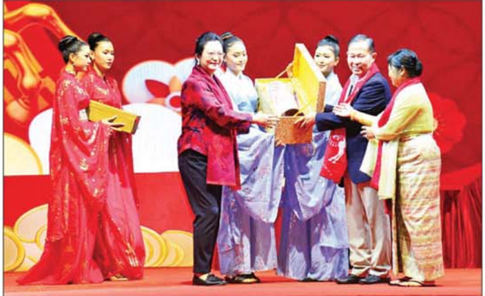
နိုင်ငံတော်လုံခြုံရေးနှင့် အေးချမ်းသာယာရေးကော်မရှင် ဒုတိယဥက္ကဋ္ဌ ဒုတိယဗိုလ်ချုပ်မှူးကြီး ဦးဝင်း၊ ဇနီး ဒေါ်သန်းသန်းနွယ်နှင့် မြန်မာနိုင်ငံဆိုင်ရာ တရုတ်ပြည်သူ့သမ္မတနိုင်ငံ သံအမတ်ကြီး H.E. Ms. Ma Jia တို့ ၂၀၂၆ ခုနှစ် မြင်းနှစ် တရုတ်နှစ်သစ်ကူး အထိမ်းအမှတ်လက်ဆောင်များ အပြန်အလှန် ပေးအပ်ကြစဉ်။

ယုံကြည်မှုနှင့် ရှိရင်းစွဲ ဆွေမျိုး ပေါက်ဖော် ချစ်ကြည်ရင်းနှီးမှုကို အခြေခံပြီး နှစ်နိုင်ငံဆက်ဆံမှု တိုးမြှင့်ဆောင်ရွက်ရေး၊ ကဏ္ဍစုံ ပူးပေါင်းဆောင်ရွက်မှု ပိုမိုတိုးမြှင့် ရေး၊ အေးအတူပူအမျှ အသိုက် အခန်းတည်ဆောက်မှု အရှိန် အဟုန်မြှင့်တင်ရေးနှင့် ဒေသတွင်း တည်ငြိမ်အေးချမ်းရေး ဆိုင်ရာ ကိစ္စရပ်များတွင် ပူးပေါင်း ဆောင်ရွက်ရေးတို့နှင့် ပတ်သက်ပြီး ရင်းနှီးပွင့်လင်းစွာ အမြင်ချင်း ဖလှယ် ဆွေးနွေးနိုင်ခဲ့ပါကြောင်း။ တရုတ်ပြည်သူ့ သမ္မတနိုင်ငံ အစိုးရအနေဖြင့် မြန်မာနိုင်ငံ၏ ငြိမ်းချမ်းရေး လုပ်ငန်းစဉ်များတွင် ကူညီပေးခဲ့မှု၊ မန္တလေးလျှင် အတွက် အစောဆုံး အကူအညီ စေလွှတ်ခဲ့မှုတို့အပေါ် အစဉ် အမှတ်ရပါကြောင်းနှင့် လျှင်တော့ အလွန် ပြန်လည်ထူထောင်ရေး လုပ်ငန်းစဉ်များအတွက် အကူ အညီများ ပေးအပ်မှုအပေါ် များစွာ ကျေးဇူးတင်ရှိကြောင်း၊ ဒေသတွင်း တွင်သာမက နိုင်ငံတကာ အသိုက် အခန်းများတွင် စဉ်ဆက်မပြတ် အပြုသဘောဆောင်သည့်အားပေး ထောက်ခံမှုများ အတွက်လည်း များစွာတန်ဖိုးထားကြောင်း၊ ယခု အခါ မိမိတို့နိုင်ငံတွင် ပါတီစုံဒီမို ကရေစီ အစောဆုံးရွေးကောက်ပွဲ ကို အောင်အောင်မြင်မြင်ဖြင့် ကျင်းပပြီးစီးခဲ့ပြီ ဖြစ်ကြောင်း၊ ရွေးကောက် တင်မြှောက်ခံကိုယ်စားလှယ်များ ဦးဆောင်ပြီး လွှတ်တော်အစည်း အဝေးများကို ခေါ်ယူကျင်းပနိုင် တော့မည်ဖြစ်ကြောင်း၊ လွှတ်တော် မှုတစ်ဆင့် ဒီမိုကရေစီ နည်းလမ်း တကျ ရွေးကောက်တင်မြှောက် သည့် နိုင်ငံတော်သမ္မတ ဦးဆောင် သည့် အစိုးရအဖွဲ့ တစ်ရပ်လည်း သည့် လာမည့် ဧပြီလဆန်းပိုင်း တွင် ပေါ်ပေါက်လာတော့မည် ဖြစ်သည့်အတွက် နှစ်နိုင်ငံအကြား ယခုထက်ပိုသည့် ပူးပေါင်း ဆောင်ရွက်မှုများ ပိုမိုဆောင်ရွက် နိုင်မည်ဟုလည်း ယုံကြည်ကြောင်း။ တရုတ်ရိုးရာ ရာသီခွင်များထဲက “မြင်း” ဆိုသည်မှာ အောင်မြင်မှု