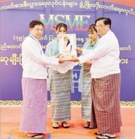
ပြည်ထောင်စုဝန်ကြီး ဒေါက်တာချာလီသန်း MSME ထုတ်ကုန်ပြပွဲနှင့် ဈေးရောင်းပွဲတော်တွင် ဆုရရှိသူတစ်ဦးအား ဆုပေးအပ်ချီးမြှင့်စဉ်။