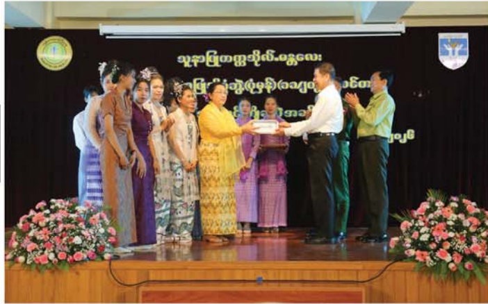
မန္တလေး ဖေဖော်ဝါရီ ၁၄

သူနာပြုတက္ကသိုလ်(မန္တလေး) ပထမနှစ်သူနာပြုသိပ္ပံဘွဲ့(ပုံမှန်) (၁၁/၂၀၂၅)သင်တန်း မောင်မယ်သစ်လွင်ကြိုဆိုပွဲအခမ်းအနားကို ယနေ့နံနက်ပိုင်းက ချမ်းမြသာစည်မြို့နယ်ရှိ သူနာပြုတက္ကသိုလ်(မန္တလေး)ပင်မ(၆)ထပ်ဆောင် Multipurpose Hall တွင် ကျင်းပသည်။