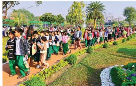
နေရောင်အောက်က သက်ရှိတွေကို စောင့်ရှောက်ဖို့ အိုဇုန်းလွှာကို ထိန်းသိမ်းစို့

ပြပွဲ၊ ပြိုင်ပွဲတွင် ပန်းအလှပင်များ၊ သစ်သီးဝလံစိုက်ခင်းများ၊ ပုံဖော်ပန်းအလှပန်းစုံ၊ တိရစ္ဆာန်အရုပ်များ၊ အပျော်စီးရွက်လှေများ ထားရှိပေးထား၍ အပန်းဖြေလာရောက်သူများ နှစ်သက်ရွှင်လန်းနေကြသည့်ပြင် ဓာတ်ပုံရိုက်သူများဖြင့် စည်ကားလျက်ရှိသည်။ ထို့ပြင် ဌာနဆိုင်ရာပြခန်းများ၊ MSME ပြခန်းများ၊ ပညာပေးပြခန်းများ၊ ပြပွဲ၊ ပြိုင်ပွဲ ခင်းကျင်းထားသည်။ ပန်းမန်၊ ဟင်းသီးဟင်းရွက်၊ သစ်သီးဝလံများကို ကြည့်ရှုလေ့လာကြသူ လူကြီးလူငယ်များ၊ ကျောင်းသား၊ ကျောင်းသူများ များပြားလျက်ရှိသည်။ ယနေ့တွင် ရုံးပိတ်ရက်ဖြစ်တာကြောင့် နံနက်ပိုင်းနှင့် ညနေ