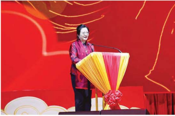
မြန်မာနိုင်ငံဆိုင်ရာ တရုတ်ပြည်သူ့သမ္မတနိုင်ငံ သံအမတ်ကြီး H.E. Ms. Ma Jia နှစ်သစ်ဆုတောင်းစကား ပြောကြားစဉ်။

၂၀၂၅ ခုနှစ်သည် တရုတ်-မြန်မာ ဆက်ဆံရေးအတွက် အရေးပါသည့် နှစ်တစ်နှစ်ဖြစ်ခဲ့ကြောင်း၊ နှစ်နိုင်ငံဆက်ဆံရေးသည် ထိပ်သီးခေါင်းဆောင်များ၏ လမ်းညွှန်မှုအောက်တွင် အဆင့်သစ်တစ်ခုသို့ တက်လှမ်းခဲ့ပါကြောင်း၊ နှစ်နိုင်ငံခေါင်းဆောင်များ နှစ်ကြိမ်တိုင်တိုင် တွေ့ဆုံခဲ့ပြီး ဂုဏ်ပြုစာလွှာများ အပြန်အလှန် ပေးပို့ခဲ့ကြကာ သံတမန်ဆက်ဆံရေး ၇၅ နှစ်ပြည့်ခြင်းကို အခွင့်အခါကောင်းယူ၍ မဟာဗျူဟာမြောက် ပူးပေါင်းဆောင်ရွက်မှုကို နက်ရှိုင်းစေရန်နှင့် တရုတ်-မြန်မာ အေးအတူပူအမျှ ကံကြမ္မာတူညီရေး တည်ဆောက်ရေးကို အရှိန်မြှင့်ဆောင်ရွက်ရန် တွန်းအားပေးခဲ့ကြောင်း၊ ယင်းသည် နှစ်နိုင်ငံဆက်ဆံရေး ဖွံ့ဖြိုးတိုးတက်မှုအတွက် လမ်းညွှန်မှုနှင့် အင်အားကို ပေါ်လွင်စေခဲ့ကြောင်း၊ တရုတ်-မြန်မာ စီးပွားရေး ပူးပေါင်းဆောင်ရွက်မှုတွင် တိုးတက်မှုအသစ်များ ရရှိခဲ့ပြီး နှစ်နိုင်ငံကုန်သွယ်မှုပမာဏမှာ ၁၉ ရာခိုင်နှုန်း တိုးတက်ခဲ့ကာ တရုတ်နိုင်ငံ၏ မြန်မာနိုင်ငံအတွင်း ရင်းနှီးမြှုပ်နှံမှုမှာ ၂၃၀ ရာခိုင်နှုန်း တိုးတက်ခဲ့ပြီး နှစ်နိုင်ငံပြည်သူများအတွက် မြင်သာထင်သာသော