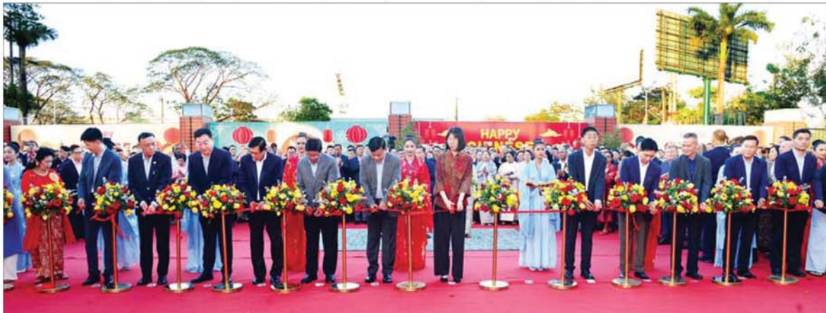
ပြည်ထောင်စုဝန်ကြီးများဖြစ်ကြသည့် ဗိုလ်ချုပ်ကြီး မောင်မောင်အေး၊ ဦးညွှန်ထွန်း၊ ရန်ကုန်တိုင်းဒေသကြီးဝန်ကြီးချုပ် ဦးစိုးသိန်း၊ ကာကွယ်ရေးဦးစီးချုပ်ရုံး (ကြည်း)မှ ဒုတိယဗိုလ်ချုပ်ကြီး ကိုကိုဦး၊ ဒုတိယဝန်ကြီးများ၊ မြန်မာနိုင်ငံဆိုင်ရာ တရုတ်သံရုံးမှ သံမှူးကြီးများ၊ ပြည်ထောင်စုသမ္မတ မြန်မာနိုင်ငံကုန်သည်များနှင့် စက်မှုလက်မှုလုပ်ငန်းရှင်များ အသင်းချုပ် (UMFCCI) ဒုတိယဥက္ကဋ္ဌ၊ မြန်မာ-တရုတ်ချစ်ကြည်ရေးအသင်းဥက္ကဋ္ဌ၊ မြန်မာနိုင်ငံ တရုတ်ကုန်သည်များအသင်းချုပ်ဥက္ကဋ္ဌ၊ မြန်မာ-တရုတ် ဗုဒ္ဓဘာသာနှင့် ယဉ်ကျေးမှု နှီးနှောပလ္လင်ရေးအဖွဲ့ နာယကနှင့် အသင်းအဖွဲ့များမှ တာဝန်ရှိသူများက ၂၀၂၆ ခုနှစ် မြင်းနှစ် တရုတ်နှစ်သစ်ကူးပွဲတော် ဖွင့်ပွဲအခမ်းအနားအား ဖဲကြိုးဖြတ်ဖွင့်လှစ်ပေးစဉ်။

ထို့နောက် နိုင်ငံတော်လုံခြုံရေး နှင့်အေးချမ်းသာယာရေးကော်မရှင် ဒုတိယဥက္ကဋ္ဌနှင့် အဖွဲ့ဝင်များ သည် တရုတ်ရိုးရာယဉ်ကျေးမှု ပြခန်းများ၊ လက်မှုပညာပြခန်း များ၊ တိုင်းရင်းဆေးဝါးပြခန်းများ၊ တရုတ်ရိုးရာ အစားအစာပြခန်း များနှင့် စီးပွားရေးဆိုင်ရာ ပြခန်း များကို လှည့်လည်ကြည့်ရှုကြရာ ပြခန်းတာဝန်ခံများက လိုက်လံ ရှင်းလင်း တင်ပြကြသည်။