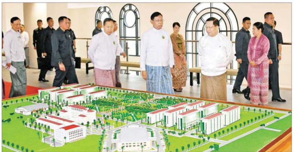
ပြည်ထောင်စုသမ္မတမြန်မာနိုင်ငံတော် ယာယီသမ္မတ နိုင်ငံတော်လုံခြုံရေးနှင့် အေးချမ်းသာယာရေးကော်မရှင်ဥက္ကဋ္ဌ ဗိုလ်ချုပ်မှူးကြီးမင်းအောင်လှိုင် Naypyitaw State Academy ပုံစံငယ်အား ကြည့်ရှုစဉ်။

ဦးမျိုးသန့်တို့ကို အခမ်းအနားကို ဖဲကြိုးဖြတ်ဖွင့်လှစ်ပေးကြသည်။ ဆက်လက်၍ နိုင်ငံတော်ယာယီသမ္မတ နိုင်ငံတော်လုံခြုံရေးနှင့် အေးချမ်းသာယာရေးကော်မရှင် ဥက္ကဋ္ဌနှင့် အခမ်းအနားတက်ရောက် လာကြသူများသည် Naypyitaw State Academy ဘွဲ့နှင်းသဘင်ခန်းမ (ဘက်စုံသုံးခန်းမ) ရှေ့တွင် စုပေါင်းမှတ်တမ်းတင် ဓာတ်ပုံ ရိုက်ကြသည်။ ထို့နောက် နိုင်ငံတော် ယာယီသမ္မတ နိုင်ငံတော်လုံခြုံရေးနှင့် အေးချမ်းသာယာရေး ကော်မရှင် ဥက္ကဋ္ဌက Naypyitaw State Academy ဘွဲ့နှင်းသဘင်ခန်းမ (ဘက်စုံသုံးခန်းမ) ကမ္ဘည်းမော်ကွန်းကို စက်ခလုတ်နှိပ်ဖွင့်လှစ်ပေးပြီး ကမ္ဘည်းမော်ကွန်းအား အမွှေးနံ့သာရည်များဖြင့် ပက်ဖျန်းပေးသည်။ ယင်းနောက် Naypyitaw State Academy ဘွဲ့နှင်းသဘင်ခန်းမ (ဘက်စုံသုံးခန်းမ) အတွင်း လှည့်လည်ကြည့်ရှုကြပြီး တာဝန်ရှိသူများ၏ တင်ပြချက်များအပေါ် နိုင်ငံတော်ယာယီသမ္မတ နိုင်ငံတော်လုံခြုံရေးနှင့် အေးချမ်းသာယာရေး