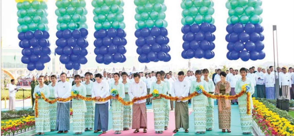
နိုင်ငံတော်လုံခြုံရေးနှင့် အေးချမ်းသာယာရေးကော်မရှင် ဒုတိယဥက္ကဋ္ဌ ဒုတိယဗိုလ်ချုပ်မှူးကြီး စိုးဝင်း၊ ကော်မရှင်အဖွဲ့ဝင် နိုင်ငံတော်ဝန်ကြီးချုပ် ဦးညိုစော၊ ကော်မရှင်အတွင်းရေးမှူး ဗိုလ်ချုပ်ကြီး ရဲဝင်းဦး၊ ပြည်ထောင်စုဝန်ကြီး ဒေါက်တာ ချောချောစိန်နှင့် ဦးမျိုးသန့်တို့ Naypyitaw State Academy ဘွဲ့နှင်းသဘင်ခန်းမ (ဘက်စုံသုံးခန်းမ) ဖွင့်ပွဲအခမ်းအနားကို ဖဲကြိုးဖြတ် ဖွင့်လှစ်ပေးစဉ်။

နိုင်ငံတော် အစိုးရအနေဖြင့် အသိပညာ၊ အတတ်ပညာပြည့်စုံသည့် ပညာတတ်များဖြင့် သာယာဝပြောသည့် အနာဂတ်ကို တည်ဆောက်နိုင်ရေး ပညာရေးကဏ္ဍကို မြှင့်တင်ပေးလျက်ရှိကြောင်း၊ ထိုသို့သော ရည်မှန်းချက်နှင့်အညီ နိုင်ငံတကာအဆင့်မီ Naypyitaw State Academy ကို ၂၀၂၂ ခုနှစ် နိုဝင်ဘာလ ၉ ရက်တွင် တည်ထောင် ဖွင့်လှစ်ခဲ့ကြောင်း၊ ယခုတက္ကသိုလ်ကြီးသည် ဝိဇ္ဇာ၊ သိပ္ပံ၊ စီးပွားရေး၊ ဥပဒေပညာ၊ ဆေးပညာ၊ လူမှုရေးပညာ၊ သတ်စာမန်ရေးရာ၊ အားကစား အစရှိသည့် ဘာသာရပ် နယ်ပယ်စုံလင်စွာဖြင့် ဘက်စုံပညာများကို သင်ကြားပို့ချပေးနေသည့် မြန်မာနိုင်ငံ၏ ပထမဆုံးသော ပညာရပ်ပေါင်းစုံ လေ့လာသင်ယူနိုင်မည့် Comprehensive University လည်းဖြစ်ကြောင်း။ စာမျက်နှာ ၄ သို့ ။