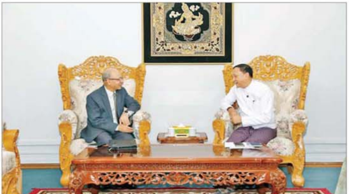
ဒုတိယဝန်ကြီး ဦးကိုကိုကျော် မြန်မာနိုင်ငံဆိုင်ရာ နီပေါသံအမတ်ကြီး မစ္စတာ ဟာရီရီချန်ဒရာ ဂီဇီရေးအား လက်ခံတွေ့ဆုံစဉ်။

အကြား ရှိရင်းခွဲ ခွဲကြည့်ရင်းနှီးမှု ပိုမိုခိုင်မာလာစေရေးတို့ အပေါ် ရင်းနှီးပွင့်လင်းစွာ အမြင်ချင်း ဖလှယ် ဆွေးနွေးကြသည်။ အမြင်ချင်းဖလှယ် ဆွေးနွေး မြန်မာနိုင်ငံဆိုင်ရာ နီပေါ သံအမတ်ကြီးနှင့် တွေ့ဆုံစဉ် နှစ်နိုင်ငံဆက်ဆံရေးနှင့် ပူးပေါင်း ဆောင်ရွက်မှုဆိုင်ရာ ကိစ္စရပ်များ၊ နှစ်နိုင်ငံနှင့် ပြည်သူများအကြား ကာလရှည်ကြာ တည်ရှိပြီးဖြစ် သော ချစ်ကြည်ရင်းနှီးသည့် ဆက်ဆံရေး ပိုမိုတိုးမြှင့်စေရေးတို့ နှင့်စပ်လျဉ်း၍ အမြင်ချင်းဖလှယ် ဆွေးနွေးခဲ့ကြကြောင်း သိရသည်။ သတင်းစဉ်