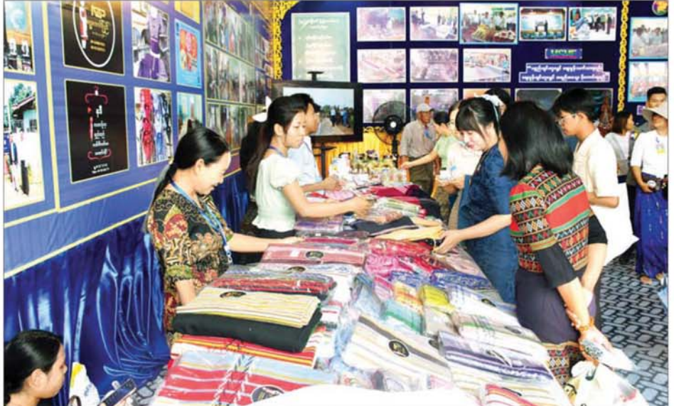
ပြည်ထောင်စုအဆင့် MSME ထုတ်ကုန်ပြပွဲနှင့် ဈေးရောင်းပွဲတော်(နေပြည်တော်) တတိယနေ့တွင် ခင်းကျင်းပြသထားမှုများအား ကြည့်ရှုလေ့လာနေကြသူများကို တွေ့ရစဉ်။