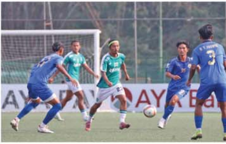
ယနေ့ထုတ် မန္တလေးနေ့စဉ်သတင်းစာတွင် ကြော်ငြာအထူးကဏ္ဍ အချုပ်ပို(၄)မျက်နှာပါ ရှိသည်။

လုပ်ငန်းများ ဖွံ့ဖြိုးတိုးတက်ရေးအတွက် ပိုင်းဝန်း ကူညီဆောင်ရွက်ပေးသွားမည်ဖြစ်ကြောင်း၊ ထုတ်ကုန် ပစ္စည်းများအား ပြည်တွင်း၌ ထုတ်လုပ်နိုင်လျှင် သွင်းကုန်အစားထိုးနိုင်ခြင်း၊ ထုတ်လုပ်မှုအချိန် တိုတောင်းခြင်း၊ စက်အရန်ပစ္စည်းများ လိုအပ်သည့် အချိန်တွင်ရရှိနိုင်ခြင်း၊ စသည့်အကျိုးကျေးဇူးများ ရရှိနိုင်မည်ဖြစ်ကြောင်း၊ တက်ရောက်လာသည့် လုပ်ငန်းရှင်များအနေဖြင့် လယ်ယာသုံးစက်ပစ္စည်း ကိရိယာများ အရည်အသွေးပြည့်စီစွာ ထုတ်လုပ်နိုင် ရေးအတွက် ဆွေးနွေးပေးကြရန် ဖိတ်ခေါ်ပါကြောင်း နှင့် လိုအပ်ချက်များကို ညှိနှိုင်းပေါင်းစပ် ဖြည့်ဆည်း ဆောင်ရွက်ပေးသွားမည်ဖြစ်ကြောင်း ဆွေးနွေး ပြောကြားသည်။ ထို့နောက် တိုင်းဒေသကြီး/ပြည်နယ် MSME အကျင့်စီဥက္ကဋ္ဌများ၊ လုပ်ငန်းရှင်များက တိုင်းဒေသ ကြီး/ပြည်နယ်များအလိုက် လယ်ယာသုံးစက်ပစ္စည်း ကိရိယာများ ထုတ်လုပ်နေမှု၊ စံချိန်စံညွှန်းများနှင့် အညီ အရည်အသွေးပြည့်စီစွာ ထုတ်လုပ်နိုင်ရေး ဆောင်ရွက်နေမှုတို့ကို ဆွေးနွေးတင်ပြကြပြီး ပြည်ထောင်စုဝန်ကြီး ဒေါက်တာ ချာလီသန်းက နိဂုံးချုပ်အမှာစကား ပြောကြားခဲ့ကြောင်း သိရ သည်။ သတင်းစဉ်