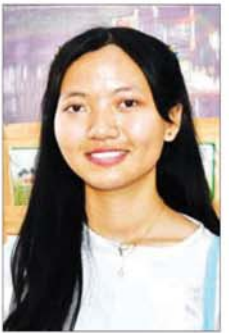
မအေးမြတ်သွယ်

ထိုကဲ့သို့ ပြခန်းများအလိုက် ခင်းကျင်းပြသထားသည့် ဒေသ အလိုက်ထွက်ရှိသောတိုင်းရင်းသား ရိုးရာအစားအစာများ၊ One Region One Product ထုတ်ကုန်များ အပါအဝင် ပြည်ပသို့ တင်ပို့ရောင်းချ နေသည့် MSME ထုတ်ကုန်များ အကြောင်းကို ပြခန်းတာဝန်ရှိသူ များက သက်ဆိုင်ရာ ပြခန်း