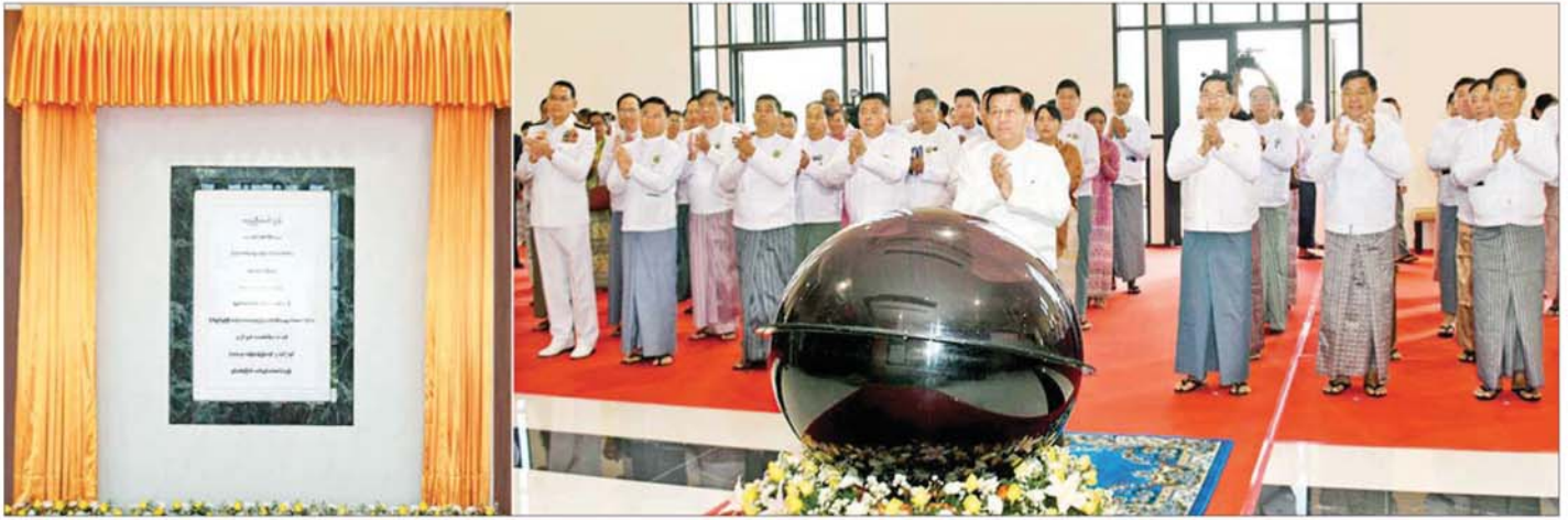
ပြည်ထောင်စုသမ္မတမြန်မာနိုင်ငံတော် ယာယီသမ္မတ နိုင်ငံတော်လုံခြုံရေးနှင့် အေးချမ်းသာယာရေးကော်မရှင်ဥက္ကဋ္ဌ ဗိုလ်ချုပ်မှူးကြီးမင်းအောင်လှိုင် Naypyitaw State Academy ဘွဲ့နှင်းသဘင်ခန်းမ (ဘက်စုံသုံးခန်းမ) ကမ္ဘည်းမော်ကွန်းကို စက်ခလုတ်နှိပ်ဖွင့်လှစ်ပေးစဉ်။