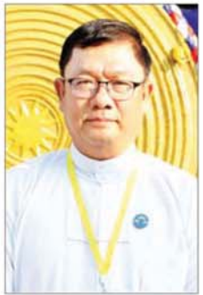
ဦးစန်းကို