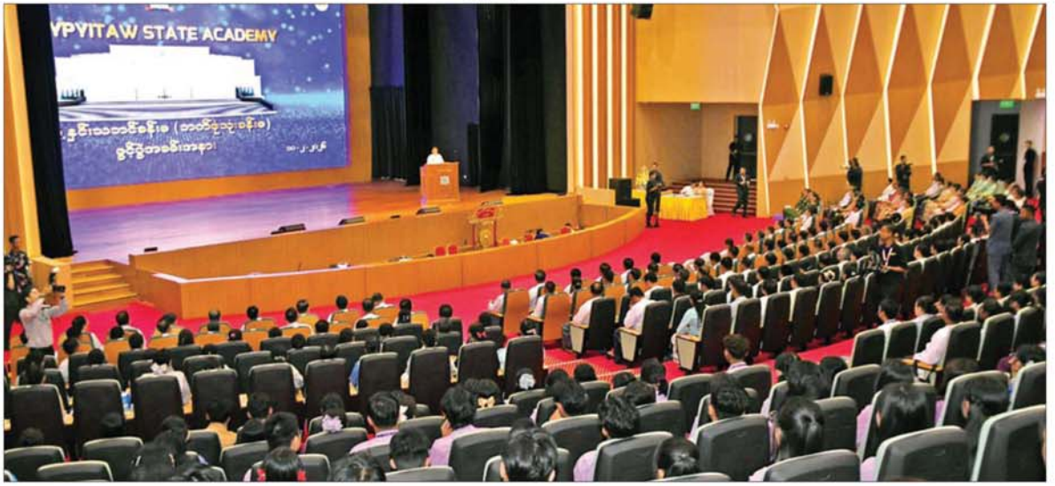
ပြည်ထောင်စုသမ္မတမြန်မာနိုင်ငံတော် ယာယီသမ္မတ နိုင်ငံတော်လုံခြုံရေးနှင့်အေးချမ်းသာယာရေးကော်မရှင်ဥက္ကဋ္ဌ ဗိုလ်ချုပ်မှူးကြီးမင်းအောင်လှိုင် Naypyitaw State Academy ဘွဲ့နှင်းသဘင်ခန်းမ(ဘက်စုံသုံးခန်းမ)ဖွင့်ပွဲအခမ်းအနားတွင် အမှာစကားပြောကြားစဉ်။

ဘွဲ့နှင်းသဘင်ခန်းမဟူသည် မှာ ပညာသင်ယူမှုခရီးလမ်း၏ အောင်မြင်မှု မှတ်တိုင်အဖြစ် တက္ကသိုလ်ပညာရေးအဆင့်တစ်ခု ပြီးမြောက်ကြောင်း အသိအမှတ်ပြု ဘွဲ့လက်မှတ်များ အပ်နှင်းချီးမြှင့် ရာ ထွတ်မြတ်သည့်နေရာမွန်ဖြစ် ကြောင်း၊ တက္ကသိုလ်တစ်ခု၏ ဂုဏ်သိက္ခာကြီးမြတ်မှု၊ ပညာ ဂုဏ်သတင်းကျော်စောမှု၊ သမိုင်း