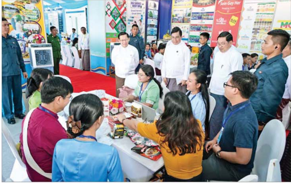
ပြည်ထောင်စုသမ္မတမြန်မာနိုင်ငံတော် ယာယီသမ္မတ နိုင်ငံတော် လုံခြုံရေးနှင့် အေးချမ်းသာယာရေးကော်မရှင်ဥက္ကဋ္ဌ ဗိုလ်ချုပ်မှူးကြီး မင်းအောင်လှိုင် ၂၀၂၆ ခုနှစ် (၇၉)နှစ်မြောက် ပြည်ထောင်စုနေ့ အထိမ်းအမှတ် ပြည်ထောင်စုအဆင့် MSME ထုတ်ကုန်ပြပွဲနှင့် ဈေးရောင်းပွဲတော်ရှိ ပြခန်းများအား ကြည့်ရှုအားပေးစဉ်။

ဥက္ကဋ္ဌနှင့် အဖွဲ့ဝင်များသည် ပြည်ထောင်စုဝန်ကြီးဌာန ပြခန်းများနှင့် အရောင်းပြခန်း တစ်ခုချင်းစီအလိုက် စိတ်ပါဝင်စားစွာ ရင်းရင်းနှီးနှီး လိုက်လံကြည့်ရှုလေ့လာခဲ့ကြပြီး ပြခန်းတာဝန်ခံများ၏ ရှင်းလင်းတင်ပြမှုများအပေါ် သိရှိလိုသည်များ ပြန်လည်မေးမြန်းဆွေးနွေးခဲ့ကြသည်။ နိုင်ငံတော် ယာယီသမ္မတ နိုင်ငံတော်လုံခြုံရေးနှင့် အေးချမ်းသာယာရေးကော်မရှင် ဥက္ကဋ္ဌနှင့် အတူ ကော်မရှင်ဒုတိယဥက္ကဋ္ဌ ဒုတိယဗိုလ်ချုပ်မှူးကြီး စိုးဝင်း၊ ကော်မရှင်အဖွဲ့ဝင် နိုင်ငံတော် ဝန်ကြီးချုပ် ဦးညီစော၊ အမှုဆောင်ချုပ် ဦးအောင်လင်းဒွေး၊ ကော်မရှင်အတွင်းရေးမှူး ဗိုလ်ချုပ်ကြီး စုဝင်းဦး၊ ကော်မရှင်အဖွဲ့ဝင်များ ပြည်ထောင်စု ဝန်ကြီးများ၊ ပြည်ထောင်စုအဆင့် ပုဂ္ဂိုလ်များ၊ တိုင်းဒေသကြီးနှင့် ပြည်နယ်ဝန်ကြီးချုပ်များ၊ ကာကွယ်ရေးဦးစီးချုပ်ရုံးမှ အဆင့်မြင့် တပ်မတော်အရာရှိကြီးများ၊ နေပြည်တော် တိုင်းစစ်ဌာနချုပ် တိုင်းမှူးနှင့် တာဝန်ရှိသူများကလည်း လိုက်ပါ၍ ပြခန်းများအား လှည့်လည်ကြည့်ရှုခဲ့ကြောင်း သိရသည်။ သတင်းစဉ်