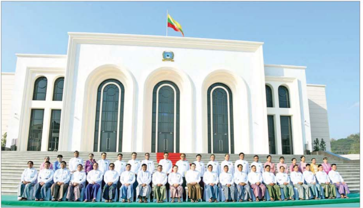
ပြည်ထောင်စုသမ္မတမြန်မာနိုင်ငံတော် ယာယီသမ္မတ နိုင်ငံတော်လုံခြုံရေးနှင့် အေးချမ်းသာယာရေးကော်မရှင်ဥက္ကဋ္ဌ ဗိုလ်ချုပ်မှူးကြီးမင်းအောင်လှိုင်နှင့် အခမ်းအနား တက်ရောက်လာကြသူများ Naypyitaw State Academy ဘွဲ့နှင်းသဘင်ခန်းမ(ဘက်စုံသုံးခန်းမ)ရှေ့တွင် စုပေါင်းမှတ်တမ်းတင်ဓာတ်ပုံရိုက်ကူးကြစဉ်။

Naypyitaw State Academy ၏ ဘွဲ့နှင်းသဘင်ခန်းမကြီးကို ယခုကဲ့သို့ ပြခန်းများ၊ ဖျော်ပွဲရွှင်ပွဲ များဖြင့် စည်ကားသိုက်မြိုက်စွာ ဖွင့်လှစ်ပေးနိုင်သည့် အတွက် လှိုက်လှိုက်လှလှ ဝမ်းမြောက် ဂုဏ်ယူပါကြောင်း။ ယခုဘွဲ့နှင်း သဘင်ပရိဝုဏ်မှ နှစ်စဉ်နှစ်ဆက် ပေါ်ထွက်လာကြမည့် ဘွဲ့ရ မောင်မယ်များအနေဖြင့် နိုင်ငံတော် က အားကိုးအားထားပြုနိုင်ပြီး နိုင်ငံနှင့်လူမျိုးအကျိုးကို သယ်ပိုး နိုင်မည့် လူတော်လူကောင်းများ ဖြစ်လာကြမည်ဟု ယုံကြည် မျှော်လင့်ပါကြောင်း။ မြန်မာနိုင်ငံ ၏ ပိုမိုကောင်းမွန်သည့် အနာဂတ် လူ့ဘောင်ကို တည်ဆောက်နိုင် ရေး ကမ္ဘာနှင့်ရင်ပေါင်တန်းနိုင် မည့် အသိပညာ အတတ်ပညာနှင့် ပြည့်စုံသည့် နှလုံးရည်ပြည့်ဝသည့်