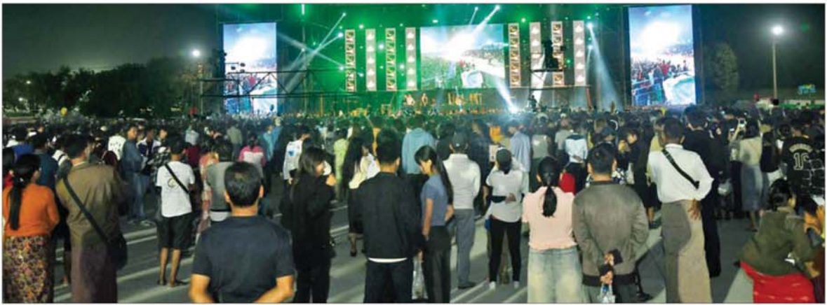
ပြည်ထောင်စုအဆင့် MSME ထုတ်ကုန်ပြပွဲနှင့် ဈေးရောင်းပွဲတော် ဒုတိယနေ့ညပိုင်းတွင် နိုင်ငံကျော်အနုပညာရှင်များ၏ သီဆိုကပြပျော်ဖြေမှုများအား ကြည့်ရှုအားပေးသူများဖြင့် စည်ကားလျက်ရှိသည်ကို တွေ့ရစဉ်။

နေပြည်တော် ဖေဖော်ဝါရီ ၉ (၇၉)နှစ်မြောက် ပြည်ထောင်စု နေ့ကိုကြိုဆိုရက်ပြုသောအားဖြင့် ပြည်ထောင်စုအဆင့် MSME ထုတ်ကုန်ပြပွဲနှင့် ဈေးရောင်းပွဲတော်(နေပြည်တော်)ကို ပြခန်းပေါင်း ၁၂၀ ကျော်နှင့် ပြင်ပကုမ္ပဏီ ၂၉ ခုတို့က ပါဝင်ပြသရောင်းချ လျက်ရှိရာ ယနေ့ပြပွဲဒုတိယနေ့တွင် ကျောင်းသား ကျောင်းသူများ၊ လူငယ်များနှင့် ဒေသခံပြည်သူ အများအပြား လာရောက်ကြည့်ရှု လေ့လာကြသည်။