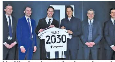
နိုင်ငံပီပြီ။ ဒီအသင်းနဲ့အတူ ဒီအသင်းမှာပဲ ကုန်ဆုံးသွားလို့ပါ အောင်မြင်မှုများစွာလည်း ရယူသွား တယ်ဟု ပြောသည်။ (အပေါ်ပုံ) (NGB)

တူရင် ဖေဖော်ဝါရီ ၉ အသင်းနှင့်အတူ ၂၀၂၃-၂၀၂၄ ဂျူပင် တပ် အသင်းသည် အသင်းကွင်းလယ်တိုက်စစ်ကစားသမား ယီဒက်စ်အား ၂၀၃၀ပြည့်နှစ်အထိ သက်တမ်းတိုးစာချုပ် ချုပ်ဆိုခဲ့ကြောင်း အတည်ပြု ထုတ်ပြန်ကြေညာခဲ့သည်။ အဆိုပါ ကွင်းလယ်တိုက်စစ်ကစားသမားသည် ဂျူပင်တပ်