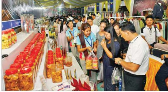
ပြည်ထောင်စုအဆင့် MSME ထုတ်ကုန်ပြပွဲနှင့် ဈေးရောင်းပွဲတော်တွင် အားပေးကြည့်ရှုဝယ်ယူကြသူ များဖြင့် စည်ကားလျက်ရှိသည်ကို တွေ့ရစဉ်။

ကနေရရှိလာတဲ့ စွန့်ပစ် အခါမှာလည်း အကျိုးကျေးဇူး အများကြီးရှိပါတယ်။ အဓိကက တော့ စိုက်ပျိုးရေးကို အလေအလွင့် မရှိဘဲ လိုအပ်သလောက် ထိထိရောက်ရောက် အသုံးပြုနိုင် အောင် အထောက်အကူပေးပါ တယ်။ ဒါကြောင့်တောင်သူတွေကို လာရောက်လေ့လာဖို့ ဖိတ်ခေါ်ချင် ပါတယ်။ ပြီးတော့ တောင်သူ အကျိုးပြုစိမ်းနိုးတွေ၊ လုပ်ငန်း တွေ၊ နည်းပညာတွေကို အထောက် အပံ့ပေးနေတဲ့ စိုက်ပျိုးရေးနဲ့ သက်ဆိုင်တဲ့ လယ်ယာကဏ္ဍနဲ့ သက်ဆိုင်တဲ့ အစိုးရဌာနတွေက တာဝန်ရှိသူတွေကိုလည်း လေ့လာ ဖို့ဖိတ်ခေါ်ချင်ပါတယ်။