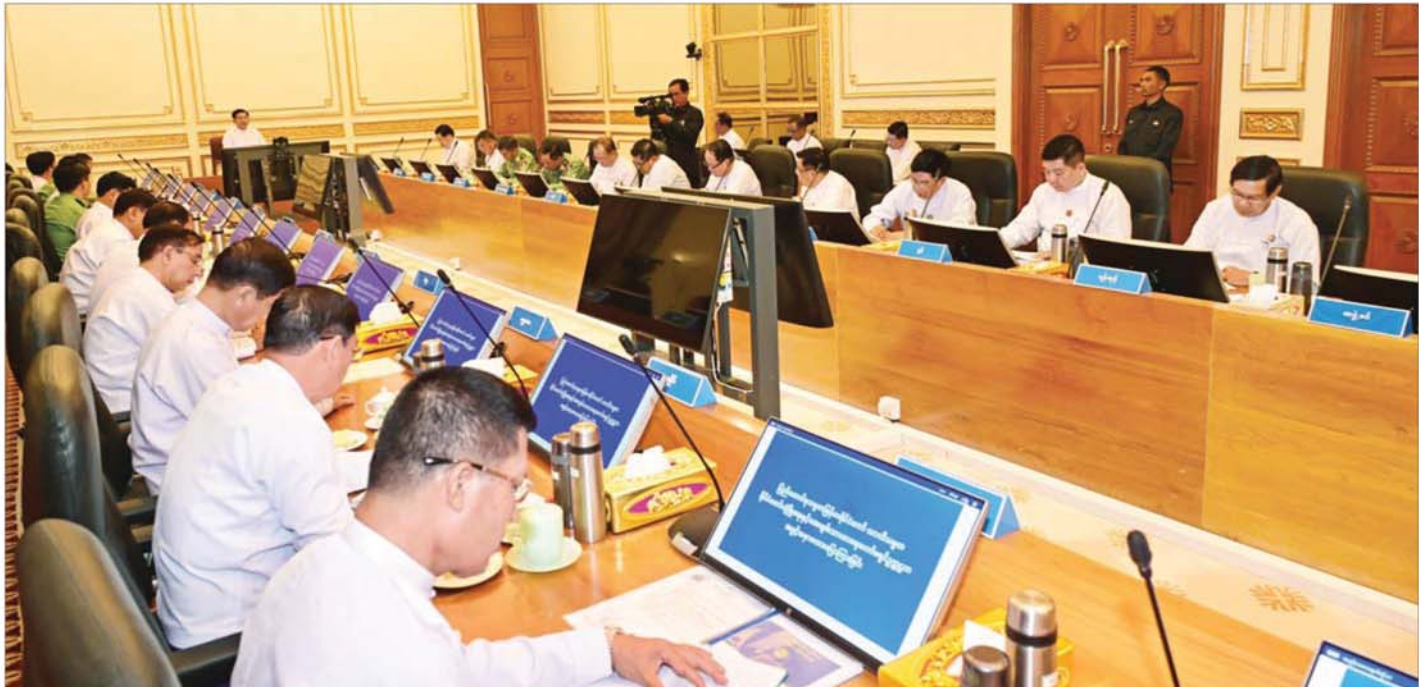
ပြည်ထောင်စုသမ္မတမြန်မာနိုင်ငံတော် ယာယီသမ္မတ နိုင်ငံတော်လုံခြုံရေးနှင့် အေးချမ်းသာယာရေးကော်မရှင်ဥက္ကဋ္ဌ ဗိုလ်ချုပ်မှူးကြီးမင်းအောင်လှိုင် ရွေးကောက်ပွဲကော်မရှင်ဥက္ကဋ္ဌ၊ နေပြည်တော်ကောင်စီဥက္ကဋ္ဌ တိုင်းဒေသကြီးနှင့် ပြည်နယ်ဝန်ကြီးချုပ်များအား တွေ့ဆုံအမှာစကားပြောကြားစဉ်။

နိုင်ငံတော်၏ဂုဏ်သိက္ခာအတွက် နိုင်ငံကြီးသားပိသစွာမဲပေးခဲ့ကြသည့် ပြည်သူများ၊ ရွေးကောက်ပွဲကို စနစ်တကျ အောင်မြင်စွာကျင်းပနိုင်ခဲ့သည့် ရွေးကောက်ပွဲကော်မရှင်နှင့် တာဝန်ရှိသူများအား နိုင်ငံတော်က အသိအမှတ်ပြုကျေးဇူးတင် နောင်တစ်ချိန်ပြုလုပ်သွားမည့် ရွေးကောက်ပွဲများတွင် ယခုထက်ပိုမိုကောင်းမွန်သည့် ရွေးကောက်ပွဲဖြစ်အောင် ကြိုးပမ်းဆောင်ရွက်သွားကြရမည်