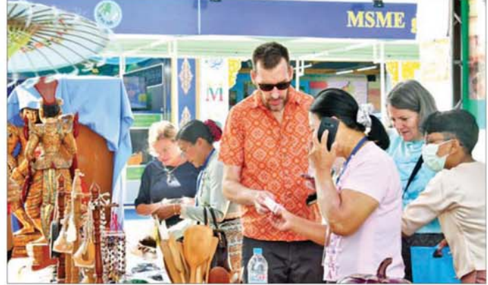
ပြည်ထောင်စုအဆင့် MSME ထုတ်ကုန်ပြပွဲနှင့် ဈေးရောင်းပွဲတော်တွင် နိုင်ငံခြားသားများ လာရောက် လေ့လာဝယ်ယူအားပေးလျက်ရှိသည်ကို တွေ့ရစဉ်။

တနိုင်းခရိုင်ထွက် ဆီမှန်ညှင်းနဲ့ ချိုဖွေခရိုင်ထွက် သစ်ကြားသီး စတာတွေကို ခင်းကျင်းပြသထား တဲ့အပြင် ဒေသထွက်ကျောက်စိမ်း လက်ဝတ်ရတနာတွေ၊ ပယင်း၊ ရှူဆေး၊ ဖျန်းဆေးနဲ့ လိမ်းဆေး ဆီတွေကို ခင်းကျင်းပြသရောင်းချ ပေးလျက်ရှိပါတယ်။ ပြည်တွင်း ကုန်ကြမ်းများကို ၁၀၀ ရာခိုင်နှုန်း အသုံးပြုထားတဲ့ ပြည်နယ်ရဲ့ စားသောက်ကုန် လုပ်ငန်းတွေ၊ ကချင်ရိုးရာ ရက်ကန်းထည်တွေ လည်းပါပါတယ်” ဟု ကချင် ပြည်နယ် စီးပွားရေးရာဝန်ကြီး