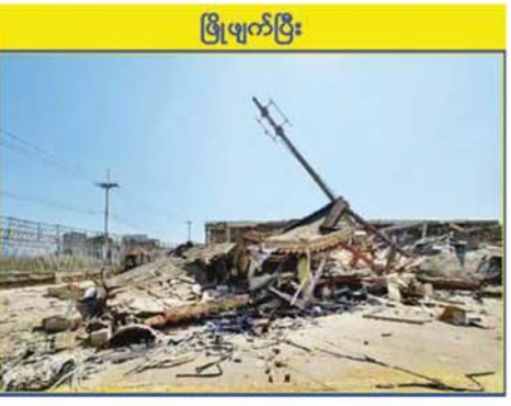
KK Park နယ်မြေအပိုင်း(၃)တွင် တရားမဝင် ဆောက်လုပ်ထားသည့် နှစ်ထပ် လူနေအဆောက်အအုံများအား လေအိုးမီးအိုးဖြင့် ဖျက်ဆီးစဉ်။

အပိုင်း(၃)အတွင်းရှိ တရားမဝင် အဆောက်အအုံများအနက် ယာဉ် ယန္တရားများအသုံးပြု၍ ဖြိုချ ဖျက်ဆီးခြင်းများ ဆောင်ရွက်ပြီးစီး ခဲ့သည့် တရားမဝင်အဆောက် အအုံများကို အလုံးစုံဖျက်ဆီးစေရန် အတွက် လေအိုးမီးအိုးဖြင့် ထပ်မံ