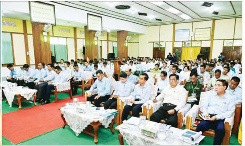
ပြည်ထောင်စုသမ္မတမြန်မာနိုင်ငံတော် ယာယီသမ္မတ နိုင်ငံတော်လုံခြုံရေးနှင့် အေးချမ်းသာယာရေးကော်မရှင်ဥက္ကဋ္ဌ ဗိုလ်ချုပ်မှူးကြီး မင်းအောင်လှိုင် ပန်းတောင်းမြို့ရှိ မြို့နယ်အဆင့် ဌာနဆိုင်ရာတာဝန်ရှိသူများ၊ မြို့မိမြို့ဖများနှင့် တွေ့ဆုံပွဲတွင် အမှာစကားပြောကြားစဉ်။