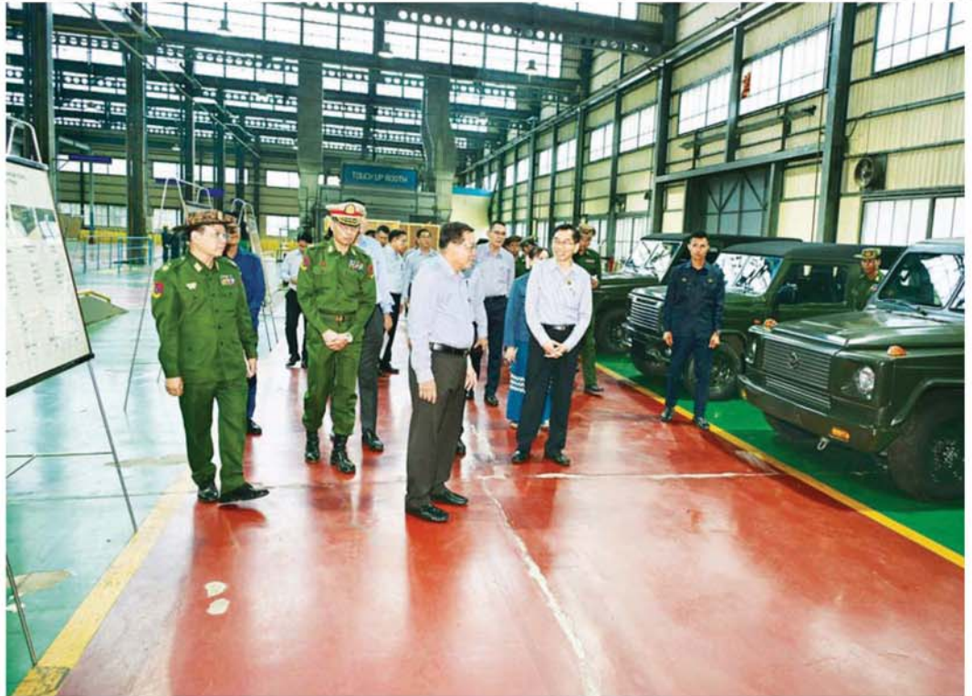
နိုင်ငံတော်လိုအပ်ရေးနှင့် အေးချမ်းသာယာရေးကော်မရှင်ဥက္ကဋ္ဌ တပ်မတော်ကာကွယ်ရေးဦးစီးချုပ် ဗိုလ်ချုပ်မှူးကြီး မင်းအောင်လှိုင် တပ်မတော် အကြီးစားစက်ရုံ(ထုံးဘို) ၌ ထုတ်လုပ်ထားရှိသည့် မော်တော်ယာဉ်များအား လိုက်လံကြည့်ရှုစစ်ဆေးစဉ်။