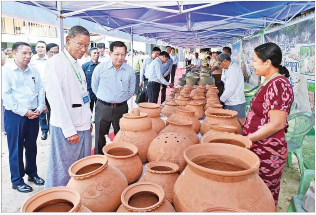
ပြည်ထောင်စုသမ္မတမြန်မာနိုင်ငံတော် ယာယီသမ္မတ နိုင်ငံတော်လုံခြုံရေးနှင့် အေးချမ်းသာယာရေးကော်မရှင်ဥက္ကဋ္ဌ ဗိုလ်ချုပ်မှူးကြီး မင်းအောင်လှိုင် ပန်းတောင်း မြို့နယ်အတွင်းရှိ အသေးစား၊ အငယ်စားနှင့် အလတ်စားစီးပွားရေး(MSME) လုပ်ငန်းများမှထွက်ရှိသည့် ထုတ်ကုန်ပစ္စည်းများအား စိတ်ပါဝင်စားစွာ လှည့်လည် ကြည့်ရှုစဉ်။

နိုင်ငံတော်အနေဖြင့် ပညာရည်မြင့်မားရေး အားပေးဆောင်ရွက် စိုက်ပျိုးမွေးမြူရေးလုပ်ငန်းများ ဖွံ့ဖြိုးတိုးတက် စေရေးအတွက် ဒေသတွင်း ပညာတတ်အရင်းအမြစ် များလိုအပ်သဖြင့် နိုင်ငံတော်အနေဖြင့် ပညာရည် မြင့်မားရေး အားပေးဆောင်ရွက်လျက်ရှိကြောင်း၊ ထို့ကြောင့် မိမိတို့ဒေသအလိုက် ပညာရည်မြင့်မား ရေး ဝိုင်းဝန်းဆောင်ရွက်ပေးကြစေလိုကြောင်း၊ ပညာသင်ကြားလျက်ရှိသည့် ကျောင်းသား ကျောင်းသူ