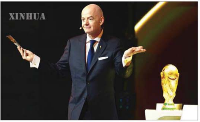
Lenovo ဥက္ကဋ္ဌနှင့် စီအီးအိုဖြစ်သူ ယန်ယွမ်ချင့် ပိုင်းအရ Lenovo ၏ AI နည်းပညာများကို အသုံးပြုမည့် အဆင့်မြှင့်ဆုံး အားကစားပြိုင်ပွဲတစ်ခုတွင် ၂၀၂၆ ဖီဖာကမ္ဘာ့ဖလားပြိုင်ပွဲသည် နည်းပညာဖြစ်လာမည်ဟု ပြောကြားခဲ့သည်။ ဆင်ပွာ

၏မြင်ကွင်းမှ ရိုက်ကူးထားသော ဗီဒီယိုမှတ်တမ်း Referee View အား အဆင့်မြှင့်ထားသော စားရှင်းတစ်မျိုးအပါအဝင် ရှင်းလင်းတိကျသည့် အေအိုင်နည်းပညာများကို အသုံးပြုသွားမည်ဖြစ်သည်။ အဆိုပါ နည်းပညာများကို Lenovo ကုမ္ပဏီက ကူညီပံ့ပိုးပေးမည်ဖြစ်သည်။ ၂၀၂၆ ခုနှစ် ဖီဖာကမ္ဘာ့ဖလားပြိုင်ပွဲသည် ကမ္ဘာပေါ်တွင် အကြီးကျယ်အခမ်းအနားဆုံး ပြိုင်ပွဲကြီးဖြစ်လာမည်ဖြစ်ကြောင်း၊ ဖီဖာနှင့် Lenovo တို့သည် ဒစ်ဂျစ်တယ်နည်းပညာများနှင့် ဉာဏ်ရည်တူ နည်းပညာဖြစ်သည့် 'Football AI' ကို အပြည့်အဝ အသုံးပြုပြီး ပြိုင်ပွဲဝင်အသင်းများနှင့် ပြိုင်ပွဲတာဝန်ရှိသူများကို အထောက်အကူပေးသွားမည်ဖြစ်ကြောင်းနှင့် ကမ္ဘာတစ်ဝန်းက ပရိသတ်များကိုလည်း အံ့မခန်း အတွေ့အကြုံခံစားရစေမည်ဖြစ်ကြောင်း ဖီဖာဥက္ကဋ္ဌ ဂျန်နီအင်ဖန်တိုနိုက ပြောသည်။