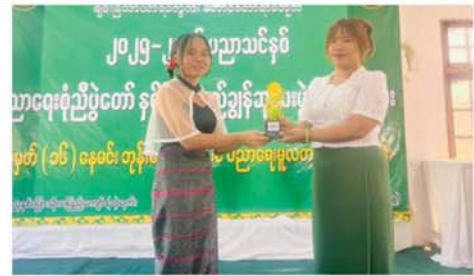
ဆောင်အဖွဲ့များက ဆရာ၊ ဆရာမ ဗုဒ္ဓသာသနံစံရတီဌတူသုံးကြိမ် ရွတ်ဆို၍ ရုပ်သိမ်းလိုက်ကြောင်း ပေးအပ်ကြပြီး အခမ်းအနားကို သိရသည်။ (အပေါ်)(၀၇၃)

များက မြတ်ဆရာသီချင်းဖြင့် ဖျော်ဖြေတင်ဆက်ကြသည်။ ထို့ နောက် တာဝန်ရှိသူများက ၂၀၂၄ -၂၀၂၅ ပညာသင်နှစ်တွင် ထူးချွန် ဆုရရှိကြသူများ၊ အားကစား ထူးချွန်ဆုရရှိကြသူများ၊ တရုတ် နှင့်အင်္ဂလိပ်စကားပြောသင်တန်း ဆုရ ကျောင်းသား၊ ကျောင်းသူ များကို ထူးချွန်ဆုများချီးမြှင့်ပေး အပ်ကြပြီး ကျောင်းအကျိုးတော်