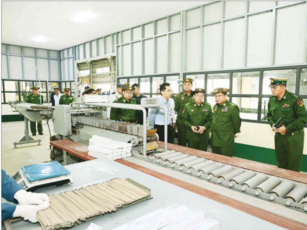
နိုင်ငံတော်လုံခြုံရေးနှင့် အေးချမ်းသာယာရေးကော်မရှင်ဥက္ကဋ္ဌ တပ်မတော်ကာကွယ်ရေးဦးစီးချုပ် ဗိုလ်ချုပ်မှူးကြီး မင်းအောင်လှိုင် တပ်မတော် အကြီးစားစက်ရုံ (ဆင်တဲ) လယ်ယာသုံးစက်ပစ္စည်းများနှင့် ဆက်စပ်ပစ္စည်းများ ထုတ်လုပ်နေမှုကို ကြည့်ရှုစစ်ဆေးစဉ်။

နေပြည်တော် ဇန်နဝါရီ ၈ နိုင်ငံတော် လုံခြုံရေးနှင့် အေးချမ်းသာယာရေး ကော်မရှင်ဥက္ကဋ္ဌ တပ်မတော်ကာကွယ်ရေးဦးစီးချုပ် ဗိုလ်ချုပ်မှူးကြီး မင်းအောင်လှိုင်သည် ကော်မရှင် အတွင်းရေးမှူး ဗိုလ်ချုပ်ကြီး ရဲဝင်းဦး၊ ခရီးစဉ်တွင် လိုက်ပါလာသည့်အဖွဲ့ဝင်များ၊ တောင်ပိုင်းတိုင်း စစ်ဌာနချုပ်တိုင်းမှူးနှင့် တာဝန်ရှိသူများလိုက်ပါ၍ ယနေ့တွင် ပဲခူးတိုင်းဒေသကြီး ဆင်တဲနှင့် ထုံးဘို တို့ရှိ နယ်မြေခံတပ်မတော်အကြီးစားစက်ရုံများ၌ လယ်ယာသုံးစက်ကိရိယာများ၊ မော်တော်ယာဉ်များ ထုတ်လုပ်နေမှု အခြေအနေများကို သွားရောက် ကြည့်ရှုစစ်ဆေးသည်။ လိုအပ်သည်များ လမ်းညွှန်မှာကြား ဦးစွာ နိုင်ငံတော်လုံခြုံရေးနှင့် အေးချမ်းသာယာ ရေးကော်မရှင်ဥက္ကဋ္ဌ တပ်မတော်ကာကွယ်ရေးဦးစီး ချုပ်နှင့်အဖွဲ့ဝင်များသည် နံနက်ပိုင်းတွင် တပ်မတော် အကြီးစားစက်ရုံ (ဆင်တဲ) သို့ ရောက်ရှိကြပြီး စက်ရုံမှ ထုတ်လုပ်ထားရှိသည့် လက်ဆွဲကောက်စိုက်စက်နှင့် Manual Drum Seeder များအား ကြည့်ရှုစစ်ဆေး ကာ တာဝန်ရှိသူများ၏ ရှင်းလင်းတင်ပြမှုများအပေါ် နိုင်ငံတော် လုံခြုံရေးနှင့် အေးချမ်းသာယာရေး ကော်မရှင်ဥက္ကဋ္ဌ တပ်မတော်ကာကွယ်ရေးဦးစီးချုပ် က လိုအပ်သည်များ လမ်းညွှန်မှာကြားသည်။ ရှင်းလင်းတင်ပြ ထို့နောက် စက်ရုံအစည်းအဝေးခန်းမတွင် စက်ရုံ များက စက်ရုံသမိုင်းအကျဉ်း၊ ဝန်ထမ်းများ ခန့်အပ် ထားရှိမှု၊ ရည်မှန်းချက်တာဝန်များ၊ စက်ရုံမှလယ်ယာသုံး စက်ပစ္စည်းများနှင့် ဆက်စပ်ပစ္စည်းများ ထုတ်လုပ် လျက်ရှိမှု၊ စက်ပစ္စည်းများ ပြုပြင်ထိန်းသိမ်းရေး စာမျက်နှာ ၃ သို့ ၀