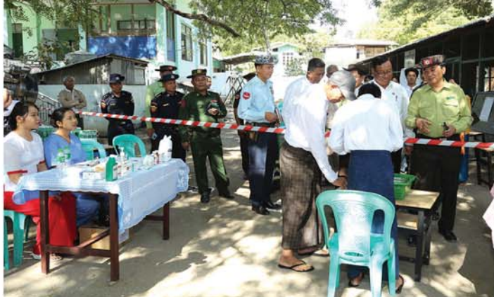
(မန္တလေးနေ့စဉ်)

အဆိုပါမဲရုံများသို့ ရောက်ရှိစဉ် တိုင်းဒေသကြီးဝန်ကြီးချုပ်က ခရိုင်၊ မြို့နယ်စီမဲခန့်ခွဲရေးနှင့် အုပ်ချုပ်ရေးကော်မတီဥက္ကဋ္ဌများနှင့် တိုင်းဒေသကြီး ရွေးကောက်ပွဲကော်မရှင်အဆင့်ဆင့်မှတာဝန်ရှိသူများအား ပါတီစုံဒီမိုကရေစီအထွေထွေရွေးကောက်ပွဲ အပိုင်း(၂)အောင်မြင်စွာကျင်းပနိုင်ရေး လုံခြုံရေးသတ်၊ လုံခြုံရေးအသိတို့ဖြင့် ပိုမိုကောင်းမွန်အောင် ဟန်ချက်ညီညီတိုးမြှင့်ဆောင်ရွက်သွားရေး၊ မဲဆန္ဒပေးသူများ ဆန္ဒမဲပေးရာတွင် အချိန်ကြန့်ကြာမှုမရှိစေဘဲ လွယ်ကူအောင်မြင်စွာဆောင်ရွက်နိုင်ရေး၊ မဲစာရင်းတွင် နံပါတ်စဉ် မသိသေးသောမဲဆန္ဒရှင်များကို မြန်ဆန်လွယ်ကူစွာ သိရှိနိုင်ရန်အတွက် ရွေးကောက်ပွဲကော်မရှင်က စီစဉ်ဆောင်ရွက်ပေးထားသည့် Tablet များကို ကျွမ်းကျင်ပိုင်နိုင်စွာဖြင့် အသုံးပြုဆောင်ရွက်သွားရေးတို့ကို မှာကြားပြီးနောက် လိုအပ်သည်များကို ပေါင်းစပ်ညှိနှိုင်းဖြည့်ဆည်းဆောင်ရွက်ပေးခဲ့ကြောင်း၊ ၂၀၂၅ ခုနှစ် ပါတီစုံဒီမိုကရေစီအထွေထွေရွေးကောက်ပွဲအပိုင်း(၂)ကို ၂၀၂၆ ခုနှစ်၊ ဇန်နဝါရီလ ၁၁ ရက်တွင် ကျင်းပသွားမည်ဖြစ်ပြီး ကျောက်ပန်းတောင်းမြို့နယ်တွင် မဲပေးပိုင်ခွင့်ရှိသည့် မဲဆန္ဒရှင်ပေါင်း ၁၄၇၇၉ ဦးအတွက် မဲရုံပေါင်း(၂၀၀)ရုံ၊ သာစည်မြို့နယ်တွင် မဲပေးပိုင်ခွင့် ရှိသည့် မဲဆန္ဒရှင်ပေါင်း ၁၅၉၅၀ ဦးအတွက် မဲရုံပေါင်း (၂၁၀)ရုံ၊ ဝမ်းတွင်းမြို့နယ်တွင် မဲပေးပိုင်ခွင့်ရှိသည့် မဲဆန္ဒရှင်ပေါင်း ၁၆၆၄၅ ဦး အတွက် မဲရုံပေါင်း(၂၁၈) ရုံနှင့် အပိုင်း(၂)၌ မန္တလေးတိုင်းဒေသကြီးအတွင်း မြို့နယ် (၉)မြို့နယ်ပါဝင်ပြီး မဲပေးပိုင်ခွင့်ရှိသည့် မဲဆန္ဒရှင်ပေါင်း ၁၀၈၄၅၇ ဦးအတွက် မဲရုံပေါင်း(၁၀၇၃)ရုံကို စနစ်တကျဖြင့်လှစ်ဆောင်ရွက်ထားရှိကြောင်း သိရသည်။