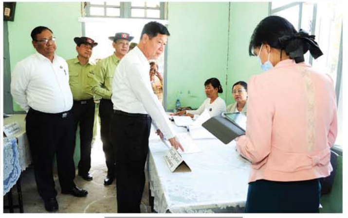
မန္တလေး ဇန်နဝါရီ ၇

မန္တလေးတိုင်းဒေသကြီးအစိုးရအဖွဲ့ဝန်ကြီးချုပ် ဦးမျိုးအောင်သည် တိုင်းဒေသကြီးအစိုးရအဖွဲ့ဝင် ဝန်ကြီးများနှင့်အတွင်းရေးမှူး၊ တာဝန်ရှိသူများလိုက်ပါပြီး ၂၀၂၆ ခုနှစ်၊ ဇန်နဝါရီ ၁၁ ရက်တွင် ကျင်းပမည့် ၂၀၂၅ ခုနှစ် ပါတီစုံဒီမိုကရေစီအထွေထွေရွေးကောက်ပွဲ အပိုင်း(၂)တွင်ပါဝင်သည့် မန္တလေးတိုင်းဒေသကြီးအတွင်းရှိ ကျောက်ပန်းတောင်းမြို့နယ်၊ သာစည်မြို့နယ်နှင့် ဝမ်းတွင်းမြို့နယ်များအတွင်း မဲရုံများ ကြိုတင်ပြင်ဆင်ဆောင်ရွက်ထားရှိမှုနှင့် ရွေးကောက်ပွဲဆိုင်ရာလုပ်ငန်းစဉ်များ ဆောင်ရွက်နေမှုများကို ယနေ့နံနက်ပိုင်းက လိုက်လံကြည့်ရှုစစ်ဆေးခဲ့သည်။