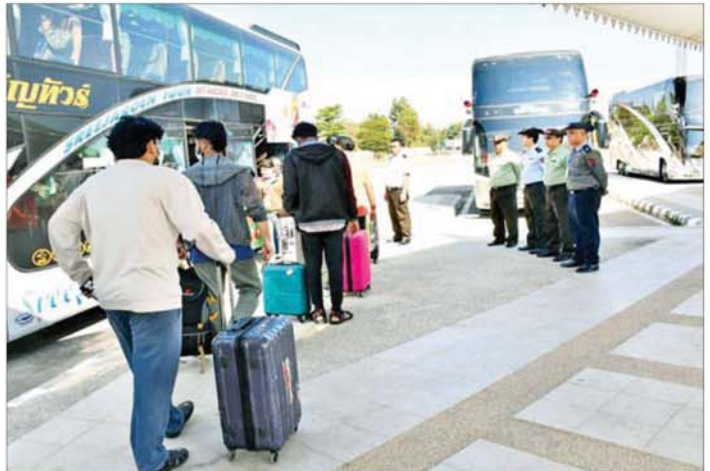
မြဝတီ-ရွှေကုက္ကိုလ်နယ်မြေတွင် တရားမဝင်အွန်လိုင်းလောင်းကစားမှုများ၊ အွန်လိုင်းလိမ်လည်မှုများ၊ ဒုစရိုက်မှုများ ကျူးလွန်ခဲ့ကြသည့် တရားမဝင်ပြည်ပနိုင်ငံသားများအား လွှဲပြောင်းပေးအပ်စဉ်။ များနှင့် တက်ကြွစွာပူးပေါင်း များနှင့် လူကုန်ကူးခံရသည့် နိုင်ငံ ညှိနှိုင်းဆောင်ရွက်လျက်ရှိကြောင်း ဆောင်ရွက်လျက်ရှိသည့်အပြင် မြားသားများကို သက်ဆိုင်ရာ နိုင်ငံ သိရသည်။ အကြောင်းအမျိုးမျိုးကြောင့် ဒုက္ခ များသို့ အမြန်ဆုံး ပြည်ပနိုင်ငံသား ရောက်နေကြသော နိုင်ငံခြားသား ပြောင်းပေးနိုင်ရေး ထိရောက်စွာ သတင်းစဉ် ၀-၀-၀-၀