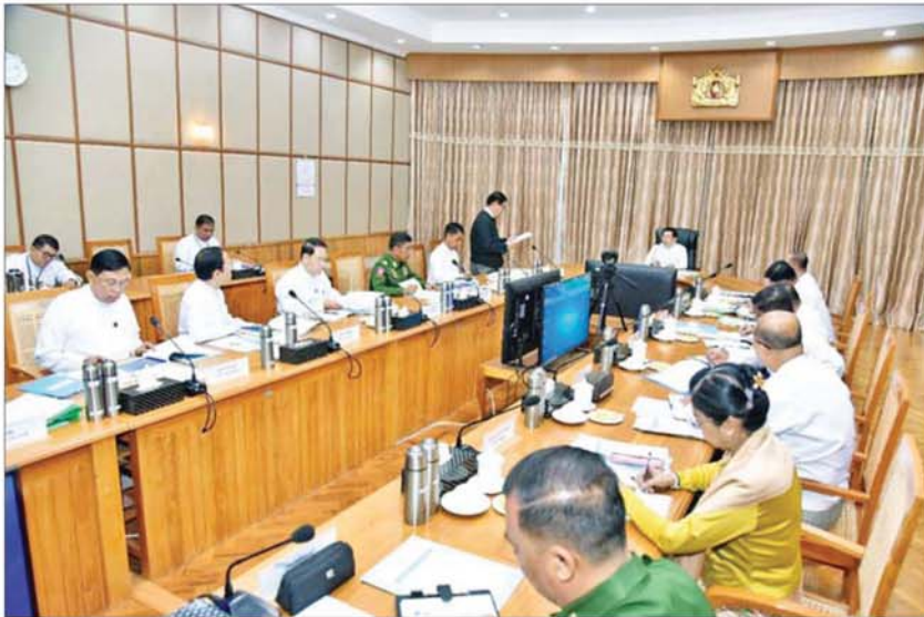
လွှတ်တော်အစည်းအဝေးကျင်းပရေး ဗဟိုကော်မတီ၏ ပထမအကြိမ်လုပ်ငန်းညှိနှိုင်းအစည်းအဝေး ကျင်းပစဉ်။

ရှေ့မိုးမှ ကျင်းပပြုလုပ်သွားမည်ဖြစ်သည့်အတွက် လွှတ်တော်အစည်းအဝေးများ အောင်မြင်စွာကျင်းပနိုင်ရေး ဗဟိုကော်မတီနှင့် လုပ်ငန်းကော်မတီများက သက်ဆိုင်ရာ လုပ်ငန်းကဏ္ဍများအလိုက် ကြိုတင်ပြင်ဆင်မှုလုပ်ငန်းများကို ဆောင်ရွက်ထားကြရမည်ဖြစ်ကြောင်း။