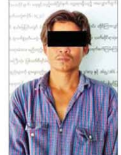
သိန်းဇော်(ခ)ကိုသိန်း