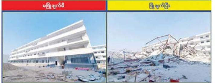
KK Park နယ်မြေ အပိုင်း(၂)တွင် တရားမဝင်အဆောက်အအုံလုပ်ထားသည့် လေးထပ်လူနေအဆောက်အအုံ ဖြိုချဖျက်ဆီးမှုကို တွေ့ရစဉ်။