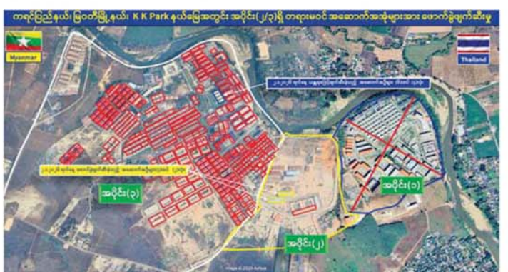
ကရင်ပြည်နယ် မြဝတီမြို့နယ် KK Park နယ်မြေအတွင်း အပိုင်း(၂/၃)ရှိ တရားမဝင်အဆောက်အအုံများအား ဖောက်ခွဲဖျက်ဆီးမှုကို တွေ့ရစဉ်။

နှစ်လုံး စုစုပေါင်း တရားမဝင်အဆောက်အအုံ ခြောက်လုံးတို့ကို ထပ်မံဖြိုချဖျက်ဆီးခဲ့သဖြင့် KK Park နယ်မြေအတွင်းရှိ တရားမဝင်အဆောက် အအုံ စုစုပေါင်း ၆၃၅ လုံးအနက် ၅၅၅ လုံးကို စနစ် တကျ ဖြိုချဖျက်ဆီးပြီးဖြစ်ကြောင်း သိရသည်။ ထို့ပြင် KK Park နယ်မြေအတွင်းရှိ တရားမဝင် အဆောက်အအုံများအနက် ယာဉ်ယန္တရားများ အသုံးပြု၍ ဖြိုချဖျက်ဆီးခြင်းများ ဆောင်ရွက်ပြီးစီးခဲ့ သည့် တရားမဝင်အဆောက်အအုံများကို အလုံးစုံ ပျက်စီးစေရန်အတွက် လေအိုးမီးအိုးဖြင့် ထပ်မံ ဖျက်ဆီးခြင်းများကို ဒီဇင်ဘာ ၁၄ ရက်မှ စတင် ဆောင်ရွက်ခဲ့ရာ ယနေ့တွင် နှစ်ထပ်အဆောက်အအုံ ငါးလုံးကို ထပ်မံဖျက်ဆီးနိုင်ခဲ့သဖြင့် စုစုပေါင်း တရားမဝင်အဆောက်အအုံ ၉၁ လုံးတို့ကို ရာခိုင်နှုန်း ပြည့် ဖျက်ဆီးပြီးဖြစ်ကြောင်း သိရသည်။ ယင်းအပြင် KK Park နယ်မြေအတွင်းရှိ အွန်လိုင်း လိမ်လည်လောင်းကစားမှု ကျူးလွန်ရာတွင် အသုံးပြု ခဲ့သည့်ပစ္စည်းများအား ထပ်မံအသုံးပြုမရှိစေရေ အတွက် စနစ်တကျဖျက်ဆီးခြင်းနှင့် အဖွဲ့စုံပေါင်းစပ် နိုင်ငံတော်အစိုးရအနေဖြင့် အွန်လိုင်းလိမ်လည်