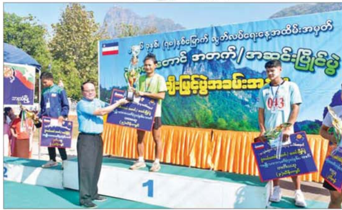
ကရင်ပြည်နယ်ဝန်ကြီးချုပ် ဦးစောမြင့်ဦးက အမျိုးသားအသက်(၄၀)နှစ်အောက်ပြိုင်ပွဲတွင် ပထမဆုရရှိသူအား ဆုပေးအပ်ပေးခဲ့ခြင်းပင်။

ရွက်ပင်တောင်အောက်/အဆင့်မြင့်ပွဲအမျိုးသား အသက်(၄၀)နှစ်အောက်ပြိုင်ပွဲတွင် ၅၂ မိနစ် ၅၅ စက္ကန့်၊ (၄၀)နှစ်အထက်ပြိုင်ပွဲတွင် ၅၇ မိနစ်၊ အမျိုးသမီး (၄၀)နှစ်အောက်ပြိုင်ပွဲတွင် ၁ နာရီ ၃၃ မိနစ်တို့ဖြင့် ပြန်လည် ပန်းဝင်လာကြရာ ပြည်နယ်ဝန်ကြီးချုပ်နှင့် တာဝန် ရှိသူများ၊ ဌာနဆိုင်ရာများနှင့် ဒေသခံတိုင်းရင်းသား ပြည်သူများက ကြည့်ရှုအားပေးခဲ့ကြသည်။