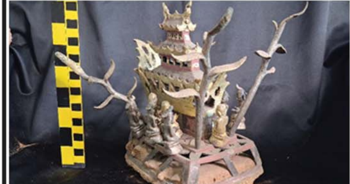
မြတ်ဘုရား ပရိနိဗ္ဗာန်စံခံခန်း ကြေးသွန်းဌာပနာ

အခုတွေ့ရတဲ့ ကြေးသွန်းရုပ်လေးက ညာဘက်လက်နဲ့ ကြီးတပ်တူရိယာလေးကို ညာပန်းပေါ်မှာ ထမ်းထားပြီး ဘယ်ဘက်လက်က ဘယ်ဘက်မျက်လုံးမှာ မျက်ရည်သုတ်လို့ ငိုနေဟန်လေးပါ။ အင်ကအခုလို ကြေးသွန်းရုပ်မျိုး တစ်ခါမျှမတွေ့ခဲ့ရဖူးပါ။ အခုလိုဟန် တွေ့ရတာ ပထမဆုံးပါ။ အထက်မှာ ရေးပြထားသလိုပင် စာတွေ၊ လက်တွေ့ဆက်စပ်လေ့လာလိုက်တော့မှ အဲဒီကြေးသွန်းရုပ်လေးဟာ မြတ်စွာဘုရား ပရိနိဗ္ဗာန်စံခံခန်းတော်မှန်ခန်းက ဆက်စပ်အရုပ်လေးဖြစ်ပါတယ်။ အရုပ်လေးနဲ့ ပတ်သက်ပြီး ရှင်းလင်းစွာ သိစေဖို့ နောက်ခံဇာတ်ကြောင်းလေးကို အကျဉ်းမျှတင်ပြပါရစေ။ မြတ်ဘုရားဂေါတမဟာ ၄၅ ဝါကာလပတ်လုံး ကျွတ်ထိုက်သူ ဝေနေယျသတ္တဝါတို့ကို ခေမာသောင်သို့ ဓမ္မတည်းဟူသော ကူးတို့ဖြင့် ဆောင်ပို့အပြီး ကုသိနာ ရုံပြည့် အင်ကြင်းရုံတောသို့ မြောက်အရပ်သို့ ဦးခေါင်းပြု၍ ပရိနိဗ္ဗာန်စံခံတော်မူခဲ့ပါတယ်။ ပရိနိဗ္ဗာန်စံခံခြင်း အချိန်မတိုင်မီ ပရိနိဗ္ဗာန် စံခံပြီးပါက ကြွင်းကျန်ရစ်သော ဥတုဇရုပ်ကလာပ်ကို မည်သို့မည်ပုံဆောင်ရွက်ရမည် အကြောင်းတို့ကို မေးလျှောက်လာသူ မြတ်ဘုရားရဲ့ အလုပ်အကျွေး ဥပဋ္ဌာကရဟန်းဖြစ်သူ ရှင်အာနန္ဒာကို မဟာပရိနိဗ္ဗာန်သုတ်တော်နဲ့ သေချာစွာ ရှင်းလင်းဟောကြားခဲ့ပါတယ်။ အဲဒီသုတ်တော်ထဲမှာ မြတ်စွာဘုရား ပရိနိဗ္ဗာန်စံခံပြီးပါက ကြွင်းကျန်ရစ်သော ဥတုဇရုပ် ကလာပ်ကို စကြဝတေးမန္တတိုင်းတို့ရဲ့ သင်္ဂြိုဟ်ပုံအတိုင်း ဝါဠုမင်းတစ်ထပ်၊ ဝိတံဗြဟ္မတစ်ထပ်