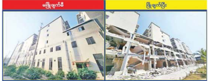
KK Park နယ်မြေ အပိုင်း(၃)တွင် တရားမဝင်အဆောက်အအုံလုပ်ထားသည့် ခြောက်ထပ်လူနေအဆောက်အအုံ ဖြိုချဖျက်ဆီးမှုကို တွေ့ရစဉ်။

လောင်းကစားမှု ကျူးလွန်မှုများကို အမျိုးသားရေး အိမ်နီးချင်းနိုင်ငံအစိုးရများနှင့် ပေါင်းစပ်ညှိနှိုင်း၍ တာဝန်တစ်ရပ်အဖြစ်ခံယူကာ မြန်မာနိုင်ငံအတွင်း ဆက်လက် ဆောင်ရွက်သွားမည်ဖြစ်ကြောင်း လုံးဝအခြေမပြုနိုင်ရေး ပြည်တွင်းအင်အားစုများအပြင် သိရသည်။ သတင်းစဉ်