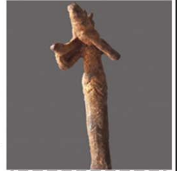
ငိုကြွေးနေသော ပန်ကျာသည်