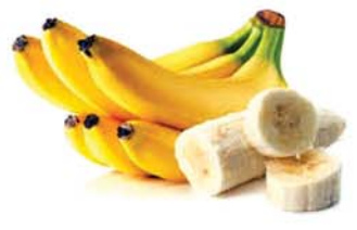
သီးမွှေးငှက်ပျောသီး

၁။ ညမွှေးပန်းရနံ့က စိတ်အနှောင့်အယှက်ဖြစ်မှု ပိုမိုပျောက် လျော့ချပေးပြီး စိတ်ကို အနားရစေပေးတတ်သည်။ ညဘက်မှာ နှစ်နှစ်ဖြိုက် ဖြိုက် အိပ်ပျော်စေပါသည်။ ၂။ ညမွှေးပန်းမှာ ပါဝင်တဲ့ ဓာတ်ပေါင်းများစွာ ဓာတ်တိုးဆန့်ကျင်အာနိသင်ရှိတဲ့အတွက် ခန္ဓာကိုယ်မှာ ဓာတ်တိုးခြင်းကြောင့် ခံစားနေမှုကို လျော့ကျစေရန် ကူညီပေးပါသည်။ ခန္ဓာကိုယ်ကို ကျန်းမာစေပါသည်။ ၃။ ရောင်ရမ်းတာကို လျော့စေတဲ့ အာနိသင်ရှိတဲ့ အချို့ရိုးရာတိုင်းရင်းဆေးများမှာ အသုံးပြုပါသည်။ ၄။ ရေဓာတ်အပြည့်အဝထိန်းသိမ်းနိုင်ပြီး အသားအရေကို ချောမွေ့စေပါသည်။ အသားအရေခြောက်ခြင်း၊ ယားယံခြင်းတို့မှ ကာကွယ်ပေးပါသည်။ ၅။ ပင်စည်မှာ Glucosides ပါတဲ့အတွက် ဓာတ်တိုးဆန့်ကျင်အာနိသင်ရှိပါသည်။ ဘက်တီးရီးယားတွေကို နှိမ်နင်းနိုင်ပါသည်။ ပင်စည်အခေါက်မှုန့်ကို အဆစ်ရောင်နာကျင့်မှုများ ကုသရာမှာ အသုံးပြုပါသည်။ ၆။ အရွက်ကို အဖျား၊ ငှက်ဖျား၊ အဆစ်ရောင်ခြင်း၊ ဆီးချိုနဲ့ သွေးတိုးရောဂါများ ကုသရာမှာ အသုံးပြုပါသည်။ ၇။ အပွင့်က အသည်းမှာ သည်းခြေရည်များ ပိုလျှံစွာ ထွက်နေခြင်းကို တားဆီးနိုင်ပြီး အစာခြေဖျက်ရာမှာ ကူညီပေးပါသည်။ ၈။ အပွင့်က အူကို ပုံမှန်လှုပ်ရှားစေပြီး အစာခြေစနစ်ကို ကျန်းမာစေပါသည်။ ၉။ ညမွှေးပန်းကို ရေနွေးကြမ်းခတ်ပြီးလည်း သောက်သုံးကြပါသည်။