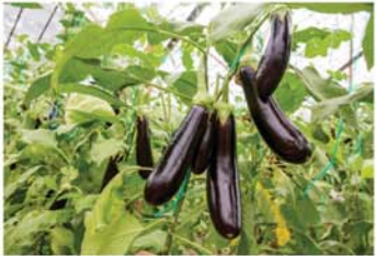
ခရမ်းသီး

ပန်းသီးစားခြင်းဖြင့် အောက်ပါကျန်းမာရေးအကျိုးကျေးဇူးများ ရရှိမှာဖြစ်ပါသည်။ ၁။ ပန်းသီးမှာပါဝင်တဲ့ ဖော်ဝင်လွယ်သော အမျှင်ဓာတ်ဟာ သွေးတွင်း ကိုလက်စထရောကို လျော့ချပေးပြီး နှလုံးရောဂါဖြစ်ပွားမှုကို သက်သာစေပါသည်။ ၂။ အမျှင်ဓာတ်ကြွယ်ဝစွာပါဝင်သောကြောင့် ဝမ်းချုပ်ခြင်းကို ကာကွယ်ပေးပြီး အူလမ်းကြောင်းကို ကျန်းမာစေပါသည်။ ၃။ ရေဓာတ်နဲ့ အမျှင်ဓာတ်များသောကြောင့် ဗိုက်ပြည့်လွယ်စေကာ ကိုယ်အလေးချိန်လျော့ချလိုသူများအတွက် အထူးသင့်လျော်ပါသည်။ ၄။ ပန်းသီးကို ပုံမှန်စားသုံးခြင်းဖြင့် အမျိုးအစား (၂) ဆီးချိုရောဂါဖြစ်နိုင်ခြေကို လျော့နည်းစေပါသည်။ သတိပြုရန် ပန်းသီးအစေ့တွင် ဆိုင်ယာနိုက်အဆိပ်ဓာတ်အနည်းငယ်ပါဝင်သောကြောင့် အစေ့ကို မစားမိစေရန် သတိပြုသင့်ပါသည်။ အခွံမှာ အာဟာရဓာတ်အများဆုံးပါဝင်သဖြင့် သေချာစွာ ဆေးကြောပြီး အခွံပါစားသုံးခြင်းက ပိုမိုကောင်းမွန်ပါသည်။