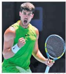
xander Zverev တို့ ယှဉ်ပြိုင်ကစားသွားရမည်ဖြစ်သည်။ (အပေါ်ပုံ) (NGB)

လန်ဒန် ဇန်နဝါရီ ၂၀ မပြေဖြစ်နေခြင်းကြောင့် အသင်းမှ ထွက်ခွာချင်နေသည်။ ထို့ကြောင့် ပုပ်အသင်းအနေဖြင့် လက်ရှိဈေးကွက်အတွင်းတွင် မာဆေးလ်အသင်းထံမှ အိန်ဂျယ်ဂိုးမက်စ်အား ရရှိအောင် ခေါ်ယူနိုင်မည်လားဆိုသည်မှာ စောင့်ကြည့်ရမည်ဖြစ်သည်။ (NGB) အသက်(၂၅)နှစ်အရွယ်ရှိ ကွင်းလယ်ကစားသမားသည် မာဆေးလ်အသင်းနှင့်အတူ ယခုနှစ်ဘောလုံးရာသီတွင် ပြိုင်ပွဲစုံ ၂၀ ကစားပြီး ၄ဂိုး သွင်းယူကာ ခြေစွမ်းပြနိုင်ခဲ့ခြင်းကြောင့် ပုပ်အသင်းက ခေါ်ယူရန် စီစဉ်လာခြင်းဖြစ်သည်။ (ယာပုံ) အိန်ဂျယ်ဂိုးမက်စ်ကိုယ်တိုင်ကလည်း လက်ရှိအချိန် မာဆေးလ်အသင်းတာဝန်ရှိသူများနှင့် အဆင်