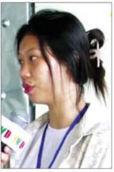
ခဲလိုက်ရတယ်။

ရောင်းစားခဲလိုက် ရပြီး သူတို့ တိုက်ပိတ်ထားတယ်။ ၁၇ ရက်၊ ၁၈ ရက်လောက် တိုက် ပိတ်ထားတယ်။ တိုက်ပိတ်ထားပြီး လက်ထိပ်တွေ ခတ်ထားတယ်။ ၁၂ နာရီတစ်ခါ လာကြည့်တယ်။ ထမင်းကျွေးတယ်။ ပြီးလို့ရှိရင် ပြန်ပိတ်သွားတယ်။ သူတို့ထင်တာ တရုတ်စကား အဲဒီလောက်မရဘူး ထင်လို့ နောက်တစ်နေရာ ပြန်ရောင်းစားဖို့ လုပ်တယ်။ ပြည်တန်ဆာရုံ ရောင်းစားဖို့ပေါ့။ အဲဒီလိုဆိုတော့ ပြည်တန်ဆာရုံက လာကြည့်တော့ ခြောက်ထောင်ပဲ ပေးမယ်ဆိုတော့ သူတို့က ဝိုက်ဆံ အနွှေးရမှာဆိုတော့ မရောင်းဘဲနဲ့ ကုမ္ပဏီမှာပဲ အလုပ်လုပ်ဖို့ဆိုပြီး တော့ ထားလိုက်တယ်။ အကောင် တွေ လော့ဂ်အင် ဝင်ခိုင်းတယ်။ Tiktok၊ We Chat အကောင်တွေ လော့ဂ်အင်ဝင်ရတယ်။ အဲဒီကနေ တစ်ဆင့် သူတို့က လိမ်တာပေါ့။ ရောက်ရောက်ချင်းကို ချောပြီး တော့ စာချုပ်တွေ ချုပ်ခိုင်းတယ်။ လက်ဗွေတွေ နှိပ်ခိုင်းတယ်။ အဲဒီလိုမျိုး နှိပ်ခိုင်းတာကျတော့ တကယ်လို့ ကိုယ်တွေက ရဲတိုင်း တာဖြစ်ဖြစ်၊ သံရုံးကို တိုင်တာ ဖြစ်ဖြစ် လာကြည့်တဲ့အချိန် အဲဒီစာချုပ်ကို သူတို့ကထုတ်ပြ တယ်။ စာချုပ်ချုပ်ထားတယ် ဆိုတော့ ရဲတွေလည်း ဘာမှမလုပ် နိုင်ဘူး။ မခေါ်သွားနိုင်ဘူး။ အဲဒီလို မျိုးပုံစံပေါ့။ ကိုယ်က ရောင်းစား