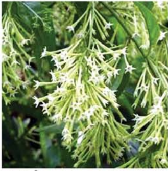
ညမွှေးပန်း

၁။ ညမွှေးပန်းရနံ့က စိတ်အနှောင့်အယှက်ဖြစ်မှု ပိုမိုပျောက် လျော့ချပေးပြီး စိတ်ကို အနားရစေပေးတတ်သည်။ ညဘက်မှာ နှစ်နှစ်ဖြိုက် ဖြိုက် အိပ်ပျော်စေပါသည်။ ၂။ ညမွှေးပန်းမှာ ပါဝင်တဲ့ ဓာတ်ပေါင်းများစွာ ဓာတ်တိုးဆန့်ကျင်အာနိသင်ရှိတဲ့အတွက် ခန္ဓာကိုယ်မှာ ဓာတ်တိုးခြင်းကြောင့် ခံစားနေမှုကို လျော့ကျစေရန် ကူညီပေးပါသည်။ ခန္ဓာကိုယ်ကို ကျန်းမာစေပါသည်။ ၃။ ရောင်ရမ်းတာကို လျော့စေတဲ့ အာနိသင်ရှိတဲ့ အချို့ရိုးရာတိုင်းရင်းဆေးများမှာ အသုံးပြုပါသည်။ ၄။ ရေဓာတ်အပြည့်အဝထိန်းသိမ်းနိုင်ပြီး အသားအရေကို ချောမွေ့စေပါသည်။ အသားအရေခြောက်ခြင်း၊ ယားယံခြင်းတို့မှ ကာကွယ်ပေးပါသည်။ ၅။ ပင်စည်မှာ Glucosides ပါတဲ့အတွက် ဓာတ်တိုးဆန့်ကျင်အာနိသင်ရှိပါသည်။ ဘက်တီးရီးယားတွေကို နှိမ်နင်းနိုင်ပါသည်။ ပင်စည်အခေါက်မှုန့်ကို အဆစ်ရောင်နာကျင့်မှုများ ကုသရာမှာ အသုံးပြုပါသည်။ ၆။ အရွက်ကို အဖျား၊ ငှက်ဖျား၊ အဆစ်ရောင်ခြင်း၊ ဆီးချိုနဲ့ သွေးတိုးရောဂါများ ကုသရာမှာ အသုံးပြုပါသည်။ ၇။ အပွင့်က အသည်းမှာ သည်းခြေရည်များ ပိုလျှံစွာ ထွက်နေခြင်းကို တားဆီးနိုင်ပြီး အစာခြေဖျက်ရာမှာ ကူညီပေးပါသည်။ ၈။ အပွင့်က အူကို ပုံမှန်လှုပ်ရှားစေပြီး အစာခြေစနစ်ကို ကျန်းမာစေပါသည်။ ၉။ ညမွှေးပန်းကို ရေနွေးကြမ်းခတ်ပြီးလည်း သောက်သုံးကြပါသည်။