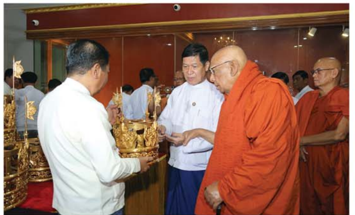
ကြည့်ရှုခဲ့ကြောင်း သိရသည်။

ရှေးဦးစွာ နိုင်ငံတော်ဩဝါဒါစရိယ၊ သောဠသမ ရွှေကျင်သာသနာပိုင် ဆရာတော်၊ သီတဂူကမ္ဘာ့ဗုဒ္ဓတက္ကသိုလ်များနှင့် သီတဂူဆေးရုံတော်များ၏ အဓိပတိ သီတဂူဆရာတော်ကြီးသည် မဟာမုနိရုပ်ရှင်တော်မြတ်ကြီးအား ဖူးမြော်ကြည့်ညှိပြီးနောက် တိုင်းဒေသကြီး ဝန်ကြီးချုပ်နှင့် တာဝန်ရှိသူများက မန္တလေးလျှင်ကြီးလှုပ်ခတ်ခဲ့မှုကြောင့် ထိခိုက်ပျက်စီးခဲ့သည့် မဟာမုနိရုပ်ရှင်တော်မြတ်ကြီး၏ ဂန္ဓကုဋ်တိုက်တော် ရွှေကျင်းတော်ကြီးနှင့် သာသနိကအဆောက်အအုံများ ပြန်လည်ပြုပြင်မွမ်းမံတည်ဆောက်ပြီးစီးမှု အခြေအနေများ၊ စိန်ဖူးတော်ကြီး၊ ၎က်မြတ်နားတော်၊ ရွှေထီးတော်များ တင်လှူပူဇော်နိုင်ရေးနှင့် ဗုဒ္ဓါဘိသေက အနေကဇာတင် အခမ်းအနားကြီး အောင်မြင်စွာ ကျင်းပနိုင်ရေးတို့နှင့် စပ်လျဉ်း၍ သာသနာရေးဆိုင်ရာများကို လျှောက်ထားပြီးနောက် ဆရာတော်ကြီးထံမှ ဩဝါဒများ ခံယူခဲ့ကြကြောင်းနှင့် နိုင်ငံတော်ဩဝါဒါစရိယ၊ သောဠသမ ရွှေကျင်သာသနာပိုင်ဆရာတော်၊ သီတဂူကမ္ဘာ့ဗုဒ္ဓတက္ကသိုလ်များနှင့် သီတဂူဆေးရုံတော်များ၏ အဓိပတိ သီတဂူဆရာတော်ကြီးက လှည့်လည်