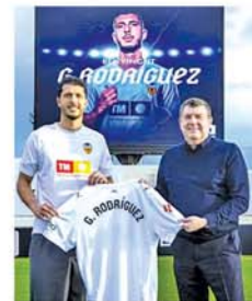
ပလင်စီယာအသင်း၏ ထုတ်

ပြန်ချက်တွင် ပွဲဒီရိုဒီဂရက်ကို ခေါ်ယူခဲ့ပါပြီ။ သူ့အနေနဲ့လည်း အသင်းပေါ်များစွာ အထောက်အကူပြုနိုင်လိမ့်မယ်လို့ ယုံကြည်ပါတယ်။ အသင်းအနေနဲ့လည်း ဈေးကွက်အတွင်း ကစားသမားသစ်တွေ ခေါ်ယူအားဖြည့်သွားဦးမှာပါ ဟု ထုတ်ပြန်သည်။ (အောက်ပုံ) (NGB)