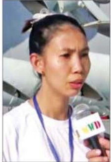
၁။ အမျိုးသမီး

အဆိုပါ ကမ္ဘောဒီးယားနိုင်ငံမှ ပြန်လည်ရောက်ရှိလာသည့် မြန်မာ နိုင်ငံသားများအား သက်ဆိုင်ရာ တာဝန်ရှိသူများက လိုအပ်သည့် ကိုယ်ရေးအချက်အလက်များနှင့် မှတ်တမ်းများ စာရင်းကောက်ယူ ခြင်း လုပ်ငန်းများ၊ လိုအပ်သည့် စစ်ဆေးမှုများ ဆောင်ရွက်ကာ လုပ်ထုံးလုပ်နည်းများနှင့်အညီ ဆက်လက်ဆောင်ရွက်သွားမည် ဖြစ်ပြီး ၎င်းတို့၏ ပြောကြား ချက်များကိုလည်း ယခုကဲ့သို့ ကြားသိရပါသည်-