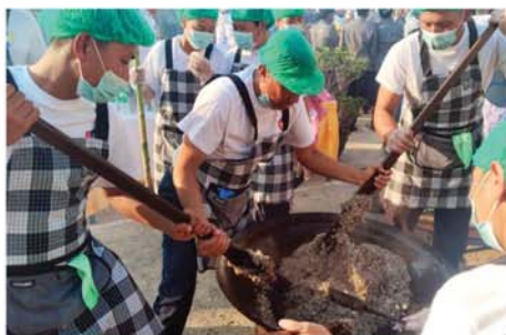
တောင်ကြီး ဇန်နဝါရီ ၂၀

ရှေးဦးစွာ ရှမ်းပြည်နယ် ရဲတပ်ဖွဲ့မှ ရဲမှူးချုပ် ကျော်ကျော်တောင်ကြီးမြို့၊ စိန်ဖန်းရပ်ကွက်ရှိ မြန်မာ့ရိုးရာ ထမနဲထိုးပြိုင်ပွဲ ကျင်းပသည်။ ထို့နောက် ထမနဲထိုး