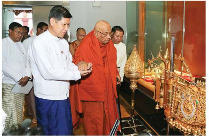
မန္တလေး ဇန်နဝါရီ ၂၀