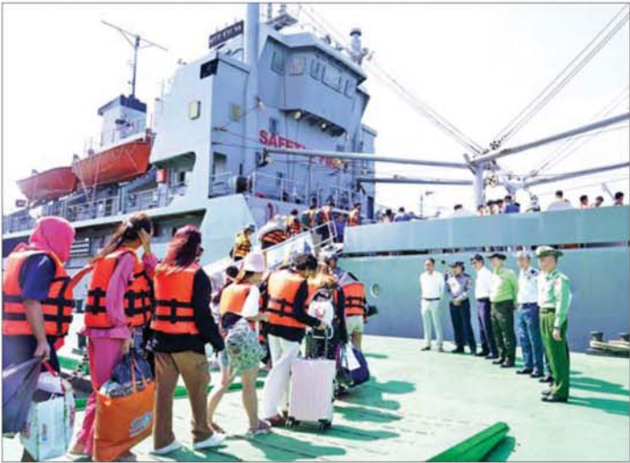
ကမ္ဘောဒီးယားနိုင်ငံမှ ပြန်လည်ခေါ်ဆောင်ပေးခဲ့သည့် မြန်မာနိုင်ငံသားများအား စစ်ရေယာဉ် (မုတ္တမ)ပေါ်သို့ ပို့ဆောင်ပေးစဉ်။

ခဲလိုက်ရတယ်။ ရောင်းစားခဲလိုက် ရပြီး သူတို့ တိုက်ပိတ်ထားတယ်။ ၁၇ ရက်၊ ၁၈ ရက်လောက် တိုက် ပိတ်ထားတယ်။ တိုက်ပိတ်ထားပြီး လက်ထိပ်တွေ ခတ်ထားတယ်။ ၁၂ နာရီတစ်ခါ လာကြည့်တယ်။ ထမင်းကျွေးတယ်။ ပြီးလို့ရှိရင် ပြန်ပိတ်သွားတယ်။ သူတို့ထင်တာ တရုတ်စကား အဲဒီလောက်မရဘူး ထင်လို့ နောက်တစ်နေရာ ပြန်ရောင်းစားဖို့ လုပ်တယ်။ ပြည်တန်ဆာရုံ ရောင်းစားဖို့ပေါ့။ အဲဒီလိုဆိုတော့ ပြည်တန်ဆာရုံက လာကြည့်တော့ ခြောက်ထောင်ပဲ ပေးမယ်ဆိုတော့ သူတို့က ဝိုက်ဆံ အနွှေးရမှာဆိုတော့ မရောင်းဘဲနဲ့ ကုမ္ပဏီမှာပဲ အလုပ်လုပ်ဖို့ဆိုပြီး တော့ ထားလိုက်တယ်။ အကောင် တွေ လော့ဂ်အင် ဝင်ခိုင်းတယ်။ Tiktok၊ We Chat အကောင်တွေ လော့ဂ်အင်ဝင်ရတယ်။ အဲဒီကနေ တစ်ဆင့် သူတို့က လိမ်တာပေါ့။ ရောက်ရောက်ချင်းကို ချောပြီး တော့ စာချုပ်တွေ ချုပ်ခိုင်းတယ်။ လက်ဗွေတွေ နှိပ်ခိုင်းတယ်။ အဲဒီလိုမျိုး နှိပ်ခိုင်းတာကျတော့ တကယ်လို့ ကိုယ်တွေက ရဲတိုင်း တာဖြစ်ဖြစ်၊ သံရုံးကို တိုင်တာ ဖြစ်ဖြစ် လာကြည့်တဲ့အချိန် အဲဒီစာချုပ်ကို သူတို့ကထုတ်ပြ တယ်။ စာချုပ်ချုပ်ထားတယ် ဆိုတော့ ရဲတွေလည်း ဘာမှမလုပ် နိုင်ဘူး။ မခေါ်သွားနိုင်ဘူး။ အဲဒီလို မျိုးပုံစံပေါ့။ ကိုယ်က ရောင်းစား