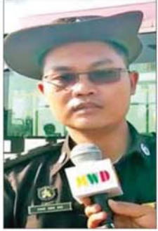
၃။ လဝက ဝန်ထမ်း

ရတယ်ဆိုတော့ သူတို့ပြောတဲ့ အတိုင်း လုပ်ရတယ်။ မလုပ်ရင် ရိုက်တာတွေ၊ ကျွဲစက်နဲ့တိုတာ တွေ လည်းရှိတယ်။ ကြောက် တော့လည်းလုပ်ရတာပေါ့။ မလုပ် လို့ရှိရင် အရိုက်ခံရမှာပေါ့။ သံရုံးမှာ က ထမင်းစားဖို့ရယ် အိပ်ဖို့နေရာ တွေ သေချာစီစဉ်ပေးတယ်။ လေယာဉ်လာကြိုမယ်ဆိုတာ သိ တယ်။ အဲဒါပြီးရင် တုံးတွေထွေး ပြီး ကတ်တွေလုပ်ပေးတယ်။ အဲဒါပြီးမှ အရင်ရောက်တဲ့သူကို အုပ်စု ၁၊ ၂ ခွဲပြီးတော့ ပြန်ပို့တယ်။ ကျေးဇူးအများကြီးတင်ပါတယ်။ မဟုတ်လို့ရှိရင် ကိုယ့်အစီအစဉ်နဲ့ ဆိုရင်တော့ အိမ်ပြန်ရောက်မှာ မဟုတ်တော့ဘူး။ ကိုယ့်နိုင်ငံကို ပြန်ရောက်မှာ မဟုတ်တော့ ဘူး။”