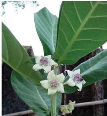
မရိုးပင်

စေပါသည်။ ၇။ ကြွက်သားကျန်းမာရေးကို အားပေးတဲ့အတွက် ကြွက်တက်ခြင်း ကင်းဝေးစေပါသည်။ ၈။ ဗီတာမင်စီပါဝင်လို့ ကိုယ်ခံအားကို မြှင့်တင်ပေးပြီး ရောဂါတွေကို ကာကွယ်ပေးပါသည်။ ၉။ စိတ်ကြည်လင်စေတဲ့ Serotonin ထွက်ရှိလို့ စိတ်ဖိစီးမှုကို လျော့ကျစေပါသည်။ ၁၀။ လူကို အမြဲလန်းဆန်းစေလို့ နုံးချည့်မှုကို ပျောက်ကင်းစေပါသည်။ ၁၁။ မဂ္ဂနီစီယမ် ပါဝင်လို့ အရိုးတွေကို သန်မာစေပါသည်။ ၁၂။ ပိုလျှံတဲ့ ရေဓာတ်ကို စွန့်ထုတ်ပေးလို့ ဖောရောင်မှုကို လျော့ကျစေပါသည်။ ၁၃။ GI တန်ဖိုးနည်းလို့ ဆီးချိုသမားများ အသင့်အတင့် စားသုံးသင့်ပါသည်။ ၁၄။ အစာအိမ်နံရံ အချွဲမြေကို လှုံ့ဆော်ပေးလို့ အစာအိမ်နာ သက်သာစေပါသည်။ ၁၅။ သွေးကြောဆိုင်ရာရောဂါ အန္တရာယ်ကိုလျော့ချပေးလို့ လေဖြတ်ခြင်းမှ ကာကွယ်ပေးပါသည်။ ၁၆။ စိတ်ဓာတ်ကျခြင်းကို သက်သာစေပြီး စိတ်ခံစားချက်ကို ကောင်းမွန်စေပါသည်။ ၁၇။ ဗိုက်ပြည့်လွယ်လို့ ဝိတ်ချလိုသူတွေနဲ့ သင့်တော်ပြီး ကိုယ်အလေးချိန်ကို ထိန်းညှိပေးပါသည်။ ၁၈။ အားကစားသမားများအတွက် လေ့ကျင့်ခန်း ပိုမိုလုပ်နိုင်စေပါသည်။ ၁၉။ အရေအကြောင်းဖြစ်ခြင်းကို နွေးကွေးစေပြီး အသားအရေကို လှပစေပါသည်။ ၂၀။ အရက်နာကျနေသူများ စားပေးပါက အမူးပြေစေပါသည်။