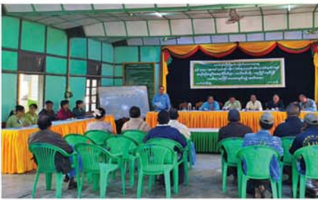
တောင်တွင်းကြီး ဇန်နဝါရီ ၂၀

မကွေးတိုင်းဒေသကြီး၊ မကွေးခရိုင်၊ တောင်တွင်းကြီးမြို့နယ် စည်ပင်သာယာရေးအဖွဲ့မှ ၂၀၂၆-၂၀၂၇ ဘဏ္ဍာရေးနှစ်အတွက် အရပ်ရပ်အခွင့်အရေး လိုင်စင်များ(သက်တမ်းတိုး၊ ဈေးပြိုင်)စနစ်ဖြင့် တတိယအကြိမ် လေလံရောင်းချပွဲကို ယမန်နေ့နံနက်ပိုင်းက တောင်တွင်းကြီးမြို့ စည်ပင်သာယာရေးအဖွဲ့ရုံး၌ ပြုလုပ်ခဲ့သည်။