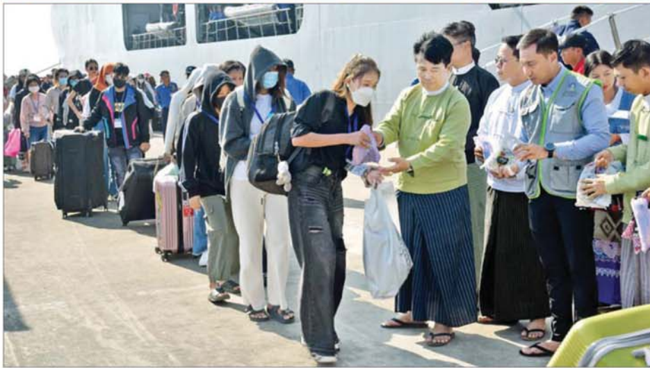
ကမ္ဘောဒီးယားနိုင်ငံမှ ပြန်လည်ခေါ်ဆောင်ခဲ့သည့် အွန်လိုင်းလိမ်လည်လောင်းကစားမှုများတွင် အကြောင်းအမျိုးမျိုးကြောင့် ပါဝင်ပတ်သက်သူ မြန်မာနိုင်ငံသားများ စစ်ရေယာဉ်(မုတ္တမ)ဖြင့် မြိတ်မြို့မှ ရန်ကုန်မြို့သို့ ရောက်ရှိလာခဲ့။