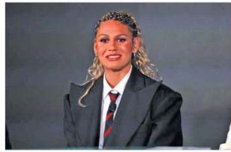
ထရီနီတီရော့ဒ်မန်းသည် ဝါရှင်တန်စပရစ်အမျိုးသမီးအသင်းနှင့် သုံးနှစ်စာချုပ်သစ် ချုပ်ဆိုပြီးနောက် ကမ္ဘာ့တန်ဖိုးအမြင့်ဆုံး အမျိုးသမီး ဘောလုံးသမားအဖြစ် မှတ်တမ်းဝင်ခဲ့ခြင်းဖြစ်သည်။

အခုလို မှတ်တမ်းတစ်ရပ်ပိုင်ဆိုင်လို့ အတိုင်းမသိ ဂုဏ်ယူမိပါတယ်။ ဝါရှင်တန်စပရစ်အမျိုးသမီးအသင်းနဲ့အတူ အောင်မြင်မှုများ ရရှိအောင်လည်း အစွမ်းကုန် ကြိုးစားသွားမှာပါ။ ဒီအသင်းက ကျွန်မအတွက်တော့ ကြီးကျယ်ခမ်းနားတဲ့ အသင်းတစ်သင်းပါ' ဟု ပြောသည်။ (အောက်ပုံ) (NGB)