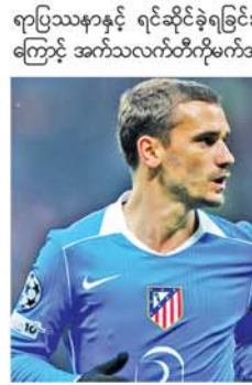
ရာပြဿနာနှင့် ရင်ဆိုင်ခဲ့ရခြင်းကြောင့် အက်သလက်တီကိုမက်ဒရစ်အသင်းအတွက် ကြီးမားသည့် ထိုးနှက်ချက်တစ်ရပ်ဖြစ်လာခဲ့သည်။ အသက်(၃၄)နှစ်အရွယ်ရှိ တိုက်စစ်မှူး ဂရစ်မန်းသည် အက်သလက်တီကိုမက်ဒရစ်အသင်းနှင့်အတူ ၂၀၂၁-၂၀၂၂မှ ၂၀၂၅-၂၀၂၆ ဘောလုံးရာသီအထိ ပြိုင်ပွဲစုံ ၁၈၂ပွဲကစားပြီး ၆၇ ရိုးအထိ သွင်းယူကာ ခြေစွမ်းပြထားသည်။ (စုံပုံ)

မက်ဒရစ် ဇန်နဝါရီ ၂၇ အက်သလက်တီကိုမက်ဒရစ်အသင်း တိုက်စစ်မှူး ဂရစ်မန်းသည် ကြွက်သားဒဏ်ရာကြောင့် တစ်လနီးပါးခန့် အနားယူရမည် ရှိနေသည်။ အဆိုပါ တိုက်စစ်မှူးသည် အက်သလက်တီကိုမက်ဒရစ်အသင်း၏ လေ့ကျင့်ရေးအစီအစဉ်တွင် ပါဝင်ကစားရင်း ဒဏ်ရာရရှိခဲ့ခြင်း ဖြစ်သည်။ တိုက်စစ်မှူး ဂရစ်မန်း ဒဏ်