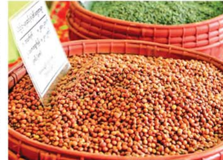
ဇွန်ဇွန်

နှမ်းမျိုးစုံဈေးကွက်မှာ ဇန်နဝါရီ ၂၅ ရက်တွင် နှမ်းနက် သုံးတင်းဝင် တစ်အိတ်လျှင် ငွေကျပ် ၇၅၀၀၀၊ နှမ်းဖြူ(ဂျပန်) သုံးတင်းဝင်တစ်အိတ်လျှင် ငွေကျပ် ၃၄၀၀၀၊ နှမ်းဖြူ(ဗမာ) သုံးတင်းဝင် တစ်အိတ်လျှင် ငွေကျပ် ၃၆၀၀၀၊ သီးပေါက်ဈေးရှိနေကြောင်း သိရသည်။