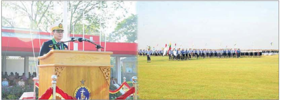
နိုင်ငံတော်လုံခြုံရေးနှင့် အေးချမ်းသာယာရေးကော်မရှင်ဥက္ကဋ္ဌ တပ်မတော်ကာကွယ်ရေးဦးစီးချုပ်ကိုယ်စား ကာကွယ်ရေးဦးစီးချုပ်(ရေ) ဗိုလ်ချုပ်ကြီး ဇေယျကျော်ထင်ထိန်ဝင်း တပ်မတော်(ရေ) အရာရှိငယ်(စီမံခန့်ခွဲရေး)သင်တန်းအမှတ်စဉ်(၈၅)၊ တပ်မတော်(ရေ)အရာရှိငယ်(အင်ဂျင်နီယာ) သင်တန်းအမှတ်စဉ်(၅၉)နှင့် တပ်မတော်(ရေ)အမျိုးသမီးအရာရှိငယ်သင်တန်းအမှတ်စဉ်(၁၀) သင်တန်းဆင်းဂုဏ်ပြုစစ်ရေးပြအခမ်းအနားတွင် မိန့်ခွန်းပြောကြားစဉ်။

အဆိုပါအခမ်းအနားသို့ ကာကွယ်ရေးဦးစီးချုပ်ရုံး(ကြည်း)မှ ဒုတိယဗိုလ်ချုပ်ကြီး ကိုကိုဦး၊ ဒုတိယဗိုလ်ချုပ်ကြီး ကျော်ကိုထိုက်၊ စစ်ဦးစီးအရာရှိချုပ်(ရေ) ဒုတိယဗိုလ်ချုပ်ကြီး အေးမင်းထွေး၊ ရန်ကုန်တိုင်း