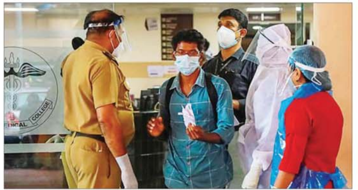
အတွက် အထူးသဖြင့် နိုင်ငံတကာ ကာကွယ်ရေး အစီအစဉ်များကို လာခဲ့ကြသည်။ ဆင်ဟွာ လေဆိပ်များတွင် ကြိုတင် အင်တိုက်အားတိုက် လုပ်ဆောင်

၌ ကျန်းမာရေးဝန်ထမ်းများ အပါအဝင် နီပါးရ်ဗိုင်းရပ်စ် ကူးစက် ဖြစ်ပွားသူ ဝါးဦးရှိသည်ဟု အိန္ဒိယ အာဏာပိုင်များက အတည်ပြု ဖော်ပြပြီးနောက် ဒေသတွင်း တွင် နီပါးရ်ဗိုင်းရပ်စ်နှင့် ပတ်သက်ပြီး သတိထားစောင့် ကြည့်မှုများ မြှင့်တင်လာခြင်း ဖြစ်သည်။ ကာကွယ်ရေးအစီအစဉ်များ လုပ်ဆောင် နီပါးရ်ဗိုင်းရပ်စ် တွေ့ရှိမှုကြောင့် ဒေသတွင်းနိုင်ငံအများအပြားကို စောင့်ကြည့်စစ်ဆေးရမည့်အခြေ အနေအထိ ရောက်ရှိစေခဲ့သည့်