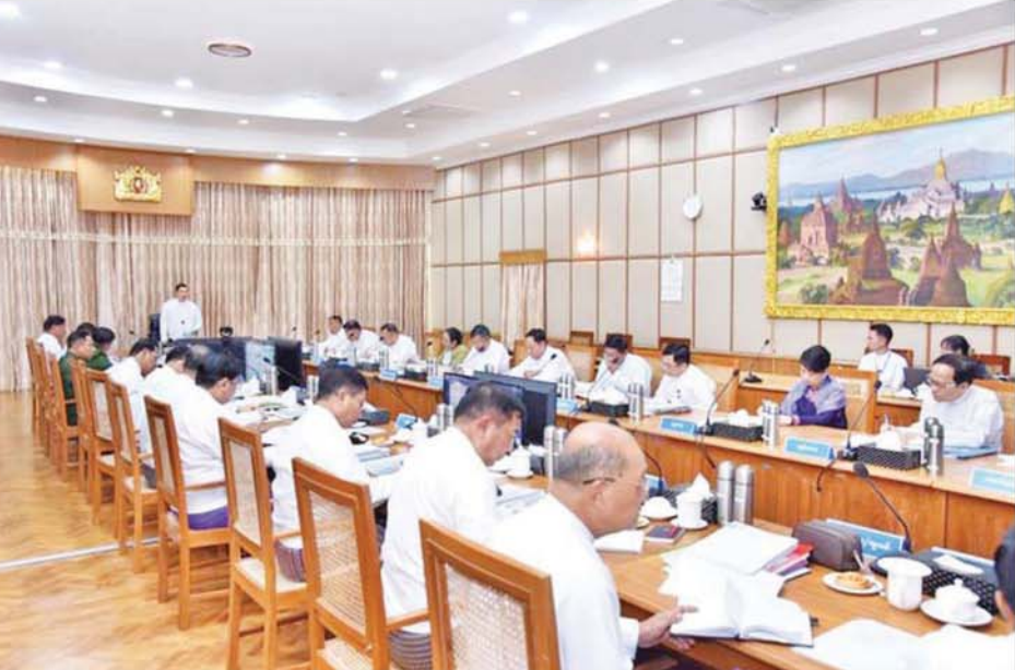
နိုင်ငံတော်ဝန်ကြီးချုပ် ဦးညိုစော ပြည်ထောင်စုသမ္မတမြန်မာနိုင်ငံတော် ပြည်ထောင်စုအစိုးရအဖွဲ့ အစည်းအဝေး (၁/၂၀၂၆) တွင် အမှာစကား ပြောကြားစဉ်။

နေပြည်တော် ဇန်နဝါရီ ၂၇ ပြည်ထောင်စုသမ္မတမြန်မာနိုင်ငံတော် ပြည်ထောင်စုအစိုးရအဖွဲ့ အစည်းအဝေး (၁/၂၀၂၆) ကို ယနေ့မနက်လွှဲပိုင်းတွင် ပြည်ထောင်စုအစိုးရ အဖွဲ့ရုံး ရုံးအမှတ်(၁၈) အစည်းအဝေးခန်းမ၌ ကျင်းပပြုလုပ်ရာ နိုင်ငံတော် ဝန်ကြီးချုပ် ဦးညိုစော တက်ရောက်အမှာစကားပြောကြားသည်။ အစည်းအဝေးသို့ ပြည်ထောင်စုဝန်ကြီးများနှင့် တာဝန်ရှိသူများ တက်ရောက်ကြပြီး တိုင်းဒေသကြီး/ပြည်နယ်ဝန်ကြီးချုပ်များက video conference စနစ်ဖြင့် တက်ရောက်ကြသည်။ ဦးစွာ ပြည်ထောင်စုအစိုးရအဖွဲ့ အစည်းအဝေးအမှတ်စဉ် (၆/၂၀၂၅) မှတ်တမ်းကို အတည်ပြုခြင်းဆောင်ရွက်သည်။ ထို့နောက် နိုင်ငံတော်ဝန်ကြီးချုပ်က အဖွင့်အမှာစကား ပြောကြား ရာတွင် နိုင်ငံတော်အစိုးရအနေဖြင့် စစ်မှန်ပြီးစည်းကမ်းပြည့်ဝသည့် ဒီမိုကရေစီလမ်းကြောင်းပေါ်တွင် ပြည်သူ့လူထု၏ ဆန္ဒနှင့်အညီ လျှောက်လှမ်းနိုင်ရေး ပါတီစုံဒီမိုကရေစီ အထွေထွေရွေးကောက်ပွဲကြီးကို အောင်မြင်စွာကျင်းပနိုင်ခဲ့ပြီးဖြစ်ကြောင်းနှင့် ထွက်ပေါ်လာမည့် အစိုးရ အသစ်ကို နိုင်ငံတာဝန်များ လွှဲပြောင်းပေးအပ်ပြီး ၎င်းတို့၏ တာဝန်များ ကို အကောင်းဆုံးဖြစ်အောင် ထမ်းဆောင်နိုင်ရေး ဆက်လက်ဆောင်ရွက် ပေးရမည်ဖြစ်ကြောင်း၊ နိုင်ငံတော်အကြီးအကဲအနေဖြင့် မန္တလေးတိုင်း ဒေသကြီး ခရီးစဉ်တွင် ပါတီစုံဒီမိုကရေစီအထွေထွေရွေးကောက်ပွဲ အပိုင်း(၃)၌ ပါဝင်ဆန္ဒမဲပေးနေကြသည့် မဲဆန္ဒရှင်ပြည်သူများအား လိုက်လံကြည့်ရှုအားပေးခဲ့ကြောင်း၊ ထိုသို့ကြည့်ရှုအားပေးရာတွင် ပြည်သူ လူထုမှ လွတ်လပ်စွာ မိမိတို့သဘောဆန္ဒများအလျောက် စည်းကမ်းရှိပြီး နိုင်ငံကြီးသားပီသစွာ လိုလားလားဖြင့် လာရောက်ဆန္ဒမဲပေးကြသည် ကို တွေ့ရခြင်းကြောင့်၊ စာမျက်နှာ ၃ သို့ ၂