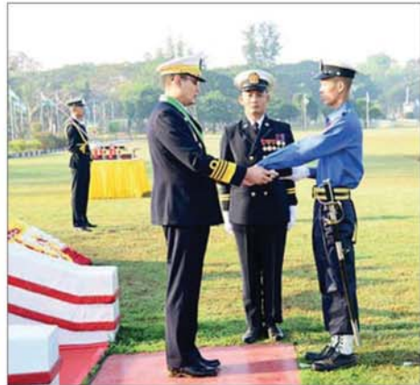
ကာကွယ်ရေးဦးစီးချုပ်(ရေ) ဗိုလ်ချုပ်ကြီး ဇေယျကျော်ထင်ထိန်ဝင်း တပ်မတော်(ရေ) အရာရှိငယ်(စီမံခန့်ခွဲရေး) သင်တန်းအမှတ်စဉ်(၈၅) မှ ရေကြောင်းပညာစာပေထူးချွန်ဆုရ ရေ ၅၇၈၀ ဗိုလ် ဇော်ဖြိုးအောင်အား ထူးချွန်ဆုပေးအပ်ချီးမြှင့်စဉ်။