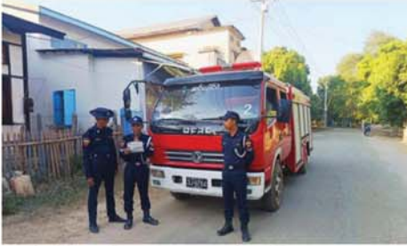
ဆင်ပေါင်ဝဲ ဇန်နဝါရီ ၂၇

မကွေးတိုင်းဒေသကြီး၊ ဆင်ပေါင်ဝဲမြို့နယ် မီးသတ်ဦးစီးဌာနမှ ပြည်သူများ မီးဘေးအန္တရာယ်မှ ကင်းဝေးစေရန်နှင့် မီးဘေးသတိရှိစေရန် ရည်ရွယ်၍ မီးဘေးအန္တရာယ်ကြိုတင်ကာကွယ်ရေးအတွက် ယမန်နေ့ ညနေ ၄ နာရီက မြို့ပေါ်ရပ်ကွက်များသို့ အသိပေးနှိုးဆော်ခြင်း လိုက်လံအသိပေးနှိုးဆော်ခြင်းများ ဆောင်ရွက်ခဲ့သည်။