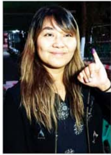
မမီမီစိုး