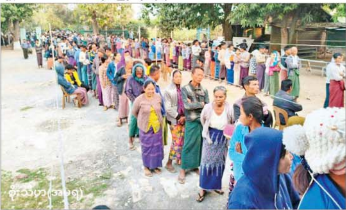
မဲဆန္ဒရှင်ပြည်သူများ စိတ်အေးချမ်းစွာ ဆန္ဒမဲပေးနေကြသည်ကို တွေ့ရစဉ်။