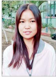
မဖြိုးဖြိုး