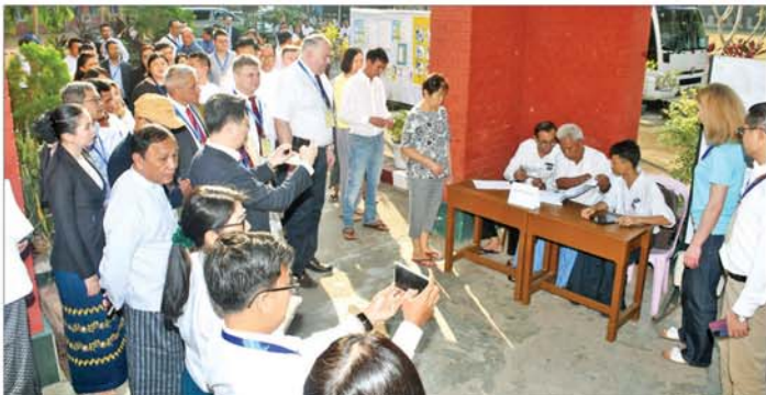
နိုင်ငံတကာ ရွေးကောက်ပွဲ စောင့်ကြည့်လေ့လာရေးအဖွဲ့များ လမ်းမတော်မြို့နယ် အမှတ်(၈) ရပ်ကွက် မဲရုံးအမှတ်(၁)တွင် မဲဆန္ဒရှင်ပြည်သူများ ဆန္ဒမဲပေးနေမှုကို ကြည့်ရှုလေ့လာကြစဉ်။