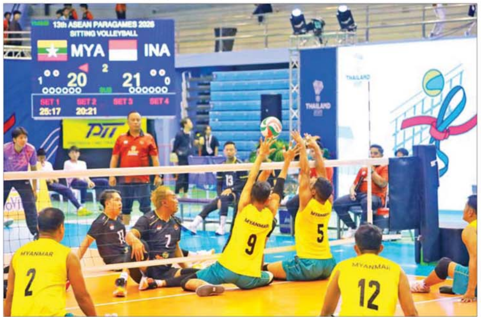
ထိုင်လျက်ဘော်လီဘော ဗိုလ်လုပွဲစဉ်တွင် မြန်မာအသင်းနှင့် အင်ဒိုနီးရှားအသင်းတို့ ယှဉ်ပြိုင်ကစားကြစဉ်။