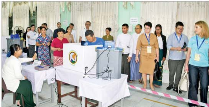
နိုင်ငံတကာ ရွေးကောက်ပွဲစောင့်ကြည့်လေ့လာရေးအဖွဲ့များ ဒဂုံမြို့နယ် ပြည်လမ်းအရှေ့ရပ်ကွက် မဲရုံးအမှတ်(၂)တွင် မဲဆန္ဒရှင်ပြည်သူများ ဆန္ဒမဲပေးနေမှုကို ကြည့်ရှုလေ့လာကြစဉ်။

(၈)ရပ်ကွက် မဲရုံးအမှတ်(၁)၊ သာကေတမြို့နယ် အမှတ် (၇) ရပ်ကွက်(အနောက်) မဲရုံးအမှတ် (၁) နှင့် မဲရုံးအမှတ် (၂) တို့၌လည်းကောင်း၊ မွန်လွဲပိုင်းတွင် ဒဂုံမြို့နယ် (ဆိပ်ကမ်း)မြို့နယ် အမှတ် (၆)၊ ရပ်ကွက် မဲရုံးအမှတ် (၁)၊ တာမွေမြို့နယ် နတ်မောက်ရပ်ကွက် မဲရုံးအမှတ်(၁)၊ ဗိုင်းလေးရေအိုင်ရပ်ကွက်သစ်ရပ်ကွက် မဲရုံးအမှတ် (၁)၊ ရန်ကင်းမြို့နယ် အမှတ် (၁)၊ ရပ်ကွက် မဲရုံးအမှတ်(၁)တို့၌လည်းကောင်း မဲဆန္ဒရှင်ပြည်သူများက မြန်မာအိတ်ထရော့နစ်မဲပေးကတ် (MEVM) အသုံးပြု၍ လွှတ်တော်ကိုယ်စားလှယ်လောင်းများအား လွတ်လပ်စွာ ဆန္ဒပြုမဲပေးရွေးချယ်နေမှု ရွေးကောက်ပွဲဆိုင်ရာစံနှုန်းများ၊ အလေ့အကျင့်ကောင်းများနှင့်အညီ လွတ်လပ်၍ တရားမျှတသော ရွေးကောက်ပွဲဖြစ်စေရေး ဆောင်ရွက်နေမှုများကို လေ့လာစောင့်ကြည့်ကြပြီး မဲရုံးများ၊ တာဝန်ရှိသူများ၊ မဲဆန္ဒရှင်ပြည်သူများကို တွေ့ဆုံ၍ ၎င်းတို့သိရှိလိုသည့်များကို မေးမြန်းဆွေးနွေးခဲ့ကြကြောင်း သိရသည်။ သတင်းစဉ်