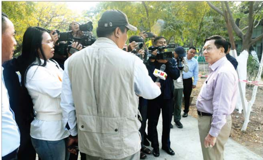
နိုင်ငံတော်ယာယီသမ္မတ နိုင်ငံတော်လုံခြုံရေးနှင့် အေးချမ်းသာယာရေးကော်မရှင်ဥက္ကဋ္ဌ ဗိုလ်ချုပ်မှူးကြီးမင်းအောင်လှိုင် ပြည်တွင်း၊ ပြည်ပမှ သတင်းမီဒီယာများ၏ သိရှိလိုသည့် မေးမြန်းမှုများကို လက်ခံဖြေကြားစဉ်။

ကျွန်တော်တို့ သွားပါမယ်။ မေး။ တချို့ကပြောတာပေါ့နော်။ တပ်ကို ထောက်ခံတဲ့ USDP ပါတီက