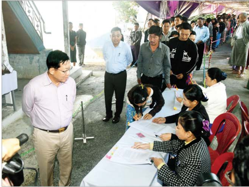
နိုင်ငံတော်ယာယီသမ္မတ နိုင်ငံတော်လုံခြုံရေးနှင့် အေးချမ်းသာယာရေးကော်မရှင်ဥက္ကဋ္ဌ ဗိုလ်ချုပ်မှူးကြီးမင်းအောင်လှိုင် ပုသိမ်ကြီးမြို့နယ်၌ မဲဆန္ဒရှင်ပြည်သူများ၏ တက်ကြွစွာပါဝင်ဆန္ဒမဲပေးနေမှုများကို ကြည့်ရှုအားပေးစဉ်။

သည်။ နိုင်ငံတော်ယာယီသမ္မတ နိုင်ငံတော်လုံခြုံရေးနှင့် အေးချမ်းသာယာရေးကော်မရှင်ဥက္ကဋ္ဌသည် မဲရုံများအလိုက် မဲဆန္ဒရှင်ပြည်သူများ၏ ဆန္ဒမဲပေးနေမှုများအား လိုက်လံကြည့်ရှုအားပေးစဉ် လာရောက် သတင်းရယူကြသည့် ပြည်တွင်း၊ ပြည်ပမှ သတင်းမီဒီယာများ၏ သိရှိလိုသည့် မေးမြန်းမှုများကိုလည်း လက်ခံဖြေကြားခဲ့ပြီး အပြည့်အစုံမှားမေး။ အခုဒီနေ့ ရွေးကောက်ပွဲတော်အဖွဲ့ နေ့လည်းဖြစ်တယ်ဆိုတော့ ဒီဟာနဲ့ပတ်သက်ပြီး ရှေ့ဆက်ပြီး မြန်မာနိုင်ငံအပေါ် ဘယ်လိုမျိုး မျှော်မှန်းထားလဲရှင်။ ဖြေ။ မြန်မာနိုင်ငံက ကျွန်တော်တို့က နက်ကတည်းက ပြည်သူကရွေးချယ်တဲ့ ပါတီနဲ့ဒီမိုကရေစီစနစ်ကိုသွားဖို့ ရည်ရွယ်ပြီးလုပ်ခဲ့တာ။ ဒီအတိုင်းပဲ သွားရမှာ။ ပြည်သူကရွေးချယ်တဲ့လမ်းပဲ။ ကျွန်တော်တို့ရွေးတာမဟုတ်ဘူး။ ပြည်သူကရွေးချယ်တဲ့လမ်း။ ကျွန်တော်တို့လည်း ပြည်သူတွေထဲက အစိတ်အပိုင်း၊ ကျွန်တော်တို့လည်း ဒီဟာကိုထောက်ခံတယ်။ ဒီအတိုင်းပဲ ပါတီနဲ့ဒီမိုကရေစီစနစ်အတိုင်းပဲ သွားမယ်။ အနာဂတ်မှာ