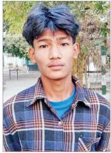
မောင်ရွှန်းလင်းထက်