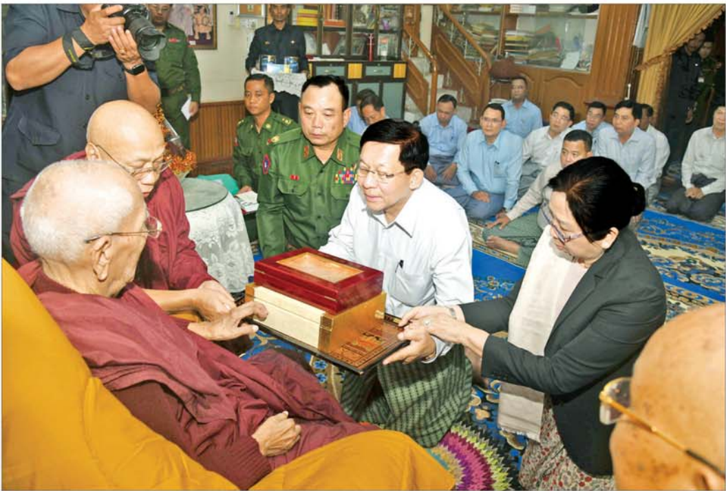
ပြည်ထောင်စုသမ္မတမြန်မာနိုင်ငံတော် ယာယီသမ္မတ နိုင်ငံတော်လုံခြုံရေးနှင့် အေးချမ်းသာယာရေးကော်မရှင်ဥက္ကဋ္ဌ ဗိုလ်ချုပ်မှူးကြီးမင်းအောင်လှိုင်နှင့် ဇနီး ဒေါ်ကြူကြူလှ မန္တလေးမြို့ မဟာဝိဇိတာရုံကျောင်းတိုက် ပဓာနနာယကဆရာတော်ကြီးအား လှူဖွယ်ပစ္စည်းများ ဆက်ကပ်လှူဒါန်းစဉ်။

ယင်းနောက် နိုင်ငံတော်ယာယီသမ္မတ နိုင်ငံတော်လုံခြုံရေးနှင့် အေးချမ်းသာယာရေးကော်မရှင်ဥက္ကဋ္ဌနှင့် ဇနီးတို့က ဆရာတော်ကြီးအား လှူဖွယ်ပစ္စည်းများ၊ ဆေးပစ္စည်းများ၊ အာဟာရဖြည့်