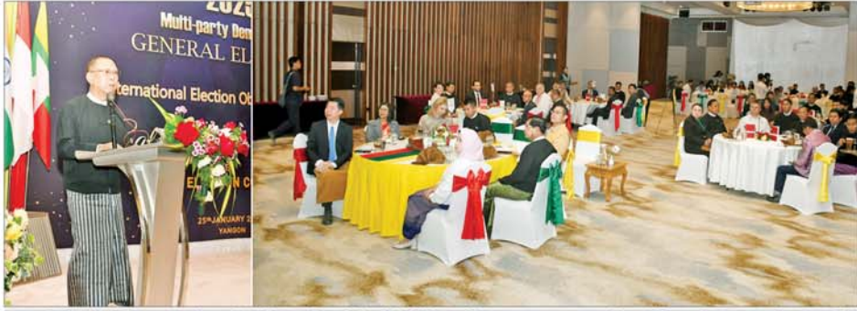
ပြည်ထောင်စုရွေးကောက်ပွဲကော်မရှင်ဥက္ကဋ္ဌ ဦးသန်းစိုး ပါတီစုံဒီမိုကရေစီအထွေထွေရွေးကောက်ပွဲ အပိုင်း(၃)သို့ လာရောက်လေ့လာကြည့်ရှုနိုင်သည့် နိုင်ငံတကာ ရွေးကောက်ပွဲစောင့်ကြည့်လေ့လာသူများအား ဂုဏ်ပြုညစာစားပွဲအခမ်းအနားတွင် ဂုဏ်ပြုစကားပြောကြားစဉ်။

နေပြည်တော် ဇန်နဝါရီ ၂၅ ၂၀၂၆ ခုနှစ် ဇန်နဝါရီ ၂၅ ရက် တွင် ကျင်းပပြီးစီးခဲ့သည့် ပါတီစုံ ဒီမိုကရေစီအထွေထွေရွေးကောက်ပွဲ အပိုင်း(၃) သို့ လာရောက်လေ့လာခဲ့ကြသည့် နိုင်ငံတကာရွေးကောက်ပွဲ စောင့်ကြည့်လေ့လာသူများအား တည်ခင်းအညီအညွတ် ဂုဏ်ပြုညစာစားပွဲကို ယနေ့ညနေပိုင်းတွင် ရန်ကုန်မြို့ရှိ Park Royal ဟိုတယ်၌ ကျင်းပသည်။