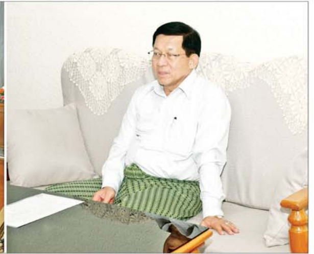
ပြည်ထောင်စုသမ္မတမြန်မာနိုင်ငံတော် ယာယီသမ္မတ နိုင်ငံတော်လုံခြုံရေးနှင့် အေးချမ်းသာယာရေးကော်မရှင်ဥက္ကဋ္ဌ ဗိုလ်ချုပ်မှူးကြီး မင်းအောင်လှိုင် မန္တလေးတိုင်းဒေသကြီး ဝန်ကြီးများ၊ မြို့တော်စည်ပင်သာယာရေးကော်မတီမှ တာဝန်ရှိသူများနှင့်တွေ့ဆုံ၍ မန္တလေးမြို့ မြို့အင်္ဂါရပ်နှင့်အညီ ဖွံ့ဖြိုးတိုးတက်ရေးနှင့် သန့်ရှင်းသာယာလှပရေးတို့အတွက် လိုအပ်သည်များ လမ်းညွှန်မှာကြားစဉ်။