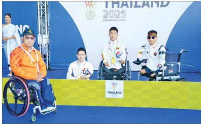
Anniversary Stadium အတွင်း မြန်မာမသန်စွမ်း အဖွဲ့ချုပ်အားကစားအဖွဲ့၊ ရေကူးအားကစားအဖွဲ့၊ သေနတ်ပစ်အားကစားအဖွဲ့နှင့်ထိုင်လျက်ဘောလုံးဘော ပြိုင်ပွဲ ဗိုလ်လုပွဲ ပွဲစဉ်တွင် မြန်မာအသင်းနှင့် အင်ဒိုနီးရှားအသင်းတို့ ယှဉ်ပြိုင်ကစားနေမှု၊ Center Point Hotel Terminal 21(Korat)တွင် စားပွဲတင်