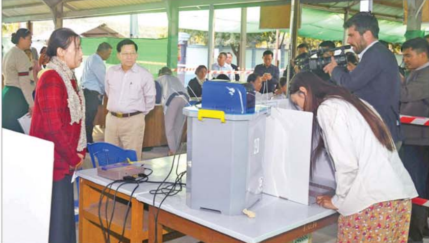
နိုင်ငံတော်ယာယီသမ္မတ နိုင်ငံတော်လုံခြုံရေးနှင့် အေးချမ်းသာယာရေးကော်မရှင်ဥက္ကဋ္ဌ ဗိုလ်ချုပ်မှူးကြီးမင်းအောင်လှိုင် ချမ်းမြသာစည်မြို့နယ်၌ မဲဆန္ဒရှင်ပြည်သူများ၏ တက်ကြွစွာပါဝင်ဆန္ဒမဲပေးနေမှုများကို ကြည့်ရှုအားပေးစဉ်။

ဖြေ။ ပြည်သူက သူတို့ မြန်မာပြည်တွင်းမှာနေတဲ့ ပြည်သူတွေမဲပေးတာလေ။ သူတို့အပြင်ကသူတွေ မဲပေးတာမဟုတ်ဘူး။ မြန်မာပြည်တွင်းမှာနေတဲ့သူမဲပေးတာ။ သူတို့ဘယ်သူပဲ ထောက်ခံထောက်ခံ ကြိုက်တာထောက်ခံလို့ရတယ်။ ပေးတဲ့သူတွေက သူတို့ထောက်ခံချင်တဲ့သူတွေပဲလို့ မဲလာပေးတာပေါ့။ သူတို့ထောက်ခံချင်တဲ့သူတွေ မပါဘူးဆိုရင် မဲလာပေးမှာမဟုတ်ဘူး။ မဲလာမေးခြင်းမှာ နှစ်မျိုးရှိတယ်။ တစ်ပိုင်းကတော့ သူတို့ထောက်ခံချင်တဲ့သူတွေ မပါလို့ မဲလာမေးတာ။ တစ်ပိုင်းက လုံခြုံမှုအရ လာမေးတာရှိတယ်။ လုံခြုံမှုဆိုတာ လာဖို့ပြုဖို့အခက်အခဲရှိတယ်။ မဲပေးတဲ့သူတွေကကျတော့ သူတို့ထောက်ခံတဲ့သူတွေရှိလို့ လာမဲပေးတာပေါ့။ အဲဒီမှာ ခုနက ခင်များပြောတဲ့ ပြည်ခိုင်ဖြိုးပါတီလည်းပါတယ်။ တခြား PPP ပါတီလည်းပါတယ်။ ကျားဖြူပါတီလည်းပါတယ်။ ပါတီနဲ့ပါတယ်။ ဒါကြောင့်လည်း မဲပေးတဲ့စာရင်းတွေ ကျွန်တော်တို့ထုတ်ပြန်ပေးပါတယ်။ အဲဒါ သူတို့လွှတ်လွှတ်လုပ်လုပ် မဲပေးတာပဲ မဟုတ်ဘူးလား။ စာမျက်နှာ ၄ သို့ ။