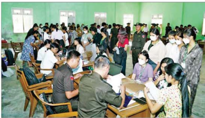
ကမ္ဘောဒီးယားနိုင်ငံရှိ အွန်လိုင်းလိမ်လည်လောင်းကစားမှုများတွင် အကြောင်းအမျိုးမျိုးကြောင့် ပါဝင်ပတ်သက်သူ မြန်မာနိုင်ငံသားများအား ဒုတိယအသုတ်အဖြစ် ထပ်မံပြန်လည်ခေါ်ဆောင် ရောက်ရှိစဉ်။

နေပြည်တော် ဇန်နဝါရီ ၂၅ မြန်မာနိုင်ငံအစိုးရအနေဖြင့် နိုင်ငံတကာနှင့် တစ်ကမ္ဘာလုံးကို အန္တရာယ်ပေးနေသည့် အွန်လိုင်းလိမ်လည်မှုများ၊ အွန်လိုင်းလောင်းကစားမှုများ တိုက်ဖျက်ရေးလုပ်ငန်းစဉ်များကို အမျိုးသားရေးတာဝန်တစ်ရပ် အနေဖြင့် အလေးထား တိုက်ဖျက်ဆောင်ရွက်လျက်ရှိပြီး Online Scam Center လုပ်ငန်းများတွင် ပါဝင်ပတ်သက်နေသူများနှင့် နောက်ကွယ်မှ ကြိုးကိုင်သော နိုင်ငံခြားသားများကို ဖော်ထုတ်ဖမ်းဆီးပြီး ထိထိရောက်ရောက် ပြင်းပြင်းထန်ထန် အရေးယူနိုင်ရေး အိမ်နီးချင်းနှင့် စာမျက်နှာ ၁၀ သို့ ။