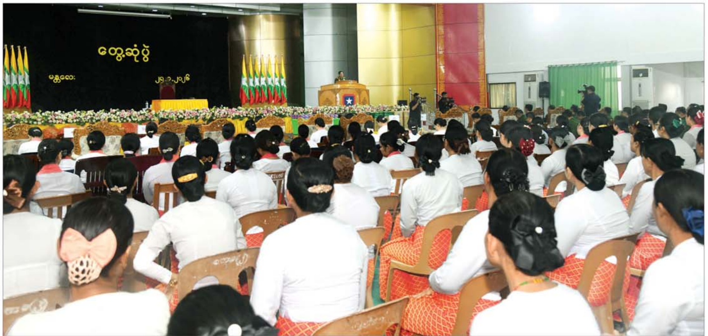
နိုင်ငံတော်လုံခြုံရေးနှင့် အေးချမ်းသာယာရေးကော်မရှင်ဥက္ကဋ္ဌ တပ်မတော်ကာကွယ်ရေးဦးစီးချုပ် ဗိုလ်ချုပ်မှူးကြီး မင်းအောင်လှိုင် မန္တလေးတပ်နယ်ရှိ အရာရှိ စစ်သည်၊ မိသားစုများအား တွေ့ဆုံအမှာစကားပြောကြားစဉ်။