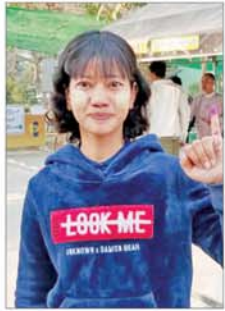
မာသန္တာလွင်