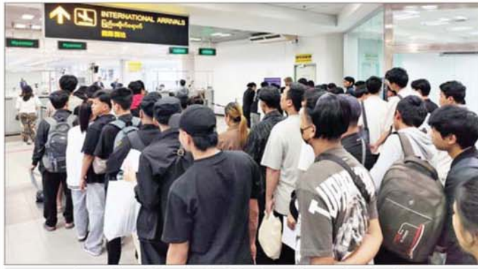
ကမ္ဘောဒီးယားနိုင်ငံမှ မြန်မာနိုင်ငံသို့ ပြန်လည်ရောက်ရှိလာသည့် မြန်မာနိုင်ငံသားများအား လိုအပ်သည့်စစ်ဆေးမှုများ ဆောင်ရွက်စဉ်။

နေပြည်တော် ဇန်နဝါရီ ၂၃ လိမ်လည်မှုများ၊ အွန်လိုင်း ထား တိုက်ဖျက်ဆောင်ရွက်လျက် မြန်မာနိုင်ငံ အစိုးရအနေဖြင့် လောင်းကစားမှုများ တိုက်ဖျက်ရေး ရှိပြီး Online Scam Center နိုင်ငံတကာနှင့် တစ်ကမ္ဘာလုံးကို အမျိုးသားရေး လုပ်ငန်းစဉ်များကို အမျိုးသားရေး လုပ်ငန်းများတွင် ပါဝင်ပတ်သက် အန္တရာယ်ပေးနေသည့် အွန်လိုင်း တာဝန်တစ်ရပ်အနေဖြင့် အလေး နေသူများနှင့် နောက်ကွယ်မှ