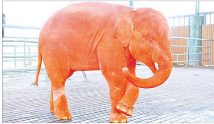
ဖြစ်ခြင်း၊ ခြေဖဝါးတွင်ရှေ့ခြေသည်း ငါးခုစီနှင့် စသည် ရတနာဆင်ဖြူတော်များ၏ ကြန်အင် နောက်ခြေသည်း လေးခုစီပါရှိခြင်း၊ နားကြီးခြင်း လက္ခဏာဆိုင်ရာချက်ကိုကိုင်ညီသော ဆင်ဖြူတော်ကလေး

နေပြည်တော် စန်နဝါရီ ၂၃ ရခိုင်ပြည်နယ် တောင်ကုတ်မြို့နယ်ရှိ မြန်မာ့သစ်လုပ်ငန်းဆိုင်ရင်းမှ ဆင်မ ၈ နှစ်ခန့်လျှောက် အသက် ၃၃ နှစ်က ဆင်ဖြူတော် (အထီး)ကလေး တစ်စီးအား ၂၀၂၂ ခုနှစ် ဇူလိုင် ၂၃ ရက် နံနက် ၈ နာရီခန့် ၆ နာရီခွဲတွင် မွေးဖွားခဲ့ပြီး အဆိုပါ ဆင်ဖြူတော်ကလေးမှာ မွေးဖွားစဉ်တွင် အရပ်အမြင့် ၂ ပေ ၅ လက်မ၊ ကိုယ်လုံးလုံးပတ် ၃ ပေ ၁ လက်မ၊ ကိုယ်အလေးချိန် ပေါင် ၁၈၀ ခန့်ရှိသည်။