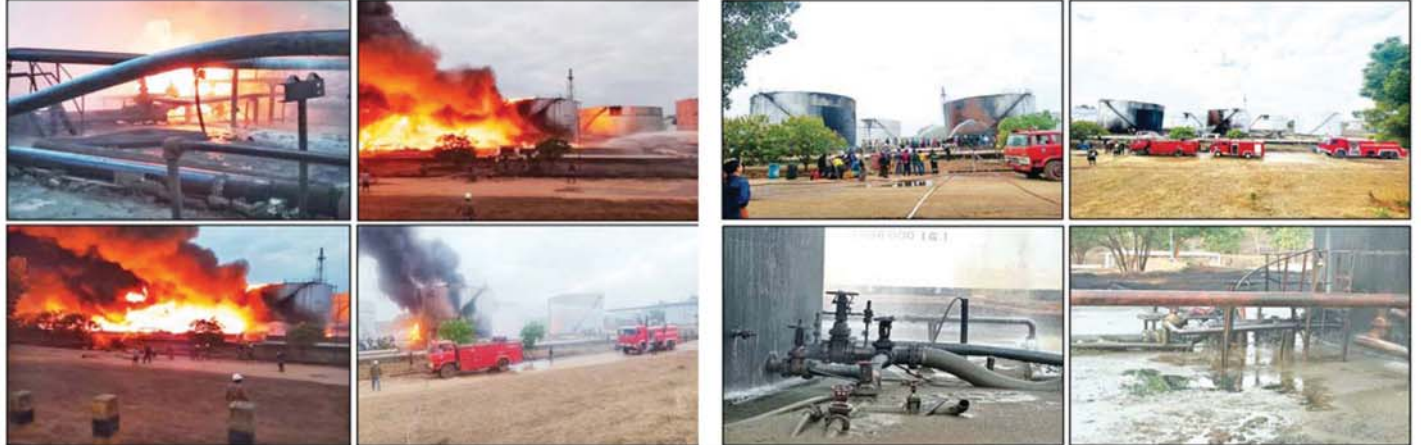
မကွေးတိုင်းဒေသကြီး မင်းလှမြို့နယ်ရှိ (မန်း)သံပရာကန် ရေနံချက်စက်ရုံ မီးလောင်မှုဖြစ်ပွားစဉ် မီးငြိမ်းသတ်နေမှုအား တွေ့ရစဉ်။

နေပြည်တော် ဇန်နဝါရီ ၂၃ မကွေးတိုင်းဒေသကြီး မင်းလှမြို့နယ်ရှိ ရေနံ ဓာတုပေးစက်ရုံ(သံပရာကန်)၌ ယနေ့နံနက် ၆ နာရီ ၅ မိနစ်ခန့်တွင် စတင်မီးလောင်ကျွမ်းမှုဖြစ်ပွား ခဲ့ရာ စက်ရုံရှိ မီးသတ်ဝန်ထမ်းများနှင့် စက်ရုံဝန်ထမ်း များ၊ တပ်နယ်၊ ခရိုင်၊ မြို့နယ်များရှိ မီးသတ်တပ်ဖွဲ့ဝင် များနှင့် အတူပူးပေါင်းပြီး ဝိုင်းဝန်းငြိမ်းသတ်နိုင်ခဲ့ မှုကြောင့် နံနက် ၇ နာရီတွင် မီးငြိမ်းသတ်နိုင်ပြီး လက်ရှိအချိန်တွင် ကုန်ထုတ်လုပ်မှုလုပ်ငန်းများ ပုံမှန် ပြန်လည် လည်ပတ်လျက်ရှိသည်။ အဆိုပါမီးလောင်ကျွမ်းမှုဖြစ်စဉ် ဖြစ်ပေါ်ခဲ့ခြင်း ကို စွမ်းအင်ဝန်ကြီးဌာန ဒုတိယဝန်ကြီးနှင့် တာဝန် ရှိသူများက မင်းလှမြို့နယ်ရှိ မြန်မာ့ရေနံဓာတုပေး လုပ်ငန်း၏ ရေနံဓာတုပေးစက်ရုံစု (သံပရာကန်)