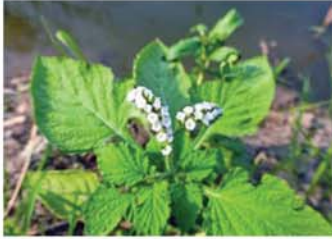
ဆင်းနွာမောင်းပင်

ဆင်းနွာမောင်းပင်ဟာ နေရာအနှံ့အပြားမှာ အလေ့ကျပေါက်တဲ့အပင်ဖြစ်ပြီး တန်ဖိုးမမြတ် နိုင်တဲ့ ဆေးဖက်ဝင်အပင် တစ်မျိုးဖြစ်ပါတယ်။