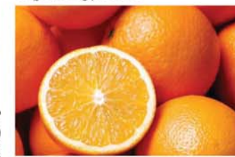
လိမ္မော်သီး

ပန်းဂေါ်ဖီစိမ်းဟာ ဗိုက်ပြည့်စေမယ့် ကာရို ဟိုက်ဒရိုနဲ့ ကယ်လိုရီနည်းသောကြောင့် ကိုယ် အလေးချိန်လျော့ချဖို့နဲ့ ဆီးချိုရောဂါအတွက် အထူးကောင်းမွန်ပါတယ်။