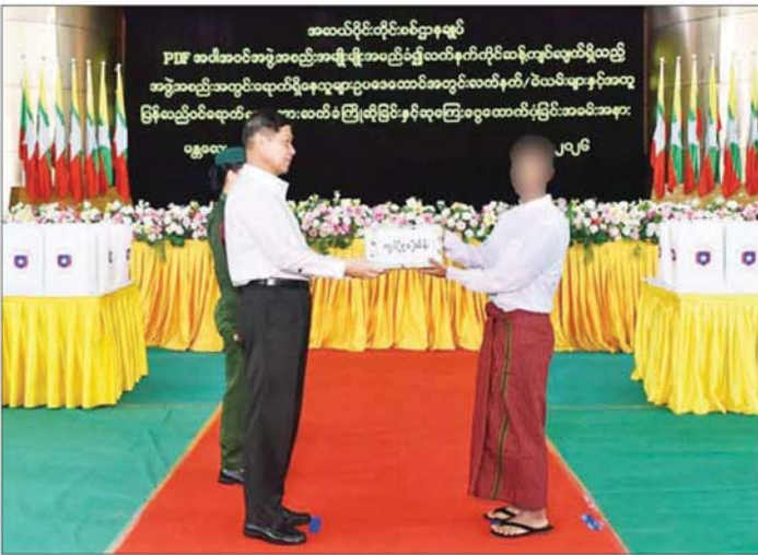
အထည်ပိုင်ဆိုင်ဝင်ငွေရရှိရန် အထည်ပိုင်ဆိုင်သူများအား ဥပဒေဘောင်အတွင်းသို့ ပြန်လည်ဝင်ရောက်စေရန် ရည်ရွယ်ချက်ဖြင့် ဖိတ်ခေါ်ခဲ့ခြင်းဖြစ်သည်။