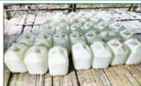
၅ ဂါလန်ပုံး အဖြူ အက်စစ်ပီ ၇၅ ပုံး တွေ့ရှိမှု။