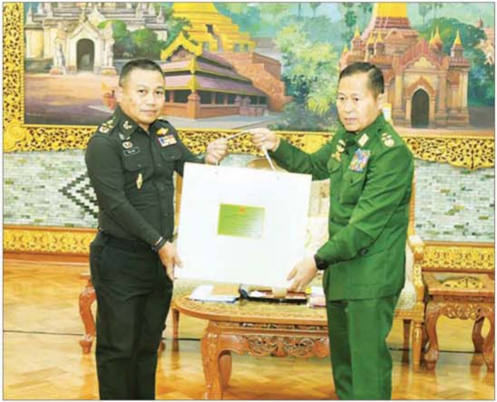
နိုင်ငံတော်လုံခြုံရေးနှင့် အေးချမ်းသာယာရေးကော်မရှင် ဒုတိယဥက္ကဋ္ဌ ဒုတိယတပ်မတော်ကာကွယ်ရေး ဦးစီးချုပ် ကာကွယ်ရေးဦးစီးချုပ်(ကြည်း) ဒုတိယဗိုလ်ချုပ်မှူးကြီး စိုးဝင်းနှင့် ထိုင်းဘုရင့်ကြည်းတပ်ဦးစီး ချုပ်ရုံး၊ Army Operation Center | Neighboring Countries Coordination Center (NCCC) ဌာန၏ အကြီးအကဲ General Direk Bongkam တို့ အမှတ်တရလက်ဆောင်ပစ္စည်းများ အပြန်အလှန်ပေးအပ်စဉ်။ အခြေအနေများနှင့် ပတ်သက်၍ ရင်းရင်းနှီးနှီး ထိုင်းဘုရင့်ကြည်းတပ်ဦးစီးချုပ်ရုံး၊ (NCCC) ဌာန၏ အကြီးအကဲတို့သည် အမှတ်တရလက်ဆောင်ပစ္စည်း များ အပြန်အလှန်ပေးအပ်ပြီး တက်ရောက်လာကြ သူများနှင့်အတူ စုပေါင်းမှတ်တမ်းတင်စာတံပုံရိုက် ခဲ့ကြကြောင်း သတင်းရရှိသည်။ သတင်းစဉ် အခြေအနေများနှင့် ပတ်သက်၍ ရင်းရင်းနှီးနှီး ဆွေးနွေးခဲ့ကြသည်။ စုပေါင်းမှတ်တမ်းတင်စာတံပုံရိုက် တွေ့ဆုံပွဲအပြီးတွင် နိုင်ငံတော်လုံခြုံရေးနှင့် အေးချမ်းသာယာရေးကော်မရှင် ဒုတိယဥက္ကဋ္ဌနှင့်

တိုးတက်လျက်ရှိသည့် အခြေအနေများနှင့် ရေရှည်တည်တံ့ခိုင်မြဲအောင် ဆက်လက်ဆောင်ရွက် သွားမည့်အခြေအနေများ၊ နှစ်နိုင်ငံအကြား သဘော တူညီချက်များအား ဆက်လက်အကောင်အထည်ဖော် ဆောင်ရွက်သွားမည်ဖြစ်သည့် အခြေအနေများနှင့် ပူးပေါင်းဆောင်ရွက်မှုများ တိုးတက်ကောင်းမွန်နေ စေရေး ဆက်လက်ဆောင်ရွက်သွားမည်ဖြစ်သည့် အခြေအနေများ၊ နှစ်နိုင်ငံကုန်သွယ်မှု၊ ကုန်စည် စီးဆင်းမှုများ ပြန်လည်ကောင်းမွန်ရေးအတွက် နယ်စပ် ဒေသတည်ငြိမ်အေးချမ်းရေးကို နှစ်နိုင်ငံအစိုးရနှင့် တပ်မတော်နှစ်ရပ်အကြား ပူးပေါင်း၍ ထိန်းသိမ်း ဆောင်ရွက်သွားနိုင်မည့် အခြေအနေများနှင့် နယ်စပ် ဒေသများတွင် တရားမဝင်ကုန်သွယ်မှုများနှင့် တရားမဝင်လုပ်ငန်းများ လုပ်ကိုင်မှုမရှိစေရေး ထိန်းသိမ်းဆောင်ရွက်သွားရန် လိုအပ်သည့်အခြေ အနေများ၊ မြန်မာနိုင်ငံအစိုးရအနေဖြင့် အွန်လိုင်း လိမ်လည်လောင်းကစားမှုများ တစ်ကျော့ပြန် မပေါ်ပေါက်လာစေရေးနှင့် မူးယစ်ဆေးဝါးတိုက်ဖျက် ရေးလုပ်ငန်းစဉ်များကို အမျိုးသားရေးတာဝန်တစ်ရပ် အဖြစ်ခံယူ၍ အင်တိုက်အားတိုက်ဆောင်ရွက်လျက် ရှိသည့်အခြေအနေများနှင့် နှစ်နိုင်ငံသတင်းအချက် အလက်များ ဖလှယ်ခြင်းများအပါအဝင် ပူးပေါင်း ဆောင်ရွက်မှုများကို တိုးမြှင့်ဆောင်ရွက်သွားနိုင်မည့် အခြေအနေများ၊ မြန်မာနိုင်ငံတွင် ၂၀၂၅ ခုနှစ် ပါတီစုံဒီမိုကရေစီ အထွေထွေရွေးကောက်ပွဲအပိုင်း(၁) နှင့်အပိုင်း(၂)ကို အောင်မြင်စွာ ကျင်းပပြီးစီးခဲ့သည့် အခြေအနေများနှင့် လာမည့်စနစ်နာဝါရီ ၂၅ ရက်နေ့ တွင်အပိုင်း(၃)ကို ဆက်လက်ကျင်းပသွားမည်ဖြစ်သည့်