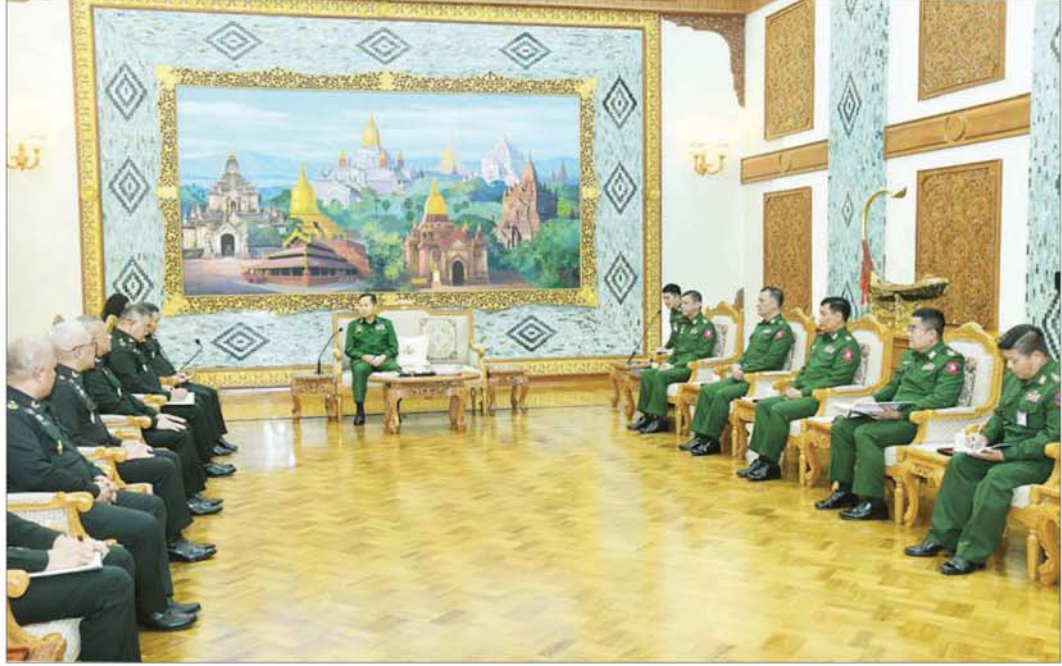
နိုင်ငံတော်လုံခြုံရေးနှင့် အေးချမ်းသာယာရေးကော်မရှင် ဒုတိယဥက္ကဋ္ဌ ဒုတိယတပ်မတော်ကာကွယ်ရေးဦးစီးချုပ် ကာကွယ်ရေးဦးစီးချုပ်(ကြည်း) ဒုတိယဗိုလ်ချုပ်မှူးကြီး စိုးဝင်း ထိုင်းဘုရင့်ကြည်းတပ်ဦးစီးချုပ်ရုံး၊ Army Operation Center ၊ Neighboring Countries Coordination Center (NCCC) ဌာန၏ အကြီးအကဲ General Direk Bongkarn ဦးဆောင်သည့် ကိုယ်စားလှယ်အဖွဲ့အား လက်ခံတွေ့ဆုံစဉ်။

နေပြည်တော် ဇန်နဝါရီ ၂၂ နိုင်ငံတော်လုံခြုံရေးနှင့် အေးချမ်းသာယာရေး ကော်မရှင်ဒုတိယဥက္ကဋ္ဌ ဒုတိယတပ်မတော်ကာကွယ်ရေးဦးစီးချုပ် ကာကွယ်ရေးဦးစီးချုပ်(ကြည်း) ဒုတိယဗိုလ်ချုပ်မှူးကြီး စိုးဝင်းသည် ထိုင်းဘုရင့်ကြည်းတပ်ဦးစီးချုပ်ရုံး၊ Army Operation Center ၊ Neighboring Countries Coordination Center (NCCC) ဌာန၏ အကြီးအကဲ General Direk Bongkarn ဦးဆောင်သည့် ကိုယ်စားလှယ်အဖွဲ့အား ယနေ့မနန်းလှိုင်တွင် နေပြည်တော်ရှိ ဘုရင့်နောင်ရိပ်သာညောင်ခန်းမ၌ လက်ခံတွေ့ဆုံသည်။ အဆိုပါ တွေ့ဆုံပွဲ၌ နိုင်ငံတော်လုံခြုံရေးနှင့် အေးချမ်းသာယာရေးကော်မရှင် ဒုတိယဥက္ကဋ္ဌ ဒုတိယတပ်မတော်ကာကွယ်ရေးဦးစီးချုပ် ကာကွယ်ရေးဦးစီးချုပ်(ကြည်း)နှင့်အတူ ကာကွယ်ရေးဦးစီးချုပ်ရုံး(ကြည်း)မှ ဒုတိယဗိုလ်ချုပ်ကြီး ညွှန်ဝင်းဆွေနှင့် တပ်မတော်အရာရှိကြီးများ တက်ရောက်ကြပြီး ထိုင်းဘုရင့်ကြည်းတပ်ဦးစီးချုပ်ရုံး (NCCC) ဌာန၏ အကြီးအကဲနှင့်အတူ မြန်မာနိုင်ငံဆိုင်ရာ ထိုင်းဘုရင့်ကြည်းတပ်စစ်သံမှူး Senior Colonel Pongphan Puttha နှင့် ထိုင်းဘုရင့်ကြည်းတပ်ဦးစီးချုပ်ရုံးနှင့် (NCCC) ဌာနတို့မှ တာဝန်ရှိသူများ တက်ရောက်ကြသည်။ ထိုသို့တွေ့ဆုံရာတွင် နှစ်နိုင်ငံတပ်မတော် အကြီးအကဲများ၏ ဦးဆောင်မှုဖြင့် တပ်မတော်နှစ်ရပ် အကြား ဆက်ဆံရေးကောင်းမွန်လျက်ရှိပြီး ချစ်ကြည်ရင်းနှီးမှုများ စာမျက်နှာ ၁ သို့