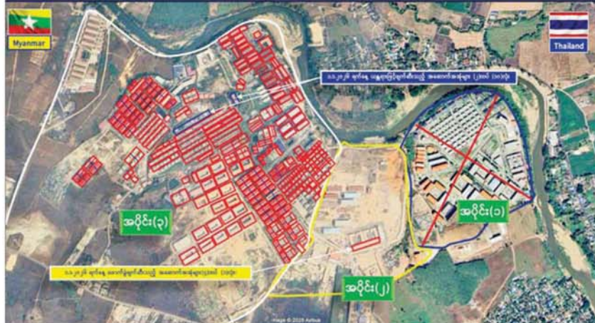
ကရင်ပြည်နယ် မြဝတီမြို့နယ် KK Park နယ်မြေအတွင်းရှိ တရားမဝင်အဆောက်အအုံများအား ဖောက်ခွဲဖျက်ဆီးမှုကို တွေ့ရစဉ်။ (၁-၁-၂၀၂၆)

ကျောက်ဆည် စနံနံဝါရီ ၁ မန္တလေးဒေသကြီး ကျောက်ဆည်မြို့နယ် ဆုတောင်းပြည့် မဟာရွှေသိမ်တော် တန်ခိုးကြီးဘုရားတွင် ၂၀၂၆ ခုနှစ် နှစ်ဦးတစ်ရက်နေ့၌ ရပ်နီး/ရပ်ဝေးမှ ဘုရားဖူးလာပြည်သူများဖြင့် စည်ကားလျက်ရှိကြောင်း သိရှိရသည်။ စာမျက်နှာ ၄ သို့ ❖