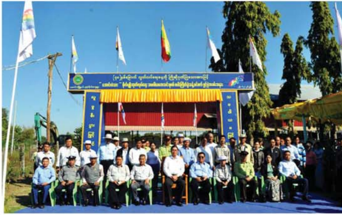
(၇၀)နှစ်မြောက် လွတ်လပ်ရေးနေ့ကို ကြိုဆိုရက်ပြုသောအားဖြင့် အောင်လံသား စိုက်ပျိုးထုတ်လုပ်ရေး သမဝါယမအသင်းစု၏ စပါးကြိုက်ခွဲသန့်စင်စက် ဖွင့်ပွဲကျင်းပ

အောင်လံ စနံနခဝါရီ ၁ ယမန်နေ့ နံနက် ၁၀ နာရီက မကွေးတိုင်းဒေသကြီး၊ ကျင်းပခဲ့ရာ မကွေးတိုင်းဒေသ အောင်လံခရိုင်၊ အောင်လံမြို့နယ်၊ ဒုရက်မိုင်ကျေးရွာတွင် 'အောင်လံ သား' စိုက်ပျိုးထုတ်လုပ်ရေး သမဝါယမအသင်းစု၏ စပါး ကြိုက်ခွဲသန့်စင်စက် ဖွင့်ပွဲကို