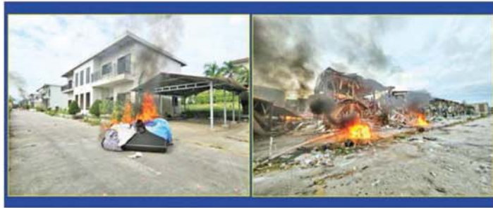
KK Park နယ်မြေအတွင်း အွန်လိုင်းလိမ်လည်လောင်းကစားမှုကျူးလွန်ရာတွင် အသုံးပြုသည့်ပစ္စည်းများအား မီးရှို့ဖျက်ဆီးထားမှုကို တွေ့ရစဉ်။

မြစ်သားမြစ်ရေသည် ကလေးမြို့တွင် ပေဝက်ခန့်၊ ဒုဋ္ဌတော်မြစ်ရေသည် သီပေါမြို့တွင် သုံးလက်မခန့်၊ ရွှေစာရံနှင့် မြစ်ငယ်မြို့တို့တွင် ပေဝက်မှ တစ်ပေခန့်၊ စစ်တောင်းမြစ်ရေသည် တောင်ငူမြို့နှင့် မဒေါက်မြို့တို့တွင် ပေဝက်ခန့်စီ၊ ရွှေကျင်မြစ်ရေသည် ရွှေကျင်မြို့တွင် သုံးလက်မခန့်၊ ပဲခူးမြစ်ရေသည် ဖောင်းတုမြို့တွင် ပေဝက်ခန့်၊ သောင်ရင်းမြစ်ရေသည် မြစ်တော်မြို့တွင် ပေဝက်ခန့်နှင့် ငဝန်မြစ်ရေသည် ငါးသိုင်းချောင်းမြို့တွင် ပေဝက်ခန့် လက်ရှိရေမှတ်များအောက် ကျဆင်းလာနိုင်ပြီး ပဲခူးမြစ်ရေသည် ပဲခူးမြို့တွင် တစ်ပေခန့်၊ သံလွင်မြစ်ရေသည် ဘားအံမြို့တွင် ပေဝက်ခန့်၊ ငဝန်မြစ်ရေသည် သာပေါင်းမြို့နှင့် ပုသိမ်မြို့တို့တွင် ပေဝက်ခန့်စီ တိုးမြစ်ရေသည် မအူဝင်မြို့တွင် တစ်ပေခန့်နှင့် ဘီးလင်းမြစ်ရေသည် ဘီးလင်းမြို့တွင် ပေဝက်ခန့် လက်ရှိရေမှတ်များအောက် မြင့်တက်လာနိုင်သည်။ မိုး/ဇလ