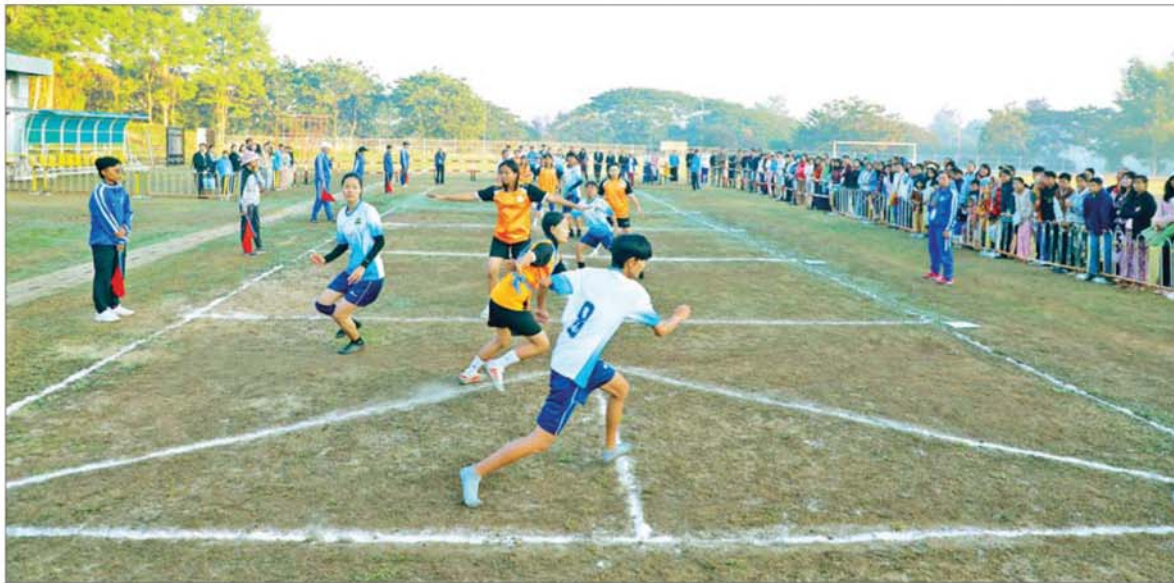
(၇၈) နှစ်မြောက် လွတ်လပ်ရေးနေ့အထိမ်းအမှတ် ဝန်ကြီးဌာနပေါင်းစုံ ထုပ်ဆီးတိုး(အမျိုးသမီး)ပြိုင်ပွဲ ယှဉ်ပြိုင်ကစားကြစဉ်။

နေပြည်တော် ဇန်နဝါရီ ၁ အားကစားနှင့် လူငယ်ရေးရာ ဝန်ကြီးဌာနမှ ကြီးမှူးကျင်းပသည့် ၂၀၂၆ ခုနှစ် (၇၈)နှစ်မြောက် လွတ်လပ်ရေးနေ့ အထိမ်းအမှတ် ဝန်ကြီးဌာနပေါင်းစုံ ထုပ်ဆီးတိုး (အမျိုးသမီး)ပြိုင်ပွဲ ပွဲစဉ်များနှင့် လွန်ဆွဲ(အမျိုးသား/အမျိုးသမီး) ပြိုင်ပွဲ ပွဲစဉ်များကို ယနေ့နံနက် ၇ နာရီမှ စတင်ကာ နေပြည်တော် ဝဏ္ဏသိဒ္ဓိ အားကစားကွင်းအတွင်း ရှိ လေ့ကျင့်ရေးကွင်းအမှတ်(၃) နှင့် (၄)တို့၌ ကျင်းပသည်။ ကြည့်ရှုအားပေး ပြိုင်ပွဲ ပွဲစဉ်များကို ဌာနဆိုင်ရာ တာဝန်ရှိသူများ၊ ဝန်ကြီးဌာန များမှ အရာထမ်း၊ အမှုထမ်း များနှင့် အားကစားဝါသနာရှင်များ လာရောက် ကြည့်ရှုအားပေးကြ သည်။ စာမျက်နှာ ၃ သို့ ၀