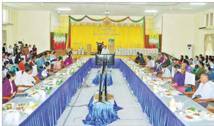
ထို့နောက် ပြည်ထောင်စုဝန်ကြီးသည် ဝန်ထမ်း ပေးအပ်ပြီး ဝန်ထမ်းများနှင့်အတူတကွ နေ့လယ်စာများအား ကံစမ်းမဲများ ဖွင့်ဖောက်ပေးအပ်နေမှု အခြေ သုံးဆောင်ခဲ့ကြောင်း သိရသည်။ အနေတို့ကို အားပေးကြည့်ရှု၍ ဆုလက်ဆောင်များ

အချင်းချင်း အထက်အောက်မခွဲခြားဘဲ ချစ်ခင်ရင်းနှီးမှုကိုရရှိစေပြီး လုပ်ငန်းတာဝန်များကို ထမ်းဆောင်နေချိန်တွင် ဖိစီးနေသည့် စိတ်တင်းကျပ်မှုများကို လည်း ပြေလျော့စေမည်ဖြစ်ကြောင်း၊ နှစ်သစ်ကူးချိန်တွင် ဝန်ထမ်းများအနေဖြင့် ကျရာတာဝန်များကို ထမ်းဆောင်ရင်း ရှေ့ဆက်လုပ်ဆောင်ရမည့် လုပ်ငန်းတာဝန်များ ဆောင်ရွက်ရာတွင် တွေ့ကြုံရမည့် အခက်အခဲများကို ညီညီညွတ်ညွတ်ဖြင့် ပေါင်းစပ်လုပ်ကိုင် ဆောင်ရွက်သွားကြရမည်ဖြစ်ကြောင်း၊ နှစ်သစ်ကူးပွဲတွင် စိတ်သစ်၊ လူသစ်၊ ခွန်အားသစ်များနှင့် ဌာန၏လုပ်ငန်းတာဝန်များ၊ မိသားစုတာဝန်များကို ကျေပွန်စွာထမ်းဆောင်နိုင်ပါစေဟု ဆုမွန်ကောင်းတောင်းပါကြောင်း ပြောကြားသည်။