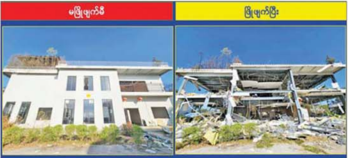
KK Park နယ်မြေအပိုင်း(၃)တွင် တရားမဝင်ဆောက်လုပ်ထားသည့် နှစ်ထပ် လူနေအဆောက်အအုံအား မဖြိုဖျက်စီနှင့် ဖြိုဖျက်ပြီးနောက် တွေ့ရစဉ်။