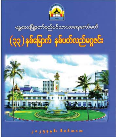
မန္တလေးမြို့တော်စည်ပင်သာယာရေးကော်မတီ (၃၃)နှစ်မြောက် နှစ်ပတ်လည်မဂ္ဂဇင်း

လျင်မြန်စွာ ဖွံ့ဖြိုးလာသော မြို့ပြတစ်ခုအတွက် လိုအပ်ချက် များသည်လည်း လွန်စွာများပြားလှသည်ကို တွေ့ရမည်ဖြစ်သည်။ မြို့နေလူထုအတွက် လိုအပ်သော အခြေခံအဆောက်အအုံများ များပြားလာသဖြင့် စနစ်ကျနမူရီစေရေး၊ ပိုင်ဆိုင်မှုထောက်အထား ပြည့်စုံရေး၊ ကျန်းမာမှုနှင့်ပြည့်ဝစေရန် ရေးဆွဲထုတ်ဖော်ခြင်းနှင့် ရေချိုးစနစ်ပစ်စနစ်များ၊ အများပြည်သူသုံးစွဲသည့်လမ်းများ အဆင့် မြှင့်တင်ရေး၊ တစ်မြို့လုံးမှ စွန့်ပစ်သောအမှိုက်နှင့် အညစ်အကြေး များ သိမ်းဆည်း၍ စနစ်တကျ စွန့်ပစ်ရေး၊ လျှပ်စစ်မီး အဆင်ပြေ ရေး၊ လိုအပ်သောမြို့ကြွက်သစ်ဖော်ထုတ်ရေး၊ မြို့နေလူထုအား သိသင့်သိထိုက်သော သတင်းအချက်အလက်များ သိစေရန် ဗဟု သုတများ တိုးပွားစေရန် သတင်းစာထုတ်ဝေခြင်း၊ သန့်ရှင်းသော ရေပေးခြင်း စသည့် များပြားလှသည့် တာဝန်များကို ရှိသည့်