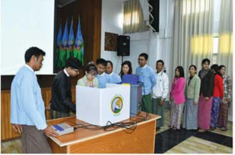
မဲပေးမှုရလဒ်ထွက်ပေါ်ခြင်း အခြေပြောကြားခဲ့ကြောင်း သိရသည်။ (အပေါ်ပုံ) (၁၉၅)

ကုန်သွယ်ရေးကို စိုက်ပျိုးစဉ် ကာလအတွင်း မီးရှို့ခြင်းမပြုသည့် ထုတ်လုပ်မှုစရိတ်များ သို့မဟုတ် လယ်ယာလုပ်ငန်းခွင်များကနေ တင်သွင်းရန် လိုအပ်သည်။ နယ်စပ်ဖြတ်ကျော် စီးနိုးမြို့နဲ့ PM2.5 ညစ်ညမ်းမှုကို လျော့ချရန် ပတ်ဝန်းကျင်နှင့် သဟဇာတ ဖြစ်သော စိုက်ပျိုးရေးကို ပံ့ပိုးရန် နှင့် ကမ္ဘာ့ကုန်သွယ်ရေး ခေတ်ရေစီးကြောင်းနှင့်အညီ စိုက်ပျိုးရေးဆိုင်ရာ ထောက်ပံ့ရေးကွင်းဆက် စံနှုန်းများကို အဆင့်မြှင့်တင်ရန် ရည်ရွယ်ထားသည်။ ပြောင်းတင်သွင်းသူများအနေ ဖြင့် မီးရှို့ခြင်းမပြုလုပ်ရန်ဆိုသည့် လိုအပ်ချက်နှင့် ကိုက်ညီကြောင်း