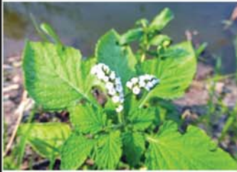
ဆင်နာမောင်းပင်

ဆင်နာမောင်းပင်ဟာ နေရာအနှံ့အပြားမှာ အလေ့ကျပ်ကျပ်အပင်ဖြစ်ပြီး တန်ဖိုးမမြတ်နိုင်တဲ့ ဆေးဖက်ဝင်အပင်တစ်မျိုးဖြစ်ပါတယ်။