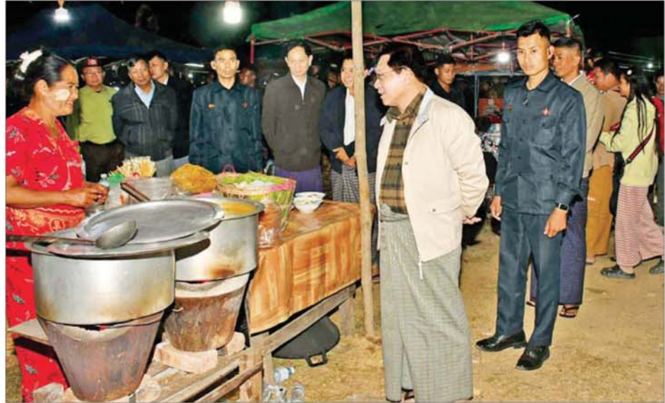
ပြည်ထောင်စုသမ္မတ မြန်မာနိုင်ငံတော်ယာယီသမ္မတ နိုင်ငံတော်လုံခြုံရေးနှင့် အေးချမ်းသာယာရေးကော်မရှင်ဥက္ကဋ္ဌ ဗိုလ်ချုပ်မှူးကြီး မင်းအောင်လှိုင် (၄၂)ကြိမ်မြောက် ကျင်းပတုံမြို့နယ် လားဟူတိုင်းရင်းသားရိုးရာ စုပေါင်းနှစ်သစ်ကူးပွဲတော်၌ ဈေးရောင်းချနေသူများအား ရင်းရင်းနှီးနှီး နှုတ်ဆက်စဉ်။

အဘယရာဇမုနိ ရုပ်ပွားတော်မြတ်ကြီး ငင်းနောက် နိုင်ငံတော်ယာယီ သမ္မတ နိုင်ငံတော်လုံခြုံရေးနှင့် အေးချမ်းသာယာရေးကော်မရှင် ဥက္ကဋ္ဌနှင့် အဖွဲ့ဝင်များသည် အဘယရာဇမုနိ ရုပ်ပွားတော် မြတ်ကြီးသို့ ရောက်ရှိကြပြီး စာမျက်နှာ ၄ သို့