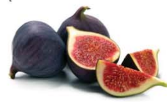
သဖန်းသီး

ကီဝီသီးမှာတွေ့ရတဲ့ Actinidin Enzyme က ပရိုတင်းခြေဖျက်ရာမှာ ကူညီပြီး အစာကြေညက်မှုကို ကောင်းစေပါတယ်။