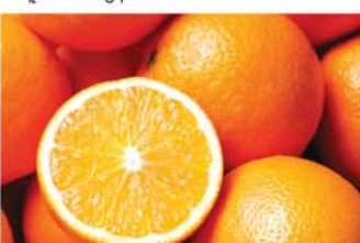
လိမ္မော်သီး

ပန်းဂေါ်ဖီစိမ်းဟာ ဖိုက်ပြည့်စေမယ့် ကာဗိုဟိုက်ဒရိတ်နဲ့ ကယ်လိုရီနည်းသောကြောင့် ကိုယ်အလေးချိန်လျော့ချဖို့နဲ့ ဆီးချိုရောဂါအတွက် အထူးကောင်းမွန်ပါတယ်။