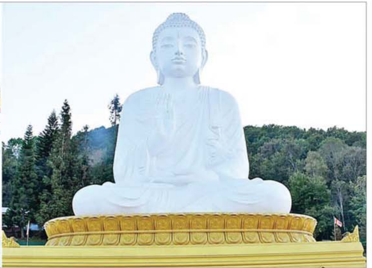
ပြည်ထောင်စုသမ္မတမြန်မာနိုင်ငံတော် ယာယီသမ္မတ နိုင်ငံတော်လုံခြုံရေးနှင့် အေးချမ်းသာယာရေးကော်မရှင်ဥက္ကဋ္ဌ ဗိုလ်ချုပ်မှူးကြီး မင်းအောင်လှိုင် ရှမ်းပြည်နယ်(အရှေ့ပိုင်း) ကျိုင်းတုံမြို့၊ ဗုဒ္ဓဥယျာဉ်ဝတ္ထုကံတော် အတွင်း တည်ထားကိုးကွယ်သည့် အဘယရာဇမုနိ ရုပ်ပွားတော်မြတ်ကြီးအား ဖူးမြော်ကြည့်ညိစဉ်။