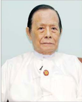
ဦးဝင်းလွင် (အငြိမ်းစားသံအမတ်ကြီး)

နဂါးမင်းစစ်ဆင်ရေး စတင်ဖြစ်စဉ်ကာလတုန်းက ကျွန်တော်က နိုင်ငံခြားရေးဝန်ကြီးဌာနမှာ သက်ဆိုင်ရာဌာနကိုကိုင်တွယ်တဲ့ တာဝန်ခံဖြစ်ပါတယ်။ အဲဒီတော့ ပြည်ပကနေ တရားမဝင် ဝင်တဲ့ သူတွေများလာတော့ သန်းခေါင်စာရင်း ပြန်စစ်ဆေးမှု လုပ်ကြတယ်။ ဒီလိုလုပ်တဲ့အခါ ပထမဆုံး Pilot Project ဆိုပြီး မင်္ဂလာတောင်ညွန့်မှာထင်တယ်။ အဲဒီမှာစပြီးလုပ်တယ်။ အဲဒီကနေ ရခိုင်ပြည်နယ် စစ်တွေအထိ သွားပြီးလုပ်တယ်။ အဲဒီလို လုပ်တဲ့ အချိန်မှာ ရခိုင်ပြည်နယ်အထက် အကြောင်းအမျိုးမျိုး ကြောင့် ဝင်ရောက်နေကြတဲ့သူတွေက သူတို့ဆီမှာ တရားဝင်မှတ်ပုံတင်လက်မှတ်မရှိတော့ ထွက်ပြေး သွားကြတယ်။