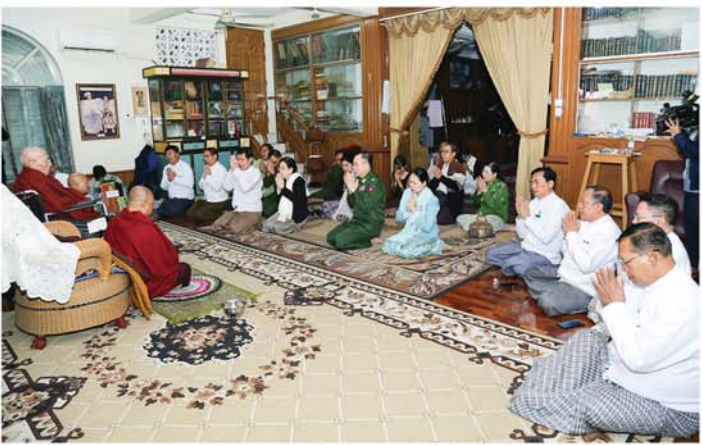
ဦးစီးပမာန နာယက၊ နိုင်ငံတော်ဩဝါဒါစရိယ အဘိဓမ္မဟာရဋ္ဌဂုရု၊ အဘိဓမ္မဟာသဒ္ဓမ္မဇောတိက ဘဒ္ဒန္တဝိစာရိန္ဒာဘိဝံသ သက်တော်ရှည်ဆရာတော်ကြီးက ဝိဇယနုပွေးနေ့မင်္ဂလာအဖြစ် တပည့်သံဃာတော်များအား ဆွမ်းဆက်ကပ်လှူဒါန်းခြင်း၊ ဧည့်ပရိသတ်အပေါင်းတို့အား စတုဒီသာများဖြင့် ကျွေးမွေးဆွမ်းခံခြင်း ကောင်းကောင်းမှုလျက်ရှိကြောင်း သိရသည်။ (မန္တလေးနေ့စဉ်)

ဇနီး၊ အစိုးရအဖွဲ့ဝင်များ၊ တပည့်ဒါယကာ၊ ဒါယိကာမနှင့် တက်ရောက်လာကြသူများသည် နမောတဿ သုံးကြိမ်ရွတ်ဆို ဘုရားကန်တော့၍ ငါးပါးသီလခံယူဆောက်တည်ခြင်းများ၊ လှူဒါန်းမှုအစုစုအတွက် အနုမောဒနာ တရားနာယူခြင်းများကို ဆောင်ရွက်ခဲ့ကြပြီးနောက် ဆရာတော်ကြီး၏ သက်တော် (၉၇) နှစ်ပြည့် ဝိဇယနုပွေးနေ့မင်္ဂလာ အထိမ်းအမှတ် လှူဖွယ်ပစ္စည်းများနှင့် အာဟာရပြည့်စွက်စာများ၊ နဝကမ္မဝတ္ထုငွေများကို တိုင်းဒေသကြီး ဝန်ကြီးချုပ်နှင့် ဇနီး၊ အလယ်ပိုင်းတိုင်းစစ်ဌာနချုပ် တိုင်းမှူးနှင့် ဇနီးတို့က ဆက်ကပ်လှူဒါန်းခဲ့သည်။ ယနေ့ ကျင်းပသည့် မဟာဝိစိတာရုံပရိယတ္တိစာသင်တိုက်၏