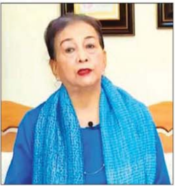
ဒေါက်တာ ရင်ရင်နွယ်

ပထမအချက် ကျွန်မပြောချင်တာက သူ့ကို Report ကို ဦးဆောင်ဖို့ ဘာကြောင့် ရွေးလိုက်သလဲ ဆိုတာ ရှင်းရှင်းပြောရင် ကျွန်မသိပ်ပြီး နားမလည် ပါဘူး။ ဘာဖြစ်လို့လဲဆိုတော့ ကိုဖီအာနန်ရဲ့ ကိုယ်ရေး အတ္ထုပ္ပတ္တိပဲဖြစ်ဖြစ် UN ကထုတ်တဲ့ အတ္ထုပ္ပတ္တိပဲ ဖြစ်ဖြစ် အတ္ထုပ္ပတ္တိတစ်ခုခုကို ကြည့်လိုက်မယ်ဆိုရင် ကိုဖီအာနန်က ကုလသမဂ္ဂမှာရှိတဲ့ နိုင်ငံတွေရဲ့ အချုပ်အခြာအာဏာကို သိပ်အလေးမထားတဲ့ အတွင်းရေးမှူးချုပ်လို့ပဲ ကျွန်မသုံးသပ်ရမှာပဲ။ ဥပမာ