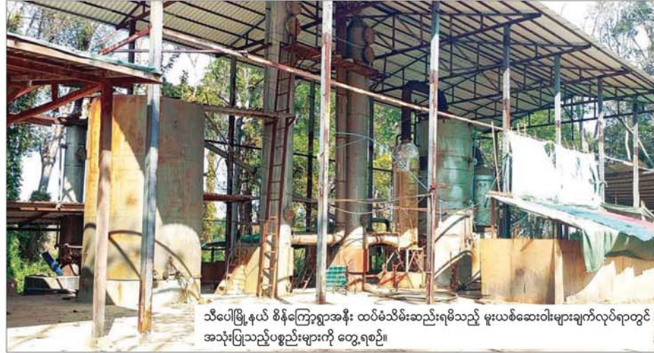
သီပေါမြို့နယ် စိန်ကြောရွာအနီး ထပ်မံသိမ်းဆည်းရမိသည့် မူးယစ်ဆေးဝါးများချက်လုပ်ရာတွင် အသုံးပြုသည့်ပစ္စည်းများကို တွေ့ရစဉ်။

လန်ဒန် ဇန်နဝါရီ ၁၆ နယူးကာဆယ်အသင်းသည် နောက်ခံကစားသမား ဆခင်ဘော့တံမန်းကို ၂၀၂၀ ပြည့်နှစ် အထိ သက်တမ်းတိုးစာချုပ်တစ်ရပ် ချုပ်ဆိုခဲ့ကြောင်း အတည်ပြုထုတ်ပြန်ကြေညာခဲ့သည်။ အဆိုပါ နောက်ခံကစားသမားသည် နယူးကာဆယ်အသင်းနှင့်အတူ ၂၀၂၂-၂၀၂၃ မှ ၂၀၂၅-၂၀၂၆ ဘောလုံးရာသီအထိ ပြိုင်ပွဲစုံ ၉၁ ပွဲကစားပြီး နှစ်ပိုင်း သွင်းယူကာ ခြေစွမ်းပြနိုင်ခဲ့ခြင်းကြောင့် အသင်းက သက်တမ်းတိုးစာချုပ် ချုပ်ဆိုခဲ့ခြင်းဖြစ်သည်။ အသက်(၂၆)နှစ်အရွယ်ရှိ ဆခင်ဘော့တံမန်းက ကျွန်တော်အသင်းနဲ့ သက်တမ်းတိုးစာချုပ် ချုပ်ဆိုခဲ့ပါပြီ။ ဒီအသင်းနဲ့အတူ အောင်မြင်မှုများစွာကိုလည်း ရယူသွားချင်ပါတယ်။ ကစားသမားဘဝကိုလည်း ဒီအသင်းမှာပဲ ကုန်ဆုံးသွားလိမ့်မယ်ဟု ထုတ်ပြန်သည်။ (အပေါ်ပုံ)(NGB)