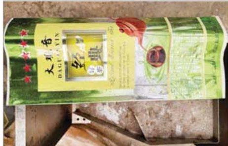
သီပေါမြို့နယ် နှစ်လခန့်ဒေသနှင့်မိုင်းရယ်မြို့အနီး ထပ်မံသိမ်းဆည်း ရမိသည့် မူးယစ်ဆေးဝါးချက်လုပ်သည့်နေရာတွင် တွေ့ရှိရသည့် လုပ်ပိုးခွဲများ။