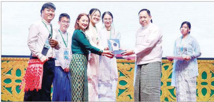
ပြည်ထောင်စုဝန်ကြီး ဒုတိယဗိုလ်ချုပ်ကြီး ရာပြည့် ကွန်ရက်အလိုက် စီမံချက်၊ အဆိုပြုချက်များနှင့်စပ်လျဉ်း၍ အဖွဲ့လိုက်ဆွေးနွေးမှုတွင် ပထမဆုံးရရှိသည့် လူငယ်အဖွဲ့အား ဆုချီးမြှင့်စဉ်။

အဆိုပါ အခမ်းအနားသို့ နိုင်ငံတော်လုံခြုံရေးနှင့် အေးချမ်းသာယာရေးကော်မရှင်အဖွဲ့ဝင်၊ အမျိုးသားစည်းလုံးညီညွတ်ရေးနှင့် ငြိမ်းချမ်းရေးဖော်ဆောင်မှုညွှန်ကြားရေးကော်မတီဥက္ကဋ္ဌ ပြည်ထောင်စုဝန်ကြီး ဒုတိယဗိုလ်ချုပ်ကြီး ရာပြည့်၊ ပြန်ကြားရေးဝန်ကြီးဌာန ပြည်ထောင်စုဝန်ကြီး ဦးမောင်မောင်အုန်း၊ အမျိုးသားစည်းလုံးညီညွတ်ရေးနှင့် ငြိမ်းချမ်းရေးဖော်ဆောင်မှု ညွှန်ကြားရေးကော်မတီအတွင်းရေးမှူး ဒုတိယဗိုလ်ချုပ်ကြီး မင်းနိုင်နှင့် ညွှန်ကြားရေးကော်မတီဝင်များ၊ တိုင်းဒေသကြီး၊ ပြည်နယ်များမှ လူမှုရေးရာဝန်ကြီးများ၊ ဝန်ကြီးဌာနများမှ ကိုယ်စားလှယ်များနှင့် နယ်ပယ်အသီးသီးမှ အသိပညာရှင်၊ အတတ်ပညာရှင်များ၊ တိုင်းဒေသကြီးနှင့် ပြည်နယ်များရှိ အလွှာအလွှာ NCA လက်မှတ်ရေးထိုးထားသည့် တိုင်းရင်းသားလက်နက်ကိုင် အဖွဲ့အစည်းများမှ လူငယ်ကိုယ်စားလှယ်များ၊ တိုင်းရင်းသားယဉ်ကျေးမှုနှင့် တာဝန်ယူရေးဆိုင်ရာ ယုံကြည်ကိုးကွယ်မှုအမျိုးမျိုးမှ လူငယ်ကိုယ်စားလှယ်များ၊ နယ်စပ်ဒေသများမှ တိုင်းရင်းသားလူငယ်များ၊ အခြားလိင်ကြားထားသည့် လူငယ်ကိုယ်စားလှယ်များနှင့် လေ့လာသူများ တက်ရောက်ကြသည်။