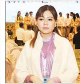
မန်းအိဖြေထက်

လူငယ်ငြိမ်းချမ်းရေးဖိုရမ် ၂၀၂၆ ကို နေပြည်တော်ရှိ မြန်မာအပြည်ပြည်ဆိုင်ရာ ကွန်ဗင်းရှင်းဗဟိုဌာန - ၁ (MICC 1) ၌ သုံးရက်တာကျင်းပခဲ့ပြီး ဖိုရမ်တော်ယူနေ့တွင် ဖိုရမ်၏ အဓိက အရေးအကြီးဆုံးအပိုင်းဖြစ်သည့် လူငယ်ကွန်ရက်ဖွဲ့စည်းခြင်း၊ ချိတ်ဆက်ခြင်း၊ ကွန်ရက်အလိုက် စီမံချက်၊ အဆိုပြုချက်များ တင်ပြဆွေးနွေးခြင်း၊ ဆွေးနွေးချက်များအပေါ် ပညာရှင်များက အကြံပြုဆွေးနွေးခြင်းတို့ကို ဆောင်ရွက်ခဲ့ကြသည်။