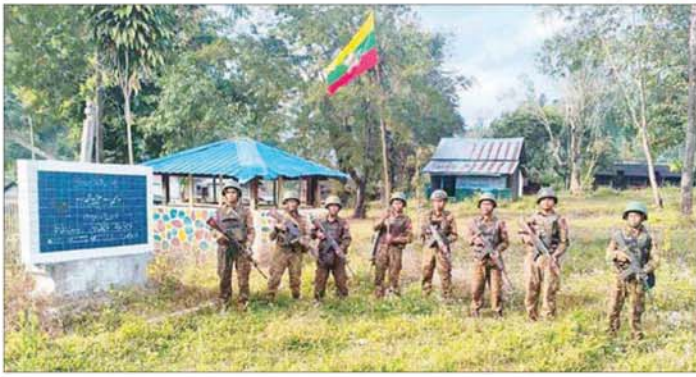
တပ်မတော်စစ်ကြောင်းများက သပိတ်ကျင်း-မိုးကုတ်လမ်းကြောင်းပေါ်ရှိ ကင်းကျေးရွာအား ပြန်လည်ထိန်းချုပ်စဉ်။

❖ စာမျက်နှာ ၂၄ မှ လမ်းပိုင်းတွင် ခိုအောင်းနေသည့် အကြမ်းဖက် သောင်းကျန်းသူများအား တိုက်ခိုက်ချေမှုန်းပြီး မိုးကုတ်-သပိတ်ကျင်း-မန္တလေး မြို့များသို့ ဆက်သွယ်ထားသည့် လမ်းကြောင်းများအား အမြန်ဆုံး ပြန်လည်ဖွင့်လှစ်နိုင်ရေးအတွက် စစ်ကြောင်းများခွဲ၍ နယ်မြေလုံခြုံရေးလုပ်ငန်းများကို ဟန့်ချက်ညီဆောင်ရွက်ခဲ့ရာ ယနေ့တွင်