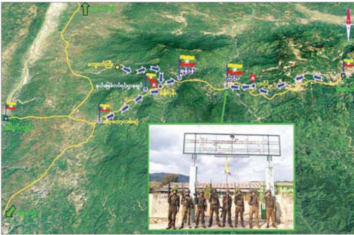
တပ်မတော်စစ်ကြောင်းများက သပိတ်ကျင်း-မိုးကုတ်လမ်းကြောင်းပေါ်ရှိ အုန်းခန့်ရွာနှင့် ကင်းရွာဝန်းကျင်ဒေသအား ပြန်လည်ထိန်းချုပ်။

ဘက် ဝိတာ ၁၀၀၀ ခန့်အကွာ အကြမ်းဖက် သောင်းကျန်းသူများ ယာယီစိုးထားသည့် ကင်းကျေးရွာ၊ ကင်းတံတားနှင့် အဆိုပါ ကျေးရွာအနီးရှိ ရန်သူစခန်းနေရာတို့အား အသီးသီးတိုက်ခိုက် ချေမှုန်းသိမ်းပိုက်နိုင်ခဲ့သည်။ အကြမ်းဖက်သောင်းကျန်းသူများအနေဖြင့် အဆိုပါကျေးရွာများအား ယာယီစိုးမိုးထားစဉ်ကျေးရွာရှိ ဘုန်းတော်ကြီးကျောင်း၊ စာသင်