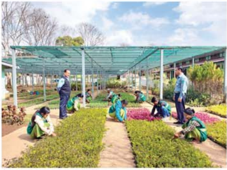
နှင့် တာဝန်ခံအင်ဂျင်နီယာတို့မှ သိရသည်။ ကြီးကြပ်ဆောင်ရွက်ခဲ့ကြကြောင်း (ကဆ)

ကလေး ဝန်နဦး ၁၅ ကလေးမြို့နယ် စည်ပင်သာယာရေးဌာနသည် ကလေးမြို့အတွင်းရှိ လမ်းလယ်ကျွန်းများ၊ ပန်းခုံများနှင့် လမ်းဘေး ဝဲ၊ ယာရှိ ပန်းစိုက်ကန်များတွင် ရာသီအလိုက်ပန်းများ လှပဝေဆာစွာ ဖူးပွင့်နေရေးအတွက် စည်ဆန်မပြတ်ဆောင်ရွက်လျက်ရှိရာ ဌာနပိုင်ပျိုးဥယျာဉ်အတွင်း ပန်းအလှပင်များ အဆက်မပြတ် ပျိုးထောင်စိုက်ပျိုးမှုအား အမှုဆောင်အရာရှိ