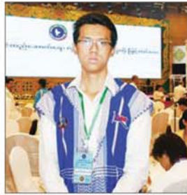
မောင်စောနေသပလေးထူး