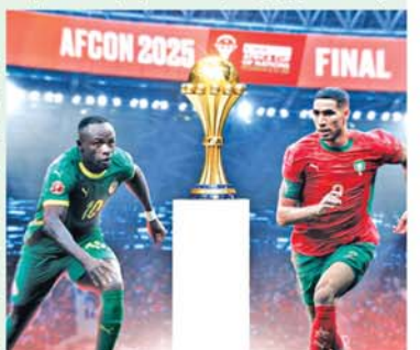
ယနေ့ထုတ် ပစ္စည်းတွေ့ဆည်းရာတွင် မြက်ပြာအထူးကုဏ္ဍအမျိုး(၄)မျက်နှာပါရှိသည်။

လန်ဒန် ဇန်နဝါရီ ၁၅ အာဖရိကနိုင်ငံများဖလား ဘောလုံးပြိုင်ပွဲဗိုလ်လုပွဲစဉ်တွင် ဆီနီဂေါအသင်းနှင့် မော်ရိုကိုအသင်းတို့ ထိပ်တိုက်တွေ့ဆုံလျက်ရှိသည်။ အာဖရိကနိုင်ငံများဖလား ဆီမီးဖိုင်နယ်အဆင့်တွင် ဆီနီဂေါအသင်းက အီဂျစ်အသင်းအား တစ်ဂိုး၊ မိုးရိုဖြင့်လည်းကောင်း၊ မော်ရိုကိုအသင်းက နိုင်ဂျီးရီးယားအသင်းအား ပင်နယ်တီအဆုံးအဖြတ် လေးဂိုး၊ နှစ်ဂိုးဖြင့်လည်းကောင်း အသီးသီးအနိုင်ရရှိကာ ဗိုလ်လုပွဲအဆင့်သို့ တက်ရောက်ခဲ့ခြင်းဖြစ်သည်။ အာဖရိကနိုင်ငံများဖလား ဗိုလ်လုပွဲစဉ်အဖြစ်လာမည့် ဇန်နဝါရီ ၁၉ရက် နံနက် ၁နာရီခွဲတွင် ဆီနီဂေါအသင်းနှင့် မော်ရိုကိုအသင်းတို့ ယှဉ်ပြိုင်ကစားသွားမည်ဖြစ်သည်။ အာဖရိကနိုင်ငံများဖလား ပြိုင်ပွဲတွင် ဗိုလ်ခွဲမည့်အသင်းသည် ဆုကြေးငွေ အဖြစ် ဒေါ်လာ ၁၀ သန်း ရရှိသွားမည်ဖြစ်ပြီး၊ မော်ရိုကိုအသင်းက ဗိုလ်ခွဲရန် ရေပန်းစားလျက်ရှိကြောင်း သိရသည်။ (NGB)