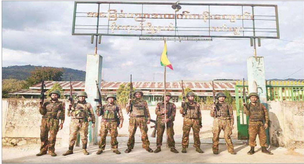
တပ်မတော်စစ်ကြောင်းများက မိုးကုတ်မြို့နယ် ကင်းကျေးရွာ အခြေခံပညာအထက်တန်းကျောင်းအား ပြန်လည်ထိန်းချုပ်စဉ်။

နေပြည်တော် ဇန်နဝါရီ ၁၅ တပ်မတော်စစ်ကြောင်းများအနေဖြင့် PDF အမည်ခံ အကြမ်းဖက်သောင်းကျန်းသူ ပူးပေါင်းအဖွဲ့များ ယာယီစိုးမိုးထားသည့် မန္တလေးတိုင်းဒေသကြီး၊ မတ္တရာမြို့နယ်၊ စဉ့်ကူးမြို့နယ်၊ သပိတ်ကျင်းမြို့နယ် များအား တစ်ခုပြီးတစ်ခု ပြန်လည်သိမ်းပိုက်ထိန်းချုပ်ခဲ့ပြီး မန္တလေး - မတ္တရာ - စဉ့်ကူး - သပိတ်ကျင်း ဆက်သွယ်ရေးလမ်းကြောင်းအား အပြည့်အဝ ပြန်လည်ထိန်းချုပ်ဖွင့်လှစ်ပေးခဲ့သည့် သတင်းအား ၂၀၂၅ ခုနှစ် ဒီဇင်ဘာ ၃၁ ရက်တွင်လည်းကောင်း၊ သပိတ်ကျင်း-မိုးကုတ် ဆက်သွယ်ရေးလမ်းကြောင်း တစ်လျှောက်ရှိ ညောင်ပင်သာကျေးရွာ၊ ပိုးခန္ဓာယ ကျေးရွာ၊ ကျောက်လှည်းဘီးကျေးရွာ၊ နယ်မြေခံ တပ်ရင်းဌာနချုပ်နှင့် စိန်ကုန်းကျေးရွာတစ်ဝိုက်တို့ အား ပြန်လည်သိမ်းပိုက်ရရှိခဲ့သည့် သတင်းအား ၂၀၂၆ ခုနှစ် ဇန်နဝါရီ ၁၄ ရက်တွင်လည်းကောင်း သတင်းထုတ်ပြန်ခဲ့ပြီးဖြစ်သည်။ ဆက်လက်၍ တပ်မတော်စစ်ကြောင်းများအနေဖြင့် အဆိုပါ သပိတ်ကျင်း-မိုးကုတ်လမ်းကြောင်းပေါ်ရှိ စိန်ကုန်းကျေးရွာနှင့် မိုးကုတ်မြို့အကြား စာမျက်နှာ ၁၄ သို့ ❖