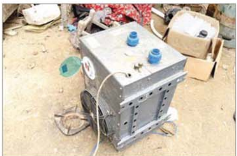
သီပေါမြို့နယ် နှစ်လခန့်ဒေသနှင့်မိုင်းရယ်မြို့အနီး ထပ်မံသိမ်းဆည်းရမိ သည့်မူးယစ်ဆေးဝါးများကိုချက်လုပ်ရာတွင်အသုံးပြုသည့်ပစ္စည်းများ။