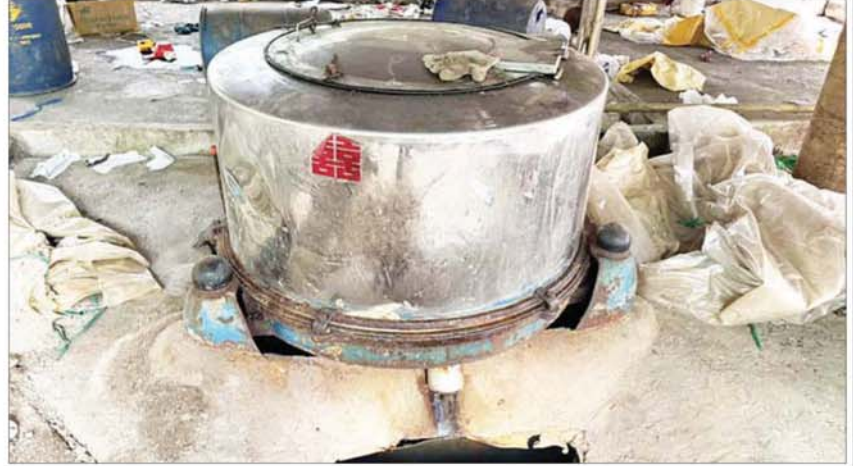
သီပေါမြို့နယ်၊ နမ့်လန်ဒေသနှင့် မိုင်းရယ်မြို့အနီး ထပ်မံသိမ်းဆည်းရမိသည့် မူးယစ်ဆေးဝါးများကိုချက်လုပ်ရာတွင် အသုံးပြုသည့် ပစ္စည်းများကို တွေ့ရစဉ်။

နေပြည်တော် ဇန်နဝါရီ ၁၅ နိုင်ငံတော်စီမံအုပ်ချုပ်ရေးကောင်စီဥက္ကဋ္ဌ နိုင်ငံတော်ဝန်ကြီးချုပ် ဗိုလ်ချုပ်မှူးကြီး မင်းအောင်လှိုင်၏ မြန်မာနိုင်ငံအနေဖြင့် မူးယစ်ဆေးဝါး နှင့် တရားမဝင် ရောင်းဝယ်မှု တားဆီး တိုက်ဖျက်ရေးလုပ်ငန်းစဉ်များကို အမျိုး ကာကွယ်နှိမ်နင်းရေး လုပ်ငန်းများကို သားရေးတာဝန်တစ်ရပ်အဖြစ် ခံယူ၍ အင်တိုက်အားတိုက် စဉ်ဆက်မပြတ် စာမျက်နှာ ၁၅ သို့ ❖