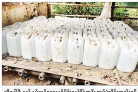
သီပေါမြို့နယ် နှစ်လခန့်ဒေသနှင့်မိုင်းရယ်မြို့အနီး ထပ်မံသိမ်းဆည်းရမိ သည့် မူးယစ်ဆေးဝါးချက်လုပ်သည့်နေရာတွင် တွေ့ရှိရသော စိစစ်ဆဲ အရည်များထည့်ထားသော အဖြူရောင်ပုံးများ။