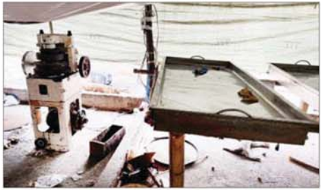
သီပေါမြို့နယ် နှစ်လခန့်ဒေသနှင့်မိုင်းရယ်မြို့အနီး ထပ်မံသိမ်းဆည်းရမိ သည့်မူးယစ်ဆေးဝါးများကိုချက်လုပ်ရာတွင်အသုံးပြုသည့်ပစ္စည်းများ။

နှင့်ပတ်သက်သည့် သတင်းများ ရရှိပါကလည်း တာဝန်ရှိသူများ ထံ အချိန်မီသတင်းပေးပို့ကြရန် လိုအပ်ကြောင်းနှင့် ဖမ်းဆီးရမိ မူးယစ်ဆေးဝါး ဖြစ်စဉ်များတွင် အဓိက ပါဝင်ပတ်သက်လျက်ရှိ သည့် မည်သည့်အဖွဲ့အစည်းကို မဆို ထိရောက်ပြင်းထန်စွာ အရေးယူ ဆောင်ရွက်သွားမည် ဖြစ်ကြောင်း သတင်းရရှိသည်။