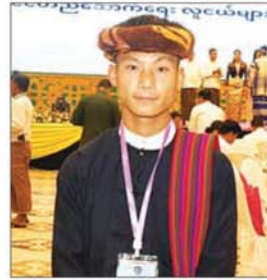
မောင်ခွန်လွန်းကျော်