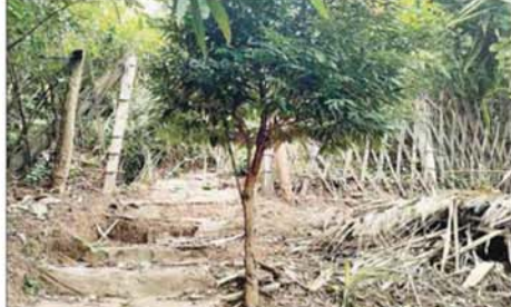
တပ်မတော်စစ်ကြောင်းများက ကင်းကျေးရွာအနီးရှိ ရန်သူအခိုင်အမာ ခံစစ်စခန်းအား သိမ်းပိုက်ရရှိစဉ်။