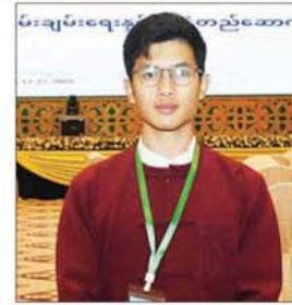
မောင်စိုင်းကောင်းအုပ်စိုး