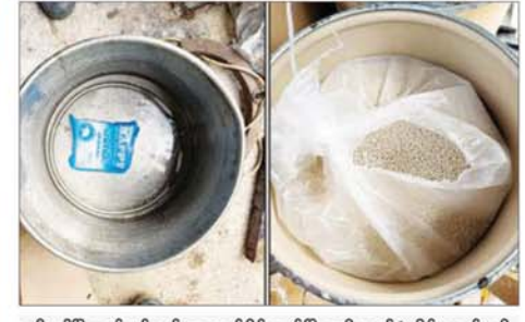
သီပေါမြို့နယ် နှစ်လခန့်ဒေသနှင့်မိုင်းရယ်မြို့အနီး ထပ်မံသိမ်းဆည်းရမိ သည့် မူးယစ်ဆေးဝါးချက်လုပ်သည့်နေရာတွင် တွေ့ရှိရသော ဟက်ပီး ဆိုင်းဆိုင်းဆားစားသုံးပါ အပြာရောင်အထုပ်နှင့် စိစစ်ဆဲ အဖြူရောင် အစေ့များ။