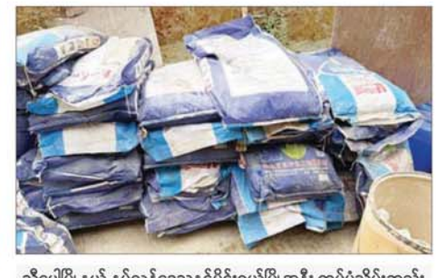
သီပေါမြို့နယ် နှစ်လခန့်ဒေသနှင့်မိုင်းရယ်မြို့အနီး ထပ်မံသိမ်းဆည်း ရမိသည့် မူးယစ်ဆေးဝါးချက်လုပ်သည့်နေရာတွင် တွေ့ရှိရသော စိစစ်ဆဲ အပြာရောင်အိတ်များ။