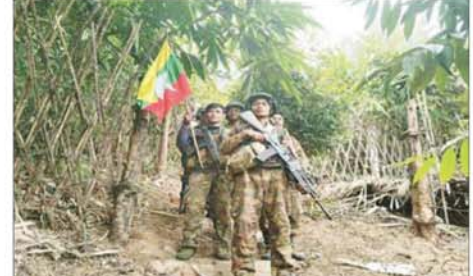
တပ်မတော်စစ်ကြောင်းများက ကင်းကျေးရွာအနီးရှိ ရန်သူအခိုင်အမာ ခံစစ်စခန်းအား သိမ်းပိုက်ရရှိစဉ်။