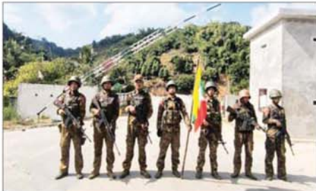
တပ်မတော်စစ်ကြောင်းများက မိုးကုတ်မြို့နယ် ကင်းကျေးရွာရှိ ကင်းတံတားအား ပြန်လည်ထိန်းချုပ်စဉ်။

ထားသည့် လမ်းကြောင်းများအား အမြန်ဆုံး ပြန်လည်ဖွင့်လှစ်နိုင်ရေးတို့ကို ဒေသခံပြည်သူများနှင့် ပူးပေါင်း၍ နယ်မြေလုံခြုံရေးနှင့် နယ်မြေစိုးမိုးရေးလုပ်ငန်းများကို အရှိန်အဟုန်ဖြင့် ဆက်လက်ဆောင်ရွက်သွားမည်ဖြစ်ကြောင်း သတင်းရရှိသည်။ သတင်းစဉ်