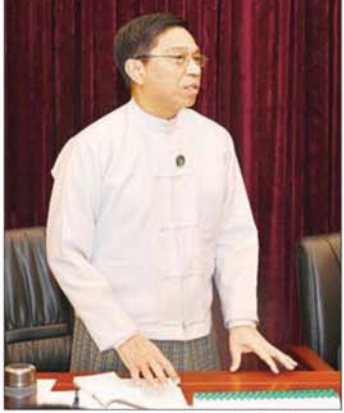
ပြည်ထောင်စုဝန်ကြီး ဒေါက်တာ စိုးဝင်း ရှင်းလင်း တင်ပြစဉ်။

နိုင်ရေး စီမံဆောင်ရွက်လျက်ရှိမှု၊ ယခုနှစ်ပညာသင်နှစ် တွင် ကျောင်းသား၊ ကျောင်းသူများ ပညာသင်ကြား လျက်ရှိမှုနှင့် ဆရာ၊ ဆရာမများအား Grade အလိုက် အဆင့်မြှင့်တင်ဆောင်ရွက်နိုင်မှု၊ ဆရာအတတ်သင် တက္ကသိုလ်များ ဖွင့်လှစ်သင်ကြားခြင်းဖြင့် နိုင်ငံတော် ၏ ပညာရေးသင်ကြားရေးကဏ္ဍကို မြှင့်တင် ဆောင်ရွက်နိုင်မှု စက်မှု၊ စိုက်ပျိုးရေးနှင့် မွေးမြူရေး ဘာသာရပ်များအတွက် သင်ရိုးများအား သက်ဆိုင်ရာ ဝန်ကြီးဌာနများအလိုက် ဝိုင်းဝန်းဆောင်ရွက်သွား မည်ဆိုပါက သင်ရိုးများပိုမိုကောင်းမွန်လာနိုင်မှု၊ မြို့ကြီး ဆရာ၊ ဆရာမများနှင့်ပတ်သက်၍ ရှေးဦးအရွယ် ကလေးပညာငယ် ပြုစုစောင့်ရှောက်ရေးသင်တန်းများ ကို ပညာရေးဝန်ကြီးဌာနအောက်ရှိ သင်တန်းကျောင်း များတွင် သင်ကြားပေးနိုင်သကဲ့သို့ လူမှုဝန်ထမ်း၊ ကယ်ဆယ်ရေးနှင့် ပြန်လည်နေရာချထားရေးဝန်ကြီး ဌာနအောက်ရှိ သင်တန်းကျောင်းများတွင်လည်း သင်ကြားပေးနိုင်မည်ဖြစ်ကြောင်း၊ ပညာရေးဒီဂရီကောလိပ်များအား တွင်လည်း သင်ကြားပေးနိုင်မည် ဖြစ်ကြောင်း၊ ပညာရေးဒီဂရီကောလိပ်များအား ဆရာအတတ်သင်တက္ကသိုလ်အဖြစ် အဆင့်မြှင့်တင် ၍ ဆောင်ရွက်ခြင်းသည် နိုင်ငံတော်၏ ပညာရည် မြှင့်တင်ရေးကဏ္ဍအတွက် များစွာအထောက်အကူ ပြုမှု အခြေခံပညာကျောင်းများအား ဘဏ္ဍာရေးနှစ် အလိုက် အဆင့်မြှင့်တင်နိုင်ရေးအတွက် ဘတ်ဂျက် များကို စည်းမျဉ်းစည်းကမ်းများနှင့်အညီ လျာထား ဆောင်ရွက်လျက်ရှိမှု၊ ကျန်းမာရေးကဏ္ဍ မြှင့်တင် နိုင်ရေးအတွက် သူနာပြုသင်တန်းကျောင်းများနှင့်