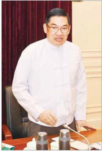
ကော်မရှင်အဖွဲ့ဝင် နိုင်ငံတော်ဝန်ကြီးချုပ် ဦးညိုစော ရှင်းလင်းတင်ပြစဉ်။

အစည်းအဝေးသို့ ကော်မရှင်အဖွဲ့ဝင် နိုင်ငံတော်ဝန်ကြီးချုပ် ဦးညိုစော၊ ဘဏ္ဍာရေးနှင့်အခွန်ဝန်ကြီးဌာန ပြည်ထောင်စုဝန်ကြီး ဒေါက်တာကဗော်၊ စက်မှုဝန်ကြီးဌာန ပြည်ထောင်စုဝန်ကြီး ဒေါက်တာချာလီသန်း၊ ပညာရေးဝန်ကြီးဌာန ပြည်ထောင်စုဝန်ကြီး ဒေါက်တာ ချောချောစိန်၊ သိပ္ပံနှင့် နည်းပညာဝန်ကြီးဌာန ပြည်ထောင်စုဝန်ကြီး ဒေါက်တာမျိုးသိန်းကျော်၊ လူမှုဝန်ထမ်း၊ ကယ်ဆယ်ရေးနှင့် ပြန်လည်နေရာချထားရေးဝန်ကြီးဌာန ပြည်ထောင်စုဝန်ကြီး ဒေါက်တာ စိုးဝင်းနှင့် ဒုတိယဝန်ကြီးများ တက်ရောက်ကြသည်။