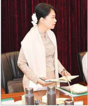
ပြည်ထောင်စုဝန်ကြီး ဒေါက်တာ ချောချောစိန် ရှင်းလင်းတင်ပြစဉ်။

ကျန်းမာရေးကဏ္ဍမြှင့်တင်ရေး ကျန်းမာရေးဝန်ထမ်းများနှင့် ပတ်သက်၍ ကုသရေးပံ့ပိုးမှုများနှင့် ဆရာဝန်များ၊ သူနာပြုများ၊ သက်ဆိုင်ရာပညာရပ်များအလိုက် ကျွမ်းကျင်သူနာပြု များရှိကြောင်း၊ ကျန်းမာရေးကဏ္ဍ မြှင့်တင်မှုကို အထောက်အကူပြုနိုင်ရန်အတွက် သူနာပြုကျောင်း များအား တိုင်းဒေသကြီးနှင့် ပြည်နယ်များအလိုက် အဆင့်မြှင့်တင်ဖွင့်လှစ်သွားရန် လိုအပ်ကြောင်း၊ ဆေးရုံများတွင် သူနာပြုများအား အဆင့်အလိုက် တာဝန်ပေးအပ်ထားပြီး ဆေးရုံများရှိ ခုတင်အရေ အတွက် အနည်း၊ အများအလိုက် တာဝန်ပေးအပ်မှု များ ကွာခြားသွားသည်ကိုသိရှိကြောင်း၊ ထို့ကြောင့်