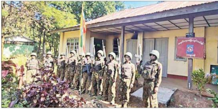
တပ်မတော်စစ်ကြောင်းများက သပိတ်ကျင်း - မိုးကုတ် ကားလမ်းပေါ်ရှိ စိန်ကုန်းကျေးရွာအနီး နယ်မြေခံ တပ်ရင်းနှင့် ဝန်းကျင်ဒေသတစ်ခုလုံးအား အလုံးစုံပြန်လည်ထိန်းချုပ်စဉ်။