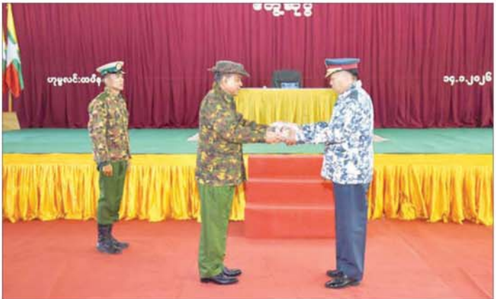
ပြည်ထောင်စုဝန်ကြီး ဗိုလ်ချုပ်ကြီးမောင်မောင်အေး ဟုမ္မလင်းတပ်နယ်ရှိ အရာရှိ၊ စစ်သည်၊ မိသားစုများအတွက် စားသောက်ဖွယ်ရာများပေးအပ်စဉ်။

ကျေပွန်စွာ လက်တွဲတာဝန်ထမ်းဆောင်ကြရန်၊ တပ်တွင်းရှိ အရာရှိ၊ အရာခံ၊ အကြပ်စစ်သည်များ ညီအစ်ကိုစိတ်ဓာတ်ရှိရန်၊ ရဲမေများ ညီအစ်မစိတ်ဓာတ်ထားရှိရန်၊ တပ်ရင်းတစ်ခုလုံး မောင်နှမစိတ်ဓာတ်ရှိကြရန်၊ တစ်ဦးချင်းစွမ်းရည်မြှင့်တင်ရေး၊ တပ်ဖွဲ့လိုက် စွမ်းရည်မြှင့်တင်ရေးတို့အတွက် အမြဲလေ့ကျင့်နေရန်၊ တပ်တိုင်း၊ ရဲဘော်တိုင်း ရှိရမည့် အရည်အချင်း ၅ ပါးကို သိရှိနားလည်ပြီး ကျင့်ကြံလိုက်နာဆောင်ရွက်ကြရန် ရှင်းလင်းပြောကြားသည်။ ထို့နောက် ပြည်ထောင်စုဝန်ကြီးက ဟုမ္မလင်းတပ်နယ်ရှိ အရာရှိ၊ စစ်သည်၊ မိသားစုများအတွက် စားသောက်ဖွယ်ရာများပေးအပ်ရာ တာဝန်ရှိသူများက လက်ခံရယူကြပြီး ပြည်ထောင်စုဝန်ကြီးနှင့် အဖွဲ့ဝင်များသည် တက်ရောက်လာကြသည့် အရာရှိ၊ စစ်သည်၊ မိသားစုများအား ရင်းရင်းနှီးနှီး လိုက်လံနှုတ်ဆက်ခဲ့ကြောင်းသတင်းရရှိသည်။ သတင်းစဉ်