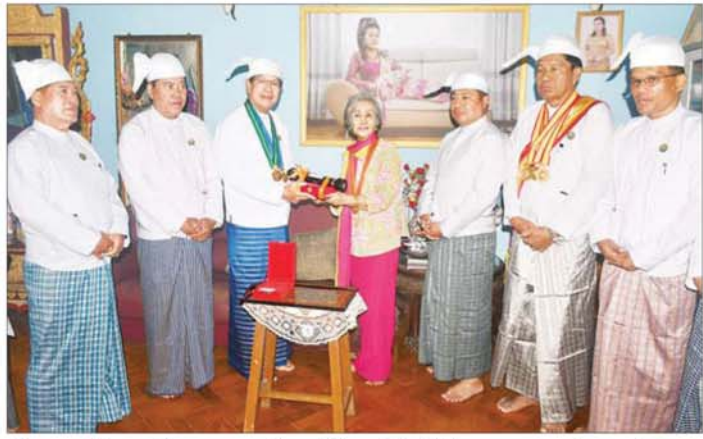
ဘွဲ့များ လက်ခံရယူမည့် ကာယကံရှင်များနှင့် မိသားစုဝင်များ၏ ချစ်အိမ်များသို့ သွားရောက် ချီးမြှင့်ပေးခြင်းဖြစ်သည်။

ရန်ကုန် ဇန်နဝါရီ ၁၄ နိုင်ငံတော်ယာယီသမ္မတနိုင်ငံတော် လုံခြုံရေးနှင့်အေးချမ်းသာယာရေး ကော်မရှင်ဥက္ကဋ္ဌ ဗိုလ်ချုပ်မှူးကြီး မင်းအောင်လှိုင်က ၂၀၂၆ ခုနှစ် (၇၈)နှစ်မြောက် လွတ်လပ်ရေးနေ့တွင် ဂုဏ်ထူးဆောင်ဘွဲ့ရရှိသည့် ပုဂ္ဂိုလ်များကို အခမ်းအနားဖြင့် ချီးမြှင့်ခဲ့ပြီး အကြောင်းအမျိုးမျိုးကြောင့် ကိုယ်တိုင်သော်လည်းကောင်း၊ ကိုယ်စားသော်လည်းကောင်း အခမ်းအနားသို့ တက်ရောက် ရယူနိုင်ခဲ့ခြင်းမရှိသောဘွဲ့ခံပုဂ္ဂိုလ်များအား ယနေ့တွင် ရန်ကုန်တိုင်းဒေသကြီး ဝန်ကြီးချုပ် ဦးစိုးသိန်း၊ ရန်ကုန်တိုင်းစစ်ဌာနချုပ်တိုင်းမှူး ဗိုလ်ချုပ်ပြည့်စုံလင်းနှင့် တိုင်းဒေသကြီးဝန်ကြီးများက ဂုဏ်ထူးဆောင်