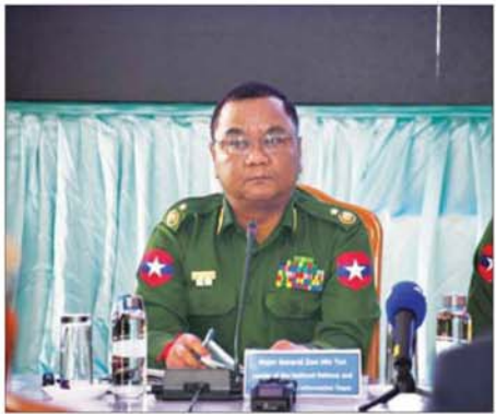
အမျိုးသားကာကွယ်ရေးနှင့် လုံခြုံရေးကောင်စီ သတင်းထုတ်ပြန်ရေးအဖွဲ့ခေါင်းဆောင်နှင့် ဒုတိယဝန်ကြီး ဗိုလ်ချုပ်စော်မင်းထွန်း

ဗိုလ်ချုပ်စော်မင်းထွန်းက မိမိအနေဖြင့် မူးယစ်ဆေးဝါးတိုက်ဖျက်ရေးနှင့်ပတ်သက်ပြီး လုပ်ဆောင်ခဲ့သည့်အကြောင်းအရာများ၊ မူးယစ်ဆေးဝါးနှင့် EAO အဖွဲ့များဆက်စပ်သည့် ကိစ္စများ၊ ဆောင်ရွက်ရမည့် ကိစ္စများကို ပြောကြားသွားမည်ဖြစ်ကြောင်း၊ မြန်မာနိုင်ငံ အစိုးရအနေဖြင့် လူသားမျိုးနွယ်စုတစ်ခုလုံးကို လူညံ့ဖျိုးစေနိုင်သည့် မူးယစ်ဆေးဝါးကို အမျိုးသားရေးအန္တရာယ်တစ်ရပ်အဖြစ် သတ်မှတ်ပြီး မူးယစ်ဆေးဝါးတိုက်ဖျက်ရေးလုပ်ငန်းများကို ဆောင်ရွက်လျက် ရှိကြောင်း၊ EAO အမည်ခံ သောင်းကျန်းသူအဖွဲ့များအနေဖြင့် နိုင်ငံအတွင်း တည်ငြိမ်မှုမရှိအောင်လုပ်ဆောင်ပြီး ထိုအခြေအနေကို အခွင့်ကောင်းယူကာ ၎င်းတို့အတွက် ဝင်ငွေရလမ်းဖြစ်သည့် မူးယစ်ဆေးဝါးထုတ်လုပ်မှုနှင့် သယ်ဆောင်ရောင်းချသည့် အလုပ်များကို