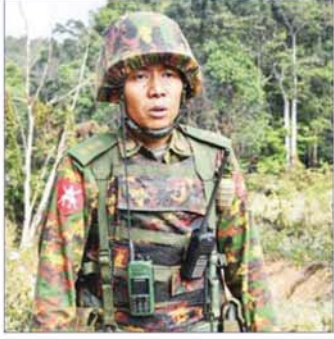
တပ်မတော်သား