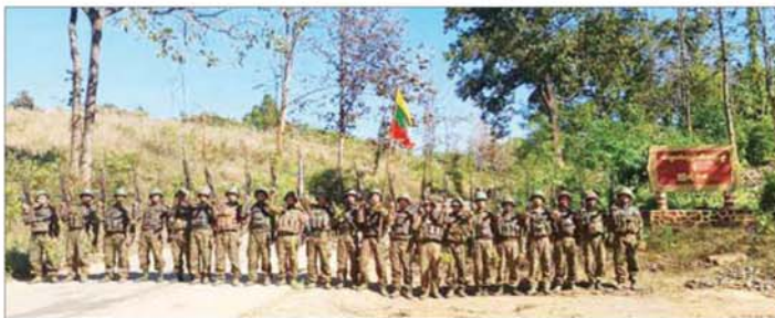
တပ်မတော်စစ်ကြောင်းများက သပိတ်ကျင်း - မိုးကုတ် ကားလမ်းပေါ်ရှိ ကျောက်လှည်းဘီးကျေးရွာအား ပြန်လည်ထိန်းချုပ်စဉ်။