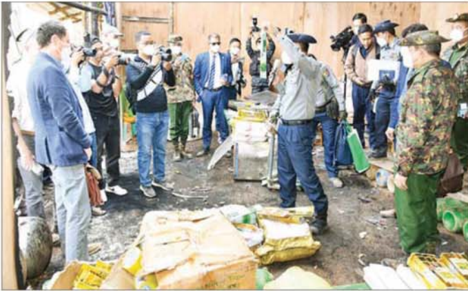
စာမျက်နှာ ၁၀ မှ

တိုက်ဖျက်ရေးလုပ်ငန်းများတွင် နိုင်ငံတကာမှ ပူးပေါင်းပါဝင် ကူညီဆောင်ရွက်ပေးကြမည်ဆိုပါက ယခုထက်ပိုမို၍ လျင်လျင်မြန်မြန်ဖြင့် အောင်မြင်နိုင်မည်ဖြစ်သည် အခြေအနေများ။