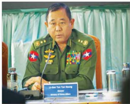
ပြည်ထောင်စုဝန်ကြီး ဒုတိယဗိုလ်ချုပ်ကြီး ထွန်းထွန်းနောင်

မူးယစ်ဆေးဝါးပြဿနာသည် မိမိတို့နိုင်ငံတစ်နိုင်ငံတည်း သက်ဆိုင်သည့်ပြဿနာမဟုတ်ကြောင်း၊ နိုင်ငံအားလုံးနှင့်သက်ဆိုင် သည့်ပြဿနာဖြစ်ကြောင်း၊ ကမ္ဘာ့လူသားမျိုးနွယ်စုအားလုံးနှင့် သက်ဆိုင်သည့် ပြဿနာဖြစ်သော်လည်း ယင်းအပေါ်တွင် တချို့အဖွဲ့ အစည်းများ၊ နိုင်ငံများအနေဖြင့် လူမျိုးစွဲ၊ ဘာသာစွဲ၊ နိုင်ငံရေးဝါဒအစွဲ များနှင့် ယင်းအစွဲများကိုအခြေခံပြီး မူးယစ်ဆေးဝါးတိုက်ဖျက်ရေး လုပ်ငန်းစဉ်များမှာ ပူးပေါင်းဆောင်ရွက်မှုအားနည်းနေခြင်းကိုလည်း စိတ်မကောင်းဖွယ်ရာတွေ့ရပါကြောင်း၊ မိမိတို့အနေဖြင့် မူးယစ်ဆေးဝါး တိုက်ဖျက်ရေးလုပ်ငန်းများနှင့်ပတ်သက်ပြီး စဉ်ဆက်မပြတ် မိမိတို့ ပေးထားသည့်ကတိများအတိုင်း ဆက်လက်ပြီးလုပ်ဆောင်သွားမည် ဟု ထပ်လောင်းကတိပြုပြောကြားလိုကြောင်း ပြောကြားသည်။