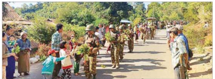
တပ်မတော်စစ်ကြောင်းများက ကျောက်လှည်းဘီးကျေးရွာသို့ ဝင်ရောက်လာစဉ် အကြမ်းဖက်သောင်းကျန်း သူများ၏ မတရားညှဉ်းပန်းနှိပ်စက်မှုဒဏ်ကို ခါးသီးစွာခံစားခဲ့ရသည့် ဒေသခံပြည်သူများက သောင်းသောင်း မြေဖြူဆိုကြစဉ်။