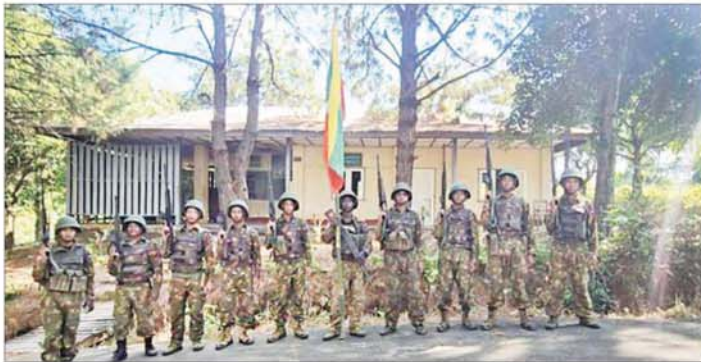
တပ်မတော်စစ်ကြောင်းများက သပိတ်ကျင်း - မိုးကုတ် ကားလမ်းပေါ်ရှိ စိန်ကုန်းကျေးရွာအနီး နယ်မြေခံတပ်ရင်းနှင့် ဝန်းကျင်ဒေသတစ်ခုလုံးအား အလုံးစုံပြန်လည်ထိန်းချုပ်စဉ်။