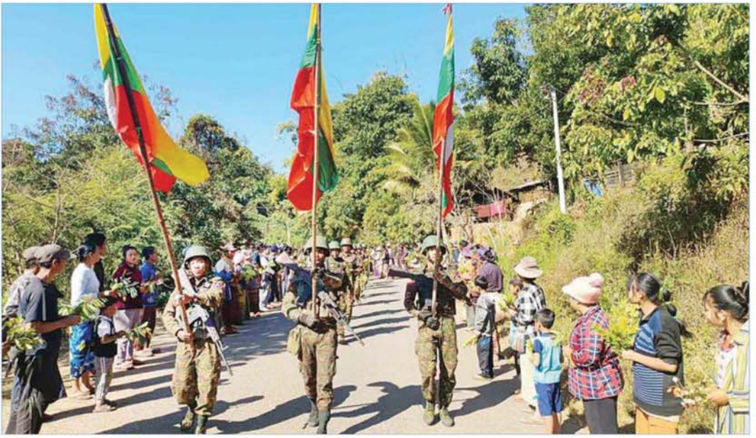
တပ်မတော်စစ်ကြောင်းများက ကျောက်လှည်းဘီးကျေးရွာသို့ ဝင်ရောက်လာစဉ် အကြမ်းဖက်သောင်းကျန်းသူများ၏ မတရားညှဉ်းပန်းနှိပ်စက်မှုဒဏ်ကို ခါးသီးစွာခံစားခဲ့ရသည့် ဒေသခံပြည်သူများက သောင်းသောင်းဖြူဖြူဆိုနေမှုကို တွေ့ရစဉ်။

နေပြည်တော် ၈နိုဗင်ဘာ ၁၄ တပ်မတော်စစ်ကြောင်းများအနေဖြင့် PDF အမည်ခံ အကြမ်းဖက်သောင်းကျန်းသူ ပူးပေါင်းအဖွဲ့များ ယာယီထိန်းချုပ်ထားသည့် မန္တလေးတိုင်းဒေသကြီး မတ္တရာမြို့နယ်၊ စဉ့်ကူးမြို့နယ်၊ သပိတ်ကျင်းမြို့နယ် များအား တစ်ခုပြီးတစ်ခု ပြန်လည်သိမ်းပိုက်ထိန်းချုပ် ခဲ့ပြီး မန္တလေး-မတ္တရာ-စဉ့်ကူး-သပိတ်ကျင်းဒေသ တစ်ဝိုက် တည်ငြိမ်အေးချမ်းမှုရှိစေရေးနှင့် ဆက်သွယ် ရေးလမ်းကြောင်းများအပေါ်တွင် ဒေသခံပြည်သူများ နှင့် ခရီးသွားပြည်သူများ စိတ်အေးချမ်းသာစွာ အသုံးပြုနိုင်ရေးအတွက် နယ်မြေလုံခြုံရေးလုပ်ငန်း များ ဆက်လက်ဆောင်ရွက်ခဲ့ရာ မန္တလေး-မတ္တရာ- စဉ့်ကူး-သပိတ်ကျင်း ဆက်သွယ်ရေးလမ်းကြောင်း ကို ၂၀၂၅ ခုနှစ် ဒီဇင်ဘာ ၃၁ ရက်တွင် အပြည့်အဝ ပြန်လည်ထိန်းချုပ် ဖွင့်လှစ်ပေးနိုင်ခဲ့ သည်။