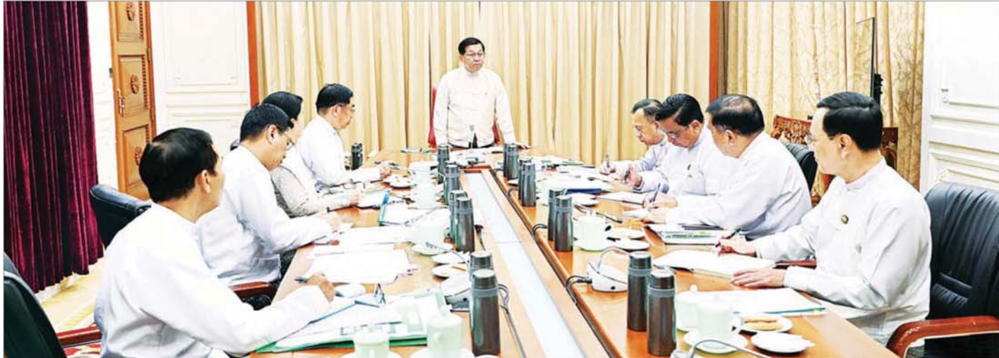
ပြည်ထောင်စုသမ္မတမြန်မာနိုင်ငံတော် ယာယီသမ္မတ နိုင်ငံတော်လုံခြုံရေးနှင့် အေးချမ်းသာယာရေးကော်မရှင်ဥက္ကဋ္ဌ ဗိုလ်ချုပ်မှူးကြီး မင်းအောင်လှိုင် ပညာရေးကဏ္ဍနှင့်ကျန်းမာရေးကဏ္ဍ မြှင့်တင်နိုင်ရေး ညှိနှိုင်းအစည်းအဝေးတွင် အမှာစကားပြောကြားစဉ်။

ပညာရေးကဏ္ဍနှင့် ကျန်းမာရေးကဏ္ဍ မြှင့်တင်နိုင်ရေးညှိနှိုင်းအစည်းအဝေးကျင်းပ တိုးတက်လာသည့် သင်ကြားမှုစနစ်နှင့် ကျောင်းသား၊ ကျောင်းသူ ဦးရေများအရ စံကိုက်ညီမှုရှိသည့် အခြေခံပညာကျောင်းများအား သတ်မှတ်ထားသည့် သတ်မှတ်ချက်များနှင့်အညီ သပ်ရပ်စွာဖြင့် စနစ်တကျဖြစ်အောင် အဆင့်မြှင့်တင်ဆောင်ရွက်ပေးသွားရမည်