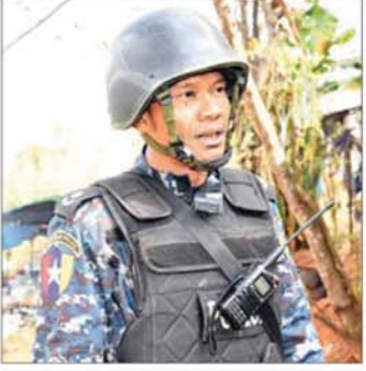
ရဲတပ်ဖွဲ့ဝင်