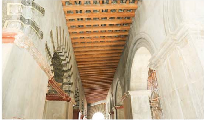
ဆောင်ရွက်သွားကြရန်တို့ကို မှာကြားပြီး လိုအပ်သည်များကို ပေါင်းစပ်ညှိနှိုင်း ဖြည့်ဆည်းဆောင်ရွက်ပေးခဲ့ကြောင်း သိရသည်။ (မန္တလေးနေ့စဉ်)

မဟာမုနိဘုရားကြီး ရွှေထီးတော်အသစ်တင်လှူပူဇော်ပွဲ မဟာမင်္ဂလာအခမ်းအနား အောင်မြင်စွာ ကျင်းပနိုင်ရေးအတွက် ပြန်လည်ပြုပြင်မွမ်းမံတည်ဆောက်ခြင်းလုပ်ငန်းများ ဆောင်ရွက်ပြီးစီးမှု အခြေအနေတို့ကို မန္တလေးတိုင်းဒေသကြီးအစိုးရအဖွဲ့ ဝန်ကြီးချုပ် ဦးမျိုးအောင်သည် တိုင်းဒေသကြီးအစိုးရအဖွဲ့ စည်ပင်သာယာရေးဝန်ကြီးနှင့် အတွင်းရေးမှူးတို့ လိုက်ပါပြီး ယနေ့မွန်းလွဲ၎င်းက သွားရောက်ကြည့်ရှုစစ်ဆေးခဲ့သည်။