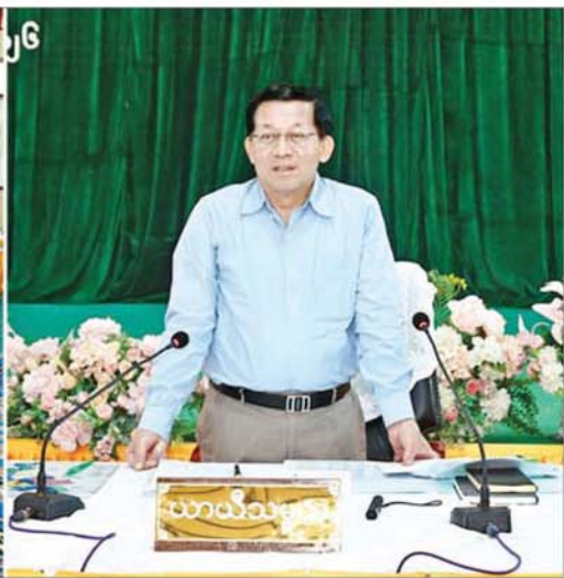
ပြည်ထောင်စုသမ္မတမြန်မာနိုင်ငံတော် ယာယီသမ္မတ နိုင်ငံတော်လုံခြုံရေးနှင့် အေးချမ်းသာယာရေးကော်မရှင်ဥက္ကဋ္ဌ ဗိုလ်ချုပ်မှူးကြီးမင်းအောင်လှိုင် ကန်ကြီးထောင့်မြို့ရှိ ဌာနဆိုင်ရာတာဝန်ရှိသူများ၊ မြို့မိမြို့ဖများနှင့် တွေ့ဆုံ၍ ဒေသဖွံ့ဖြိုးတိုးတက်ရေးဆိုင်ရာများ ဆွေးနွေးပြောကြားစဉ်။