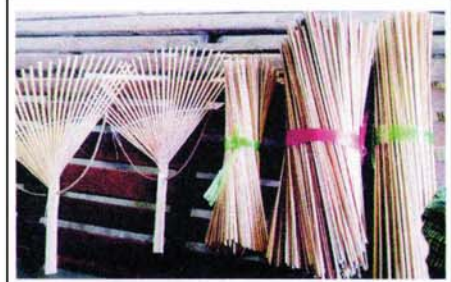
ယပ်တောင်အကြမ်းထည့် ပြီးစီးပုံ

ပြီးပါက ယပ်တောင်ပြားအောင် ယပ်တောင်တွေ အထပ်ထပ် ပိုင်းချေပြီး ဖိရပါသည်။ ယပ်တောင်တစ်ချပ်ကို ဝါးခုတ်၊ ပုံကြမ်း လောင်း၊ ခွဲစိတ်၊ ယပ်တောင်ဖြာ၊ စက္ကူကပ်၊ အနားကွပ်ပြီးသည် အထိ မိသားစုလုပ်ရတာဖြစ်တော့ ဒီကနေ့ အလုပ်သမားတစ်ယောက် ၁၅၀၀၀ ကျပ်ပေးရပါသည်။ ယပ်တောင် တစ်ချပ်ပြီးဖို့အတွက် ဝါးခုတ်ခွဲခြမ်း၊ စိတ်ချောဖြန့်၊ စက္ကူကပ်ကို အနားကွပ်အထိ အဆင့်ဆင့်လုပ်ခကို ပျမ်းမျှကွပ်ချက်ယူရပါသည်။ အပြီးဆိုင် ဆိုရင် တစ်ချောင်း ၉၀၀ ကျပ် အလတ်ဆိုင် ဆိုရင် ၇၀၀ ကျပ်၊ အသေးဆိုင်ဆိုရင် ၅၀၀ ကျပ်ပေးရကြောင်း မိသားစုမြန်မာ့ ဂုဏ်ဆောင်ဝါးယပ်တောင်လုပ်ငန်းအကြောင်း လေ့လာတင်ပြ လိုက်ရပါသည်။