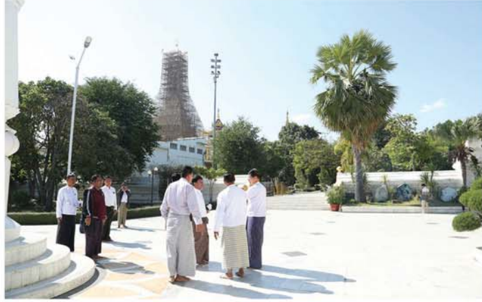
မန္တလေး ဓနံနဝါရီ ၁၀

မဟာမုနိဘုရားကြီး ရွှေထီးတော်အသစ်တင်လှူပူဇော်ပွဲ မဟာမင်္ဂလာအခမ်းအနား အောင်မြင်စွာ ကျင်းပနိုင်ရေးအတွက် ပြန်လည်ပြုပြင်မွမ်းမံတည်ဆောက်ခြင်းလုပ်ငန်းများ ဆောင်ရွက်ပြီးစီးမှု အခြေအနေတို့ကို မန္တလေးတိုင်းဒေသကြီးအစိုးရအဖွဲ့ ဝန်ကြီးချုပ် ဦးမျိုးအောင်သည် တိုင်းဒေသကြီးအစိုးရအဖွဲ့ စည်ပင်သာယာရေးဝန်ကြီးနှင့် အတွင်းရေးမှူးတို့ လိုက်ပါပြီး ယနေ့မွန်းလွဲ၎င်းက သွားရောက်ကြည့်ရှုစစ်ဆေးခဲ့သည်။