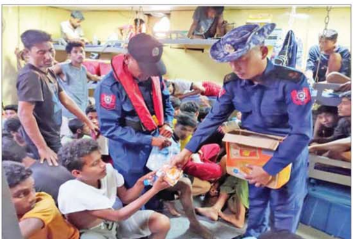
မြန်မာ့ပင်လယ်ပြင်အတွင်း ရေဝင်နစ်မြုပ်နေသည့် လှေတစ်စင်းပေါ်တွင် လိုက်ပါလာသူများအား တပ်မတော်(ရေ)နှင့် မြန်မာနိုင်ငံကမ်းခြေစောင့်တပ်ဖွဲ့မှ လုံခြုံရေးတပ်ဖွဲ့ဝင်များက စားသောက်ပွယ်ရာများ ပေးအပ်စဉ်။

အဆိုပါ ရေဝင်နစ်မြုပ်ခဲ့သည့် လှေပေါ်မှ ကူညီကယ်ဆယ်ထားရုံသူများအား သက်ဆိုင်ရာသို့