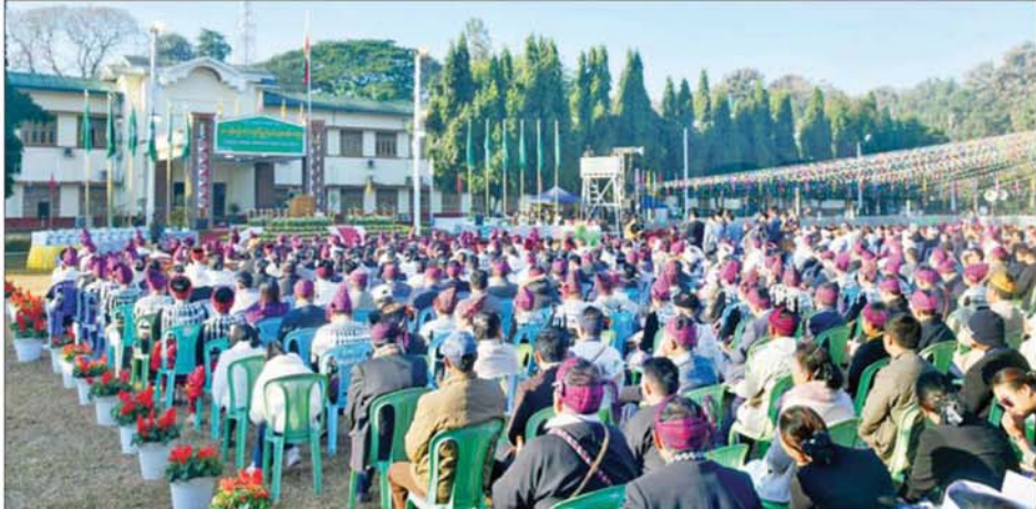
(၇၈) နှစ်မြောက် ကချင်ပြည်နယ်နေ့ အထိမ်းအမှတ်အခမ်းအနား ကျင်းပစဉ်။

အခမ်းအနားသို့ နိုင်ငံတော်သမ္မတရုံး ဝန်ကြီးဌာန(၁) ပြည်ထောင်စုဝန်ကြီး ဦးတင်အောင်စန်းနှင့်အတူ ပြည်ထောင်စုဝန်ကြီးများ မြစ်ကြည်ညိုဦးမောင်မောင်အုန်း၊ ဦးလှဝင်း၊ ဦးညာဏ်ထွန်း၊ ဦးချစ်ဆွေ၊ ဒေါက်တာချောချောစိန်၊ ဒေါက်တာမျိုးသိန်းကျော်၊ Jeng Phang နော်တောင်၊ အမျိုးသားကာကွယ်ရေးနှင့် လုံခြုံရေးကောင်စီ၏ ဗဟိုအကြံပေးအဖွဲ့ဝင်များ၊ ကချင်ပြည်နယ်ဝန်ကြီးချုပ် ဦးကော်ထိန်နီနှင့် ဇနီး၊ မြောက်ပိုင်းတိုင်းစစ်ဌာနချုပ်တိုင်းမှူးနှင့် ဇနီး၊ ပြည်နယ် တရားလွှတ်တော် တရားသူကြီးချုပ်၊ ပြည်နယ်ဝန်ကြီးများနှင့် ဇနီးများ၊ ပြည်နယ်အဆင့် ဌာနဆိုင်ရာတာဝန်ရှိသူများ၊ ငြိမ်းချမ်းရေးအကျိုးတော်ဆောင်အဖွဲ့ဝင်များ၊ ကချင်ပြည်နယ်အတွင်းရှိ ကချင်မျိုးနွယ်စု