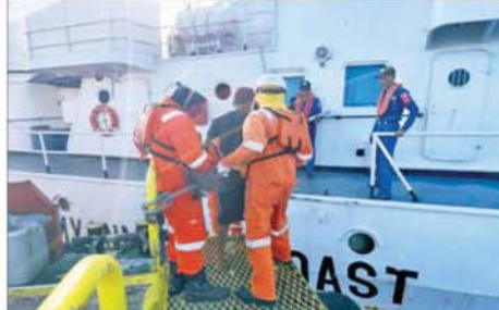
မြန်မာ့ပင်လယ်ပြင်အတွင်း ရေဝင်နစ်မြုပ်နေသည့် လှေတစ်စင်းပေါ်တွင် လိုက်ပါလာသူများအား တပ်မတော်(ရေ)နှင့် မြန်မာနိုင်ငံကမ်းခြေစောင့်တပ်ဖွဲ့မှ လုံခြုံရေးတပ်ဖွဲ့ဝင်များက ကူညီကယ်ဆယ်စဉ်။

လုပ်ထုံးလုပ်နည်းများနှင့် အညီ ပြန်လည်လွှဲပြောင်း ပို့ဆောင်နိုင်ရေး တာဝန်ရှိသူများက လိုအပ်