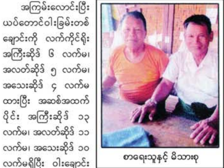
စာရေးသူနှင့် မိသားစု

ဒါကို ပုံကြမ်းလောင်းစည်းခြင်းလို့ ခေါ်ပါသည်။ တခြားသူကို ငှားမယ်ဆိုရင် အကြီးဆိုင် ၁၃ လက်မ ချောင်းရေ ၁၀၀၀ ကို ၅၀၀၀ ကျပ်၊ အလတ်ဆိုင်သေး ၁၁ လက်မ ၁၀၀၀ ကို ၂၅၀၀ ကျပ်၊ အသေးဆိုင်သေး ၁၀ လက်မ ၁၀၀၀ ကို ၁၀၀၀ ကျပ် ပေးရပါသည်။ ဝါးဖြတ်ခွဲစိတ်ခကလည်း ဝါးယပ်တောင်ဆိုသ် ၁၀၀ စည်း တစ်စည်း ကို ၁၅၀ ကျပ် ပေးရပါသည်။ မိသားစုကိုယ်တိုင်လုပ်ကြတော့ ခွဲခြမ်းစိတ်ဖြာခတွေ့ သက်သာပါသည်။