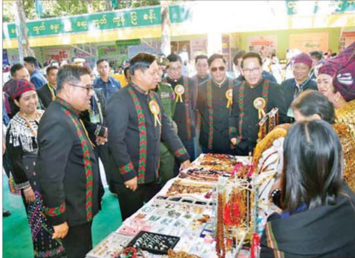
ပြည်ထောင်စုဝန်ကြီး ဦးတင်အောင်စန်းနှင့်အဖွဲ့ (၇၈)နှစ်မြောက် ကချင်ပြည်နယ်နေ့အထိမ်းအမှတ်ခင်းကျင်းပြသထားသော ပယင်းနှင့် ကျောက်မျက်အချောထည် အသုံးအဆောင်ပြခန်းများကို ကြည့်ရှုအားပေးကြစဉ်။

ပြည်နယ်နေ့ အထိမ်းအမှတ်ပြည်နယ်ဖွဲ့ပြီးရေးစီမံပေးရေးနှင့် လူမှုရေး ကဏ္ဍများတွင် စွမ်းစွမ်းတမ်း ဆောင်ရွက်ခဲ့ကြသည့် လူပုဂ္ဂိုလ်၊ အဖွဲ့အစည်းများအားဂုဏ်ထူးဆောင်လက်မှတ်၊ ဂုဏ်ထူးဆောင်ဆုပစ္စည်းများနှင့် ဂုဏ်ပြုမှတ်တမ်းလွှာ ပေးအပ်ချီးမြှင့်ခြင်း အခမ်းအနားသို့ တက်ရောက်ကြသည်။