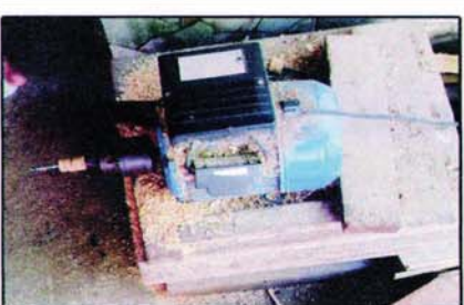
ကိုင်းသီတဲထိုးရန် အပေါက်ဖောက်စက်ပုံ

စံပြရေကြည်ညောင်ပင်ရွာဆိုတာ လွန်ခဲ့တဲ့ ပုဂံခေတ်က အနော် ရထာဘုရင် တိုင်းခန်းလှည့်ရာ ဒီရွာအနောက်ဘက် ဆင်ရပ်နားပြီး