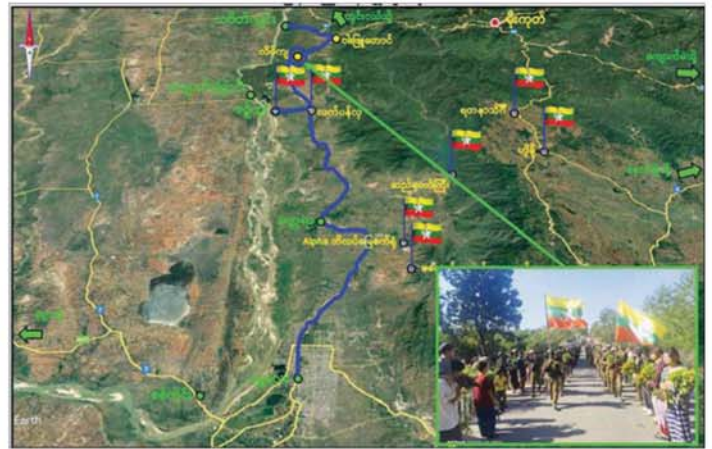
တပ်မတော်စစ်ကြောင်းများက မန္တလေး-မတ္တရာ-စဉ့်ကူး- သပိတ်ကျင်း ဆက်သွယ်ရေးလမ်းကြောင်းကို ပြန်လည်ထိန်းချုပ်ဖွင့်လှစ်။