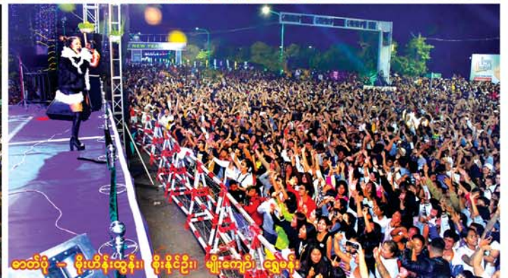
ဆောင်း - စာမျက်နှာ ၁၂