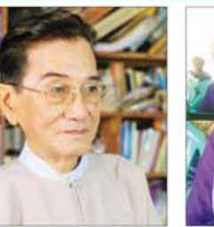
ပန်းချီစိုးမိုး