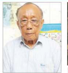
ဦးလွင်မြင့်