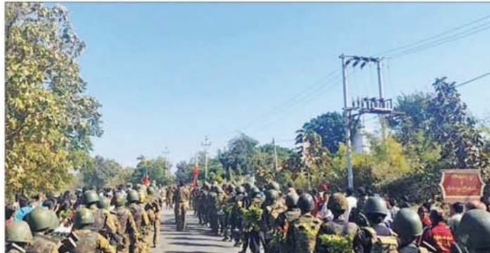
တပ်မတော်စစ်ကြောင်းများအား ဒေသခံပြည်သူများက သောင်းသောင်းဖြဖြ ကြိုဆိုနှုတ်ဆက်စဉ်။

တပ်မတော်စစ်ကြောင်းများ အနေဖြင့် သပိတ်ကျင်း-မိုးကုတ် ဒေသအနီးဝန်းကျင်ရှိ ဒေသခံပြည်သူများ၏ လူမှုစီးပွားဘဝများ လုံခြုံစေရေး ကုန်စည်ကူးသန်းရောင်းဝယ်မှုများ လွယ်ကူလျင်မြန်ချောမွေ့လာစေရေးနှင့် နိုင်ငံစီးပွားတိုးတက်ရေး အထောက်အကူပြုသည့် မြေပေါ်/မြေအောက် သယ်စာတများအား စနစ်တကျ စီမံဆောင်ရွက်နိုင်ရေးတို့အတွက် သပိတ်ကျင်း-မိုးကုတ် ဆက်သွယ်ထားသည့် လမ်းကြောင်းအား အမြန်ဆုံး ဖွင့်လှစ်နိုင်ရေး လိုအပ်သည့် နယ်မြေလုံခြုံရေးလုပ်ငန်းများကို ဆက်လက်ဆောင်ရွက် သွားမည်ဖြစ်ကြောင်း သတင်းရရှိသည်။