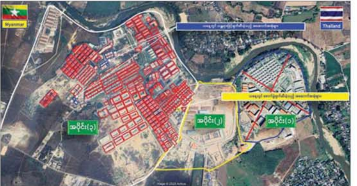
ကရင်ပြည်နယ် မြဝတီမြို့နယ်အတွင်းရှိ KK Park နယ်မြေအပိုင်း(၃) တွင် ဖောက်ခွဲပျက်ဆီးထားရှိမှုကို တွေ့ရစဉ်။

ခဲ့ကြောင်း သိရှိရသည်။ ယနေ့တွင် မြဝတီ-မဲ့ထော်သလေး(KK Park) အပိုင်း(၃)နယ်မြေအတွင်းရှိ အွန်လိုင်းလိမ်လည် လောင်းကစားမှုများ ကျူးလွန်ရာတွင် အသုံးပြုခဲ့ သည့် တရားမဝင် သုံးထပ်အဆောက်အအုံ နှစ်လုံး နှင့် နှစ်ထပ်အဆောက်အအုံ ၁၁ လုံး စုစုပေါင်း တရားမဝင် အဆောက်အအုံ ၁၃ လုံးတို့ကို ထပ်မံ ဖြိုချပျက်ဆီးခဲ့သဖြင့် KK Park နယ်မြေအတွင်းရှိ တရားမဝင်အဆောက်အအုံ စုစုပေါင်း ၆၃၇ လုံး အနက် ၅၇၀ လုံးကို စနစ်တကျ ဖြိုချပျက်ဆီးပြီးဖြစ် ကြောင်း သိရှိရသည်။ ထို့ပြင် KK Park နယ်မြေအတွင်းရှိ တရားမဝင် အဆောက်အအုံများအနက် ယာဉ်ယန္တရားများ အသုံး ပြု၍ ဖြိုချပျက်ဆီးခြင်းများ ဆောင်ရွက်ပြီးစီးခဲ့သည့်