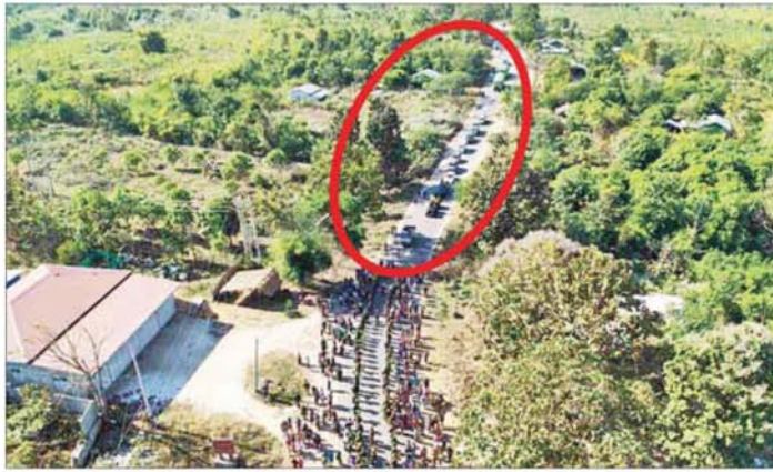
မန္တလေး-မတ္တရာ-စဉ့်ကူး-သပိတ်ကျင်း ဆက်သွယ်ရေးလမ်းကြောင်း ပြန်လည်ဖွင့်လှစ်နိုင်ပြီဖြစ်သဖြင့် ခရီးသွားပြည်သူများ၏ မော်တော်ယာဉ်များ၊ ကုန်တင်ယာဉ်များ သွားလာရန်စောင့်ဆိုင်းနေမှုကို တွေ့မြင်ရစဉ်။