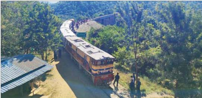
(အသွား၊ အပြန်) (ဟဲဟိုး) ဘဝသံသရာ ရှုခင်းကြည့် ရထားခရီးစဉ်ကို ယနေ့မှစတင်၍ Package ဖြင့် အထူးရထားစင်းလုံး ငှားရမ်းပြေးဆွဲပေးလျက် ရှိသည်။ ပြေးဆွဲသည့် အထူးရထားမှာ မြင်းကောင်ရေ ၂၀၀၀ အား ဒီဇယ်စက်ခေါင်းဖြင့် ခရီးသည် ၄၀ သတင်းစဉ်

နေပြည်တော် ဒီဇင်ဘာ ၃၁ ပို့ဆောင်ရေးနှင့်ဆက်သွယ်ရေးဝန်ကြီးဌာန မြန်မာ့မီးရထားအနေဖြင့် သာစည်-ရွှေညောင်-တောင်ကြီး ရထားလမ်းပိုင်းရှိ တောင်ကြီး-ပေါမူ အပိုင်းတွင် ခရီးသွားပြည်သူများအနေဖြင့် တောင်ကြီးမြို့၏ သာယာလှပသော ရှုခင်းများအား စိတ်ချမ်းမြေ့စွာ ကြည့်ရှုခံစားနိုင်ရန် တောင်ကြီး-ပေါမူ-တောင်ကြီး (အသွား၊ အပြန်) Sight Seeing ရထားခရီးစဉ်ကို အပတ်စဉ် စနေ၊ တနင်္ဂနွေ ရုံးပိတ်ရက်များ၌ ပြေးဆွဲပေးသကဲ့သို့ အဆိုပါရထားလမ်းပိုင်းရှိ ကလေး-ရွှေညောင် ရထားလမ်းပိုင်းတွင် (ဟဲဟိုး)ဘဝသံသရာ တံတားကို လေ့လာကြည့်ရှုနိုင်ရန်၊ လမ်းခရီးရှိ ရေမြေတောတောင်သဘာဝရှုခင်းများ လေ့လာကြည့်ရှုနိုင်ရန်နှင့် ဒေသန္တရဗဟုသုတရရှိစေရန် ရည်ရွယ်၍ ကလေး-အောင်ပန်း-ဟဲဟိုး-ရွှေညောင်