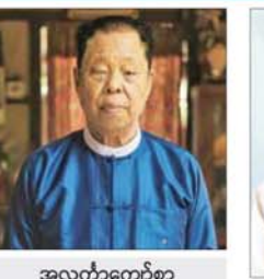
အလင်္ကာကျော်စွာ ဦးအောင်တင်ဝင်း