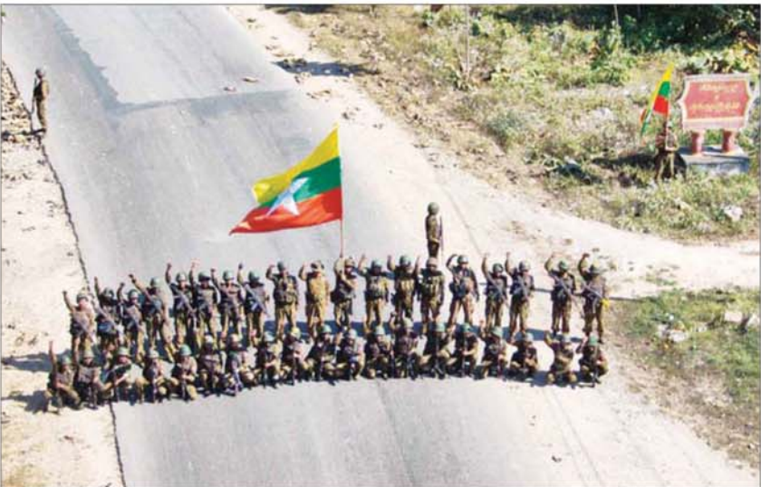
သပိတ်ကျင်းမြို့နယ်အတွင်းရှိ ကျေးရွာများသို့ တပ်မတော်စစ်ကြောင်းများ ရောက်ရှိမှုအား တွေ့မြင်ရစဉ်။