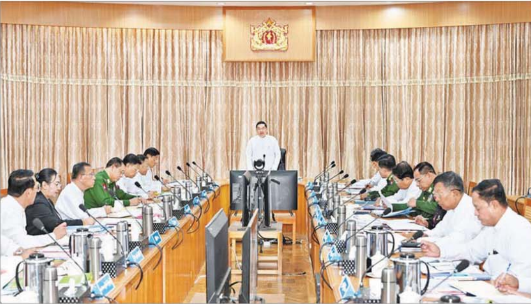
နိုင်ငံတော်ဝန်ကြီးချုပ် ဦးညိုစော ပြည်ထောင်စုသမ္မတမြန်မာနိုင်ငံတော် ပြည်ထောင်စုအစိုးရအဖွဲ့အစည်းအဝေး (၆/၂၀၂၅)တွင် အမှာစကားပြောကြားစဉ်။

နေပြည်တော် ဒီဇင်ဘာ ၃၁ ပြည်ထောင်စုသမ္မတမြန်မာနိုင်ငံတော် ပြည်ထောင်စု အစိုးရအဖွဲ့အစည်းအဝေး (၆/၂၀၂၅)ကို ယနေ့မနက် ၉ နာရီခွဲတွင် နေပြည်တော်ရှိ ပြည်ထောင်စုအစိုးရအဖွဲ့ရုံး ရုံးအမှတ်(၁၈) အစည်းအဝေးခန်းမ၌ ကျင်းပပြုလုပ် ရာ နိုင်ငံတော်ဝန်ကြီးချုပ် ဦးညိုစော တက်ရောက် အမှာစကားပြောကြားသည်။ အစည်းအဝေးသို့ ပြည်ထောင်စုဝန်ကြီးများနှင့် တာဝန်ရှိသူများ တက်ရောက်ကြပြီး တိုင်းဒေသကြီး/ ပြည်နယ်ဝန်ကြီးချုပ်များက video conference စနစ်ဖြင့် တက်ရောက်ကြသည်။ ဦးစွာ ပြည်ထောင်စုအစိုးရအဖွဲ့ အစည်းအဝေး အမှတ်စဉ်(၅/၂၀၂၅) မှတ်တမ်းကို အတည်ပြုခြင်း ဆောင်ရွက်သည်။ ထို့နောက် နိုင်ငံတော်ဝန်ကြီးချုပ်က အဖွင့် အမှာစကားပြောကြားရာတွင် နိုင်ငံတော်အစိုးရအနေ ဖြင့် ၂၀၂၅ ခုနှစ် ပါတီစုံဒီမိုကရေစီအထွေထွေ ရွေးကောက်ပွဲ အပိုင်း(၁)ကို ဒီဇင်ဘာ ၂၈ ရက်တွင် ဖြို့နယ် ၁၅ ဖြို့နယ်၌ အောင်မြင်စွာကျင်းပနိုင်ခဲ့ ကြောင်း၊ နိုင်ငံတော်၏ လုပ်ဆောင်ချက်များအပေါ် ပြည်သူလူထုမှ ပူးပေါင်းပါဝင်ဆောင်ရွက်ခဲ့ခြင်း ဖြစ်ကြောင်း။