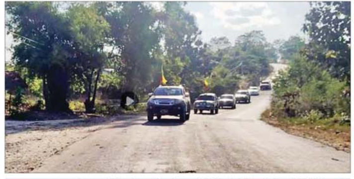
မန္တလေး-မတ္တရာ-စဉ့်ကူး-သပိတ်ကျင်း ဆက်သွယ်ရေးလမ်းကြောင်း ပြန်လည်ဖွင့်လှစ်နိုင်ပြီဖြစ်သဖြင့် ခရီးသွားပြည်သူများ၏ မော်တော်ယာဉ်များ၊ ကုန်တင်ယာဉ်များ သွားလာအသုံးပြုနေမှုကို တွေ့မြင်ရစဉ်။