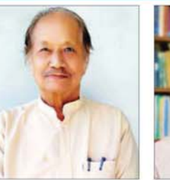
ဦးအောင်လွင်