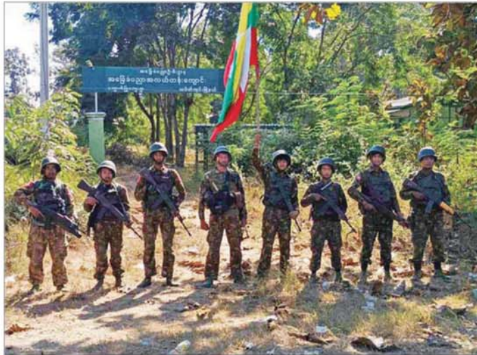
သပိတ်ကျင်းမြို့နယ်အတွင်းရှိ ကျေးရွာများသို့ တပ်မတော်စစ်ကြောင်းများရောက်ရှိမှုကို တွေ့မြင်ရစဉ်။

အကြမ်းဖက်သမားများ၏ စိတ်ကူးယဉ် ရည်မှန်းချက် အပြီးတိုင်ရိုက်ချိုး ထိုကဲ့သို့ အကြမ်းဖက်ချေမှုန်းမှု စစ်ဆင်ရေး (Counter-Terrorism Operation) ကို စနစ်တကျဖြင့် ဆောင်ရွက်ခဲ့ရာ အကြမ်းဖက် သောင်းကျန်းသူ ပူးပေါင်းအဖွဲ့များ ယာယီစိုးမိုးထားသည့် မန္တလေးတိုင်းဒေသကြီး သပိတ်ကျင်းမြို့နှင့် ၎င်းဒေသတစ်ဝိုက်အား ၂၀၂၅ ခုနှစ် ဇူလိုင် ၂၃ ရက်တွင်လည်းကောင်း၊ မတ္တရာမြို့နယ်ရှိ ဖယောင်းတောင်သတ္တုတွင်းဒေသအား ဩဂုတ် ၂၄ ရက်တွင်လည်းကောင်း၊ အယ်လ်ဖာဘီလပ်မြေစက်ရုံ တစ်ဝိုက်အား ဩဂုတ် ၂၈ ရက်တွင်လည်းကောင်း၊ ဆည်တော်ကြီးကျေးရွာနှင့် ရေ