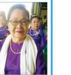
ဒေါ်နွဲ့နွဲ့စန်း

ဦးကြည်စိုးထွန်း (ဥက္ကဋ္ဌ၊ မြန်မာနိုင်ငံရုပ်ရှင်အစည်းအရုံး) လောကနိယာမအတိုင်း အဟောင်းအဟောင်းတို့ ချုပ်ငြိမ်းပြီး အသစ်အသစ်တို့ ပေါ်လာကြပါတယ်။ အခု နှစ်ဟောင်းကုန်းပြီး နှစ်သစ်ကို ကူးပြောင်းခဲ့ပြီး နှစ်ဟောင်းက အပြစ်အနာအဆာတွေကို သင်ခန်းစာယူပြီး နှစ်သစ်မှာ အကောင်းအမွန်တို့ ဖြစ်ထွန်းလာစေဖို့ ဆက်လက်ကြိုးစမ်းကြရမှာဟာ လူ့ဘဝရဲ့ တာဝန်တစ်ရပ်ပါ။