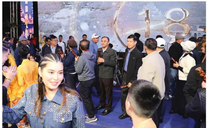
ပြောပါစေကြောင်း ဆုတောင်းကြိုဆိုခဲ့ကြကြောင်းနှင့် မိတ်ဟောင်းဆွေဟောင်း၊ မိတ်သစ်ဆွေသစ် များထံသို့ စိတ်ရင်းစေတနာဖြင့် နှစ်သစ်ကူးဆန္ဒများနှင့်အတူ မက်ဆေ့ချ်များ ပေးပို့ခြင်းတို့ဖြင့် ကြိုဆို ခဲ့ကြကြောင်း သိရသည်။

၂၀၂၅ ခုနှစ် နှစ်ဟောင်းကုန်ဆုံးခါနီးအချိန် ၂၀၂၆ ခုနှစ် နှစ်သစ်သို့ ကူးပြောင်းရောက်ရှိတော့ မည့် စက္ကန့်ပိုင်းအလိုတွင် နှစ်သစ်ကူး Countdown ကို အတူရေတွက်ခြင်း၊ ည ၁၂ နာရီတိတိ တွင် Happy New Year ဟု သံပြိုင်ရွတ်ဆိုခြင်း၊ မီးရှူးမီးပန်းများပစ်ဖောက်ခြင်းတို့နှင့်အတူ နှစ်ဟောင်း ကို နှုတ်ဆက်၍ နှစ်သစ်ကို တပျော်တပါး ကြိုဆိုခဲ့ကြောင်း၊ နိုင်ငံတော်ကြီး ပိုမိုငြိမ်းချမ်းသာယာ