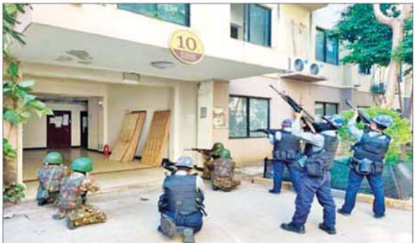
တရားမဝင်နိုင်ငံခြားသားများထားရှိသည့် ရှစ်ထပ်တိုက်အဆောက်အအုံကို ဝင်ရောက်ရှင်းလင်းစဉ်။

ဖော်ထုတ်မှုများကို နိုဝင်ဘာ ၁၈ ရက်မှ စတင်ဆောင်ရွက်ခဲ့ရာ ယနေ့တွင်လည်း ရွှေကုက္ကိုလ်နယ်မြေအတွင်းရှိ လူနေအဆောက်အအုံများ၊ ပိုဒေါင်များ၊ ဈေးဆိုင်ခန်းများနှင့် ဟိုတယ်များဖြစ်သော နှစ်ထပ်အဆောက်အအုံ တစ်လုံး၊ လေးထပ်အဆောက်အအုံ တစ်လုံး၊ ငါးထပ်အဆောက်အအုံ ၁၅ လုံး၊ ခြောက်ထပ် အဆောက်အအုံ သုံးလုံး၊ ခုနစ်ထပ်အဆောက်အအုံ လေးလုံး၊ ရှစ်ထပ်အဆောက်အအုံ နှစ်လုံး စုစုပေါင်း တရားမဝင်အဆောက်အအုံ ၂၆ လုံးတို့ကို ထပ်မံစစ်ဆေးခဲ့ရာ အွန်လိုင်းလိမ်လည်မှုနှင့် လောင်းကစားမှု လုပ်ကိုင်နေသူများကို တွေ့ရှိရခြင်းမရှိဘဲ လက်ကိုင်