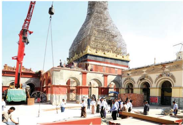
မန္တလေး နိုဝင်ဘာ ၂၉

မန္တလေးငလျင်ကြီးကြောင့် ထိခိုက်ပြိုကျပျက်စီးခဲ့သည့် စေတီ၊ ပုထိုးများ၊ သာသနိကအဆောက်အအုံများ ပြန်လည်တည်ဆောက်ပြုပြင်မွမ်းမံခြင်းလုပ်ငန်းများဆောင်ရွက်လျက်ရှိရာ မဟာမုနိဘုရားကြီး၊ သံသေကပ်ကျော်ဆုတောင်းပြည့်မြတ်စွာဘုရား၊ ရွှေကြက်ကျဆုတောင်းပြည့်မြတ်စွာဘုရား၊ ရတနာပုဏ္ဏဝရဒါဠာစာတုစေတီယ စွယ်တော်မြတ်စေတီ(မန္တလေး)နှင့် မန္တလေးတောင်တော်ဆုတောင်းပြည့်မြတ်စွာဘုရားများသို့ မန္တလေးတိုင်းဒေသကြီးအစိုးရအဖွဲ့ ဝန်ကြီးချုပ် ဦးမျိုးအောင်သည် တိုင်းဒေသကြီးအစိုးရအဖွဲ့ဝင် ဝန်ကြီးများနှင့် တာဝန်ရှိသူများလိုက်ပါပြီး ယနေ့မုန့်လွှဲပိုင်းက သွားရောက်ဖူးမြော်ကြည်ညို၍ လုပ်ငန်းဆောင်ရွက်နေမှုများကို ကြည့်ရှုစစ်ဆေးခဲ့သည်။