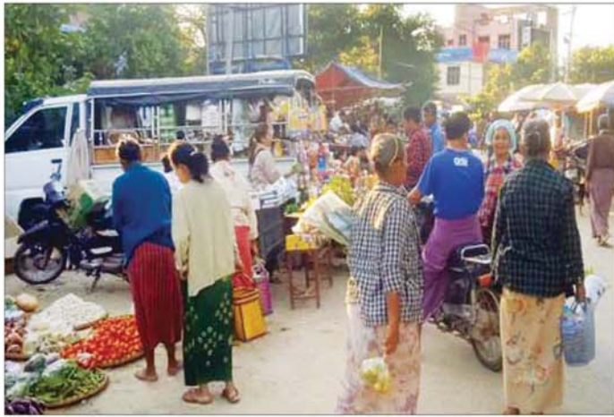
နွားထိုးကြီးမြို့၌ နိုဝင်ဘာ ၂၆ ရက်က ဈေးရောင်း ဈေးဝယ်များဖြင့် စည်ကားနေမှုကို တွေ့ရစဉ်။

မန္တလေးတိုင်းဒေသကြီး မြင်းခြံခရိုင်အတွင်းရှိ နွားထိုးကြီးမြို့နယ်လေးမှာ တစ်ချိန်က အေးချမ်းသာယာခဲ့သည့် မြို့နယ်ဖြစ်သည်။ မန္တလေး-မြင်းခြံရထားလမ်းနှင့် ကားလမ်းတို့ဆုံရာတွင် တည်ရှိနေသည့် နွားထိုးကြီးမြို့၏ စီးပွားရေးအခြေခံမှာ မိရိုးဖလာစိုက်ပျိုးရေးနှင့် မွေးမြူရေးတို့သာ ဖြစ်သည်အလျောက် စည်စည်ကားကား မြို့ကြီးများနှင့် ယှဉ်ပြိုင်လျှင် သာမန်နယ်မြို့နယ်လေး တစ်မြို့သာ။ နွားထိုးကြီးမြို့ပေါ်ရပ်ကွက် ရှစ်ခုတွင် နေထိုင်သူ စုစုပေါင်းမှာ ၁၄၀၀၀ ကျော်မျှသာဖြစ်ရာ မြို့နယ်အတွင်းရှိ ကျန်လူဦးရေ နှစ်သိန်းလျော့လျော့တို့မှာ ကျေးရွာများတွင် နေထိုင်ကြခြင်းဖြစ်သည်။