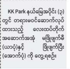
KK Park နယ်မြေအပိုင်း (၃) တွင် တရားမဝင်ဆောက်လုပ်ထားသည့် လေးထပ်တိုက် အဆောက်အအုံ မဖြိုဖျက်မီ (ယာဝဲ)နှင့် ဖြိုဖျက်ပြီး (အောက်ပုံ) ကို တွေ့ရစဉ်။