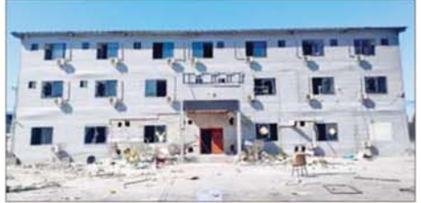
KK Park နယ်မြေအပိုင်း (၃) တွင် တရားမဝင်ဆောက်လုပ်ထားသည့် သုံးထပ်တိုက် ဆေးရုံအဆောက်အအုံ မဖြိုဖျက်မီ (ဝဲပုံ)နှင့် ဖြိုဖျက်ပြီး (အောက်ပုံ) ကို တွေ့ရစဉ်။