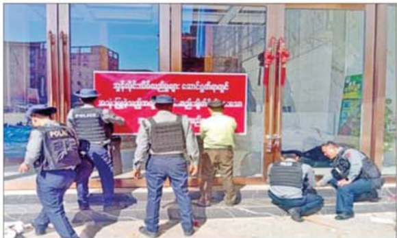
ရွှေကုက္ကိုလ်နယ်မြေအတွင်း တရားမဝင်အဆောက်အအုံများ ချိပ်ပိတ်သိမ်းမှုကို တွေ့ရစဉ်။

နေပြည်တော် နိုဝင်ဘာ ၂၉ မြန်မာနိုင်ငံ အစိုးရအနေဖြင့် အွန်လိုင်း လိမ်လည်မှုများနှင့် အွန်လိုင်း လောင်းကစားမှုများ အများဆုံး အခြေချလုပ်ကိုင်လျက်ရှိကြသည့် ရွှေကုက္ကိုလ်နယ်မြေနှင့် KK Park နယ်မြေများ၌ လုံခြုံရေး တပ်ဖွဲ့ဝင်များ၊ အုပ်ချုပ်ရေးအဖွဲ့အစည်းများနှင့် ဒေသတွင်း တာဝန်ရှိသူများအပါအဝင် အဖွဲ့စုံပါဝင်သည့် ပူးပေါင်းစစ်ဆေးရေး အဖွဲ့များဖြင့် တရားမဝင်အဆောက်အအုံများ အတွင်း ဝင်ရောက်ရှင်းလင်းခြင်း၊ အွန်လိုင်းလိမ်လည် လောင်းကစားမှု လုပ်ငန်းစဉ်များတွင် အသုံးပြုခဲ့သည့် သိမ်းဆည်းရမိပစ္စည်းများနှင့် တရားမဝင်အဆောက်အအုံများအား စနစ်တကျဖြိုချဖျက်ဆီးခြင်းများ ဆက်လက်ဆောင်ရွက်လျက်ရှိပါသည်။ ထိုသို့ အွန်လိုင်းလိမ်လည်မှုများနှင့် အွန်လိုင်းလောင်းကစားမှု တိုက်ဖျက်ရေး လုပ်ငန်းများ ဆောင်ရွက်ရာတွင် မြဝတီ-မဲ့ထောင့်သလေး (KK Park) နယ်မြေအတွင်းရှိ အွန်လိုင်းလိမ်လည်လောင်းကစားမှုများ ကျူးလွန်ရာတွင် အသုံးပြုခဲ့သည့် အဆောက်အအုံများကို အပိုင်း(၃)ပိုင်းခွဲ၍ စနစ်တကျ ဖြိုချဖျက်ဆီးခြင်းများ ဆောင်ရွက်လျက်ရှိရာ ယနေ့တွင် အပိုင်း (၃) နယ်မြေအတွင်းရှိ တရားမဝင် အဆောက်အအုံ ခုနစ်လုံးကို ထပ်မံဖြိုချဖျက်ဆီးခဲ့သဖြင့် အပိုင်း(၃)နယ်မြေအတွင်းရှိ အဆောက်အအုံ ၄၅ လုံးအနက် ယနေ့အထိ ၁၂ လုံး ဖြိုချဖျက်ဆီးခဲ့ကြောင်းနှင့် KK Park နယ်မြေအတွင်းရှိ တရားမဝင်အဆောက်အအုံ စုစုပေါင်း ၆၃၅ လုံးအနက် ၂၇၀ ကို ဖြိုချဖျက်ဆီးပြီးဖြစ်ကြောင်း သိရပါသည်။ အလားတူ ရွှေကုက္ကိုလ်နယ်မြေအတွင်း၌လည်း ရှင်းလင်း