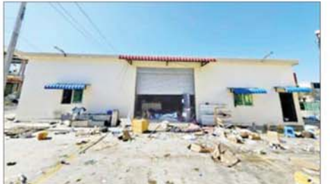
KK Park နယ်မြေအပိုင်း (၃) တွင် တရားမဝင်ဆောက်လုပ်ထားသည့် တစ်ထပ်တိုက်အဆောက်အအုံ မဖြိုဖျက်မီ (ဝဲပုံ)နှင့် ဖြိုဖျက်ပြီး (ဘာဝဲ)ကို တွေ့ရစဉ်။

ဆောင်ရွက်ပေးလျက်ရှိပါသည်။ ၂၀၂၅ ခုနှစ် ဇန်နဝါရီ ၃၀ ရက်မှ နိုဝင်ဘာ ၂၉ ရက်အထိ မြန်မာနိုင်ငံအတွင်းသို့ တရားမဝင် ဝင်ရောက်လာသည့် ပြည်ပနိုင်ငံသား စုစုပေါင်း ၁၂၅၅၅ ဦး ထိန်းသိမ်းနိုင်ခဲ့ကြောင်းနှင့် ယင်းနိုင်ငံသားအားလုံးကို စစ်ဆေးပြီးဆုံးခဲ့ပြီး ၎င်းတို့အနက်မှ ၁၀၀၂၉ ဦးကို ထိုင်းနိုင်ငံမှတစ်ဆင့် သက်ဆိုင်ရာ နိုင်ငံများသို့ ဥပဒေလုပ်ထုံးလုပ်နည်းများနှင့်အညီ စနစ်တကျ ပြည်ပနိုင်ငံသို့ပြောင်းပေးခဲ့ပြီး ကျန်ရှိသည့် ပြည်ပနိုင်ငံသား ၂၈၆ ဦးကို သက်ဆိုင်ရာနိုင်ငံများသို့ လွှဲပြောင်းပေးရန် အဆင်ပြေစေရန် ဖြစ်ကြောင်းနှင့် ၎င်းတို့ကို ကောင်းမွန်စွာ ထိန်းသိမ်းစောင့်ရှောက်ထားရှိကြောင်း သိရသည်။ နိုင်ငံတော် အစိုးရအနေဖြင့် အွန်လိုင်းလိမ်လည် လောင်းကစားမှုကျူးလွန်မှုများကို အမျိုးသားရေးတာဝန်တစ်ရပ်အဖြစ် ခံယူကာ မြန်မာနိုင်ငံအတွင်း လုံးဝအခြေမပြုနိုင်ရေး ပြည်တွင်းအင်အားစုများအပြင် အိမ်နီးချင်းနိုင်ငံအစိုးရများနှင့်လည်း ပေါင်းစပ်ညှိနှိုင်း၍ ဆက်လက် ဆောင်ရွက်သွားမည် ဖြစ်ကြောင်း သိရသည်။ သတင်းစဉ်