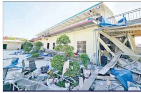
KK Park နယ်မြေအပိုင်း(၃) တွင် တရားမဝင်အဆောက်အအုံများလုပ်ထားသည့် လူနေအဆောက်အအုံနှစ်ထပ်တိုက်ကို မဖြိုဖျက်မီနှင့် ဖြိုဖျက်ပြီး တွေ့ရစဉ်။

ဖြစ်သော တစ်ထပ်အဆောက်အအုံ ၁၄ လုံး၊ နှစ်ထပ်အဆောက်အအုံ ၄၂ လုံး၊ သုံးထပ်အဆောက်အအုံ ၆၃ လုံး၊ ငါးထပ်အဆောက်အအုံခုစီလုံး၊ ခုနစ်ထပ်အဆောက်အအုံတစ်လုံး စုစုပေါင်း တရားမဝင်အဆောက်အအုံ ၂၃၁ လုံးတို့ကို ထပ်မံစစ်ဆေးခဲ့ရာ အွန်လိုင်းလိမ်လည်မှုနှင့် လောင်းကစားမှု လုပ်ငန်းများလုပ်ကိုင်နေသူများကို တွေ့ရှိရခြင်းမရှိဘဲ လက်ကိုင်ဖုန်းနှင့် အသုံးအဆောင်ပစ္စည်းများကို တစ်ပါတည်း ပြုတ်သိမ်းယူဆောင်သွားခဲ့ကြောင်း သိရသည်။ ထို့ပြင် ရွှေကုက္ကိုလ်နယ်မြေအတွင်း၌ အွန်လိုင်းလိမ်လည်မှုများ ဆောင်ရွက်ရာတွင် အသုံးပြုခဲ့သည့် အဆောက်အအုံများအား နိုဝင်ဘာ ၁၈ ရက်မှ စတင်စစ်ဆေးခဲ့ရာ ယနေ့အထိ တရားမဝင် အဆောက်အအုံ ၁၀၉ လုံးကိုတွေ့ရှိရပြီး အဆိုပါအဆောက်အအုံများအား ပြန်လည်အသုံးပြုမှု မရှိစေရေးအတွက် သိမ်းဆည်းချိတ်ခတ်ခြင်းများကို ဆက်လက် ဆောင်ရွက်ခဲ့ရာ ယနေ့တွင်လည်း အဆောက်အအုံ ၄၃ လုံးကို ချိတ်ခတ်နိုင်ခဲ့ရာ စုစုပေါင်း ၆၄ လုံးအထိ ချိတ်ခတ်သိမ်းဆည်းပြီးဖြစ်ကြောင်း သိရသည်။ ရွှေကုက္ကိုလ် နယ်မြေအတွင်း စုစုပေါင်း ဖော်ထုတ်ရှင်းလင်းမှုများအရ ယနေ့အထိ မြန်မာနိုင်ငံအတွင်းသို့ တရားမဝင် ဝင်ရောက်နေထိုင်သည့် ပြည်ပနိုင်ငံသား စုစုပေါင်း ၂၀၄၂ ဦးနှင့် အွန်လိုင်းလိမ်လည် လောင်းကစားမှု