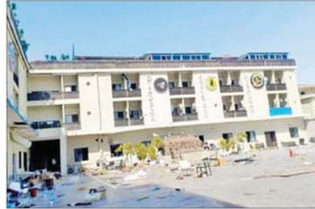
KK Park နယ်မြေအပိုင်း(၃) တွင် တရားမဝင်အဆောက်အအုံများလုပ်ထားသည့် လူနေအဆောက်အအုံသုံးထပ်တိုက်ကို မဖြိုဖျက်မီနှင့် ဖြိုဖျက်ပြီး တွေ့ရစဉ်။