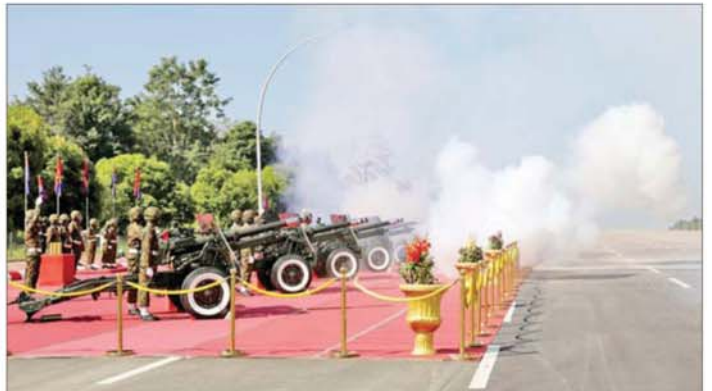
ဂုဏ်ပြုအမြောက်တပ်ဖွဲ့က အမြောက် ၂၁ ချက်ကို စစ်ရေးပြအခမ်းအနားဖြင့် ဂုဏ်ပြုပစ်ဖောက်ကြိုဆိုစဉ်။