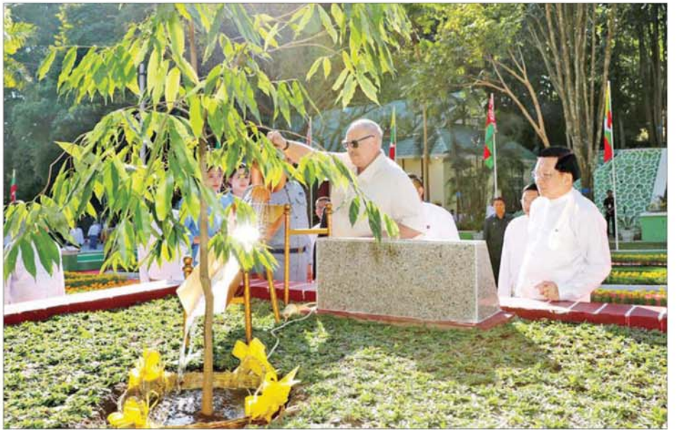
ကမ္ဘည်းကြေးပြားအား အမွှေးနံ့သာဖြင့် ပက်ဖျန်းပေးသည်။ ယင်းနောက် ဘယ်လာရုစ်သမ္မတနိုင်ငံသမ္မတ၊ ပြည်ထောင်စု သမ္မတ မြန်မာနိုင်ငံတော် ယာယီသမ္မတနှင့် အဖွဲ့ဝင်များသည် ဘယ်လာရုစ်-မြန်မာအထိမ်းအမှတ် ကံကော်ပင်ရှည် စုပေါင်းမှတ်တမ်း

ဦးစွာ ဘယ်လာရုစ်သမ္မတနိုင်ငံသမ္မတနှင့် ပြည်ထောင်စုသမ္မတ မြန်မာနိုင်ငံတော် ယာယီသမ္မတ နိုင်ငံတော်လုံခြုံရေးနှင့် အေးချမ်း သာယာရေးကော်မရှင်ဥက္ကဋ္ဌတို့သည် နေပြည်တော် အမျိုးသားပရဆေး ဥယျာဉ်ရှိ သတ်မှတ်နေရာ၌ နှစ်နိုင်ငံအထိမ်းအမှတ် ကံကော်ပင်အား အတူတကွစိုက်ပျိုးပေးကြကာ ဘယ်လာရုစ်သမ္မတနိုင်ငံသမ္မတက