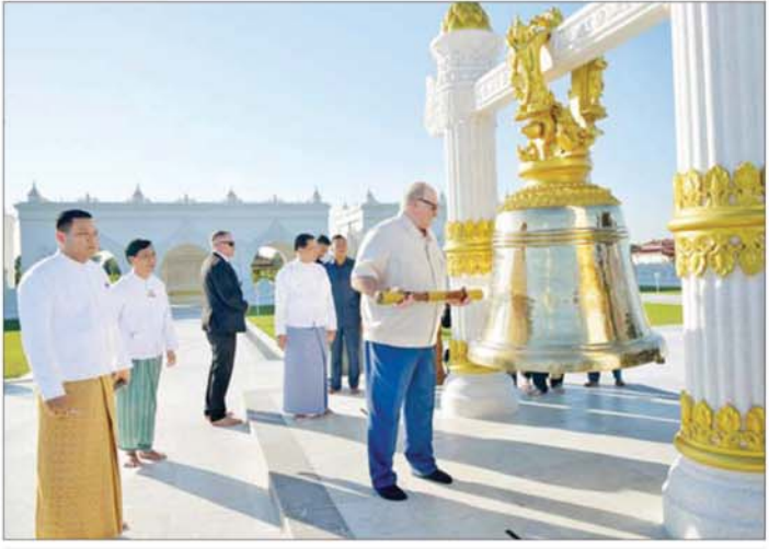
ဘယ်လာရုစ်သမ္မတနိုင်ငံသမ္မတ H.E.Mr.Aleksandr Lukashenko သဒ္ဓါမိပတိ ခေါင်းလောင်းတော် ထိုး၍ ကုသိုလ်ပြုစဉ်။

အောင်လံမြို့နယ်၌ မီးဘေးအန္တရာယ် ကြိုတင်ကာကွယ်ရေး အသိပညာပေး