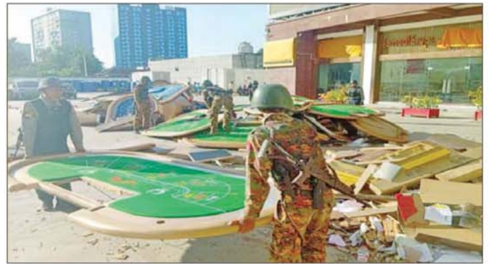
မီးရှို့ဖျက်ဆီးမည့် တရားမဝင် လောင်းကစားပစ္စည်းများကို တွေ့ရစဉ်။