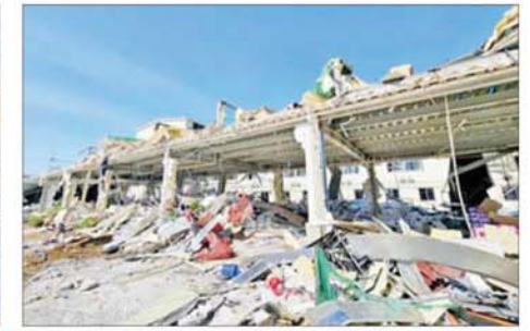
KK Park နယ်မြေအပိုင်း(၃) တွင် တရားမဝင်အဆောက်အအုံများလုပ်ထားသည့် လူနေအဆောက်အအုံနှစ်ထပ်တိုက်ကို မဖြိုဖျက်မီနှင့် ဖြိုဖျက်ပြီး တွေ့ရစဉ်။