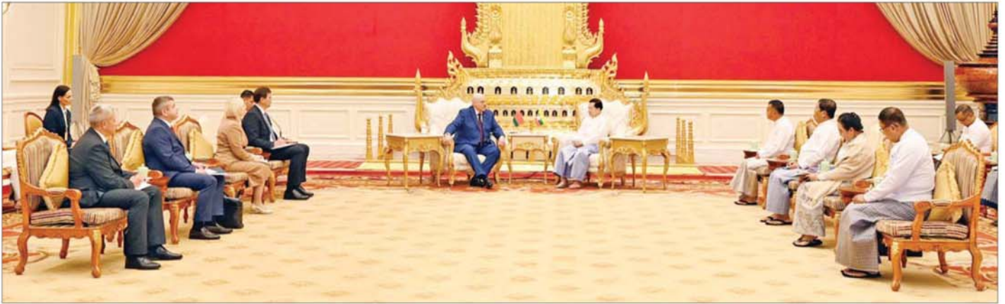
ပြည်ထောင်စုသမ္မတမြန်မာနိုင်ငံတော် ယာယီသမ္မတ နိုင်ငံတော်လုံခြုံရေးနှင့် အေးချမ်းသာယာရေးကော်မရှင်ဥက္ကဋ္ဌ ဗိုလ်ချုပ်မှူးကြီးမင်းအောင်လှိုင်နှင့် ဘယ်လာရစ်သမ္မတနိုင်ငံသမ္မတ H.E. Mr. Aleksandr Lukashenko တို့ တွေ့ဆုံဆွေးနွေးစဉ်။

❖ စာမျက်နှာ ၇ မှ မြန်မာနိုင်ငံသို့ ဘယ်လာရစ်နိုင်ငံမှ နိုင်ငံတော်အကြီးအကဲအနေဖြင့် လာရောက်သည့် သမိုင်းဝင်ခရီးစဉ် တစ်ခုဖြစ်ပါကြောင်း၊ ယခုကဲ့သို့ နှစ်နိုင်ငံအကြား ချစ်ကြည်ရေး ခရီးစဉ်များ အပြန်အလှန် သွားရောက်ခြင်းအားဖြင့် သံတမန် ဆက်ဆံမှုနှင့် ကဏ္ဍပေါင်းစုံ၌ ပူးပေါင်းဆောင်ရွက်မှုများကို ပိုမို တိုးမြှင့်ဆောင်ရွက်နိုင်မည် ဖြစ်ကြောင်း၊ ဘယ်လာရစ်နိုင်ငံအနေဖြင့် နိုင်ငံတကာမျက်နှာစာတွင် မြန်မာနိုင်ငံဘက်မှ ရပ်တည် ထောက်ခံပေးလျက် ရှိသည့် အတွက် ကျေးဇူးတင်ရှိကြောင်း၊ ဘယ်လာရစ်နိုင်ငံ အနေဖြင့် BRICS အဖွဲ့ဝင်နိုင်ငံဖြစ်ခဲ့သည့် အတွက်လည်း ဝမ်းမြောက်ပါကြောင်း၊ မြန်မာနိုင်ငံအနေဖြင့် ရုန့်ဟိုင်း ပူးပေါင်းဆောင်ရွက်မှုအဖွဲ့တွင် အဖွဲ့ဝင်အဖြစ် ဝင်ရောက်နိုင်ရေး ကြိုးပမ်းဆောင်ရွက်လျက်ရှိပြီး BRICS အဖွဲ့ဝင်နိုင်ငံဖြစ်စေရေးနှင့် ဥရောပ-အာရှစီးပွားရေးသမဂ္ဂ (EAEU) အဖွဲ့ဝင်နိုင်ငံဖြစ်စေရေး အတွက်လည်း ကြိုးပမ်းဆောင်ရွက်လျက်ရှိသဖြင့် ဘယ်လာရစ်နိုင်ငံအနေဖြင့် ဆက်လက် ထောက်ခံပေးစေ လိုကြောင်း၊ အဆွေတော် ဘယ်လာရစ်သမ္မတနိုင်ငံသမ္မတ၏ ယခုခရီးစဉ်တွင် နှစ်နိုင်ငံအကြား ကဏ္ဍပေါင်းစုံတွင် ပူးပေါင်းဆောင်ရွက်မှုများ ပိုမိုတိုးမြှင့်နိုင်ရေးအတွက်