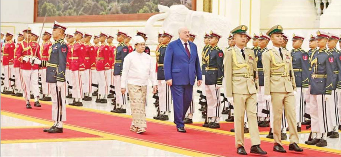
ပြည်ထောင်စုသမ္မတ မြန်မာ နိုင်ငံတော် ယာယီသမ္မတ နိုင်ငံတော်လုံခြုံရေးနှင့် အေးချမ်း သာယာရေးကော်မရှင် ဥက္ကဋ္ဌ ဗိုလ်ချုပ်မှူးကြီး မင်းအောင်လှိုင် နှင့် ဘယ်လာရုစ်သမ္မတနိုင်ငံ သမ္မတ H.E. Mr. Aleksandr Lukashenko တို့ မှတ်တမ်းတင် ဓာတ်ပုံရိုက်စဉ်။