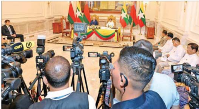
ပြည်ထောင်စုသမ္မတမြန်မာနိုင်ငံတော် ယာယီသမ္မတ နိုင်ငံတော်လုံခြုံရေးနှင့်အေးချမ်းသာယာ ရေးကော်မရှင်ဥက္ကဋ္ဌ ဗိုလ်ချုပ်မှူးကြီး မင်းအောင်လှိုင်နှင့် ဘယ်လာရစ်သမ္မတနိုင်ငံ သမ္မတ H.E. Mr. Aleksandr Lukashenko တို့ နှစ်နိုင်ငံပူးတွဲကြေညာချက်ကို ရှင်းလင်းပြောကြားစဉ်။

နေပြည်တော် နိုဝင်ဘာ ၂၈ ပြည်ထောင်စုသမ္မတမြန်မာနိုင်ငံတော် ယာယီ သမ္မတ နိုင်ငံတော်လုံခြုံရေးနှင့်အေးချမ်းသာယာရေး ကော်မရှင်ဥက္ကဋ္ဌ ဗိုလ်ချုပ်မှူးကြီးမင်းအောင်လှိုင် နှင့် ဘယ်လာရစ်သမ္မတနိုင်ငံသမ္မတ H.E. Mr. Aleksandr Lukashenko တို့သည် ယနေ့နံနက်ပိုင်း တွင် နိုင်ငံတော်သမ္မတအိမ်တော်၌ကျင်းပသည့် နှစ်နိုင်ငံတွေ့ဆုံဆွေးနွေးပွဲနှင့်နားလည်မှုစာချွန်လွှာ လက်မှတ်ရေးထိုးပွဲအပြီးတွင် နှစ်နိုင်ငံပူးတွဲ ကြေညာချက်ကို ရှင်းလင်းပြောကြားခဲ့ကြသည်။