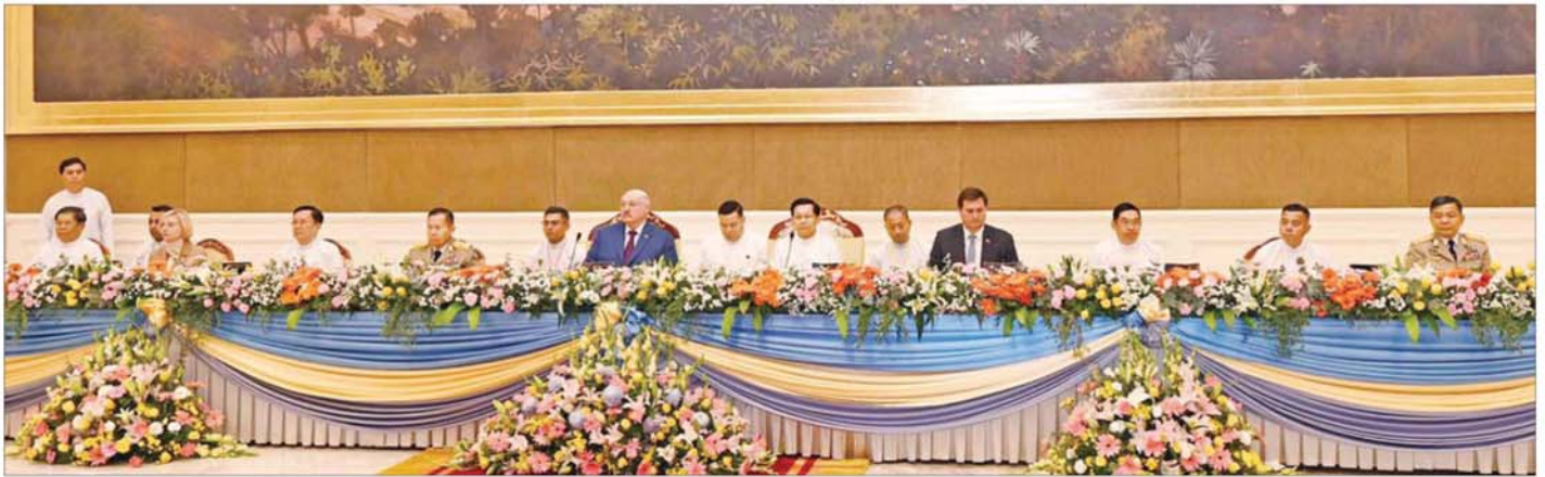
နိုင်ငံတော်ယာယီသမ္မတ နိုင်ငံတော်လုံခြုံရေးနှင့် အေးချမ်းသာယာရေးကော်မရှင်ဥက္ကဋ္ဌဗိုလ်ချုပ်မှူးကြီးမင်းအောင်လှိုင်က ဘယ်လာရစ်သမ္မတနိုင်ငံသမ္မတ H.E. Mr. Aleksandr Lukashenko ဦးဆောင်သည့် ကိုယ်စားလှယ်အဖွဲ့ဝင်များအား ဂုဏ်ပြုနေ့လယ်စာဖြင့် တည်ခင်းစဉ်စဉ်။

★ စာမျက်နှာ ၃ မှ ယင်းနောက် မြန်မာနိုင်ငံတွင် မန္တလေးငလျင်ကြီး လှုပ်ခတ်ခဲ့ စဉ်က ဘယ်လာရစ်သမ္မတနိုင်ငံမှ ငလျင်ဘေးဒဏ်သင့် ဒေသများ တွင်ရှာဖွေကယ်ဆယ်ရေးလုပ်ငန်း များ ဆောင်ရွက်ပေးခဲ့မှုနှင့် လူသားချင်း စာနာထောက်ထားမှု ဆိုင်ရာ အကူအညီများ ဆောင်ရွက် ပေးခဲ့မှုအပေါ် မြန်မာနိုင်ငံအနေ ဖြင့် ကျေးဇူးတင်ရှိမှု၊ နှစ်နိုင်ငံ အကြား နိုင်ငံရေး၊ ကုန်သွယ်ရေး၊ စီးပွားရေး၊ စက်မှု၊ စိုက်ပျိုးရေး နှင့် အစားအစာ၊ ကျန်းမာရေး၊ ဆေးဝါး၊ ပညာရေးနှင့် ကဏ္ဍ ပေါင်းစုံ ပူးပေါင်းဆောင်ရွက်မှုများ အရှိန်အဟုန်ဖြင့် တိုးတက်လျက် ရှိပြီး ချစ်ကြည်ရင်းနှီးမှုနှင့် အပြန် အလှန် နားလည်ယုံကြည်မှုများ တိုးမြှင့်လာသည့် အခြေအနေများ၊ သံတမန်ဆက်ဆံမှုအား မြှင့်တင် နိုင်ရေးအတွက် မင့်စိမြို့ရှိ မြန်မာ ကောင်စစ်ဝန်ချုပ်ရုံးအား သံရုံး အဆင့်မြှင့်တင်နိုင်ရေး ဆောင်ရွက် လျက်ရှိသည့် အခြေအနေများ၊ နှစ်နိုင်ငံအကြား ပူးပေါင်းဆောင် ရွက်ရေး နားလည်မှုဆွန့်လွှာများ လက်မှတ်ရေးထိုးသွားမည့်အခြေ အနေများနှင့် ပူးပေါင်းဆောင်ရွက် မှုများကို မြှင့်တင်ဆောင်ရွက်သွား မည့်အခြေအနေများ၊ နှစ်နိုင်ငံ အကြား ကုန်သွယ်မှုနှင့် ရင်းနှီး မြှုပ်နှံမှုကဏ္ဍ၊ စိုက်ပျိုးမွေးမြူရေး၊