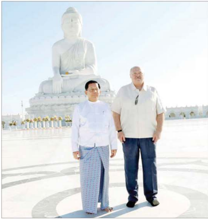
ဘယ်လာရုစ်သမ္မတနိုင်ငံသမ္မတ H.E.Mr.Aleksandr Lukashenko နှင့် ပြည်ထောင်စုသမ္မတမြန်မာ နိုင်ငံတော် ယာယီသမ္မတ နိုင်ငံတော်လုံခြုံရေးနှင့် အေးချမ်းသာယာရေးကော်မရှင်ဥက္ကဋ္ဌ ဗိုလ်ချုပ်မှူးကြီး မင်းအောင်လှိုင်တို့ မာရဝိဇယဗုဒ္ဓရုပ်ပွားတော်မြတ်ကြီး၏ အောင်မြင်နေရာတွင် မှတ်တမ်းတင်ဓာတ်ပုံရိုက် စဉ်။

အမှုဆောင်ချုပ် ဗိုလ်ချုပ်ကြီး ရဲဝင်းဦး၊ ပြည်ထောင်စုဝန်ကြီး များဖြစ်ကြသည့် ဦးမြထွန်းဦး၊ ဦးသန်းဆွေ၊ ဦးမောင်မောင်အုန်း၊ ဦးတင်ဦးလွင်၊ ဦးကိုကိုလွင်၊ ဦးမျိုးသန့်၊ နေပြည်တော်ကောင်စီ အဖွဲ့ဝင်၊ မာရဝိဇယဂေါပကအဖွဲ့ များနှင့် တာဝန်ရှိသူများက ကြိုဆို နှုတ်ဆက်ကြသည်။ ထို့နောက် ဘယ်လာရုစ်သမ္မတ နိုင်ငံ သမ္မတနှင့် ပြည်ထောင်စု သမ္မတမြန်မာနိုင်ငံတော် ယာယီ သမ္မတ နိုင်ငံတော်လုံခြုံရေးနှင့် အေးချမ်းသာယာရေးကော်မရှင် ဥက္ကဋ္ဌတို့သည် မာရဝိဇယဗုဒ္ဓရုပ်ပွား တော်မြတ်ကြီး၏အောင်မြင်နေရာ တွင် မှတ်တမ်းတင်ဓာတ်ပုံရိုက်ကြ ပြီး ဂန္ဓကုဋီတိုက်သို့ သွားရောက် ကြည့်ရှုလေ့လာကြရာ ဂန္ဓကုဋီ တိုက် အဆောင်အမှတ်(၂)တွင် ပြည်ထောင်စုသမ္မတ မြန်မာ နိုင်ငံတော် ယာယီသမ္မတ နိုင်ငံတော်လုံခြုံရေးနှင့် အေးချမ်း သာယာရေးကော်မရှင် ဥက္ကဋ္ဌက မာရဝိဇယဗုဒ္ဓရုပ်ပွားတော်မြတ် ကြီး တည်ထားကိုးကွယ်ခြင်း သမိုင်းမှတ်တမ်းနှင့် မာရဝိဇယ ဗုဒ္ဓဥယျာဉ်တော် တည်ဆောက် ရေး လုပ်ငန်းဆောင်ရွက်မှုသမိုင်း မှတ်တမ်းတို့ကို ရှင်းလင်း ပြောကြားသည်။ ယင်းနောက်ဘယ်လာရုစ်သမ္မတ နိုင်ငံသမ္မတနှင့် ပြည်ထောင်စု သမ္မတမြန်မာနိုင်ငံတော် ယာယီ