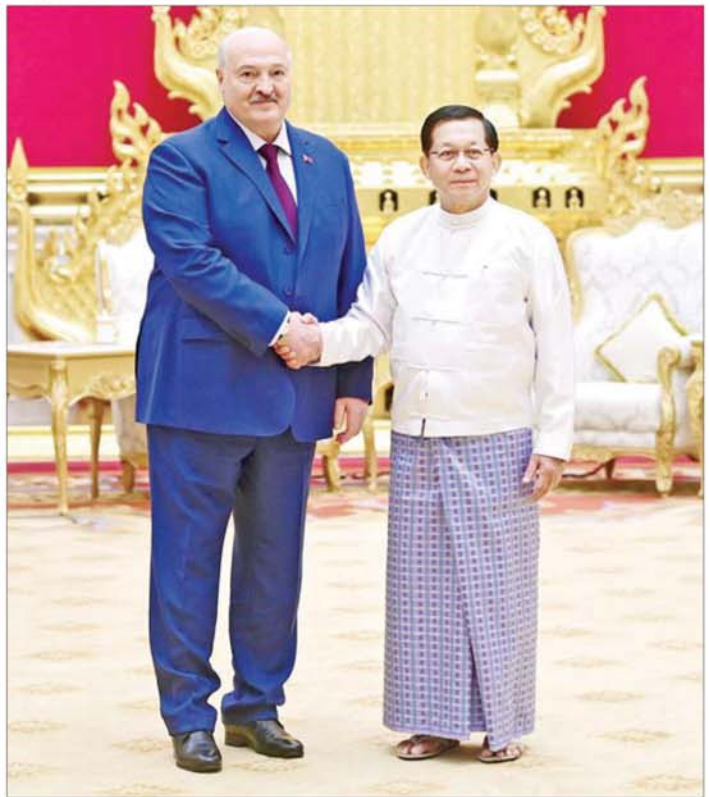
ပြည်ထောင်စုသမ္မတမြန်မာနိုင်ငံတော် ယာယီသမ္မတ နိုင်ငံတော်လုံခြုံရေးနှင့် အေးချမ်းသာယာရေးကော်မရှင်ဥက္ကဋ္ဌ ဗိုလ်ချုပ်မှူးကြီးမင်းအောင်လှိုင်နှင့် ဘယ်လာရုစ်သမ္မတနိုင်ငံသမ္မတ H.E. Mr. Aleksandr Lukashenko တို့ မှတ်တမ်းတင်စာတံပုံရိုက်စဉ်။

❖ စာမျက်နှာ ၈ မှ အွန်လိုင်းလောင်းကစားမှုပြုလုပ်သည့်နေရာများမှ ဖမ်းဆီးရမိသူ နိုင်ငံပေါင်း ၅၂ နိုင်ငံမှ ပြည်ပ နိုင်ငံသား ၇၀၀၀၀ နီးပါးခန့်ကို ထိန်းသိမ်း၍ မိခင်နိုင်ငံသို့ ပြန်ပို့လျက်ရှိမှု၊ ကျန်ရှိသည့် ပြည်ပ နိုင်ငံသား ၁၀၀၀ ခန့်ကိုလည်း ပြန်ပို့ရန် ဆောင်ရွက်လျက်ရှိမှု နှင့် အွန်လိုင်းလိမ်လည်လောင်းကစားမှုများ လုံးဝပြန်လည်အခြေမချနိုင်စေရေး၊ ဒုစရိုက်လုပ်ငန်းများ ထပ်မံမလုပ်ဆောင်နိုင်စေရေးအတွက် တရားမဝင်