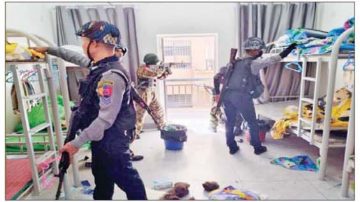
တရားမဝင် နိုင်ငံခြားသားများထားရှိသည့် လေးထပ်တိုက်အဆောက်အအုံကို ဝင်ရောက်ရှင်းလင်းနေစဉ်။

စာမျက်နှာ ၂၄ မှ ရှင်းလင်းခြင်း၊ အွန်လိုင်းလိမ်လည်လောင်းကစားမှု လုပ်ငန်းစဉ်များတွင် အသုံးပြုခဲ့သည့် သိမ်းဆည်းရမိပစ္စည်းများနှင့် တရားမဝင်အဆောက်အအုံများအား စနစ်တကျ ဖြိုဖျက်ဆီးခြင်းများ ဆက်လက် ဆောင်ရွက်လျက်ရှိသည်။ ထိုသို့ အွန်လိုင်းလိမ်လည်မှုများနှင့် အွန်လိုင်းလောင်းကစားမှုတိုက်ဖျက်ရေး လုပ်ငန်းများ ဆောင်ရွက်ရာတွင် မြဝတီ-ခွဲထော်သလေး(KK Park) နယ်မြေအတွင်းရှိ အွန်လိုင်းလိမ်လည်လောင်းကစားမှုများ ကျူးလွန်ရာတွင် အသုံးပြုခဲ့သည့် အဆောက်အအုံများကို အပိုင်းသုံးပိုင်းခွဲ၍ စနစ်တကျ ဖြိုဖျက်ဆီးခြင်းများ ဆောင်ရွက်လျက်ရှိရာ ယနေ့တွင် အပိုင်း(၃) နယ်မြေအတွင်းရှိ တရားမဝင် အဆောက်အအုံ ခုနစ်လုံးကို ထပ်မံဖြိုဖျက်ဆီးခဲ့သဖြင့် အပိုင်း(၃)နယ်မြေအတွင်းရှိ အဆောက်အအုံ ၄၂၅ လုံးအနက် ယနေ့အထိ ၁၁၅ လုံးဖြိုဖျက်ဆီးခဲ့ကြောင်းနှင့် KK Park နယ်မြေအတွင်းရှိ တရားမဝင် အဆောက်အအုံ ၅၃၅ လုံး အနက် ၂၆၃ လုံးကို ဖြိုဖျက်ဆီးပြီးဖြစ်ကြောင်း သိရသည်။ အလားတူ ရွှေကုက္ကိုလ်နယ်မြေအတွင်း၌လည်း ရှင်းလင်းဖော်ထုတ်မှုများကို နိုဝင်ဘာ ၁၈ ရက်မှ စတင်ဆောင်ရွက်ခဲ့ရာ ယနေ့တွင်လည်း ရွှေကုက္ကိုလ်နယ်မြေအတွင်းရှိ လူနေအဆောက်အအုံများ၊ ဂိုဒေါင်များ၊ ဈေးဆိုင်ခန်းများ၊ ဟိုတယ်များနှင့် ကော်ဖီများ