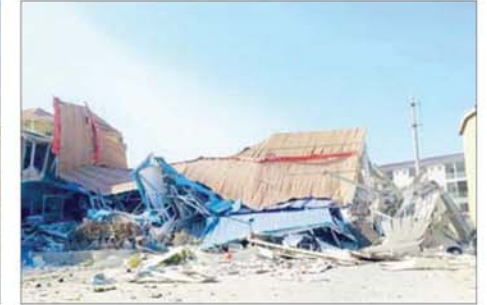
KK Park နယ်မြေအပိုင်း(၃) တွင် တရားမဝင်အဆောက်အအုံများလုပ်ထားသည့် လူနေအဆောက်အအုံသုံးထပ်တိုက်ကို မဖြိုဖျက်မီနှင့် ဖြိုဖျက်ပြီး တွေ့ရစဉ်။

ကျူးလွန်ရာတွင် အသုံးပြုသည့် ကွန်ပျူတာ အလုံး ၃၃၀၊ မိုဘိုင်းဖုန်း အလုံး ၂၈၈၇၀၊ star Link ဘုန်း ၁၀၂ လုံး၊ Router ၂၂ လုံးနှင့် လုပ်ငန်းသုံး ပစ္စည်းအများအပြားကို စစ်ဆေးတွေ့ရှိ ဖမ်းဆီးရမိခဲ့ပြီး သိမ်းဆည်းရမိ ပစ္စည်းများအား စနစ်တကျ ဖျက်ဆီးရှင်းလင်းခဲ့ကြောင်းနှင့် ဖော်ထုတ်ရှင်းလင်းခြင်းများကို ဆက်လက်ဆောင်ရွက်သွားမည်ဖြစ်ကြောင်း သိရသည်။ ထို့ပြင် အဆိုပါနယ်မြေများ၌ ဖော်ထုတ် ထိန်းသိမ်းနိုင်ခဲ့သည့်