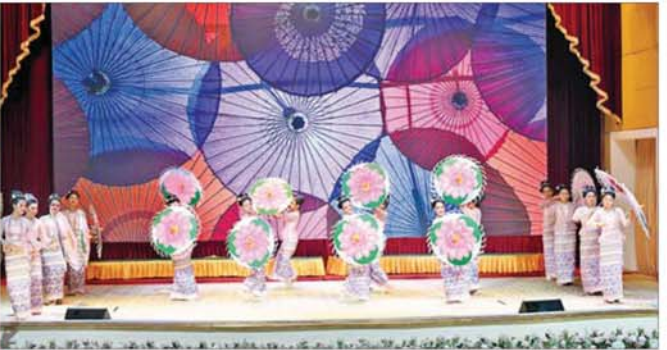
နိုင်ငံတော်ယာယီသမ္မတ နိုင်ငံတော်လုံခြုံရေးနှင့် အေးချမ်းသာယာရေးကော်မရှင်ဥက္ကဋ္ဌဗိုလ်ချုပ်မှူးကြီးမင်းအောင်လှိုင်နှင့် ဘယ်လာရစ်သမ္မတနိုင်ငံသမ္မတ H.E. Mr. Aleksandr Lukashenko ဦးဆောင်သည့် ကိုယ်စားလှယ်အဖွဲ့ဝင်များ ဂုဏ်ပြုဖျော်ဖြေမှုကို ကြည့်ရှုအားပေးကြစဉ်။