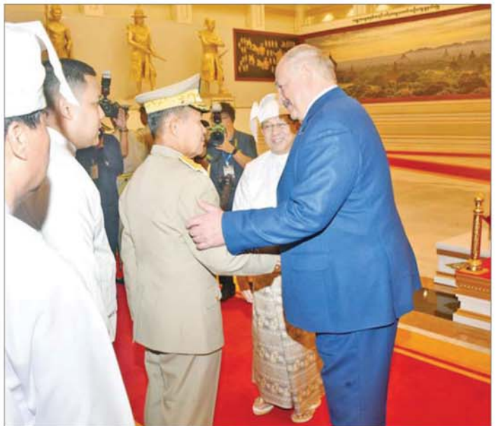
ပြည်ထောင်စုသမ္မတမြန်မာနိုင်ငံတော် ယာယီသမ္မတ နိုင်ငံတော်လုံခြုံရေးနှင့် အေးချမ်းသာယာရေးကော်မရှင်ဥက္ကဋ္ဌ ဗိုလ်ချုပ်မှူးကြီးမင်းအောင်လှိုင်က ဘယ်လာရစ်သမ္မတနိုင်ငံသမ္မတ H.E. Mr. Aleksandr Lukashenko အား ဂုဏ်ပြုကြိုဆိုပွဲသို့ တက်ရောက်လာကြသည့် အဖွဲ့ဝင်များနှင့် မိတ်ဆက်ပေးစဉ်။

လိုအပ်ချက်များကို ဆွေးနွေးဆောင်ရွက်နိုင်ခဲ့ပြီး ဖြစ်ကြောင်း၊ လက်ရှိအခြေအနေတွင် နှစ်နိုင်ငံ ပူးပေါင်းဆောင်ရွက်မှု မြှင့်တင်ရေး ဆိုင်ရာလမ်းပြမြေပြင် (၂၀၂၆-၂၀၂၈) ကိုလည်း ရေးဆွဲနိုင်ခဲ့ပြီး ဖြစ်၍ ဆက်လက်ဆောင်ရွက်သွားမည်ဖြစ်ပါကြောင်း၊ ဘယ်လာရစ်နိုင်ငံအနေဖြင့် မြန်မာနိုင်ငံအပေါ် နိုင်ငံတကာမျက်နှာစာများ၊ အဖွဲ့အစည်းများ အကြားတွင် အမြဲတမ်းထောက်ခံရပ်တည်ပေးသွားမည်ဖြစ်ပါကြောင်း၊ မြန်မာနိုင်ငံအနေဖြင့် ဘယ်လာရစ်နိုင်ငံနှင့် ပူးပေါင်းဆောင်ရွက်လိုသည့် ကိစ္စရပ်မှန်သမျှကို ကြိုဆိုလျက် ရှိပါကြောင်း ပြန်လည် ဆွေးနွေးပြောကြားသည်။ ဆက်လက်၍ နိုင်ငံတော် ယာယီသမ္မတ နိုင်ငံတော်လုံခြုံရေးနှင့် အေးချမ်းသာယာရေးကော်မရှင်ဥက္ကဋ္ဌနှင့် ဘယ်လာရစ်သမ္မတတို့သည် သမ္မတတို့သည် နှစ်နိုင်ငံအကြား စီးပွားရေးဆိုင်ရာ ပူးပေါင်း ဆောင်ရွက်မှုများနှင့် ရင်းနှီးမြှုပ်နှံမှုများကို ဆက်လက် တိုးမြှင့်ဆောင်ရွက်သွားနိုင်မည့် အခြေအနေများ၊ ပညာရေး၊ ကျန်းမာရေး၊ စက်မှု၊ စိုက်ပျိုးမွေးမြူရေးနှင့် စစ်ဘက် နည်းပညာဆိုင်ရာ စသည့် နယ်လယ်အသီးသီးတွင် ပူးပေါင်း ဆောင်ရွက်မှုများကို မြှင့်တင် ဆောင်ရွက်သွားမည့် အခြေအနေ