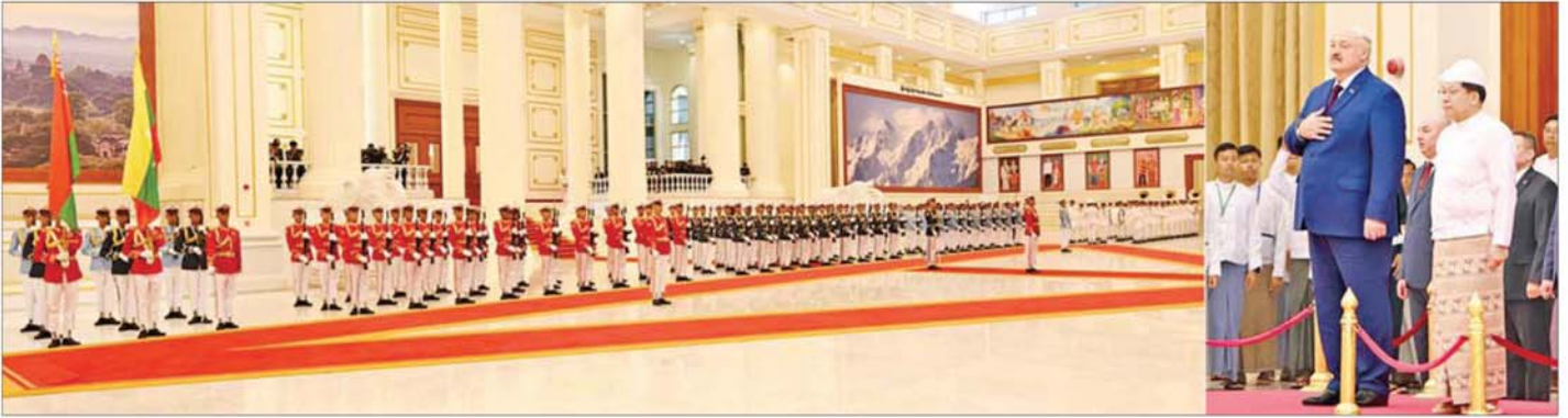
ပြည်ထောင်စုသမ္မတမြန်မာနိုင်ငံတော် ယာယီသမ္မတ နိုင်ငံတော်လုံခြုံရေးနှင့် အေးချမ်းသာယာရေးကော်မရှင်ဥက္ကဋ္ဌ ဗိုလ်ချုပ်မှူးကြီးမင်းအောင်လှိုင်နှင့် ဘယ်လာရုစ်သမ္မတနိုင်ငံသမ္မတ H.E. Mr. Aleksandr Lukashenko တို့ ဂုဏ်ပြုတပ်ဖွဲ့၏ အလေးပြုခြင်းကိုခံယူစဉ်။