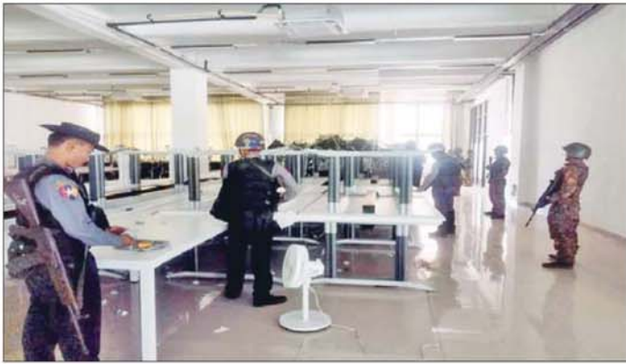
တရားမဝင် နိုင်ငံခြားသားများထားရှိသည့် ငါးထပ်တိုက်အဆောက်အအုံကို ဝင်ရောက်ရှင်းလင်းနေစဉ်။