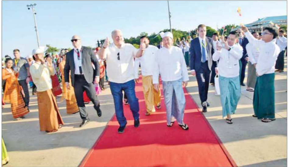
ဘယ်လာရုစ်သမ္မတနိုင်ငံသမ္မတ H.E. Mr. Aleksandr Lukashenko ဦးဆောင်သည့် အဆင့်မြင့်ကိုယ်စားလှယ်အဖွဲ့အား နိုင်ငံတော်လုံခြုံရေးနှင့် အေးချမ်းသာယာရေးကော်မရှင်အဖွဲ့ဝင် နိုင်ငံတော်ဝန်ကြီးချုပ် ဦးညိုစောနှင့် တာဝန်ရှိသူများက နေပြည်တော် တပ်မတော်လေဆိပ်၌ ပို့ဆောင်နှုတ်ဆက်ကြစဉ်။

နေပြည်တော် နိုဝင်ဘာ ၂၈ ပြည်ထောင်စုသမ္မတမြန်မာနိုင်ငံတော် ယာယီသမ္မတ နိုင်ငံတော်လုံခြုံရေးနှင့် အေးချမ်းသာယာရေးကော်မရှင်ဥက္ကဋ္ဌ ဗိုလ်ချုပ်မှူးကြီးမင်းအောင်လှိုင်၏ ဖိတ်ကြားချက်အရ မြန်မာနိုင်ငံသို့ တရားဝင်ချစ်ကြည်ရေးခရီးရောက်ရှိနေသော ဘယ်လာရုစ်သမ္မတနိုင်ငံ သမ္မတ H.E. Mr. Aleksandr Lukashenko ဦးဆောင်သည့် အဆင့်မြင့်ကိုယ်စားလှယ်အဖွဲ့သည် ယနေ့ညနေပိုင်းတွင် နေပြည်တော်တပ်မတော်လေဆိပ်မှ ဘယ်လာရုစ်သမ္မတနိုင်ငံသို့ ပြန်လည်ထွက်ခွာသည်။ ပို့ဆောင်နှုတ်ဆက် ဧည့်သည်တော် ဘယ်လာရုစ်သမ္မတနိုင်ငံသမ္မတ ဦးဆောင်သည့် အဆင့်မြင့်ကိုယ်စားလှယ်အဖွဲ့အား နိုင်ငံတော်လုံခြုံရေးနှင့် အေးချမ်းသာယာရေးကော်မရှင်အဖွဲ့ဝင် နိုင်ငံတော်ဝန်ကြီးချုပ် ဦးညိုစော၊ ပို့ဆောင်ရေးနှင့် ဆက်သွယ်ရေးဝန်ကြီးဌာန ပြည်ထောင်စုဝန်ကြီးဦးမြထွန်းဦး၊ နေပြည်တော်ကောင်စီဥက္ကဋ္ဌ၊ နိုင်ငံခြားရေးဝန်ကြီးဌာန ဒုတိယဝန်ကြီး၊ မြန်မာနိုင်ငံဆိုင်ရာ ဘယ်လာရုစ်သမ္မတနိုင်ငံ သံအမတ်ကြီး၊ ဘယ်လာရုစ်သမ္မတနိုင်ငံဆိုင်ရာ မြန်မာနိုင်ငံသံအမတ်ကြီးနှင့် တာဝန်ရှိသူများက လေဆိပ်၌ ပို့ဆောင်နှုတ်ဆက်ကြသည်။ ထိုသို့ပို့ဆောင်နှုတ်ဆက်ရာတွင် ဘယ်လာရုစ်သမ္မတနိုင်ငံ သမ္မတ ဦးဆောင်သည့် အဆင့်မြင့်ကိုယ်စားလှယ်အဖွဲ့အား နိုင်ငံတော်ဂုဏ်ပြုတပ်ဖွဲ့က ကော်စောနီလျှောက်လမ်းတစ်လျှောက် အလေးပြုကြပြီး တိုင်းရင်းသားယဉ်ကျေးမှုအဖွဲ့များနှင့် အကအဖွဲ့များက ရိုးရာယဉ်ကျေးမှုအကအလှတို့ဖြင့် ကပြဖျော်ဖြေခြင်းများနှင့်အတူ ကျောင်းသားကျောင်းသူများက နှစ်နိုင်ငံအလံများ ဝှေ့ယမ်း၍လည်းကောင်း၊ လမ်းဘေးဝဲ၊ ယာတစ်လျှောက် နှစ်နိုင်ငံအထိမ်းအမှတ်အလံများစိုက်ထူခြင်းတို့ဖြင့်လည်းကောင်း ပို့ဆောင်နှုတ်ဆက်ခဲ့ကြသည့်အပြင်