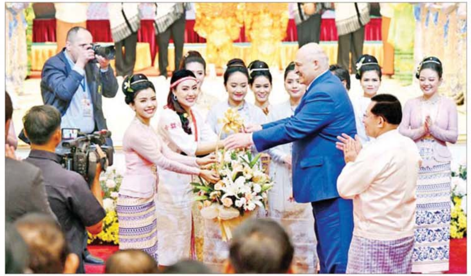
ဘယ်လာရစ်သမ္မတနိုင်ငံသမ္မတ H.E. Mr. Aleksandr Lukashenko နှင့် နိုင်ငံတော်ယာယီသမ္မတ နိုင်ငံတော်လုံခြုံရေးနှင့် အေးချမ်း သာယာရေးကော်မရှင်ဥက္ကဋ္ဌ ဗိုလ်ချုပ်မှူးကြီး မင်းအောင်လှိုင်တို့ ဖျော်ဖြေရေးအဖွဲ့ဝင်များအား ဂုဏ်ပြုပန်းခြင်းများ ပေးအပ်ချီးမြှင့်စဉ်။

အားကစား၊ ပညာရေး၊ သိပ္ပံနှင့် နည်းပညာကျန်းမာရေး၊ ယဉ်ကျေး မှု၊ စွမ်းအင်၊ စက်မှု၊ ခရီးသွား လုပ်ငန်း၊ သယ်စာတင်သင်္ဘော ပတ်ဝန်းကျင် ထိန်းသိမ်းရေး စသည့် ကဏ္ဍပေါင်းစုံတို့တွင် ပူးပေါင်းဆောင်ရွက်သွားနိုင်မည့် အခြေအနေများ၊ ဒေသတွင်းနှင့် နိုင်ငံတကာ မျက်နှာစာတွင် ပူးပေါင်း ဆောင်ရွက်သွားမည့် အခြေအနေများ၊ မြန်မာနိုင်ငံတွင် မကြာမီကာလအတွင်း လွတ်လပ် ၍ ပွင့်လင်းမြင်သာသည့် ပါတီစုံ ဒီမိုကရေစီ အထွေထွေရွေးကောက် ပွဲတစ်ရပ်ကို ကျင်းပပြုလုပ်သွား မည်ဖြစ်သည့် အခြေအနေများနှင့် အိမ်နီးချင်းနိုင်ငံများ၊ အာဆီယံ နိုင်ငံများနှင့် မိတ်ဆွေနိုင်ငံများ အပါအဝင် ပြည်တွင်း၊ ပြည်ပ စောင့်ကြည့် လေ့လာသူများကို မိတ်ဆက်ထားရှိပြီးဖြစ်သည့် အခြေ အနေများနှင့် ဘယ်လာရစ်သမ္မတ နိုင်ငံအနေဖြင့် ရွေးကောက်ပွဲ စောင့်ကြည့်လေ့လာရေးအဖွဲ့များ စေလွှတ်ပေးသွားမည့်အခြေအနေ များ၊ မြန်မာနိုင်ငံအစိုးရအနေဖြင့် ပြည်တွင်း တည်ငြိမ်အေးချမ်းမှု ရရှိရေးအတွက် ကြိုးပမ်းဆောင် ရွက်လျက်ရှိသကဲ့သို့ အွန်လိုင်း လိမ်လည် လောင်းကစားမှုများ ကိုလည်း အမျိုးသားရေး တာဝန် တစ်ရပ်အဖြစ်ခံယူကာ အင်တိုက် အားတိုက် တိုက်ဖျက်ဆောင်ရွက်