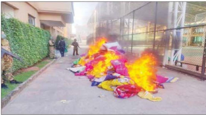
တရားမဝင် လောင်းကစားပစ္စည်းများကို မီးရှို့ဖျက်ဆီးစဉ်။