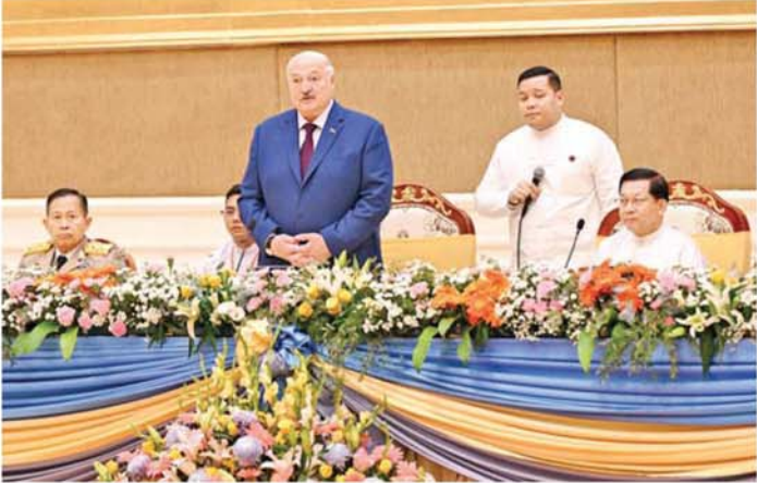
ဘယ်လာရုစ်သမ္မတနိုင်ငံ သမ္မတ H.E. Mr. Aleksandr Lukashenko ဂုဏ်ပြုနေ့လယ်စာစားပွဲတွင် အမှတ်တရစကားပြောကြားစဉ်။

ချိန်တွင် အပြန်အလှန်ကူညီရေးဆိုင်ရာများကို ဆွေးနွေးနိုင်ခဲ့ကြောင်း၊ မိမိတို့ နိုင်ငံအနေဖြင့် မြန်မာနိုင်ငံနှင့်ပတ်သက်ပြီး အမြတ်ခံယူထားပါကြောင်း၊ မြန်မာနိုင်ငံနှင့် ပူးပေါင်းဆောင်ရွက်မှုများ ဆောင်ရွက်ချိန်တွင် မည်သည့် ပြင်ပနှောင့်ယှက် စွက်ဖက်မှုများ ရှိနေပါစေ တစ်စုံတစ်ရာမရှိဘဲ ဆက်လက်ပူးပေါင်းဆောင်ရွက်သွားမည်ကို ပြောကြားလိုပါကြောင်း၊ မိမိတို့နိုင်ငံမှ တာဝန်ရှိသည့် ဝန်ကြီးများ ပူးပေါင်း၍ စီးပွားရေးဖိုရမ်များ ကျင်းပခဲ့ပြီး တွေ့ဆုံဆွေးနွေးမှုများ ပြုလုပ်ခဲ့ပါကြောင်း၊ ထိုမှတစ်ဆင့် နှစ်နိုင်ငံပူးပေါင်းဆောင်ရွက်မှုများ အောင်မြင်စေရေးနှင့် ရလဒ်ကောင်းများ ရရှိစေရေးဆွေးနွေးဆောင်ရွက်နိုင်ခဲ့ပါကြောင်း၊ မိမိတို့အနေဖြင့် ယနေ့တွင် နှစ်နိုင်ငံပူးပေါင်းဆောင်ရွက်မှု မြှင့်တင်ရေးဆိုင်ရာ လမ်းပြမြေပုံ(၂၀၂၆-၂၀၂၈) ကို လက်မှတ်ရေးထိုးသွားမည်ဖြစ်ပါကြောင်း၊ အဆိုပါ လမ်းပြမြေပုံ၌ နှစ်နိုင်ငံပူးပေါင်းဆောင်ရွက်ရေးနှင့် ပတ်သက်သည့်အချက်