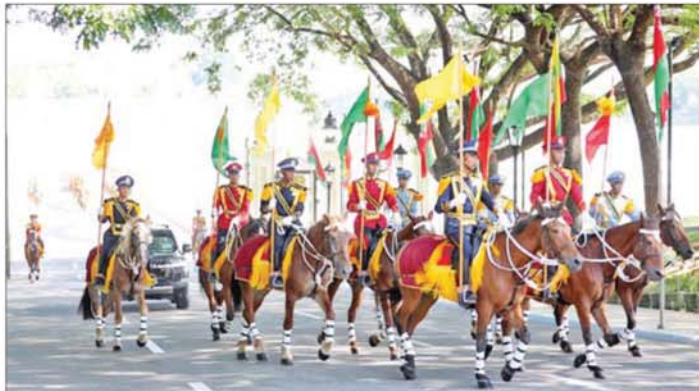
ဘယ်လာရစ်သမ္မတနိုင်ငံသမ္မတ H.E. Mr. Aleksandr Lukashenko လိုက်ပါလာသည့် အထူးယာဉ်တန်းအား နိုင်ငံတော်သမ္မတအိမ်တော်သို့ ဂုဏ်ပြုမြင်းစီးတပ်ဖွဲ့က ဦးဆောင်ကြိုဆိုလာစဉ်။

နိုင်ငံရေးမတည်ငြိမ်မှုဖြစ်လာချိန်၌ နယ်စပ်ဒေသများတွင် တည်ငြိမ်မှုနှင့် တရားဥပဒေစိုးမိုးမှု လျော့နည်းလာသည်ကို အခွင့်ကောင်းယူပြီး တရားမဝင်လက်နက်ကိုင် အဖွဲ့များနှင့် ပူးပေါင်း၍ အွန်လိုင်းလောင်းကစားမှုကို အခြေချခဲ့မှု၊ စာမျက်နှာ ၉ သို့ ❖