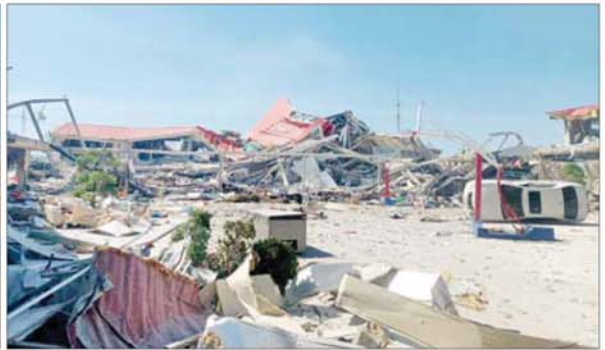
KK Park နယ်မြေ အပိုင်း(၃) တွင် တရားမဝင်ဆောက်လုပ်ထားသည့် လူနေအဆောက်အအုံလေးထပ်တိုက်ကို မဖြိုဖျက်မီနှင့် ဖြိုဖျက်ပြီး တွေ့ရစဉ်။