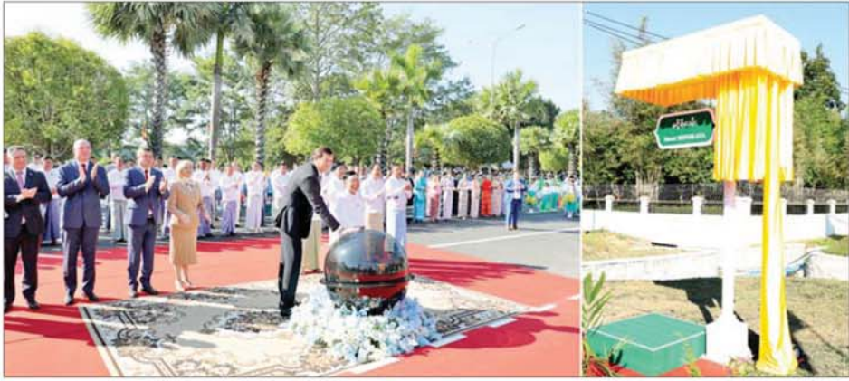
ဘယ်လာရစ်သမ္မတနိုင်ငံ နိုင်ငံခြားရေးဝန်ကြီး H.E.Mr. Maxim RYZHENKOV နှင့် နေပြည်တော်ကောင်စီဥက္ကဋ္ဌ ဦးသန်းထွန်းဦးတို့ လမ်းအမည်ဆိုင်ခွင့်အတွက် စက်ခလုတ်နှိပ်ဖွင့်လှစ်ပေးစဉ်။

နေပြည်တော် နိုဝင်ဘာ ၂၈ ပြည်ထောင်စုသမ္မတ မြန်မာနိုင်ငံနှင့် ဘယ်လာရစ်သမ္မတနိုင်ငံတို့အကြား နှစ်နိုင်ငံသံတမန်ချစ်ကြည်ရင်းနှီးမှု အခွန်ရှည်တည်တံ့စေရန် ရည်ရွယ်ပြီး ဘယ်လာရစ်သမ္မတ နိုင်ငံ၏ မြို့တော် Minsk မြို့၏အမည်အား ရာဇသင်္ဂဟလမ်းမကြီးနှင့် ဓမ္မကျက်သရေ လမ်းမကြီးကို ဆက်သွယ်ထားသော လမ်း၏ အမည်အဖြစ် ဂုဏ်ပြုပေးအပ်ပွဲ အခမ်းအနားကို ယနေ့နံနက်ပိုင်းတွင် ပြည်ထောင်စုနယ်မြေ နေပြည်တော်ရှိ ရာဇသင်္ဂဟလမ်းနှင့် သီရိကျော်စွာလမ်းထောင့် (အဆင့်မြင့်ဈေးအနီး)၌ ကျင်းပသည်။