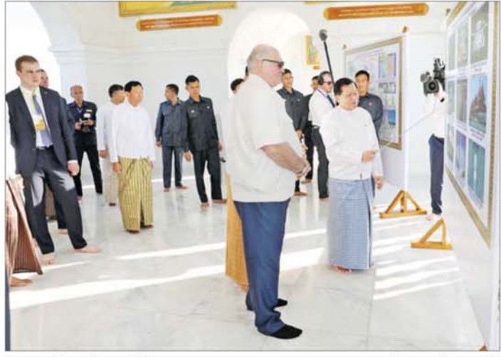
ဘယ်လာရုစ်သမ္မတနိုင်ငံသမ္မတ H.E.Mr.Aleksandr Lukashenko အား မာရဝိဇယဗုဒ္ဓရုပ်ပွားတော် မြတ်ကြီး တည်ထားကိုးကွယ်ခြင်းသမိုင်းမှတ်တမ်းနှင့် မာရဝိဇယဗုဒ္ဓဥယျာဉ်တော် တည်ဆောက်ရေးလုပ်ငန်း ဆောင်ရွက်မှုသမိုင်းမှတ်တမ်းတို့ကို ပြည်ထောင်စုသမ္မတမြန်မာနိုင်ငံတော် ယာယီသမ္မတ နိုင်ငံတော် လုံခြုံရေးနှင့် အေးချမ်းသာယာရေးကော်မရှင်ဥက္ကဋ္ဌ ဗိုလ်ချုပ်မှူးကြီးမင်းအောင်လှိုင်က ရှင်းလင်းပြောကြား စဉ်။

ကြပြီး အာရုံခံတန်ဆောင်း မှန်ဆောင်း၍ ဘယ်လာရုစ်သမ္မတ နိုင်ငံသမ္မတက စည်ညည်တော် မှတ်တမ်းတွင် လက်မှတ်ရေးထိုး