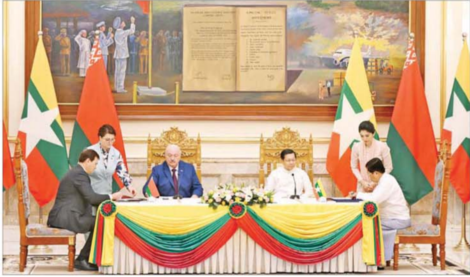
ပြည်ထောင်စုသမ္မတမြန်မာနိုင်ငံတော်နှင့် ဘယ်လာရုစ်သမ္မတနိုင်ငံတို့အကြား နားလည်မှုစာချွန်လွှာလက်မှတ်ရေးထိုးပွဲ ကျင်းပစဉ်။

နားလည်မှုစာချွန်လွှာများ လက်မှတ်ရေးထိုးသွားမည်ဆိုသည့် တွေ့ဆုံဆွေးနွေးစဉ် နိုင်ငံတော်ယာယီသမ္မတ နိုင်ငံတော် လုံခြုံရေးနှင့် အေးချမ်းသာယာရေးတော်မရင်ဥက္ကဋ္ဌက ကြိုဆိုနှုတ်ခွန်းဆက်စကားပြောကြားရာတွင် အဆွေတော်နှင့် ကိုယ်စားလှယ် အဖွဲ့များအား မြန်မာနိုင်ငံမှ လွှဲကပ်လွှာဖြင့် ကြိုဆိုပါကြောင်း၊ မိမိတို့နှစ်နိုင်ငံ၏ သံတမန်ဆက်ဆံရေးမှာ ၂၆ နှစ်တာကာလသို့ ရောက်ရှိခဲ့ပြီဖြစ်ပြီး အဆွေတော်၏ ချစ်ကြည်ရေးခရီးစဉ်သည် ဘယ်လာရုစ်သမ္မတနိုင်ငံမှ နိုင်ငံတော်အကြီးအကဲလာရောက်သည့် ပထမဆုံး သမိုင်းဝင် ခရီးစဉ်ဖြစ်သည့်အတွက် ဂုဏ်ယူဝမ်းမြောက်မိပါကြောင်း၊ မိမိအနေဖြင့် ယခုနှစ် မတ်လအတွင်း ဘယ်လာရုစ်နိုင်ငံသို့ နိုင်ငံအတော်အဆင့် တရားဝင် ချစ်ကြည်ရေးခရီးစဉ်နှင့် စွန့်လွှတ်အတွင်း စတုတ္ထအကြိမ် ဥရောပ-အာရှ စီးပွားရေးဖိုရမ်သို့ တက်ရောက်ရန် လာရောက်သည့် ခရီးစဉ်များအတွင်း အဆွေတော်နှင့် ဘယ်လာရုစ်နိုင်ငံက နွေးထွေးလွှဲကပ်လွှာကြိုဆိုခဲ့သည့် စဉ်ပတ်ကျေပျော်မှုများကိုလည်း ပြန်လည်အမှတ်ရမိပါကြောင်းနှင့် အထူးပင် ကျေးဇူးတင်ရှိပါကြောင်း၊ မတ်လ