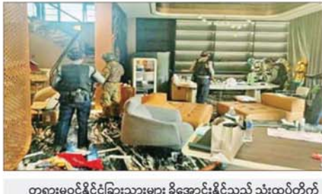
တရားမဝင်နိုင်ငံခြားသားများ ခိုအောင်းနိုင်သည့် သုံးထပ်တိုက် လူနေအဆောက်အအုံများအား ဝင်ရောက်ရှင်းလင်းနေမှုကို တွေ့ရစဉ်။