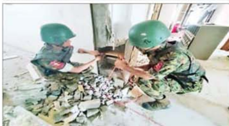
KK Park နယ်မြေအတွင်းရှိ လူနေအဆောက်အအုံ ငါးထပ်တိုက်အား ဖောက်ခွဲရန် ပြင်ဆင်နေမှုကို တွေ့ရစဉ်။