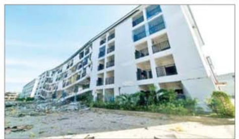
KK Park နယ်မြေအတွင်းရှိ ငါးထပ်တိုက်အား မဖြိုဖျက်မီနှင့် ဖြိုဖျက်ပြီး တွေ့ရစဉ်။