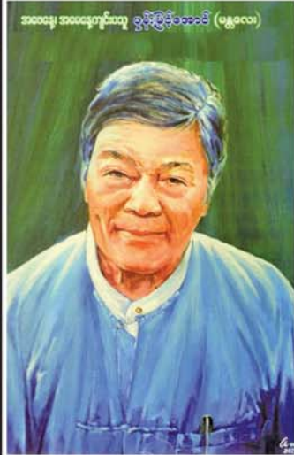
အမေနေ အခမ်းအနားကြည့် ခွင့်ပြုခံရအောင် (မန္တလေး)