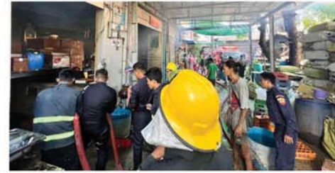
(အောက်ပုံ) (ဝ၄၅)

မီးသတ်တပ်ဖွဲ့ဝင်များ ထွက်ခွာ ငြိမ်းသတ်ခဲ့ရာ ည ၈ နာရီ ၄၅ မိနစ်တွင် မီးငြိမ်းသွားခဲ့ကြောင်း သိရသည်။