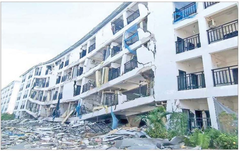
KK Park နယ်မြေအတွင်း လူနေအဆောက်အအုံ (၅)ထပ်တိုက်အား ဖြိုချပျက်ဆီးပြီး တွေ့ရစဉ်။

နေပြည်တော် နိုဝင်ဘာ ၂၅ မြန်မာနိုင်ငံအစိုးရအနေဖြင့် မြဝတီမြို့နယ်ရှိ ရွှေကုက္ကိုလ် နယ်မြေနှင့် KK Park နယ်မြေများ၌ ကမ္ဘာတစ်ဝန်းလုံးမှ ကန့်ကွက် ရွတ်ချလျက်ရှိသော အွန်လိုင်းလိမ်လည်မှုများနှင့် အွန်လိုင်း လောင်းကစားမှုများ ကျူးလွန်လုပ်ဆောင်ခဲ့ကြသည့် နေရာများတွင် လုံခြုံရေးတပ်ဖွဲ့ဝင်များ၊ အုပ်ချုပ်ရေးအဖွဲ့အစည်းများနှင့် ဒေသတွင်း တာဝန်ရှိသူများပါဝင်သည့် ပူးပေါင်းစစ်ဆင်ရေးအဖွဲ့များဖြင့် ဝင်ရောက်ရှင်းလင်းခြင်း၊ တရားမဝင် အဆောက်အအုံများနှင့် အွန်လိုင်းလိမ်လည်မှုများတွင် အသုံးပြုခဲ့သည့် အသုံးအဆောင်ပစ္စည်း များကို စနစ်တကျဖြိုချပျက်ဆီးခြင်း၊ တရားမဝင် ပြည်ပနိုင်ငံသား များအား ဖော်ထုတ်ဖမ်းဆီးအရေးယူဆောင်ရွက်ခြင်း၊ သက်ဆိုင်ရာ နိုင်ငံများသို့ ပြည်နှင်လွှဲပြောင်းပေးခြင်းများ ဆက်လက်ဆောင်ရွက် လျက်ရှိပါသည်။