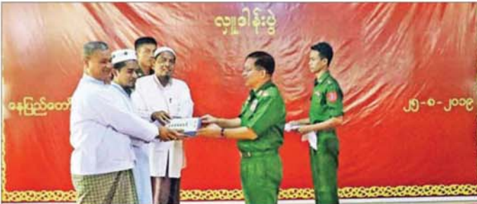
ပျဉ်းမနားမြို့နယ်ရှိ ဦးကျေး ဂျာမေမလီတွင် အစ္စလာမ်ဘာသာဝင်များအား အလှူငွေများ ပေးအပ် လှူဒါန်းနေမှု။