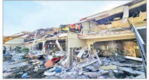
KK Park နယ်မြေအတွင်းရှိ နှစ်ထပ်လူနေအဆောက်အအုံများ မဖြိုဖျက်မီနှင့် ဖြိုဖျက်ပြီး တွေ့ရစဉ်။