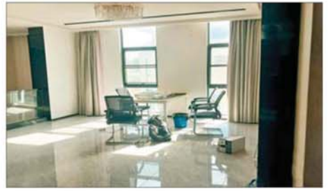
တရားမဝင်နိုင်ငံခြားသားများ ခိုအောင်းနိုင်သည့် တစ်ထပ် ဧည့်တွေဆောင်အား ဝင်ရောက်ရှင်းလင်းနေမှုကို တွေ့ရစဉ်။