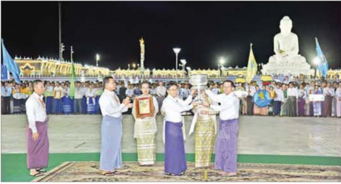
နေပြည်တော် မာရဝိဇယဘုရားကြီး တန်ဆောင်တိုင်ပွဲတော်သို့ တက်ရောက်အားပေး ချီးမြှင့်နေမှု။

နိုင်ငံတော်ယာယီသမ္မတ၊ နိုင်ငံတော်လုံခြုံရေးနှင့် အေးချမ်းသာယာရေး ကော်မရှင်ဥက္ကဋ္ဌ တပ်မတော်ကာကွယ်ရေးဦးစီးချုပ် ဗိုလ်ချုပ်မှူးကြီး မင်းအောင်လှိုင် ဘာသာပေါင်းစုံ ဘာသာရေးပွဲတော်များသို့ တက်ရောက်အားပေးသည့်မှတ်တမ်း