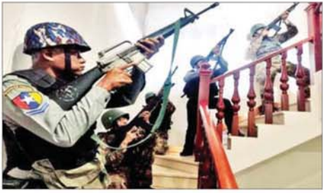
တရားမဝင်နိုင်ငံခြားသားများထားရှိသည့် နှစ်ထပ်တိုက် တန်းလျားများအား ဝင်ရောက်ရှင်းလင်းနေမှုကို တွေ့ရစဉ်။