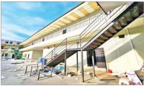
KK Park နယ်မြေအတွင်းရှိ နှစ်ထပ်လူနေအဆောက်အအုံများ မဖြိုဖျက်မီနှင့် ဖြိုဖျက်ပြီး တွေ့ရစဉ်။