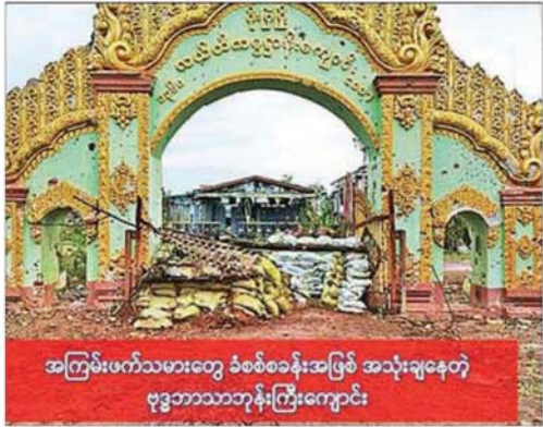
အကြမ်းဖက်သမားတွေ ခံစစ်ခန်းအဖြစ် အသုံးပြုနေတဲ့ ဗုဒ္ဓဘာသာဘုန်းကြီးကျောင်း

ပထမဆုံးအနေနဲ့ ခင်ဗျားနားလည်ထားရ မှာက မြန်မာနိုင်ငံမှာဖြစ်ပေါ်နေတဲ့ ပဋိပက္ခတွေ၊ ပျက်စီးဆုံးရှုံးမှုတွေဟာ ခင်ဗျားစွပ်စွဲသလို တပ်မတော်က အရပ်သားတွေကို ပစ်မှတ်ထား တိုက်ခိုက်နေလို့ ဖြစ်နေတာမဟုတ်ပါဘူး။ တကယ် အဖြစ်မှန်က NLD ပါတီရဲ့ အစွန်းရောက်အုပ်စုတွေ ကနေ မွေးဖွားလာတဲ့ NUG၊ CRPH၊ PDF လို အမည်ခံထားတဲ့ အကြမ်းဖက်အဖွဲ့တွေရဲ့ 'အလုံးစုံ