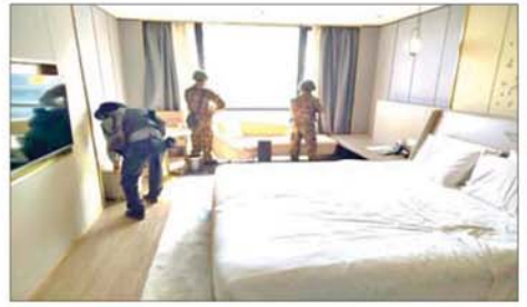
တရားမဝင်နိုင်ငံခြားသားများ ထားရှိနိုင်သည့် ၁၂ ထပ်တိုက် အဆောက်အအုံအား ဝင်ရောက်ရှင်းလင်းနေမှုကို တွေ့ရစဉ်။