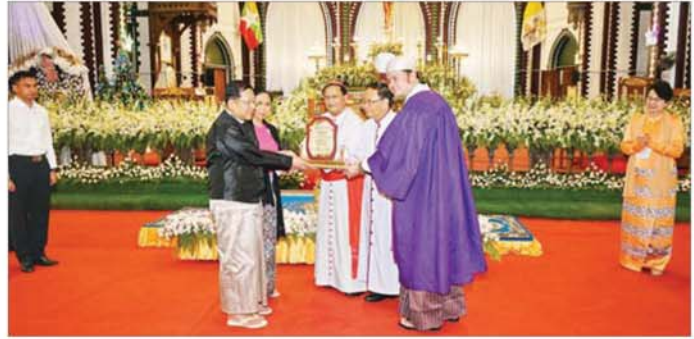
St. Mary's Cathedral Church တွင် ခရစ်တော်မွေးနေ့ (ခရစ္စမတ်) အခမ်းအနားသို့ တက်ရောက် ချီးမြှင့်နေမှု။