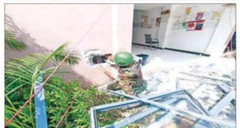
KK Park နယ်မြေအတွင်းရှိ လူနေအဆောက်အအုံ ငါးထပ်တိုက်အား ဖောက်ခွဲရန် ပြင်ဆင်နေမှုကို တွေ့ရစဉ်။