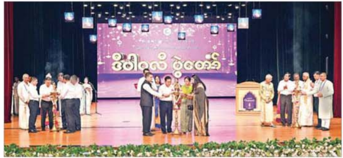
ဟိန္ဒူဘာသာဝင်များ၏ ဒီပါဝလီပွဲတော်အား တက်ရောက်ချီးမြှင့်နေမှု။