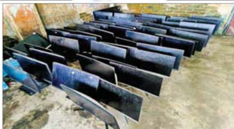
KK Park နယ်မြေအတွင်းရှိ အပိုင်း(၃) အဆောက်အအုံအတွင်းမှ ကွန်ပျူတာ အလုံး ၁၀၀ သိမ်းဆည်းရမိမှုကို တွေ့ရစဉ်။

နိုင်ငံတော်အစိုးရအနေဖြင့် အွန်လိုင်းလိမ်လည် လောင်းကစားမှု ကျူးလွန်မှုများကို အမျိုးသားရေးတာဝန်တစ်ရပ်အဖြစ် ခံယူကာ မြန်မာနိုင်ငံအတွင်း လုံးဝအခြေမပြုနိုင်ရေး ပြည်တွင်းအင်အားစုများ အပြင် အိမ်နီးချင်းနိုင်ငံအစိုးရများနှင့်လည်း ပေါင်းစပ်ညှိနှိုင်း၍ ဆက်လက်ဆောင်ရွက်သွားမည်ဖြစ်ကြောင်း သိရသည်။ သတင်းစဉ်