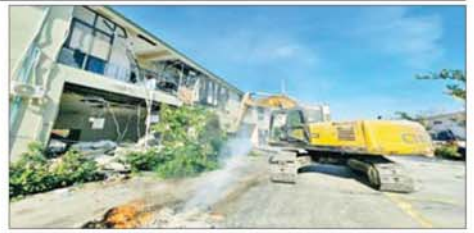
KK Park နယ်မြေအတွင်းရှိ ယန္တရားဖြင့် ဖြိုဖျက်မည့် နှစ်ထပ် လူနေအဆောက်အအုံများမှ အိမ်ရာသုံးပစ္စည်းများ စုပုံမီးရှို့ ဖျက်ဆီး နေမှုကို တွေ့ရစဉ်။