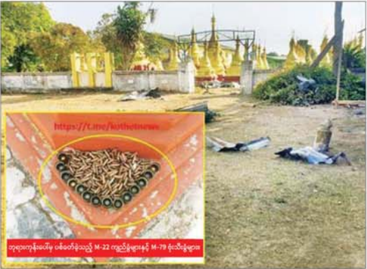
ဗုဒ္ဓဘာသာဘုန်းကြီးကျောင်းကို နှစ် ၂၀၂၅ ခုနှစ် ဇူလိုင်လ ၂၅ ရက်နေ့မှာ ဖျက်ဆီးခံရခဲ့တာ

အကြမ်းဖက်သမားများက မိုးမြေဖြူနယ်ရှိ ဗုဒ္ဓဘာသာဘုန်းကြီးကျောင်းနှင့် ကသာမြို့နယ် မိုးတားလေးရွာရှိ ဘုရားကုန်းအား အကာအကွယ်ယူ အသုံးပြု တိုက်ခိုက်ခဲ့သည့် အထောက်အထားများ။