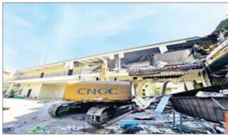
KK Park နယ်မြေအတွင်းရှိ နှစ်ထပ်လူနေအဆောက်အအုံများ မဖြိုဖျက်မီနှင့် ဖြိုဖျက်ပြီး တွေ့ရစဉ်။