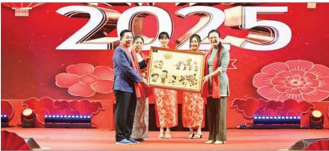
တရုတ်နှစ်သစ်ကူးအခမ်းအနားသို့ တက်ရောက်ချီးမြှင့်နေမှု။