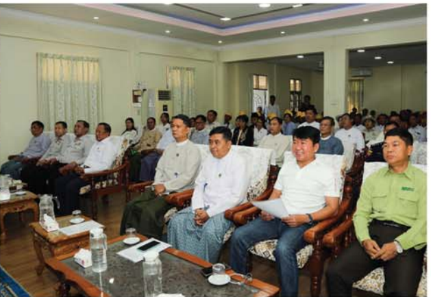
ဆောက်လုပ်ရေးလုပ်ငန်းဆိုင်ရာ လုပ်သားများ ကျွမ်းကျင်မှုဖွံ့ဖြိုးတိုးတက်ပြီး ပိုမိုအေးကင်းလုံခြုံသောအဆောက်အအုံများ ဆောက်လုပ်နိုင်စေရန်နှင့် သဘာဝဘေးအန္တရာယ်ဖြစ်နိုင်ခြေလျော့ချနိုင်သည့်အဆောက်အအုံများဆောက်လုပ်တတ်စေရန် ရည်ရွယ်ချက်များ အကောင်အထည်ဖော်ဆောင်ရွက်နိုင်ရန်အတွက် ဆောက်လုပ်ရေးဝန်ကြီးဌာန၊ ဗဟိုသင်တန်းကျောင်းမှ နည်းပြ ဆရာ၊ ဆရာမများက ကျောင်း၏ သင်ရိုးညွှန်းတမ်းများနှင့်အညီ လေ့ကျင့်ပေးသွားမည် ဖြစ်ရာ သင်တန်းသား၊ သင်