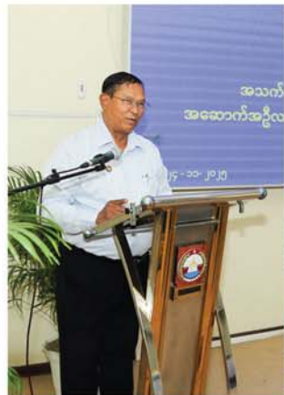
ယာရေးဝန်ကြီးက သင်တန်းအဖွင့် အမှာစကားပြောကြားရာတွင်

အခမ်းအနားသို့ မန္တလေးတိုင်းဒေသကြီးအစိုးရအဖွဲ့ဝင် ဝန်ကြီးများဖြစ်သည့် စည်ပင်သာယာရေးဝန်ကြီး မြို့တော်ဝန်ကြီး ဦးကျော်ဆန်း၊ လမ်းပန်း ဆက်သွယ်ရေးဝန်ကြီး ဦးအောင်စောဦး၊ ဆောက်လုပ်ရေးဝန်ကြီးဌာန ဗဟိုသင်တန်းကျောင်းမှ ကျောင်းအုပ်ကြီး ဦးဝင်းမင်းထွဋ်နှင့် တာဝန်ရှိသူများ၊ နည်းပြ ဆရာ၊ ဆရာမများ၊ ဆောက်လုပ်ရေးကုမ္ပဏီများမှတာဝန်ရှိသူများ၊ တည်ဆောက်ရေးလုပ်ငန်းနယ်ပယ်မှ ဆောက်လုပ်ရေးလုပ်သားများ တက်ရောက်ကြသည်။ အခမ်းအနား၌ စည်ပင်သာ