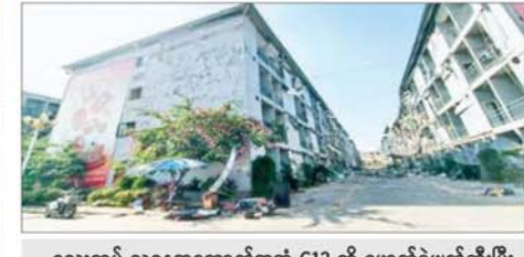
ယန္တရားဖြင့်ဖြိုဖျက်မည့် သုံးထပ်လူနေအဆောက်အအုံများအား မဖြိုချမီနှင့် ဖြိုချဖျက်ဆီးနေမှုကို တွေ့ရစဉ်။