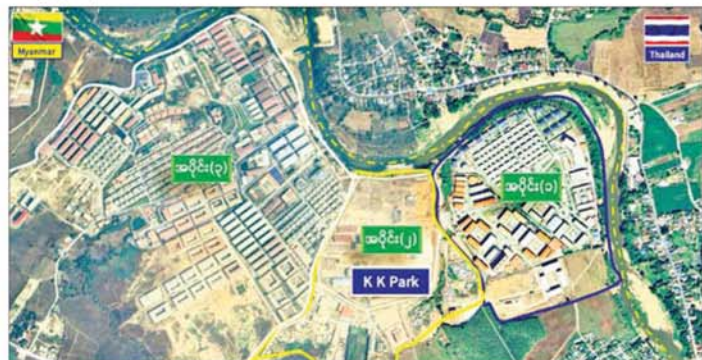
ကရင်ပြည်နယ် မြဝတီမြို့နယ် K K Park အတွင်း အဆောက်အအုံများ ဆောက်လုပ်ထားရှိမှု။

နိုင်ငံသားနှစ်ဦး၊ အိန္ဒိယနိုင်ငံသား နှစ်ဦး၊ ပါကစ္စတန်နိုင်ငံသား တစ်ဦးနှင့် တရုတ်(တိုင်ပေ)မှ နှစ်ဦး စုစုပေါင်း ၁၀၀ ဦးတို့ကို ယနေ့တွင် ထပ်မံစစ်ဆေးဖော်ထုတ်ဖမ်းဆီး ထိန်းသိမ်းနိုင်ခဲ့သည်။ ထို့ကြောင့် ရွှေကုက္ကိုလ် နယ်မြေအတွင်း စုစုပေါင်း ဖော်ထုတ်ရှင်းလင်းမှု များအရ ယနေ့အထိ မြန်မာနိုင်ငံ အတွင်းသို့ တရားမဝင် ဝင်ရောက် နေထိုင်သည့် ပြည်ပနိုင်ငံသား စုစုပေါင်း ၁၈၄၇ ဦးနှင့် အွန်လိုင်း လိမ်လည် လောင်းကစားမှု ကျူးလွန်ရာတွင် အသုံးပြုသည့် ကွန်ပျူတာ ၃၀၉၈ လုံး၊ မိုတိုင်းဖုန်း ၂၁၇၅၀ Star Link ဘန်း ၁၀၂ လုံး၊ Router ၂၂ လုံးနှင့် လုပ်ငန်း သုံး ပစ္စည်းအများအပြားကို စစ်ဆေး တွေ့ရှိဖမ်းဆီးရမိခဲ့ပြီး သိမ်းဆည်း ရမိပစ္စည်းများကို စနစ်တကျ ဖျက်ဆီး ရှင်းလင်းခဲ့ကြောင်းနှင့် ဖော်ထုတ် ရှင်းလင်းခြင်းများ ဆက်လက် ဆောင်ရွက်သွား မည်ဖြစ်ကြောင်း သိရသည်။ ထိုသို့ ဖော်ထုတ်ထိန်းသိမ်းနိုင် ခဲ့သည့် ပြည်ပနိုင်ငံသားများကို မြဝတီမြို့နယ် ပုလဲပူကျေးရွာ အုပ်စု ရွှေကုက္ကိုလ်မြိုင်ကျေးရွာ