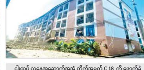
KK Park အတွင်း ယန္တရားဖြင့်ဖြိုဖျက်မည့် သုံးထပ်/နှစ်ထပ်လူနေအဆောက်အအုံများကို ဖြိုချဖျက်ဆီးပြီး တွေ့ရစဉ်။