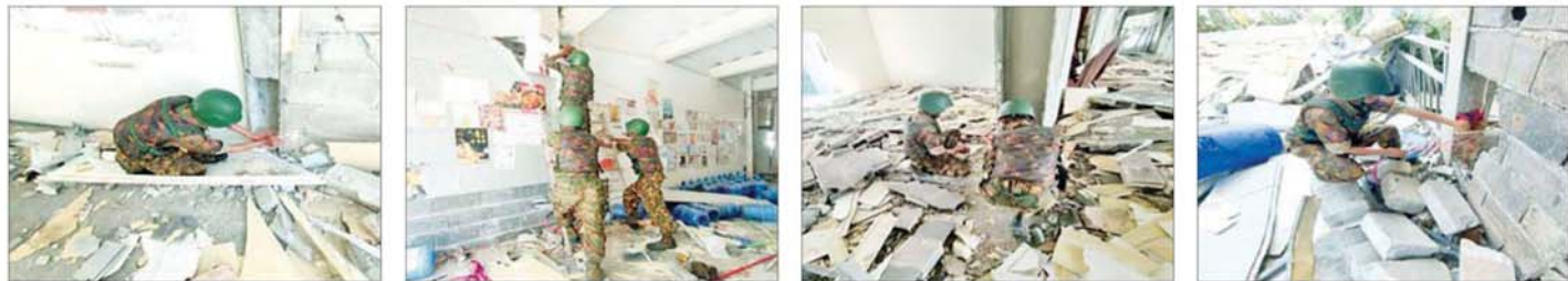
လေးထပ်နှင့်ငါးထပ် လူနေအဆောက်အအုံများအား ဖောက်ခွဲဖျက်ဆီးရန် ယမ်းများတပ်ဆင်နေသည်ကို တွေ့ရစဉ်။

စွာ ထိန်းသိမ်းစောင့်ရှောက်ထား ရှိကြောင်း သိရသည်။ နိုင်ငံတော် အစိုးရအနေ ဖြင့် အွန်လိုင်းလိမ်လည် လောင်းကစားမှု ကျူးလွန်မှုများ ကို အမျိုးသားရေးတာဝန်တစ်ရပ် အဖြစ်ခံယူကာ မြန်မာနိုင်ငံ အတွင်း လုံးဝအခြေမပြုနိုင်ရေး ပြည်တွင်း အင်အားစုများအပြင် အိမ်နီးချင်းနိုင်ငံ အစိုးရများနှင့် လည်း ပေါင်းစပ်ညှိနှိုင်း၍ ဆက်လက် ဆောင်ရွက်သွားမည် ဖြစ်ကြောင်း သိရသည်။ သတင်းစဉ်