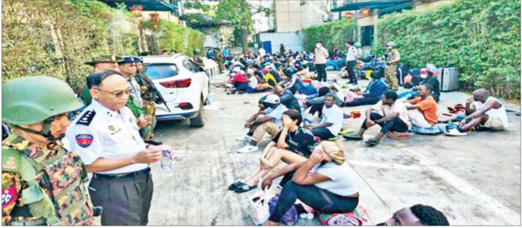
ရွှေကုက္ကိုလ်နယ်မြေအတွင်း တရားမဝင် ဝင်ရောက်လာသည့် နိုင်ငံခြားသားများအား ဖမ်းဆီးရမိမှုကို တွေ့ရစဉ်။

နေပြည်တော် နိုဝင်ဘာ ၂၄ မြန်မာနိုင်ငံအစိုးရအနေဖြင့် အွန်လိုင်းလိမ်လည်မှုများနှင့် အွန်လိုင်းလောင်းကစားမှုများ အများဆုံး အခြေချလုပ်ကိုင်လျက်ရှိကြသည့် ရွှေကုက္ကိုလ်နယ်မြေနှင့် KK Park နယ်မြေများ၌ လုံခြုံရေးတပ်ဖွဲ့များအား အုပ်ချုပ်ရေးအဖွဲ့အစည်းများအပါအဝင် အဖွဲ့စုံပါဝင်သည့် ပူးပေါင်းစစ်ဆေးရေးအဖွဲ့များဖြင့် ဝင်ရောက်ရှင်းလင်းခြင်း၊ တရားမဝင်အဆောက်အအုံ လောင်းကစားမှုများအား ဖြိုချရန်ဆုံးဖြတ်ခြင်းများ ဆက်လက် ဆောင်ရွက်လျက်ရှိပါသည်။ ထိုသို့ အွန်လိုင်းလိမ်လည်မှုများနှင့် အွန်လိုင်းလောင်းကစားမှု စာမျက်နှာ ၁၀ သို့