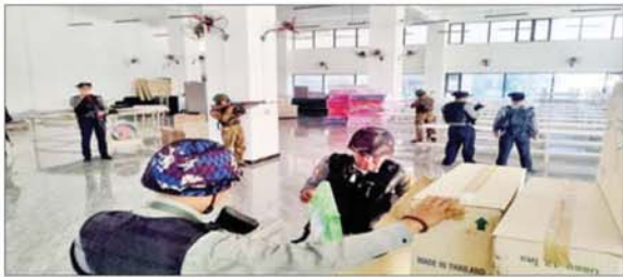
ရွှေကုက္ကိုလ်နယ်မြေအတွင်းရှိ တရားမဝင် ဝင်ရောက်နေထိုင်သူများ၏ အဆောက်အအုံများအား ဝင်ရောက်ရှင်းလင်းနေမှုကို တွေ့ရစဉ်။

ထို့ပြင် ထိုင်းနိုင်ငံအပါအဝင် အိမ်နီးချင်းနိုင်ငံအချို့ကို တစ်ဆင့် ခံမြတ်သန်း၍ ရွှေကုက္ကိုလ်နယ်မြေ အတွင်း၌ အွန်လိုင်းလိမ်လည်မှု နှင့် လောင်းကစားမှုများ ကျူးလွန် ခဲ့ပြီး ထွက်ပြေးတိမ်းရှောင်