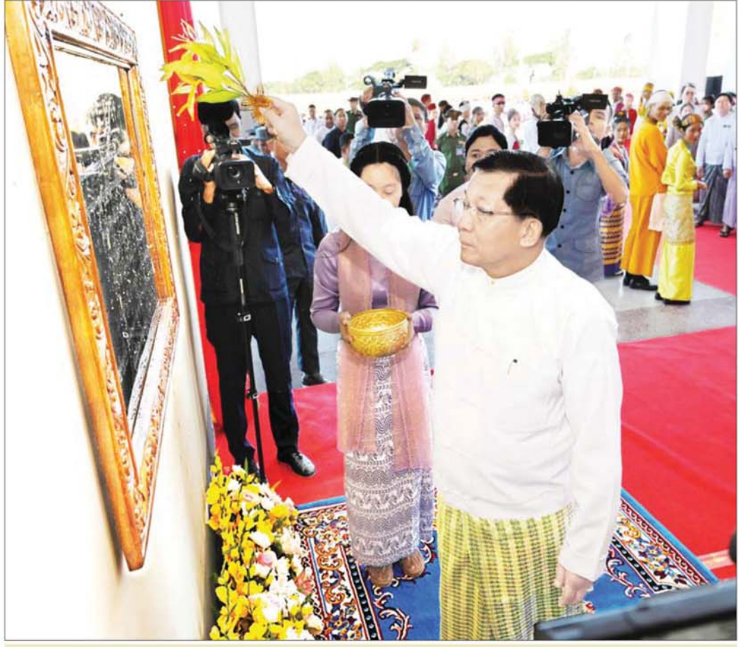
ပြည်ထောင်စုသမ္မတမြန်မာနိုင်ငံတော် ယာယီသမ္မတ နိုင်ငံတော်လုံခြုံရေးနှင့် အေးချမ်းသာယာရေးကော်မရှင်ဥက္ကဋ္ဌ ဗိုလ်ချုပ်မှူးကြီးမင်းအောင်လှိုင် စိုက်ပျိုးရေးနှင့်မွေးမြူရေးတက္ကသိုလ် (မအူပင်) ပင်မအဆောက်အအုံ ကမ္ဘည်းမော်ကွန်းအား အမွှေးနှံ့သာရည်များ ပက်ဖျန်းပေးစဉ်။