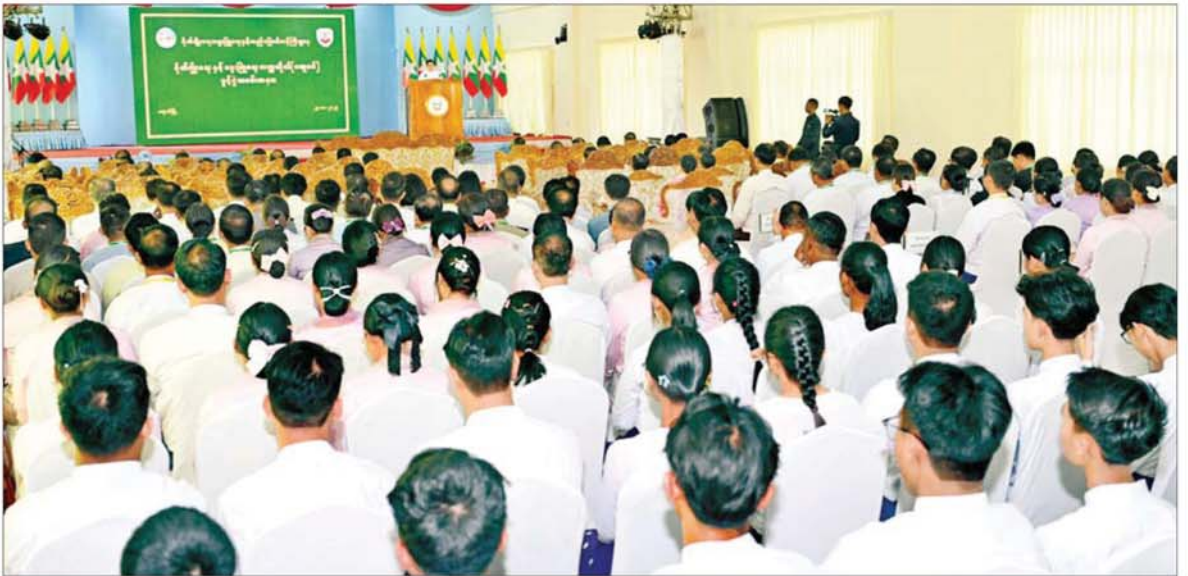
ပြည်ထောင်စုသမ္မတမြန်မာနိုင်ငံတော် ယာယီသမ္မတ နိုင်ငံတော်လုံခြုံရေးနှင့် အေးချမ်းသာယာရေးကော်မရှင်ဥက္ကဋ္ဌ ဗိုလ်ချုပ်မှူးကြီး မင်းအောင်လှိုင် စိုက်ပျိုးရေးနှင့် မွေးမြူရေးတက္ကသိုလ်(မအူပင်) ဖွင့်ပွဲအခမ်းအနားတွင် အမှာစကားပြောကြားစဉ်။

ထို့ကြောင့် မိမိတို့အစိုးရ တာဝန်ယူခဲ့သည့် ၂၀၂၁ ခုနှစ်မှစပြီး နိုင်ငံတော်အတွက် အဆင့်မြင့် စိုက်ပျိုးရေး၊ မွေးမြူရေးဘွဲ့ရ ပညာရှင်များ၊ အလယ်အလတ်အဆင့် စိုက်ပျိုးရေး၊ မွေးမြူရေး ဒီပလိုမာလက်မှတ်ရ ပညာရှင်များ၊ စိုက်ပျိုးရေး၊ မွေးမြူရေး ဘာသာရပ်ဆိုင်ရာ ကျွမ်းကျင်အဆင့်ရှိ အသိအမှတ်ပြု လက်မှတ်ရပညာရှင်များ ပိုမိုမွေးထုတ်ပေးနိုင်ရန် ကြိုးပမ်းဆောင်ရွက်ခဲ့ကြောင်း ထိုသို့ ဆောင်ရွက်ရာတွင် အခြေခံပညာနှင့် စက်မှု၊ စိုက်ပျိုး