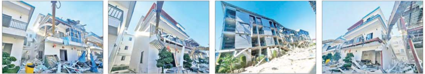
KK Park နယ်မြေအတွင်း အွန်လိုင်းလိမ်လည်လောင်းကစားမှုများကျူးလွန်ရာတွင် အသုံးပြုခဲ့သော အဆောက်အအုံများအား ယာဉ်ယန္တရားများအသုံးပြု၍ ဖြိုချဖျက်ဆီးနေမှုကို တွေ့ရစဉ်။

နိုင်ငံသား ၂၆၀၈ ဦးကို သက်ဆိုင်ရာ နိုင်ငံများသို့ လွှဲပြောင်းပေးရန် အသင့်ဖြစ်နေပြီဖြစ်ကြောင်းနှင့် ၎င်းတို့ကို ကောင်းမွန်စွာ ထိန်းသိမ်း စောင့်ရှောက်ထားရှိကြောင်း သိ ရသည်။ နိုင်ငံတော် အစိုးရအနေဖြင့် အွန်လိုင်းလိမ်လည် လောင်းကစား မှုကျူးလွန်မှုများကို အမျိုးသားရေး တာဝန်တစ်ရပ်အဖြစ် ခံယူကာ မြန်မာနိုင်ငံအတွင်း လုံးဝအခြေ မပြုနိုင်ရေး ပြည်တွင်းအင်အားစု များအပြင် အိမ်နီးချင်းနိုင်ငံအစိုးရ များနှင့်လည်း ပေါင်းစပ်ညှိနှိုင်း၍ ဆက်လက်ဆောင်ရွက်သွားမည် ဖြစ်ကြောင်း သိရသည်။ သတင်းစဉ်