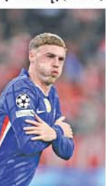
(အောက်ပုံ)(NGB)

ကြီးမားသည့် ထိုးနှက်ချက်တစ်ရပ်ဖြစ်လာခဲ့သည်။ အသက်(၂၃)နှစ်အရွယ်ရှိ ကွင်းလယ်တိုက်စစ်ကစားသမား ကိုလံဘီယာသည် ချီလီအသင်းအတွက် ၂၀၂၃-၂၀၂၄ မှ ၂၀၂၅-၂၀၂၆ ဘောလုံးရာသီအထိ ပြိုင်ပွဲစုံ ၁၀၀၀ ကစားပြီး ၄၅ဂိုးအထိ သွင်းယူကာ ခြေစွမ်းပြထားသည်။