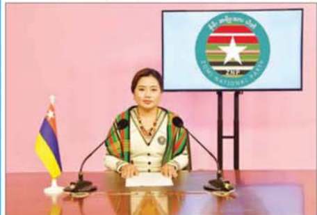
မင်္ဂလာပါရှင်

အဆိုပါ ဟောပြောတင်ပြချက်အပြည့်အစုံမှာ အောက်ပါအတိုင်းဖြစ်ပါသည်-