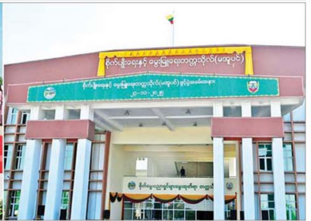
ပြည်ထောင်စုသမ္မတမြန်မာနိုင်ငံတော် ယာယီသမ္မတ နိုင်ငံတော်လုံခြုံရေးနှင့် အေးချမ်းသာယာရေးကော်မရှင်ဥက္ကဋ္ဌ ဗိုလ်ချုပ်မှူးကြီးမင်းအောင်လှိုင် စိုက်ပျိုးရေးနှင့် မွေးမြူရေးတက္ကသိုလ်(မအူပင်) ပင်မဆောင်ဆိုင်ခန်းအား စက်ခလုတ်နှိပ်ဖွင့်လှစ်ပေးစဉ်။