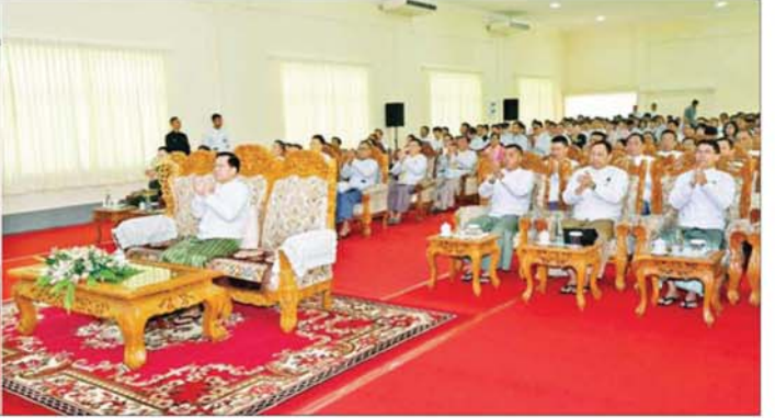
ပြည်ထောင်စုသမ္မတမြန်မာနိုင်ငံတော် ယာယီသမ္မတ နိုင်ငံတော်လုံခြုံရေးနှင့် အေးချမ်းသာယာရေးကော်မရှင်ဥက္ကဋ္ဌ ဗိုလ်ချုပ်မှူးကြီး မင်းအောင်လှိုင်နှင့် အဖွဲ့ဝင်များအား ကျောင်းသား ကျောင်းသူများက စိုက်ပျိုးရေးတက္ကသိုလ်(မအူပင်) ဖွင့်ပွဲအခမ်းအမှတ်သီချင်းဖြင့် ကပြဖျော်ဖြေစဉ်။