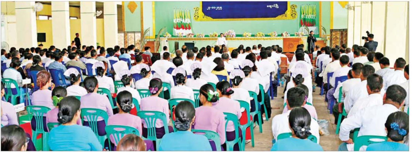
ပြည်ထောင်စုသမ္မတမြန်မာနိုင်ငံတော် ယာယီသမ္မတ နိုင်ငံတော်လုံခြုံရေးနှင့် အေးချမ်းသာယာရေးကော်မရှင်ဥက္ကဋ္ဌ ဗိုလ်ချုပ်မှူးကြီး မင်းအောင်လှိုင် မအူပင်မြို့ရှိ ခရိုင်၊ မြို့နယ်အဆင့်ဌာနဆိုင်ရာ တာဝန်ရှိသူများ၊ မြို့မိ မြို့ဖများနှင့် တွေ့ဆုံအမှာစကားပြောကြားစဉ်။