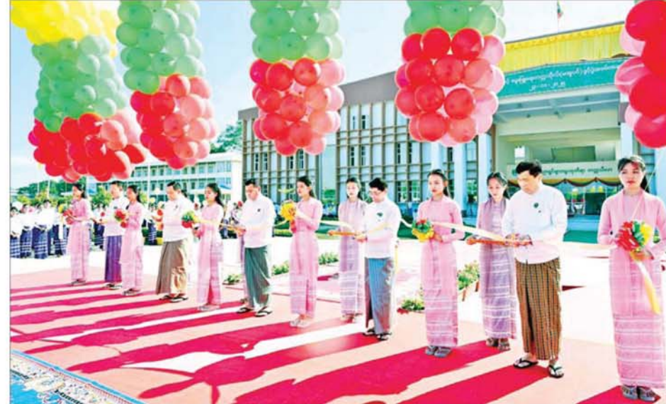
နိုင်ငံတော်လုံခြုံရေးနှင့် အေးချမ်းသာယာရေးကော်မရှင်အတွင်းရေးမှူး တွဲဖက်အမှုဆောင်ချုပ် ဗိုလ်ချုပ်ကြီး ရဲဝင်းဦး၊ ပြည်ထောင်စုဝန်ကြီး များနှင့် ဧရာဝတီတိုင်းဒေသကြီးဝန်ကြီးချုပ်တို့က စိုက်ပျိုးရေးနှင့် မွေးမြူရေးတက္ကသိုလ်(မအူပင်) ဖွင့်ပွဲအခမ်းအနားကို ဖဲကြိုးဖြတ်ဖွင့်လှစ်ပေးစဉ်။

အတွက် အဓိကမောင်းနှင်အား တစ်ခုဖြစ်ကြောင်း၊ နိုင်ငံတကာကို ကြည့်ပါကလည်း ဖွံ့ဖြိုးပြီး နိုင်ငံ များသည် စိုက်ပျိုးရေးနှင့်မွေးမြူ ရေးကိုအခြေခံပြီး စီးပွားရေး တိုးတက်အောင် စွမ်းဆောင်ရုံရာမှ စက်မှုနိုင်ငံအထိ တည်ထောင်နိုင် ကြခြင်းဖြစ်ကြောင်း၊ အလားတူ ဖွံ့ဖြိုးဆဲ နိုင်ငံများသည်လည်း စိုက်ပျိုးမွေးမြူရေးလုပ်ငန်းများ ကို အခြေခံပြီး စားရေးကုန်ဖူလုံ အောင်ပိုလှအောင်လုပ်ဆောင်နိုင် ရန်နှင့် ကုန်ထုတ်လုပ်ငန်းများကို တိုးမြှင့်ပြီး MSME လုပ်ငန်းများမှ တစ်ဆင့် နိုင်ငံတော်ကို ပြောင်းလဲ တိုးတက်အောင် လုပ်ဆောင်နေ ကြကြောင်း၊ မိမိတို့နိုင်ငံတွင်လည်း ကြွယ်ဝသည့် ရေမြေသာသာ အရင်းအမြစ်များနှင့် ရာသီဥတု ကောင်းမွန်မှုကို အရင်းပြုပြီး စိုက်ပျိုးမွေးမြူရေး လုပ်ငန်းများ ကို တိုးတက်စေရန်နှင့် အနာဂတ် စီးပွားရေး ဖွံ့ဖြိုးတိုးတက်အောင် ကြိုးပမ်း ဆောင်ရွက်နေခြင်းပင် ဖြစ်ကြောင်း။